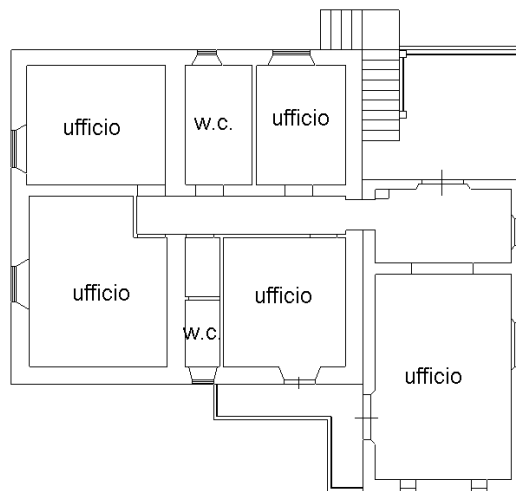
PIANTA PIANO PRIMO H 2.70 ml