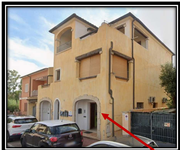
Prospetto su Via Basilicata

L'accesso al bene, ubicato nel Centro di Olbia, precisamente percorrendo la centralissima via Vittorio Veneto, per poi immettersi nella via Basilicata al n° 52/a, avviene dalla porta finestra posizionata sotto il piccolo portico, lato destro del fabbricato, piano terra.