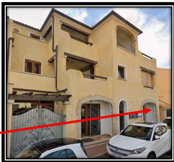
Prospetto su Via Basilicata