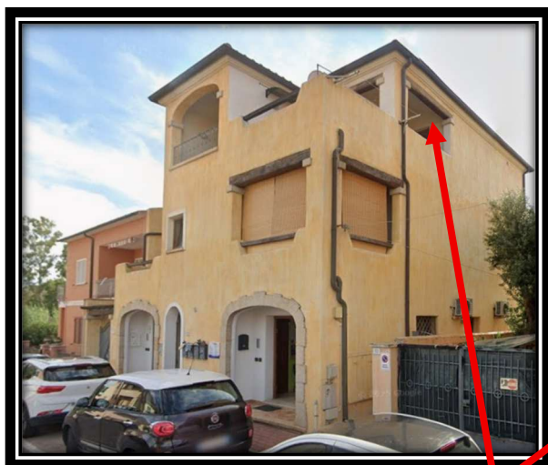
Prospetto su Via Basilicata

L'impianto elettrico è di tipo sotto traccia, e allo stato attuale non è possibile determinare se è ha norma in quanto, durante l'accesso agli atti richiesto al Comune di Olbia, non è stata prodotta, (perché probabilmente non presente), la dichiarazione di Agibilità dell'immobile. Per avere la certezza che l'impianto elettrico sia a norma, occorre la verifica da parte di tecnico abilitato con rilascio della prevista certificazione.