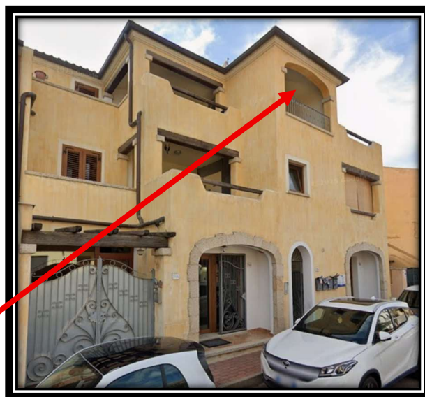
Appartamento sub 8

La superficie calpestabile (utile), è pari a 37,23 mq circa di abitazione, veranda principale di 9,60 mq/utigli circa, terrazzo 7,70 mq/utigli circa e veranda posteriore di 5,83 mq/utigli circa, mentre la superficie lorda dell'appartamento è di 55,38.