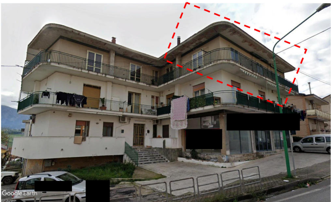
Fabbricato in cui insistono gli immobili oggetto di procedura