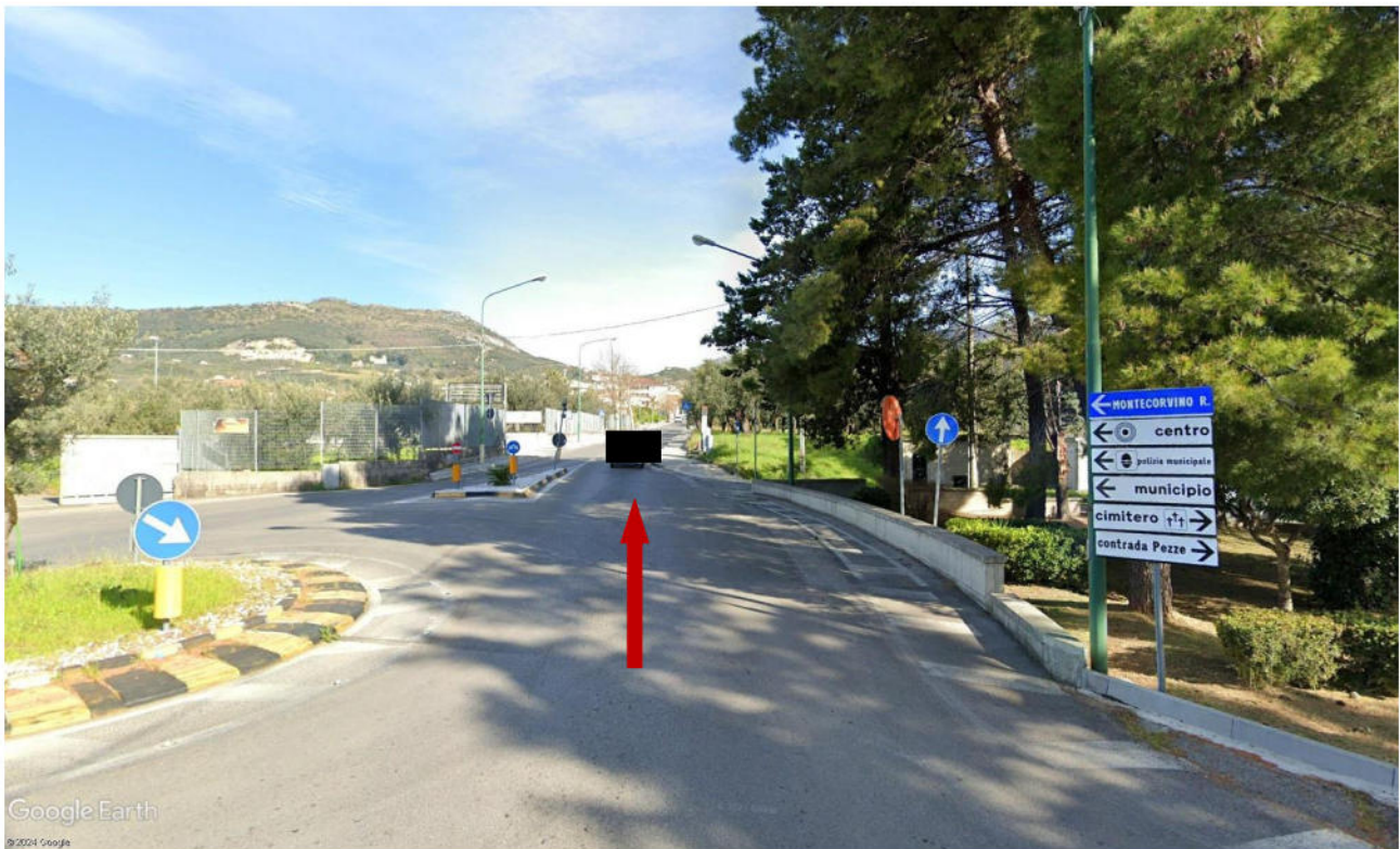
FOTO 12 – Percorso virtuale direzione Montecorvino Rovella – SP 164