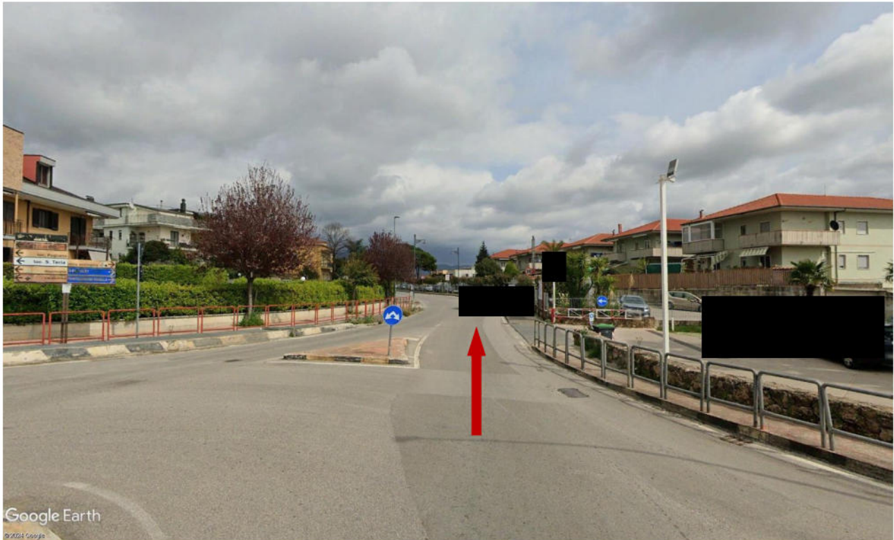
FOTO 08 – Percorso virtuale direzione Montecorvino Rovella – Incrocio tra SP 313 e SP 164