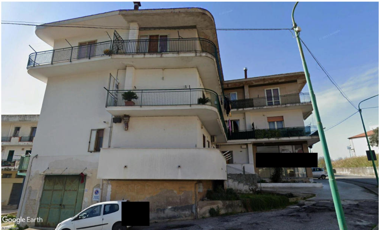
Fabbricato in cui insistono gli immobili oggetto di procedura