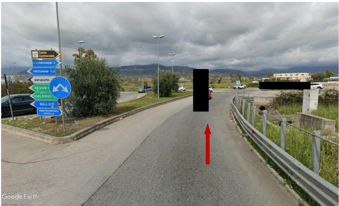
Foto 6 – Percorso virtuale direzione Montecorvino Rovella – SP 313