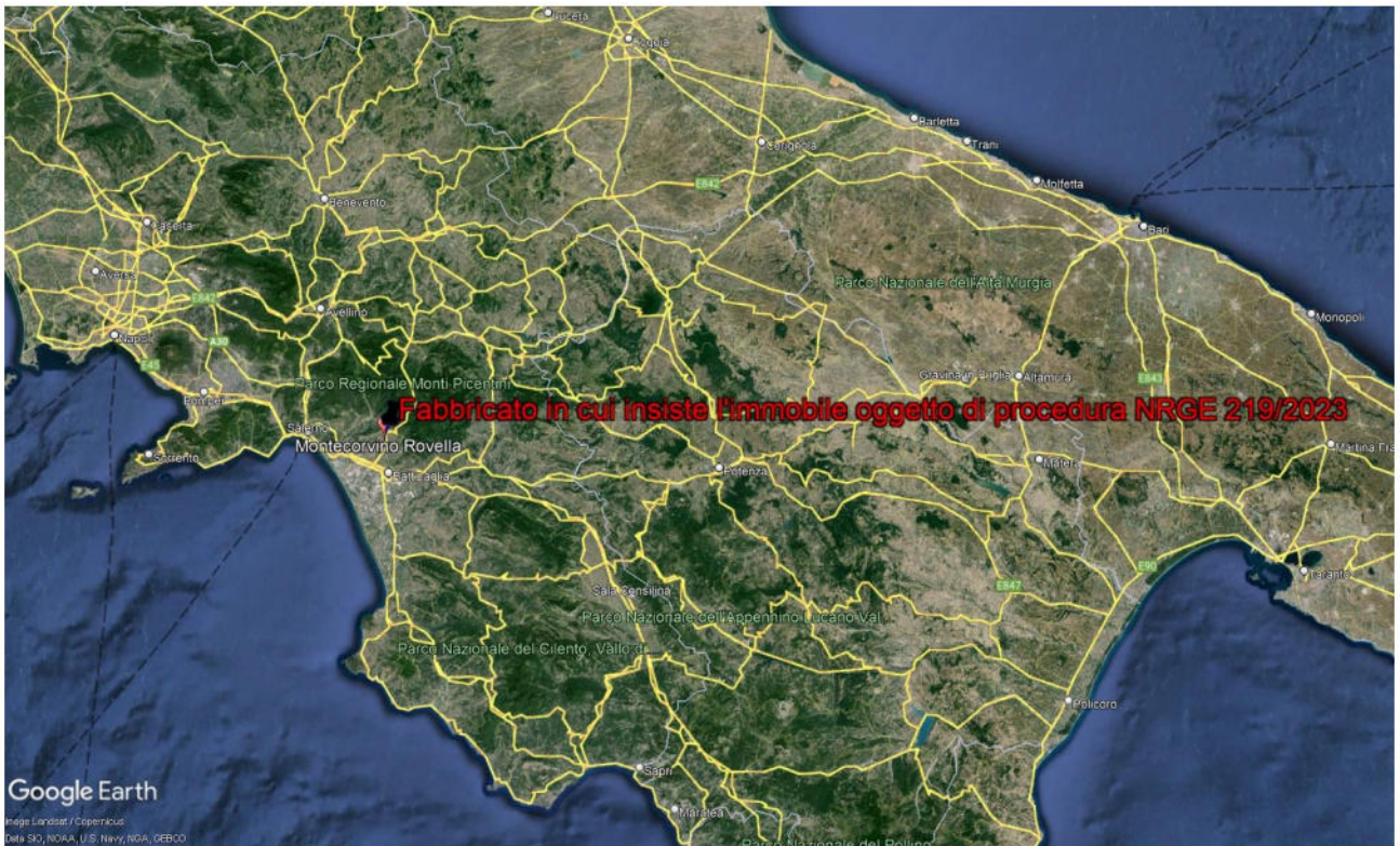
FOTO 2 – Localizzazione del bene pignorato nel Comune di Montecorvino Rovella (SA)