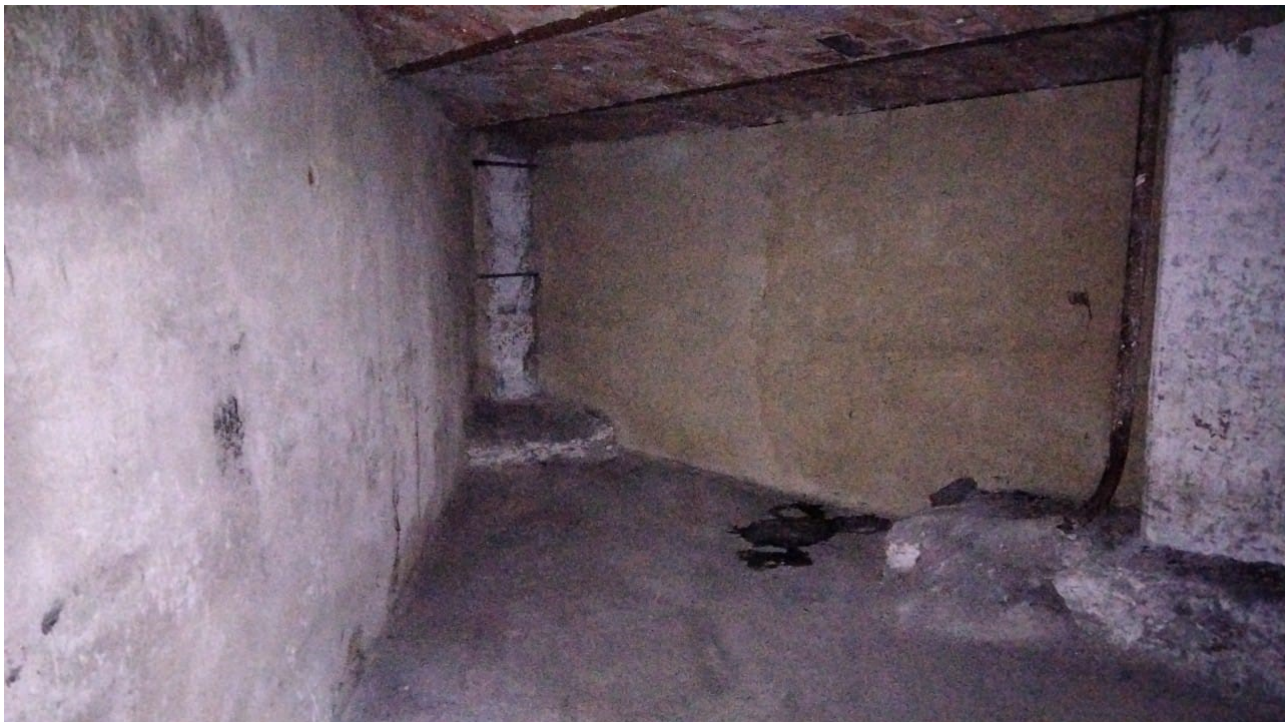
Vista interno locale cantina al piano terra dal cortile interno