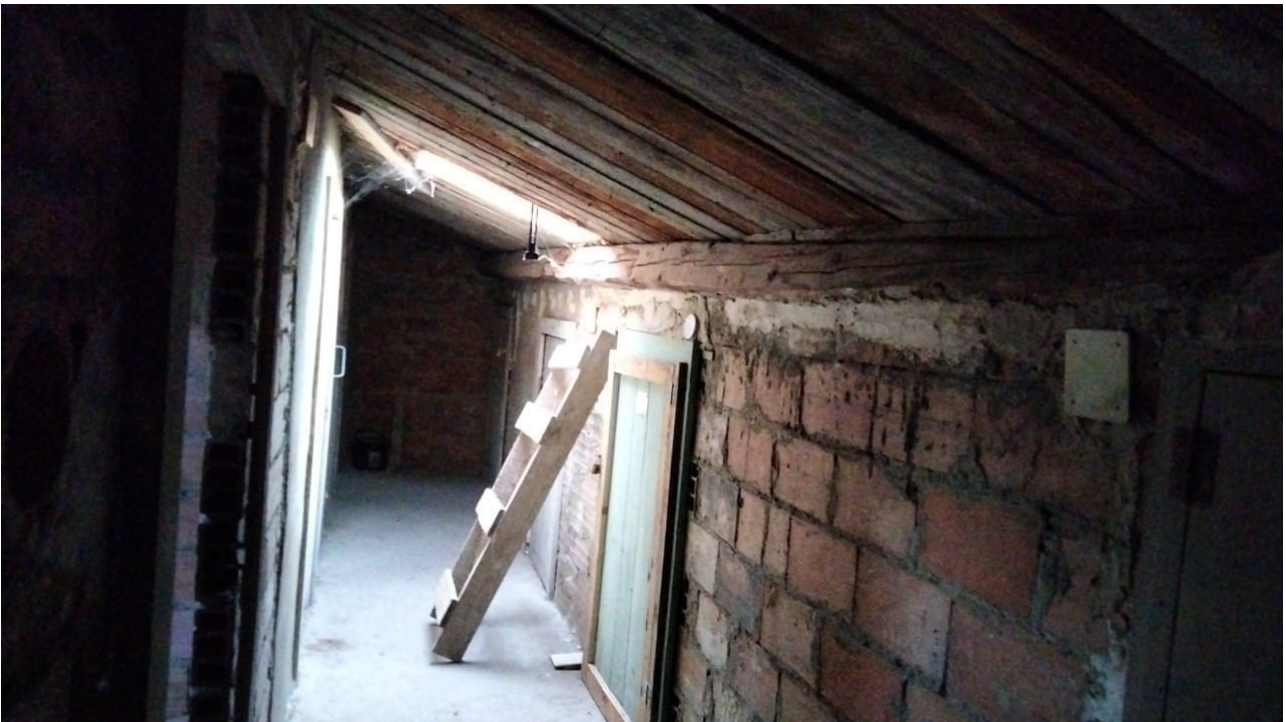
Vista corridoio condominiale di accesso alle soffitte piano sottotetto