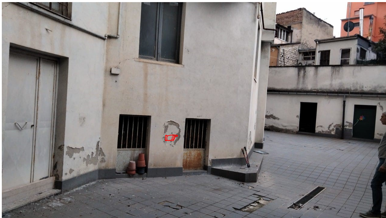
Vista dal cortile interno accesso alla cantina

Cit. "Piccolo vano accessorio, al piano terra, adibito a carbonaia, con ingresso dalla prima porta a destra per chi accede nel cortile condominiale, provenendo dalle scale comuni, in confine con proprietà Falcione o aventi causa, cortile condominiale, scale condominiali, salvo se altri".