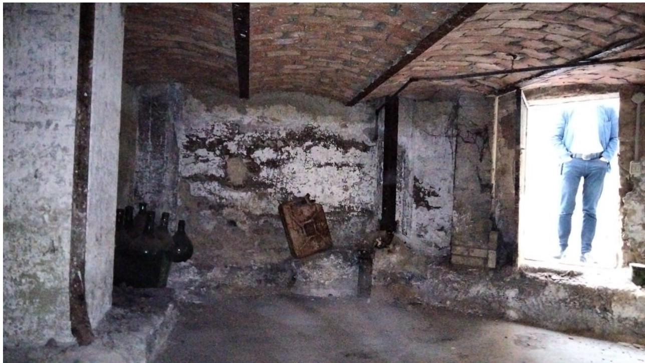
Vista interno locale cantina al piano terra dal cortile interno