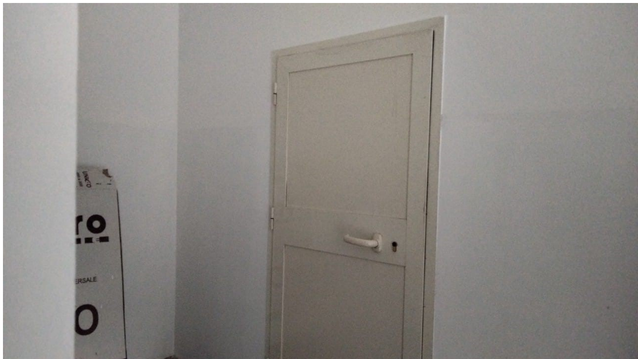
Vista porta condominiale di accesso alle soffitte piano sottotetto