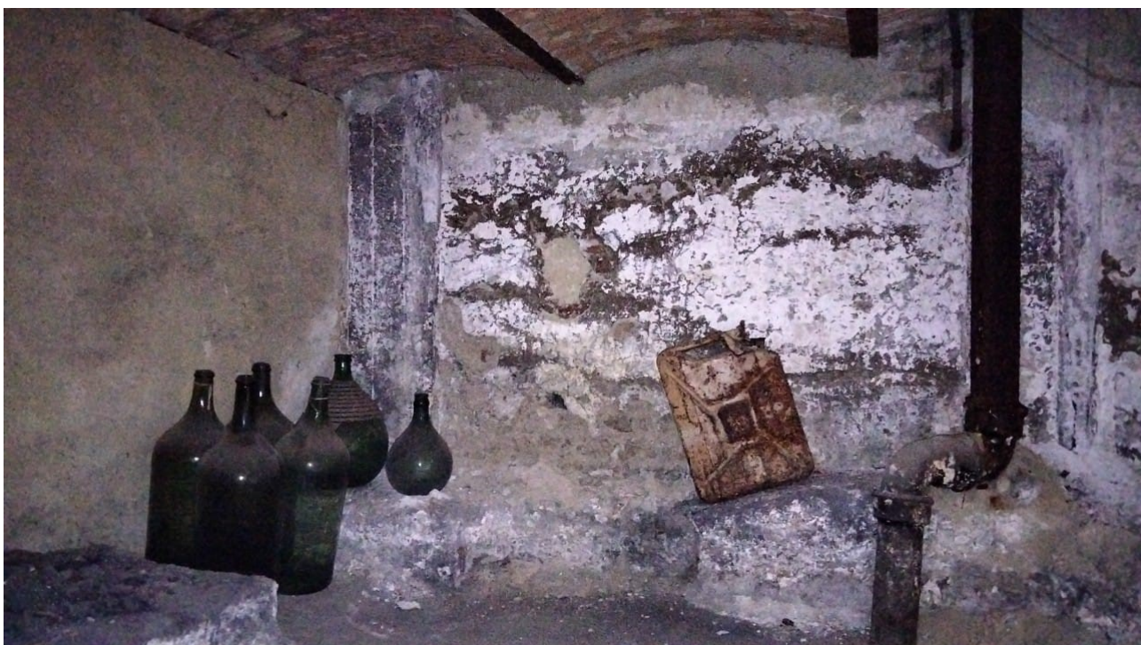
Vista interno locale cantina al piano terra dal cortile interno