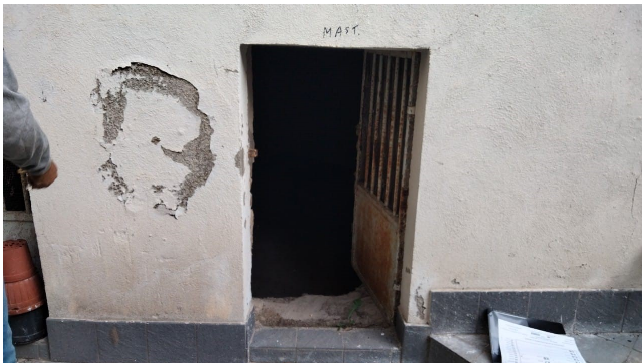
Vista dal cortile interno accesso alla cantina