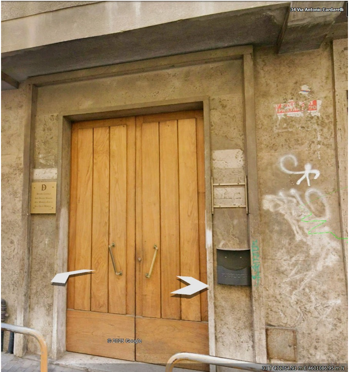
Seguono foto interne accessori indiretti cantina al piano terra e soffitta al sottotetto in catasto Comune di Campobasso (CB) foglio 119 particella 54 sub.16, piano T-6-7 Via Cardarelli n.34