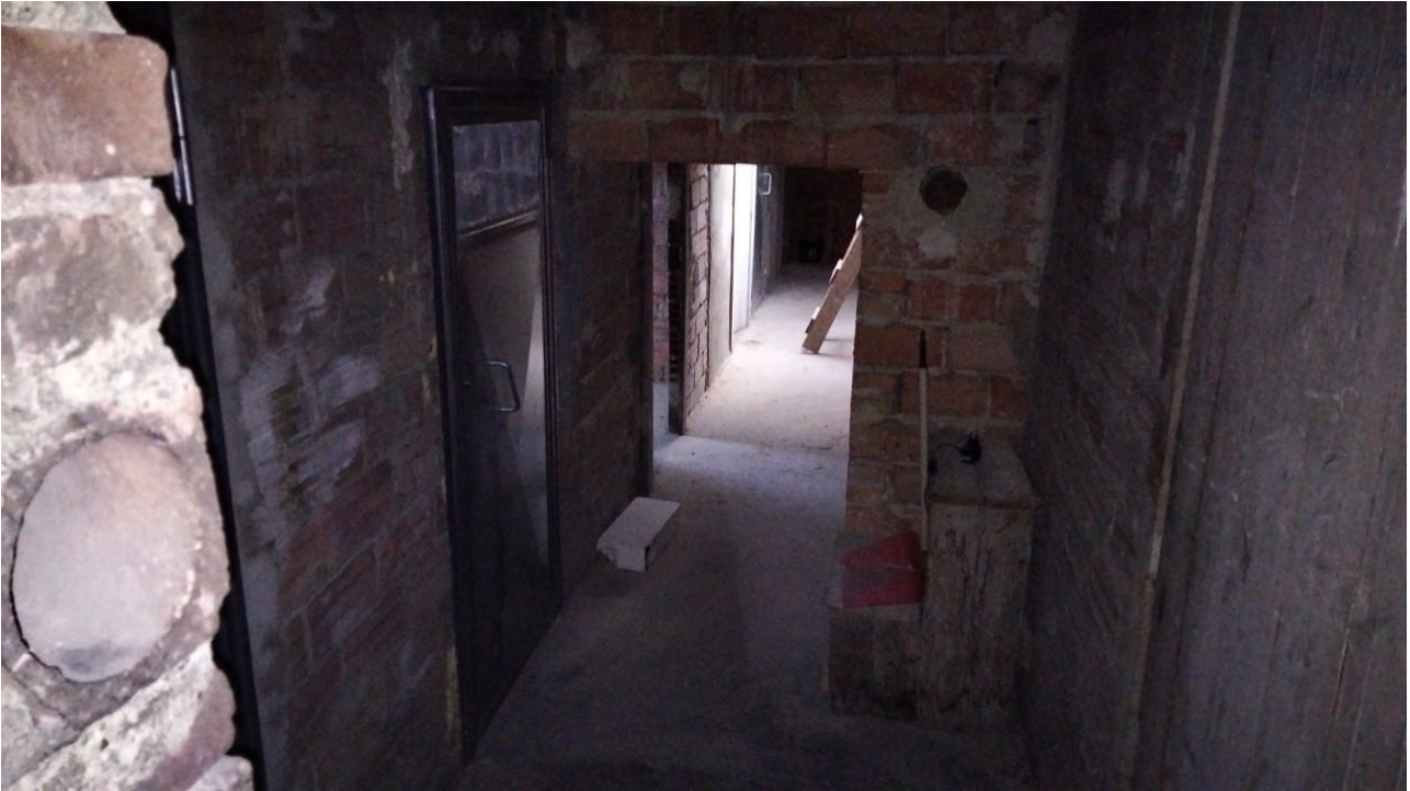
Vista corridoio condominiale di accesso alle soffitte piano sottotetto