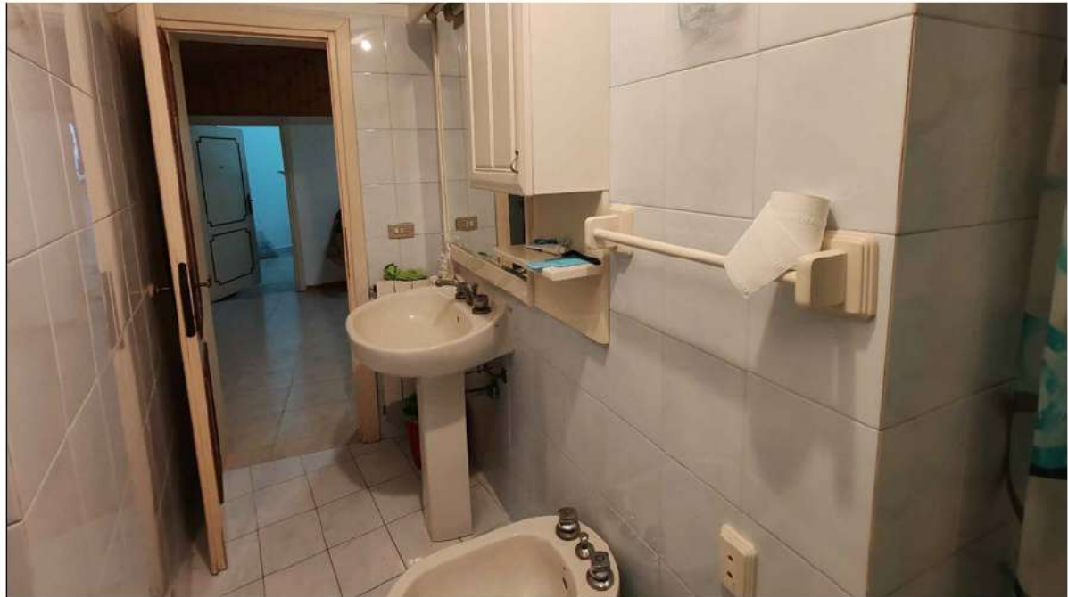
foto 9 -vista del bagno.