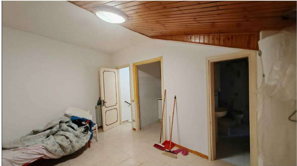
foto 5 - vista d'insieme del soggiorno.