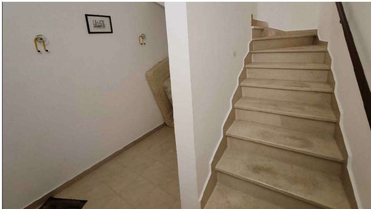
foto 3 - vista del vano scala d'ingresso al piano T.