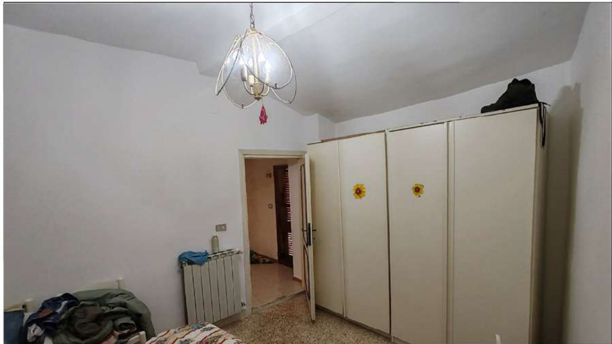
foto 7 - vista della camera da letto.