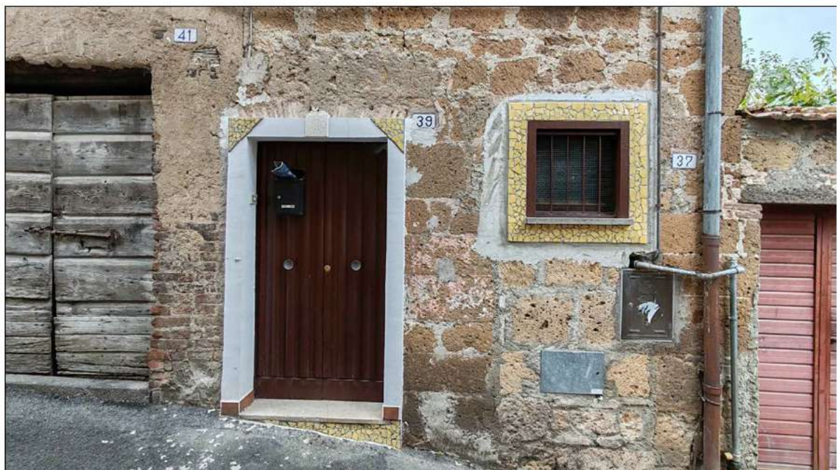
foto 2 - dettaglio dell'ingresso all'u.i.u., civico n. 39 con a destra la finestra da modificare.