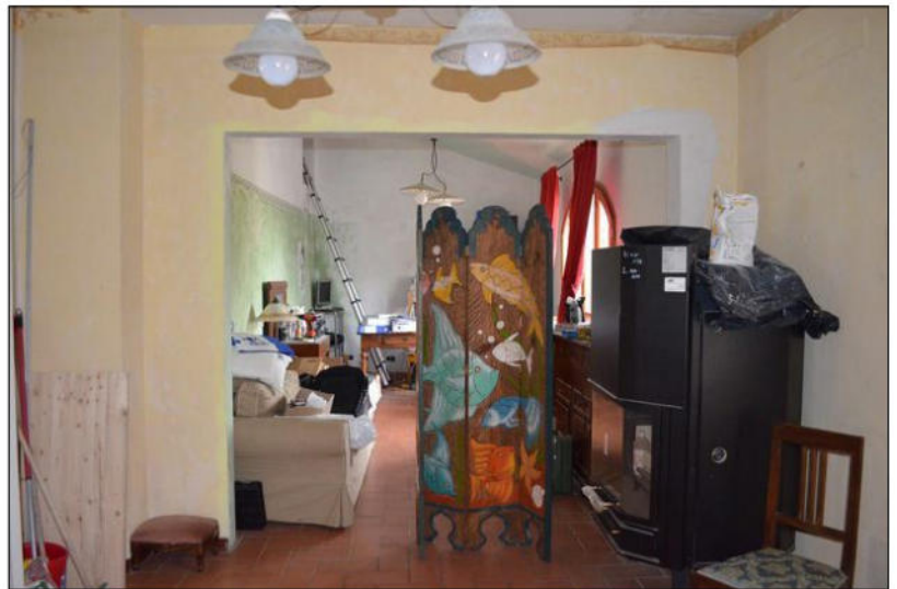
Vista E ingresso