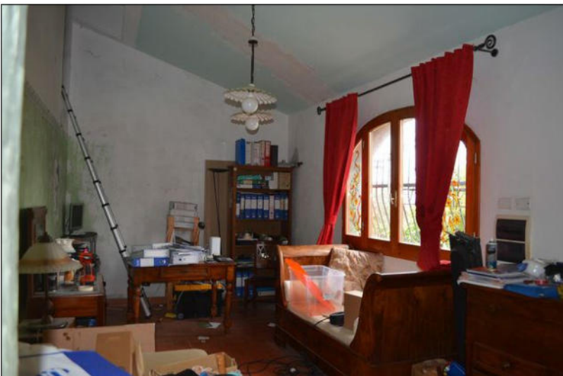
Vista F soggiorno