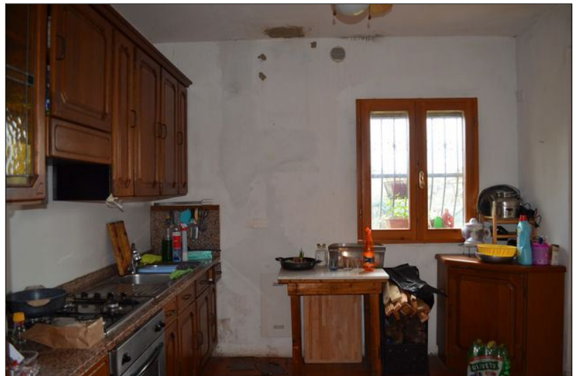
Vista H cucina