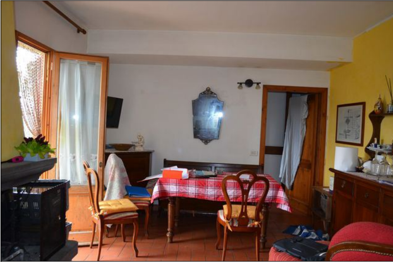
Vista L pranzo