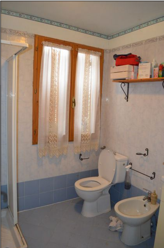
Vista T bagno