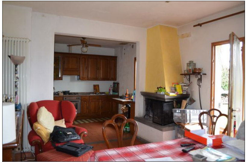
Vista M pranzo