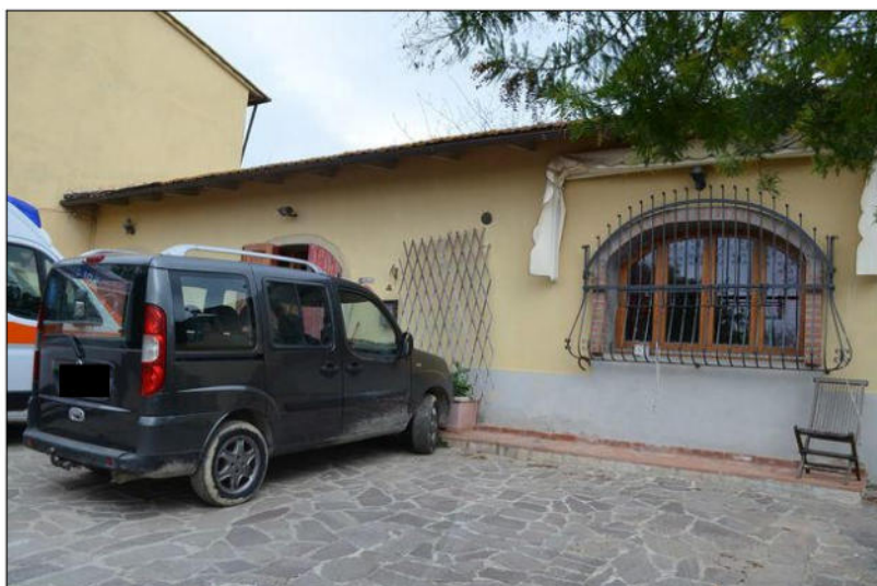
Vista B esterno fronte principale