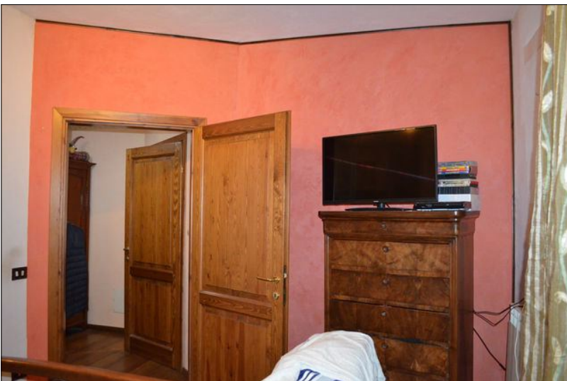
Vista Q camera ①