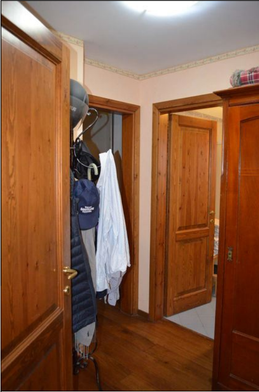
Vista O disimpegno