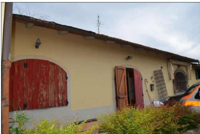
Vista A esterno fronte principale