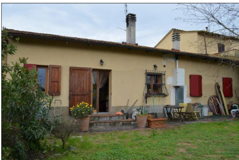
Vista C retro