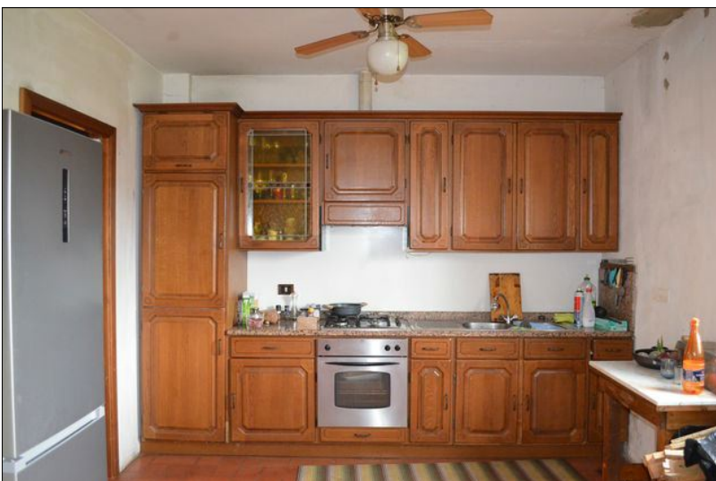
Vista I cucina