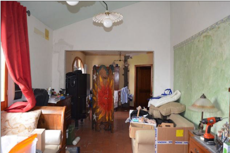
Vista G soggiorno