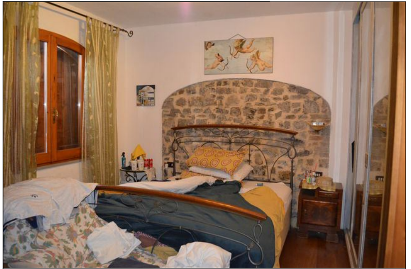
Vista P camera ①