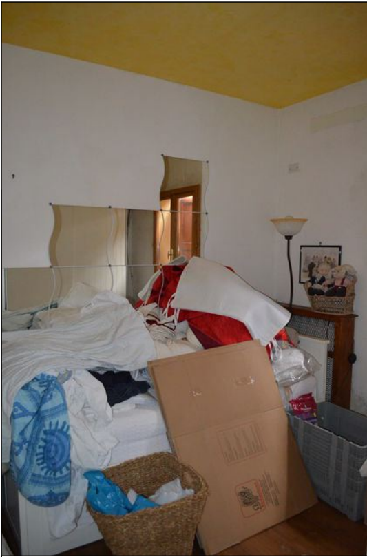
Vista R camera ②