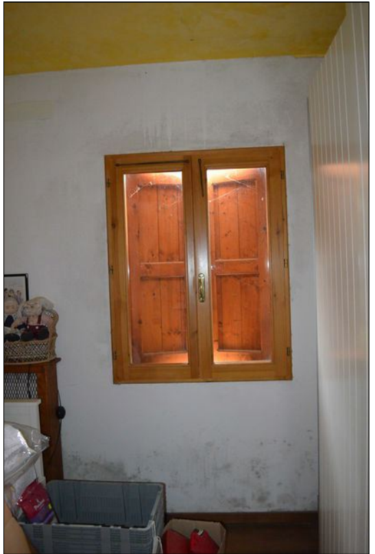
Vista S camera ②