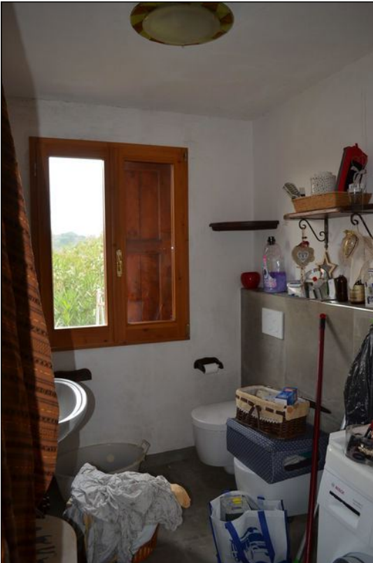
Vista N bagno