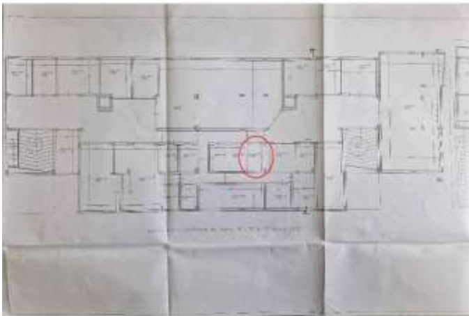
Planimetria allegata alla SCIA 2/11

Non è stato rilasciato il certificato di agibilità. Il rilascio della Segnalazione Certificata di Agibilità (SCA) è subordinato al pagamento delle sanzioni come da nota prot 63624 del 06/11/2014 (in allegato). Per la presentazione della SCA, comprensiva di diritti di segreteria, sanzioni e oneri per il Tecnico che dovrà presentarla, si stima complessivamente la somma di € 2.500,00 che sarà detratta dal valore stimato dell'immobile.