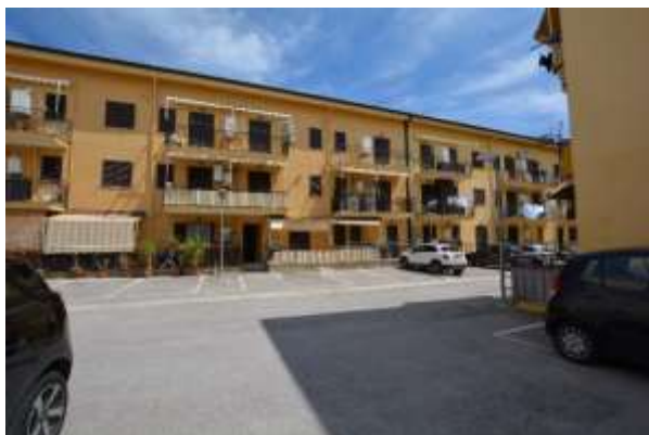
Foto 3 - Edificio di Via Bari n. 18 ad Aspra