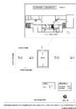
Planimetria di rilievo