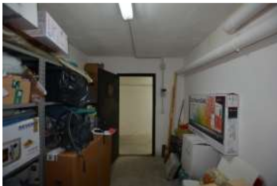
Foto 9 - Magazzino