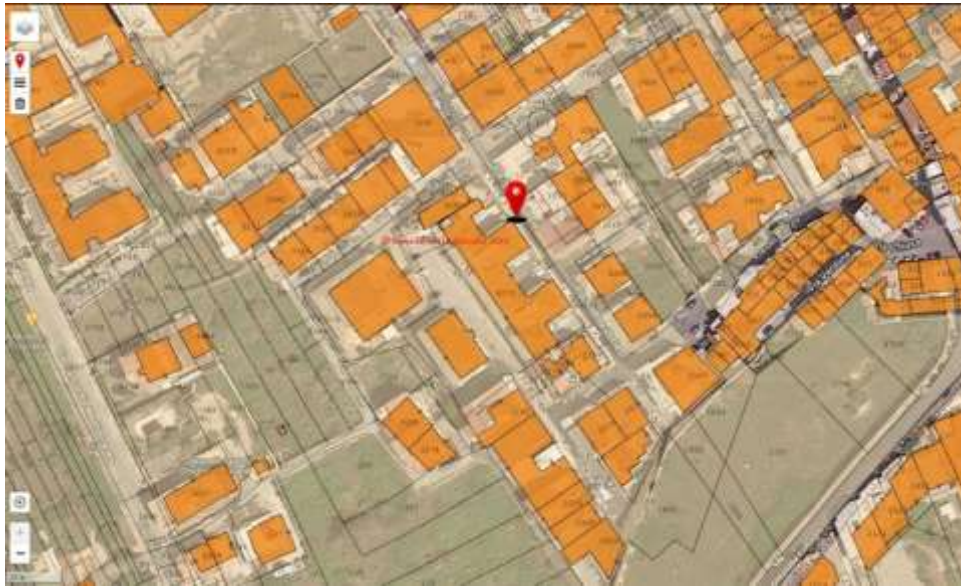
Foto 6 – Sovrapposizione immagine satellitare con le particelle catastali del Bene oggetto del presente lotto