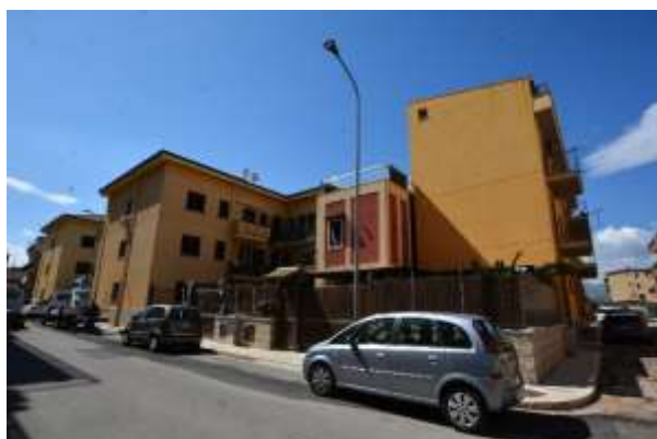
Foto 1 - Palazzina di Via Andrea Doria/Via Bari 18

U.I. 20 - PERIZIA DI STIMA RELATIVA AL MAGAZZINO SITO NEL COMUNE DI BAGHERIA, VIA ANDREA DORIA 22, UBICATO AL PIANO S1, ISCRITTO AL N.C.E.U. AL FOGLIO 8, PARTICELLA 4270, SUBALTERNO 61