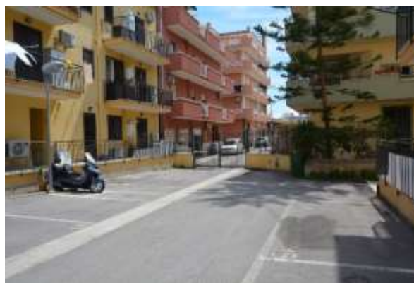
Foto 2 - Ingresso da Via Bari n. 18 ad Aspra