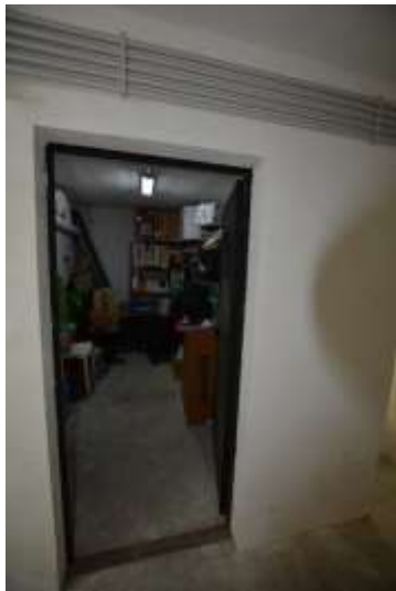
Foto 7 - Ingresso magazzino da corridoio condominiale