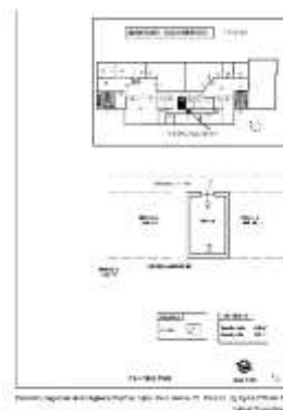
Planimetria di rilievo