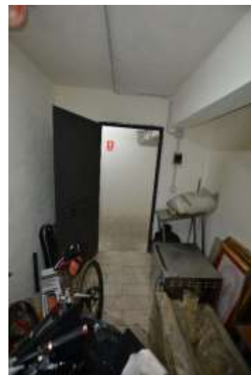
Foto 9 - Magazzino