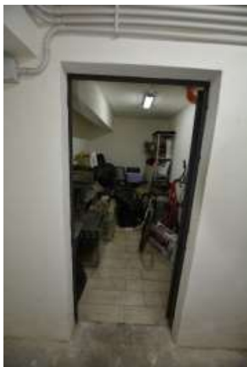
Foto 7 - Ingresso magazzino da corridoio condominiale