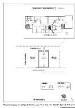
Planimetria di rilievo