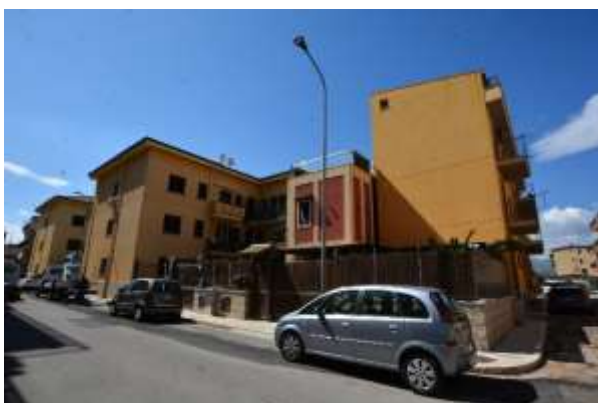
Foto 1 - Palazzina di Via Andrea Doria/Via Bari 18

U.I. 19 - PERIZIA DI STIMA RELATIVA AL MAGAZZINO SITO NEL COMUNE DI BAGHERIA, VIA ANDREA DORIA 22, UBICATO AL PIANO S1, ISCRITTO AL N.C.E.U. AL FOGLIO 8, PARTICELLA 4270, SUBALTERNO 60