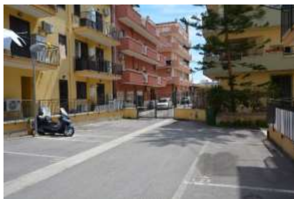
Foto 2 - Ingresso da Via Bari n. 18 ad Aspra