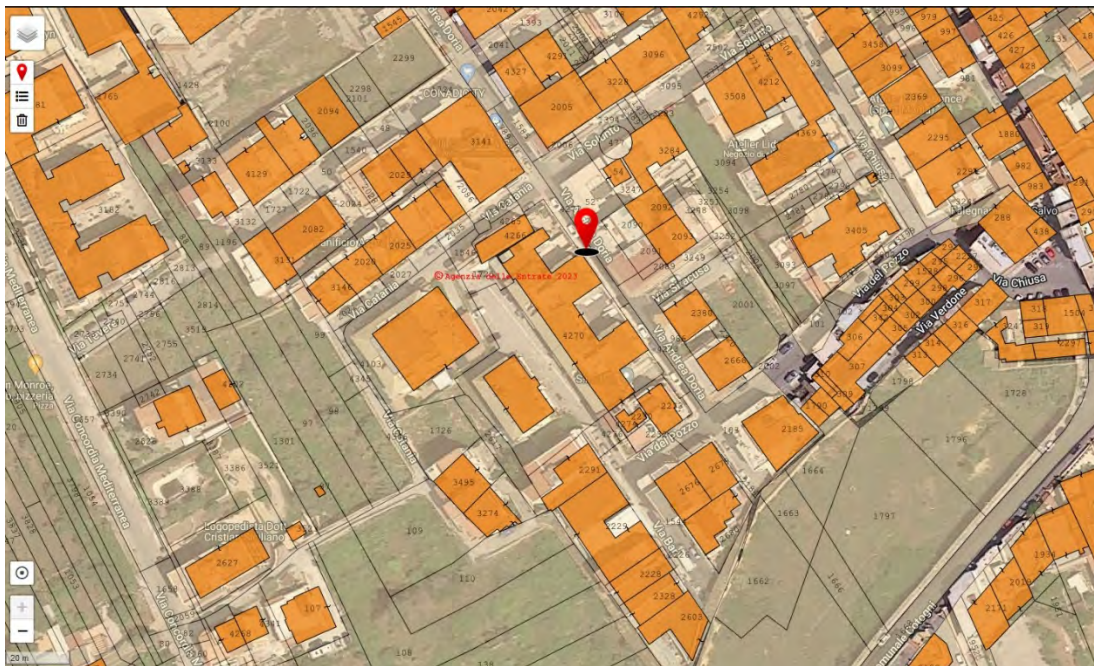
Foto 5 – Foto satellitare di Bagheria e del bene