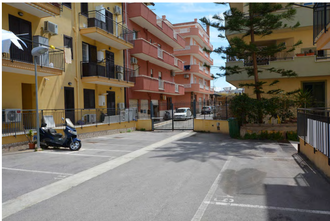
Foto 1 – Edificio di Via Bari n. 18 / Via Andrea Doria, 22 a Bagheria Frazione di Aspra