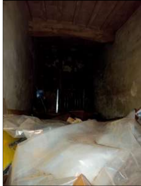
Foto 17 disimpegno a comune