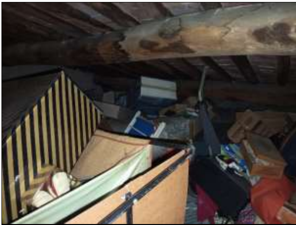
Foto 53 sottotetto non abitabile