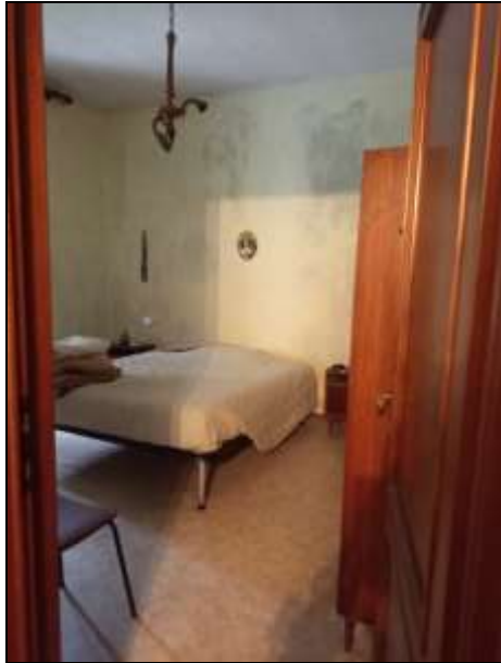
Foto 28 - camera