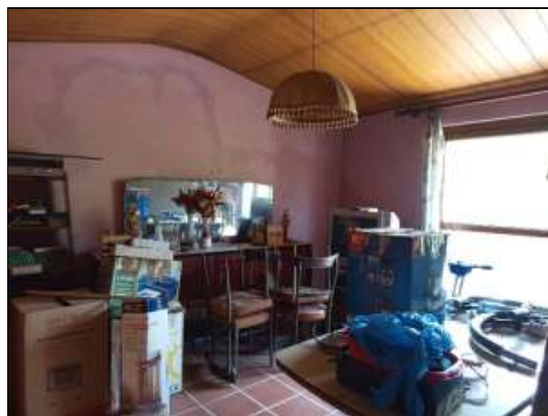
Foto 46 sala