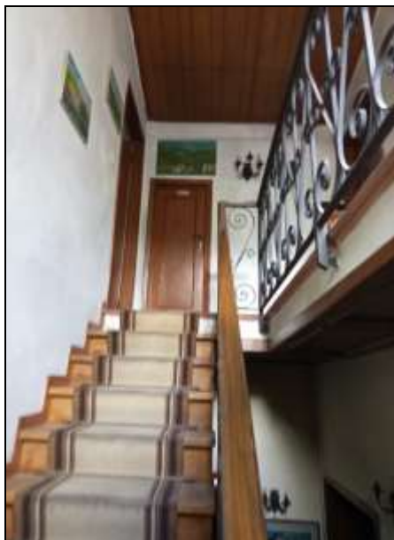
Foto 43 vano scala P1-P2