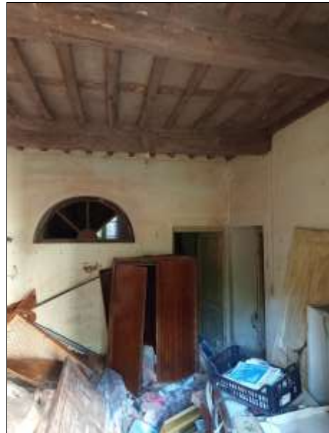
Foto 23 cantina a comune