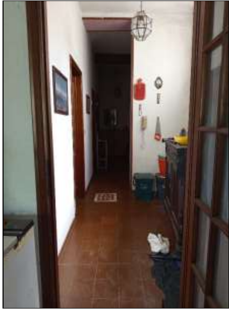
Foto 39 disimpegno