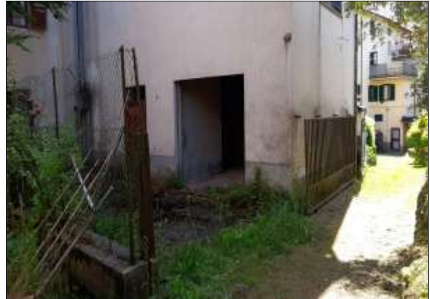
Foto 25 resede a comune - ingresso cantina a comune