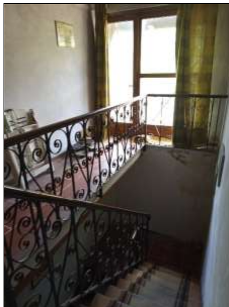
Foto 44 vano scala P1-P2