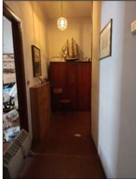
Foto 33 disimpegno