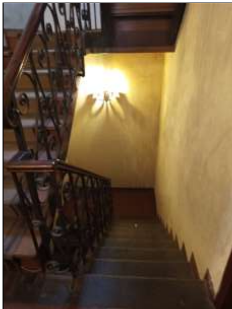
Foto 26 vano scala PT-P1