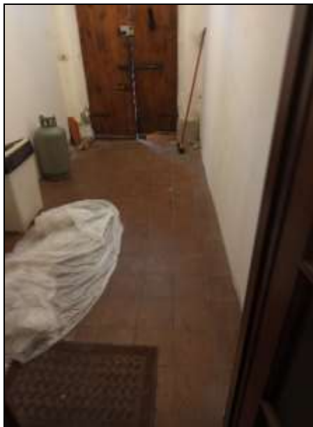
Foto 11 ingresso a comune