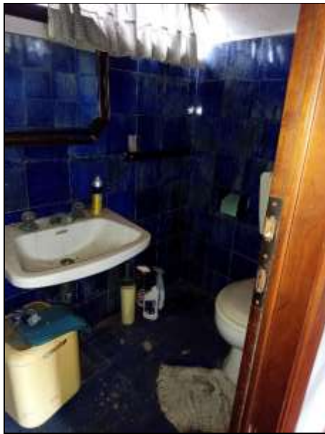
Foto 49 wc