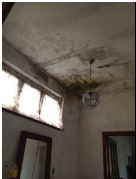
Foto 42 disimpegno