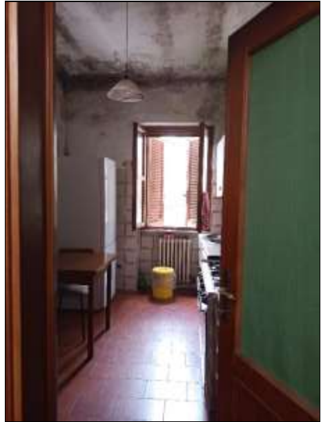
Foto 40 disimpegno