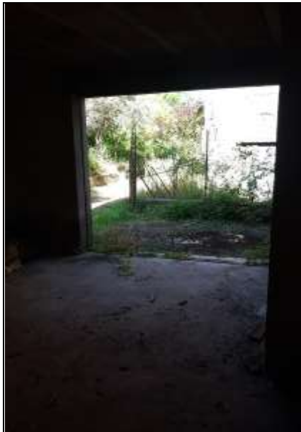
Foto 22 cantina a comune