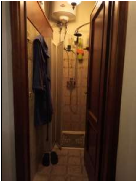
Foto 34 doccia