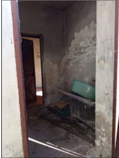
Foto 20 caldaia a comune