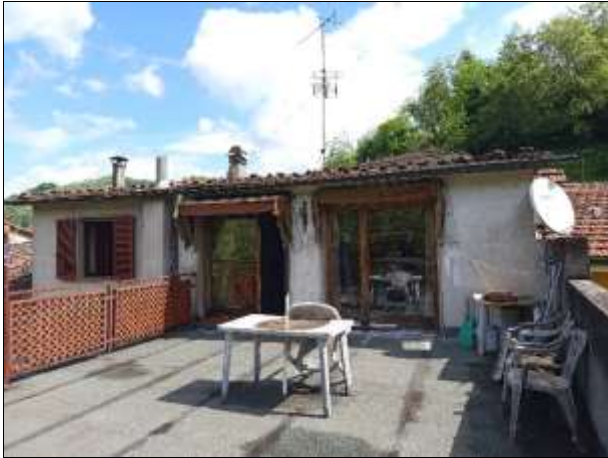
Foto 51 terrazza