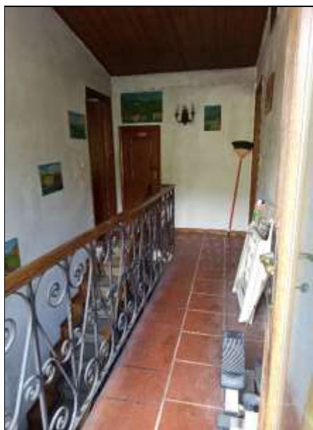
Foto 45 disimpegno