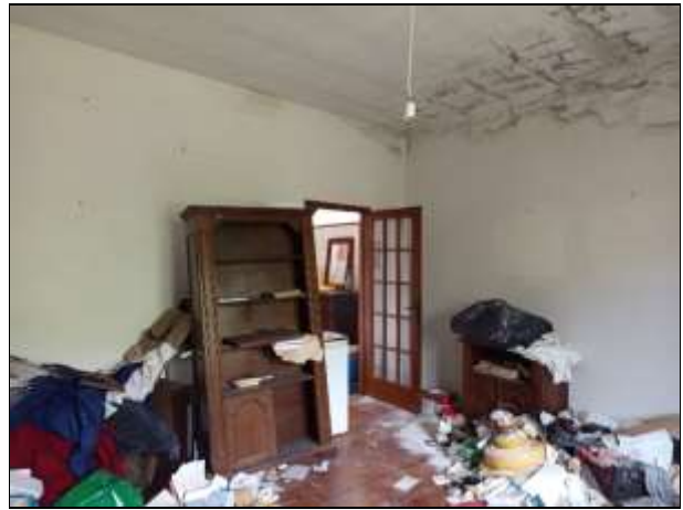
Foto 38 sala