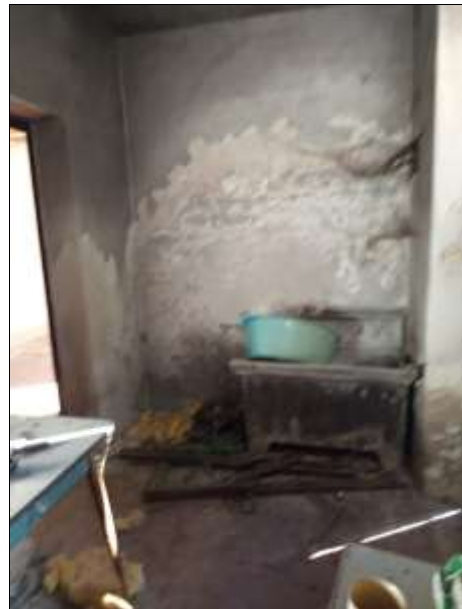
Foto 19 caldaia a comune