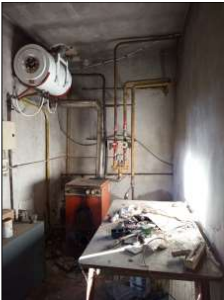
Foto 18 caldaia a comune