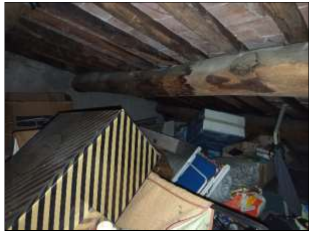
Foto 54 sottotetto non abitabile