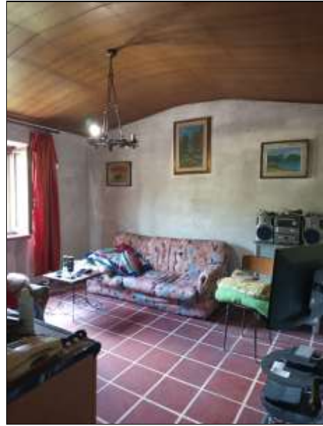
Foto 48 sala