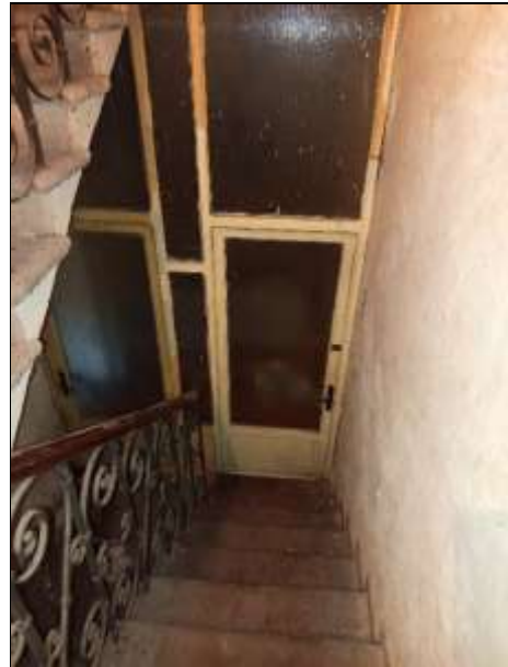
Foto 15 vano scala tra Pt e PS1 a comune