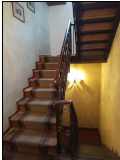
Foto 27 vano scala P1-P2