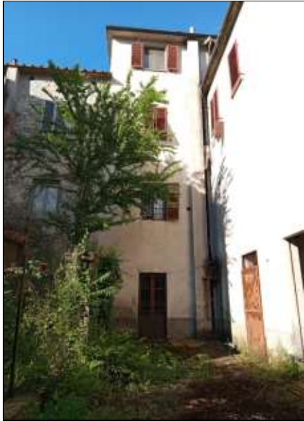
Foto 24 resede a comune