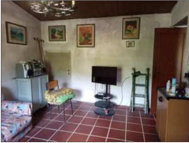
Foto 47 sala