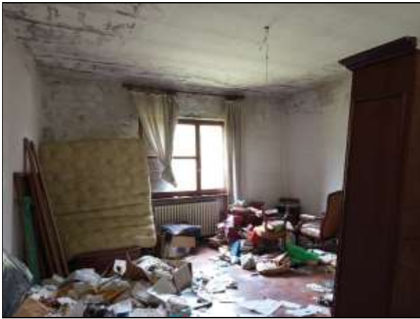
Foto 37 sala