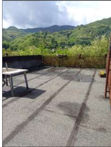
Foto 52 terrazza