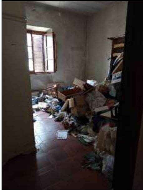
Foto 32 camera