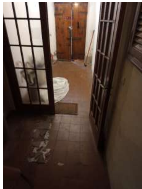
Foto 12 ingresso a comune