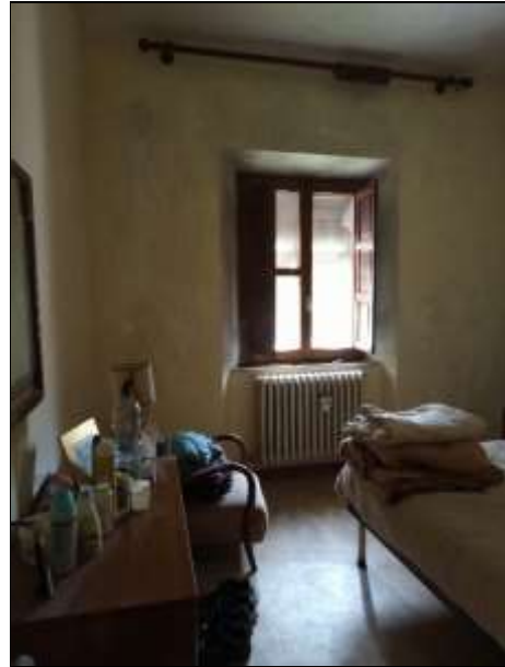
Foto 29 camera