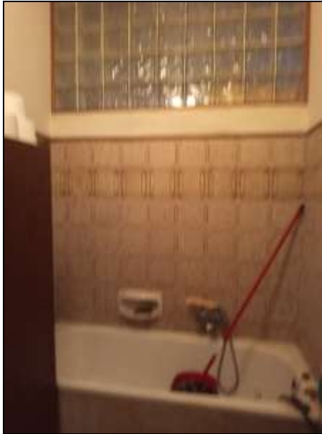
Foto 36 bagno