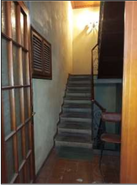
Foto 13 vano scala per accedere al P1