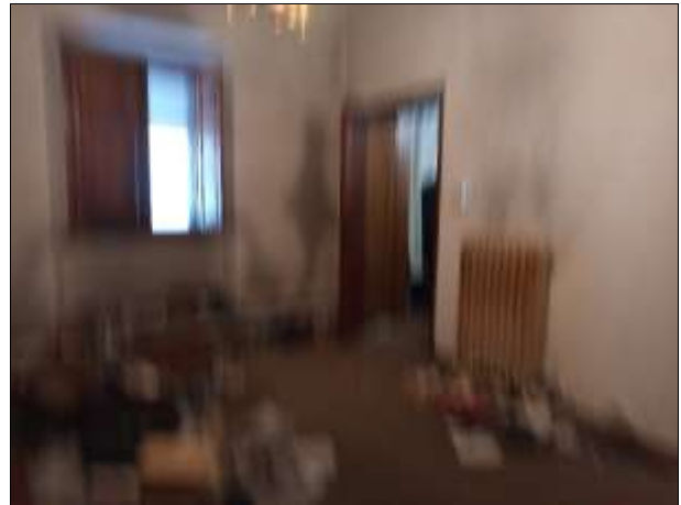
Foto 31 camera