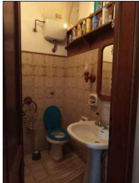
Foto 35 bagno