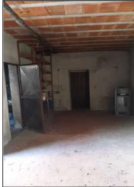
Foto 21 zona esterna a comune