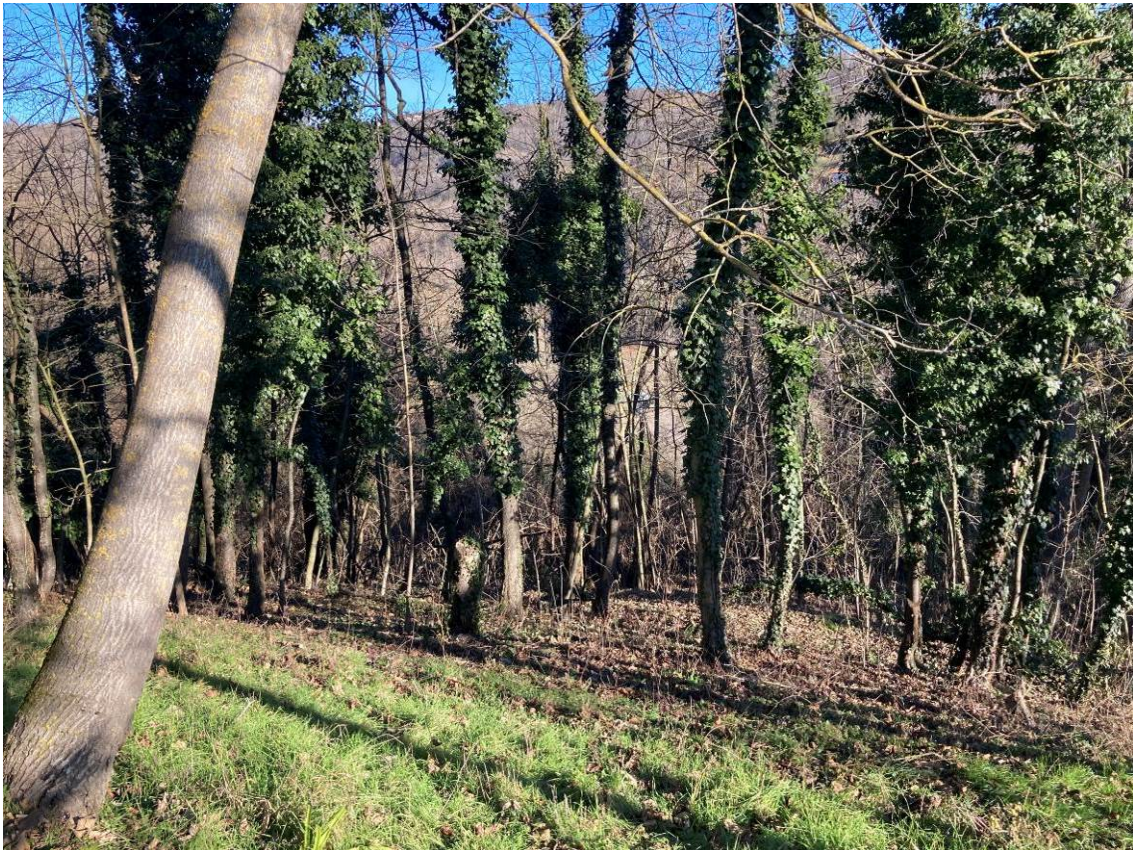
Fig. 47 – Vista esterna di terreni adiacenti all'abitazione.