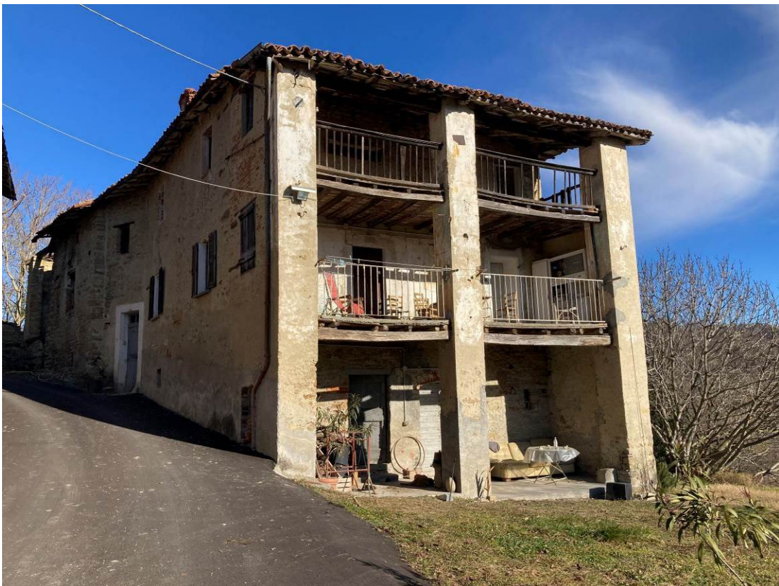
Fig. 2 – Vista esterna dell'abitazione, da Via Pisterno.