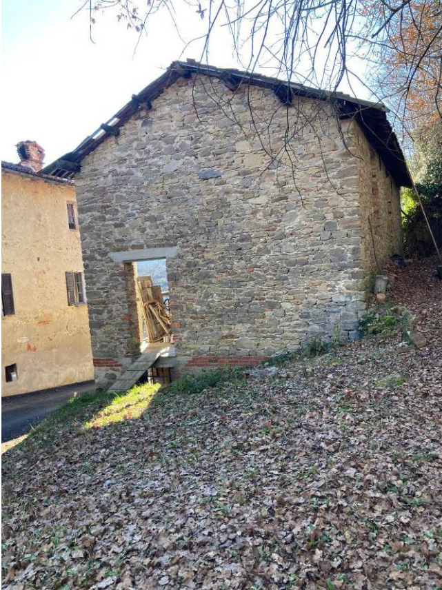
Fig. 39 – Vista esterna del magazzino.