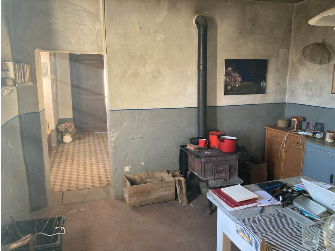
Fig. 9 – Vista interna della cucina dell’abitazione.