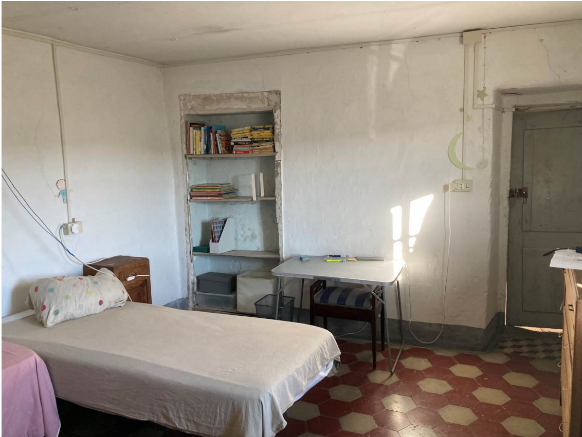
Fig. 17 – Vista interna di camera al piano secondo fuori terra dell'abitazione.