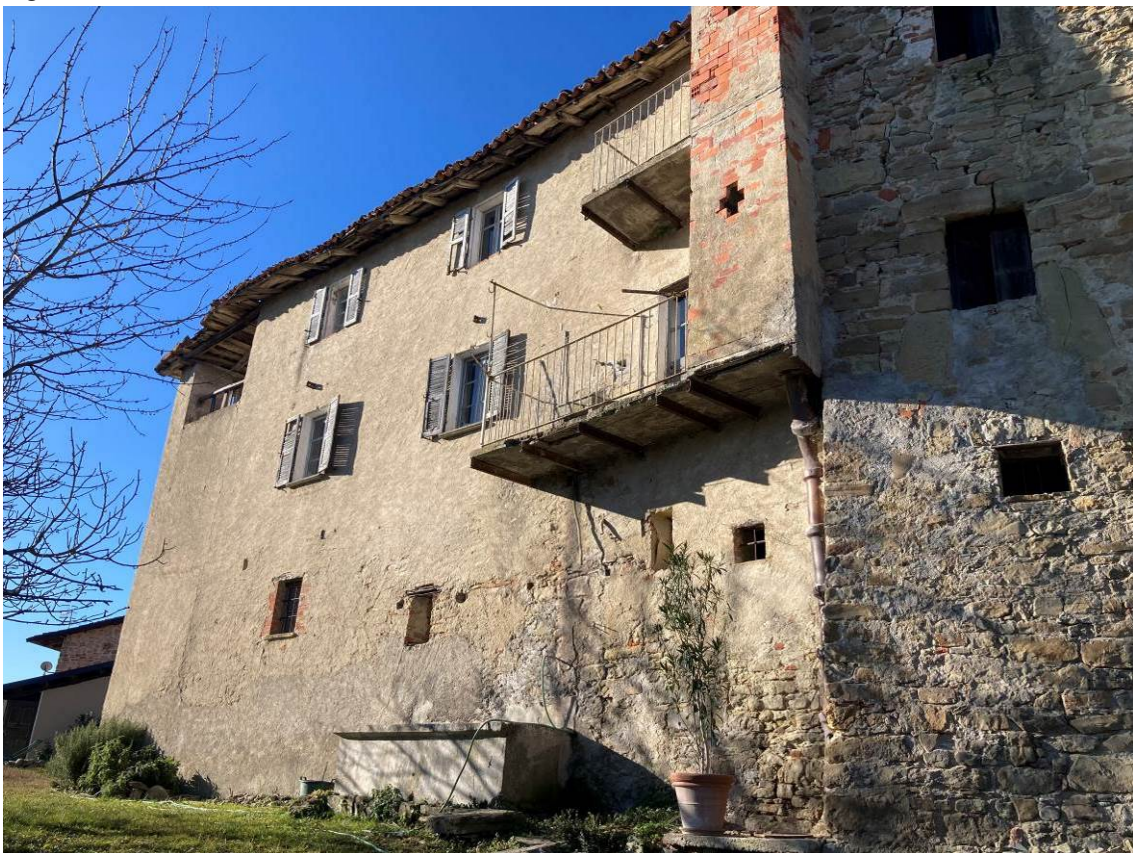
Fig. 6 – Vista esterna dell'abitazione, da valle.