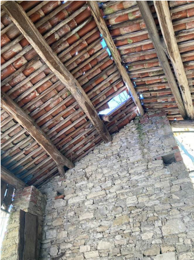
Fig. 41 – Vista interna del fienile del fabbricato accessorio; è evidente porzione di tetto crollato.