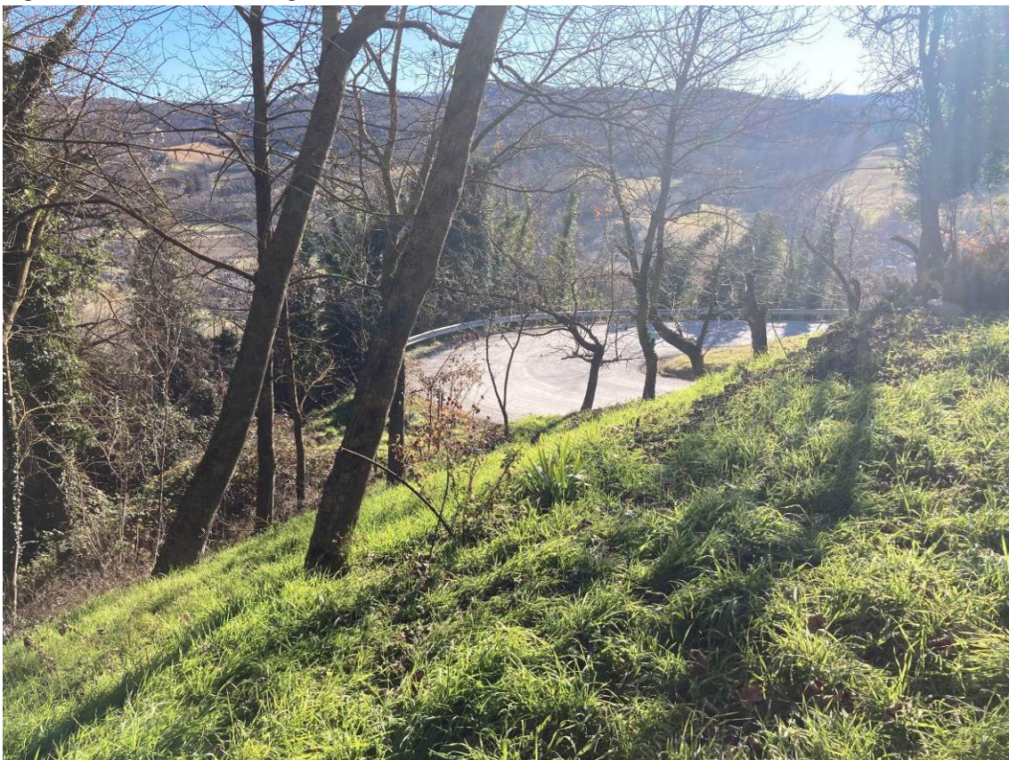
Fig. 45 – Vista esterna di terreni adiacenti all'abitazione.