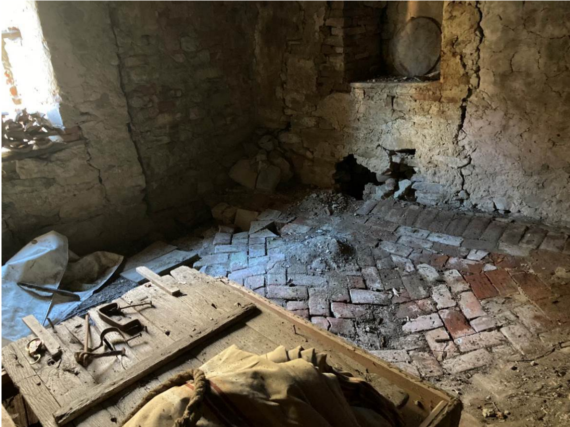
Fig. 25 – Vista interna di locale sottotetto dell'abitazione.