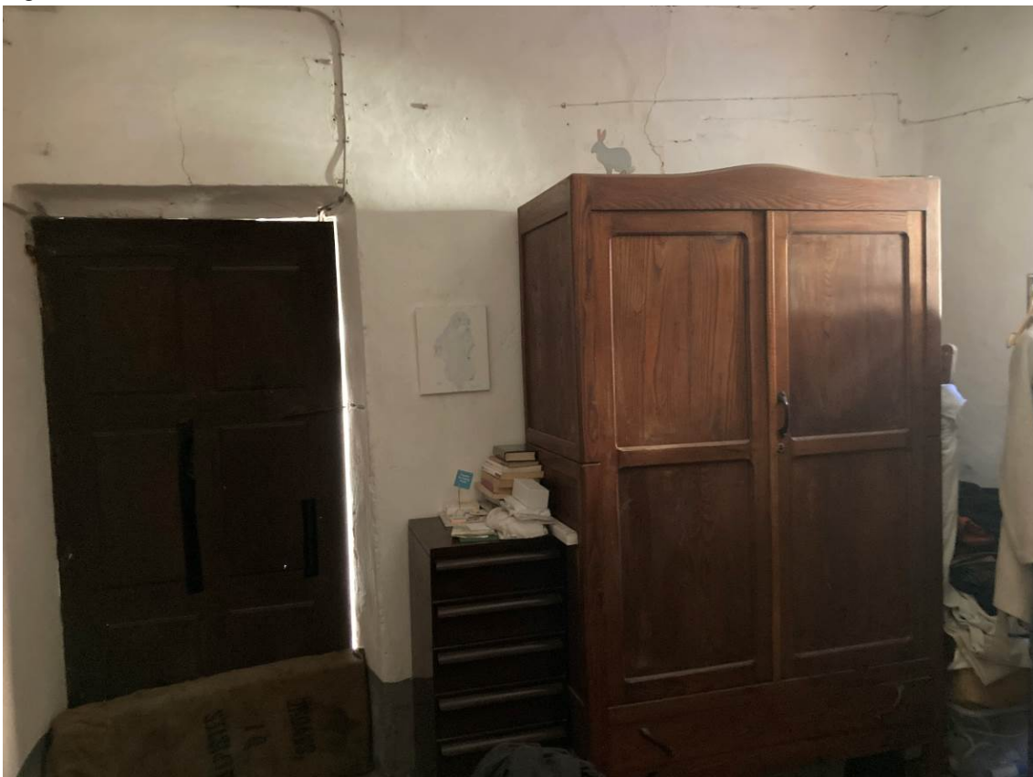
Fig. 10 – Vista interna di camera dell’abitazione.