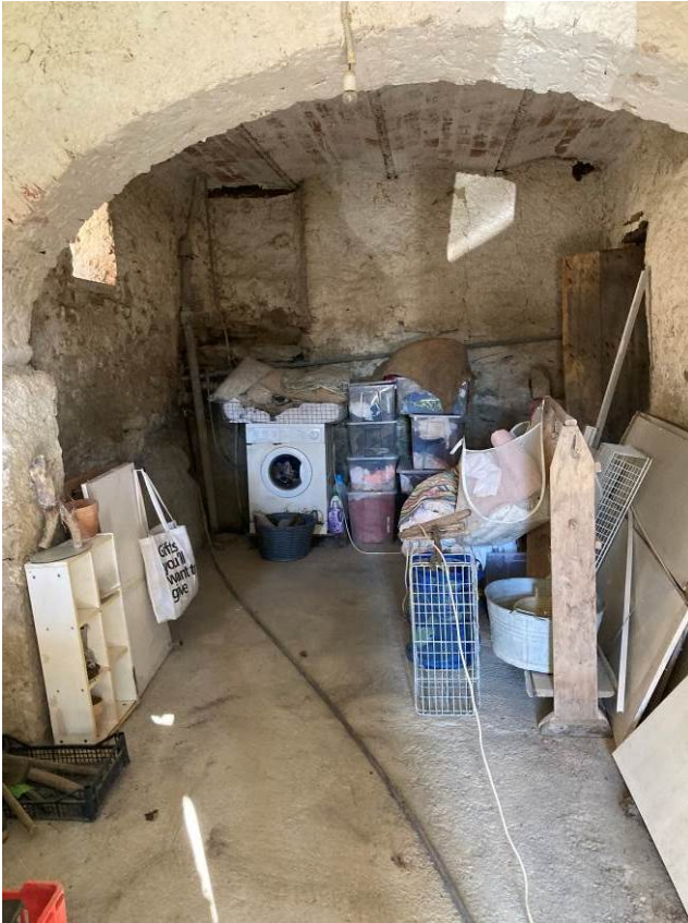
Fig. 32 – Vista di locale sgombero dell'abitazione.