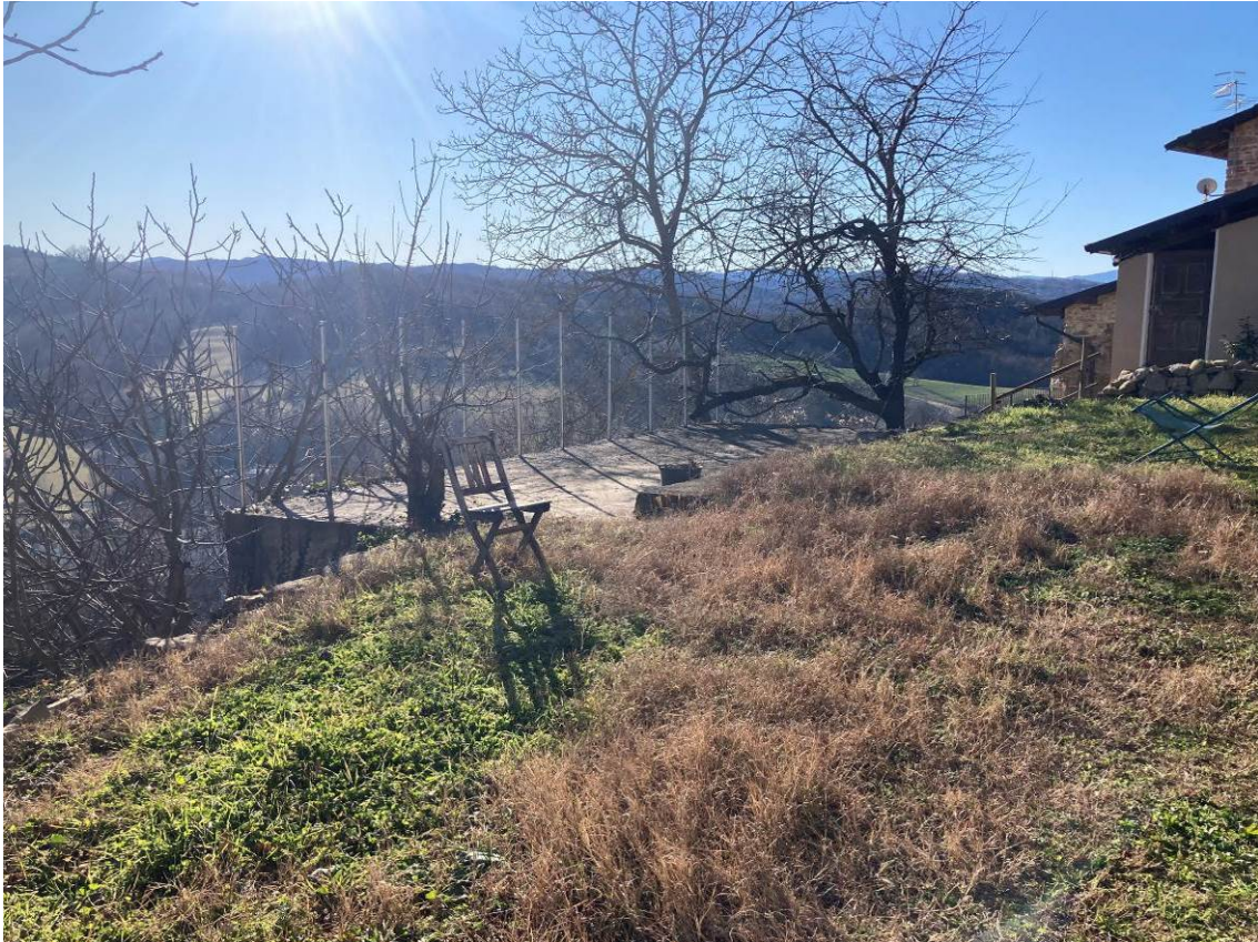
Fig. 46 – Vista esterna di terreni adiacenti all'abitazione.