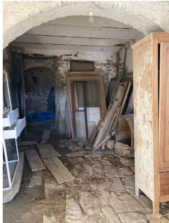
Figg. 30-31 – Vista di locali sgombero dell’abitazione