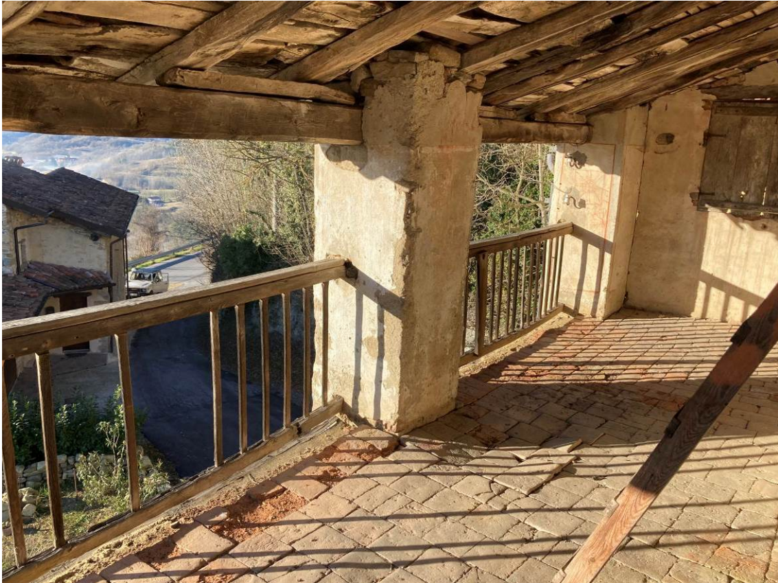
Fig. 27 – Vista del terrazzo esterno al piano secondo fuori terra dell'abitazione