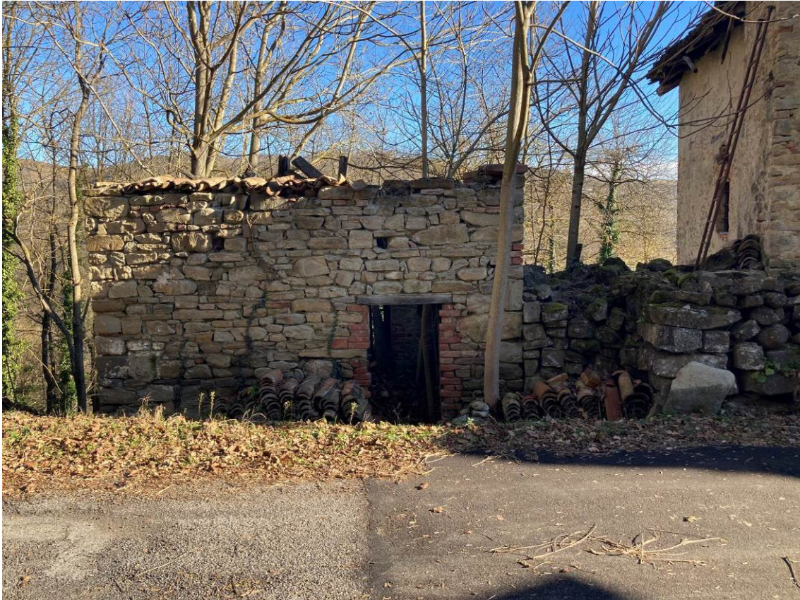
Fig. 36 – Vista della porzione di manufatto (rudere) da demolire.