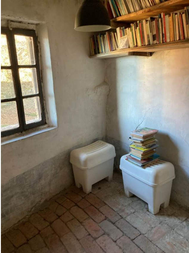
Fig. 23 – Vista interna del ripostiglio al piano secondo fuori terra dell’abitazione.