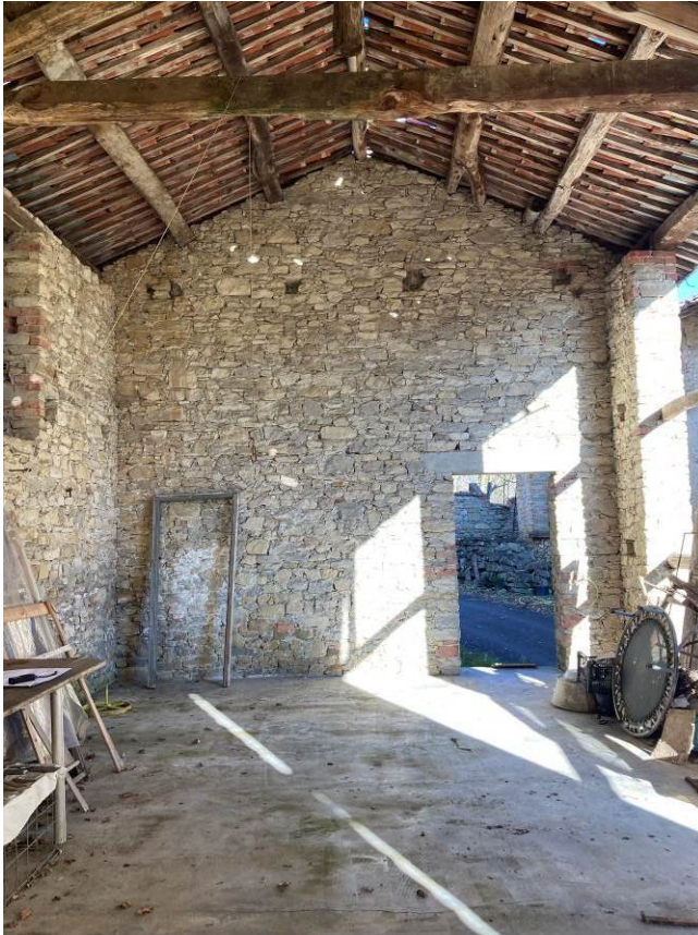
Fig. 40 – Vista interna del fienile del fabbricato accessorio.