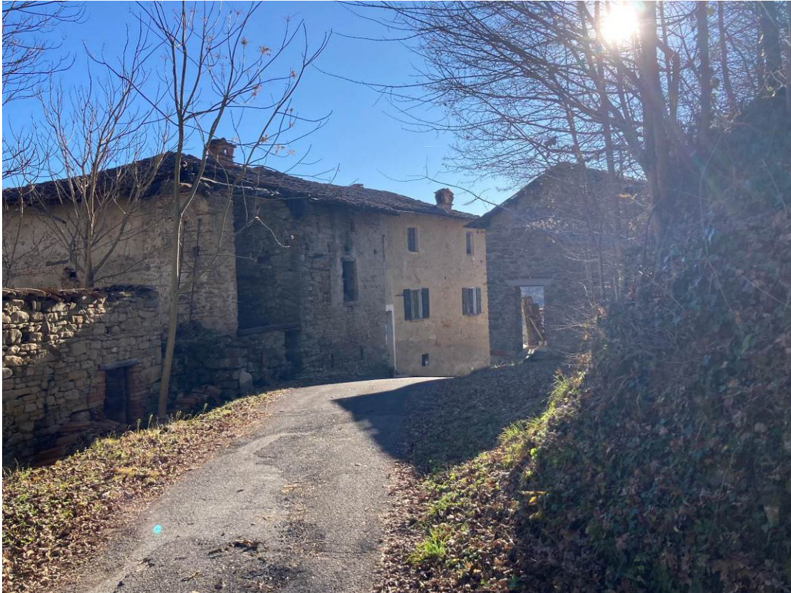
Fig. 3 – Vista esterna dell'abitazione, da Via Pisterno.