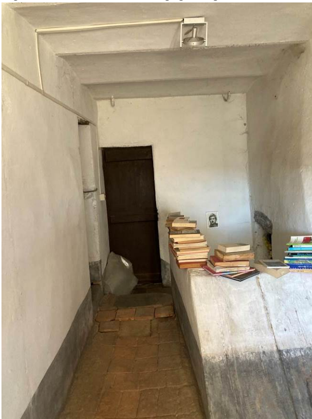
Fig. 20 – Vista interna di disimpegno al piano secondo fuori terra dell’abitazione.