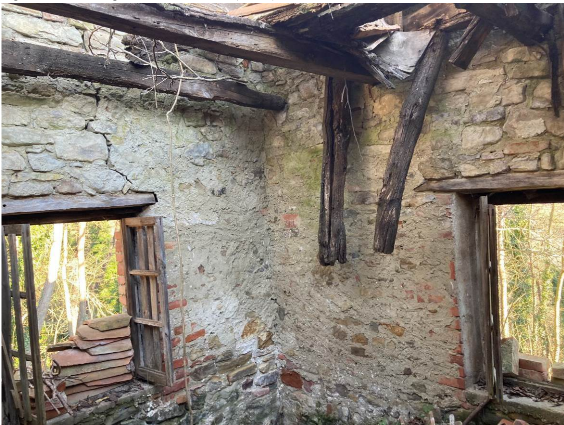
Fig. 37 – Vista interna della porzione di manufatto (rudere) da demolire.