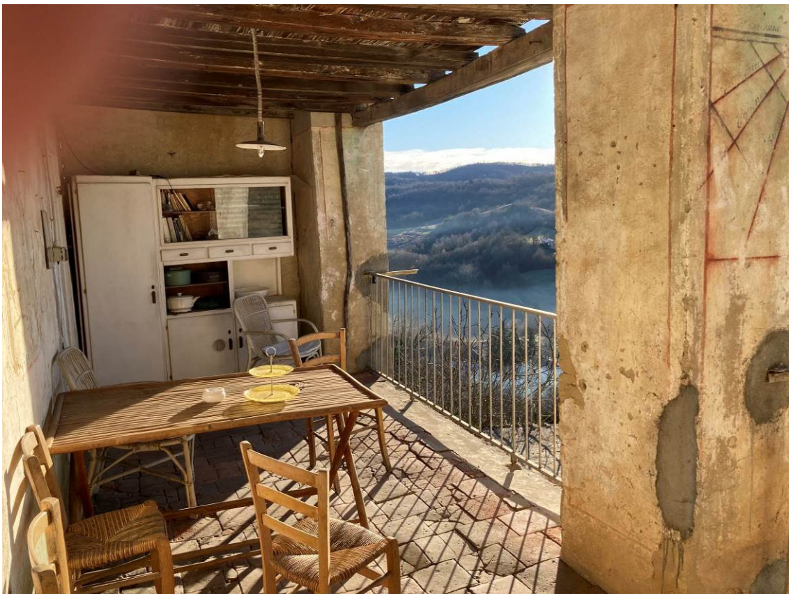
Fig. 16 – Vista del terrazzo al piano primo fuori terra dell’abitazione.