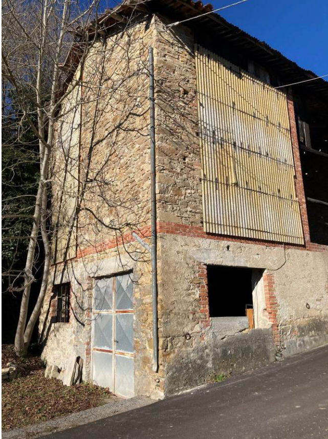
Fig. 38 – Vista esterna del magazzino, da Via Pisterno.