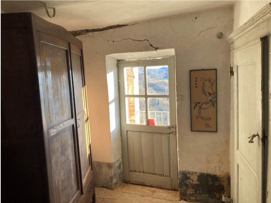
Fig. 19 – Vista interna di disimpegno al piano secondo fuori terra dell’abitazione.