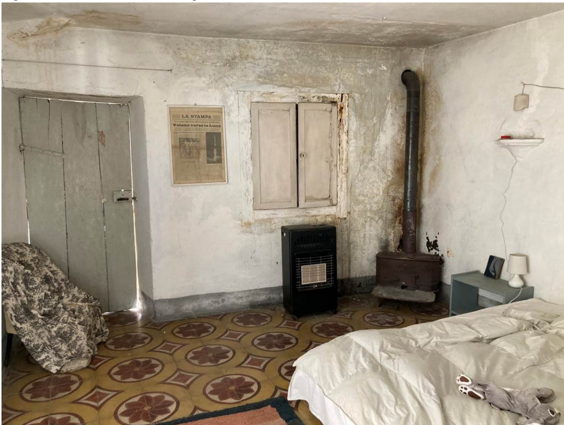
Fig. 18 – Vista interna di camera al piano secondo fuori terra dell'abitazione.