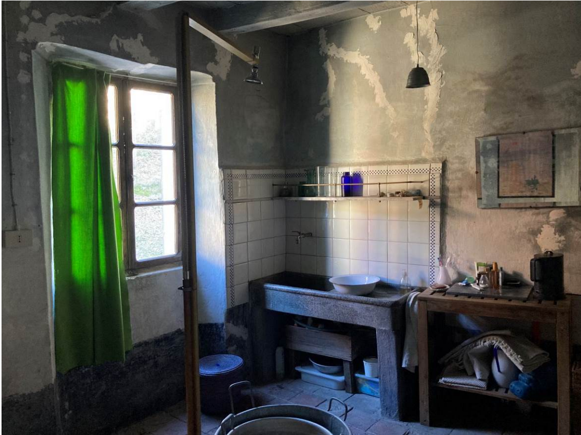
Fig. 11 – Vista interna di camera (adibita a bagno) dell’abitazione.