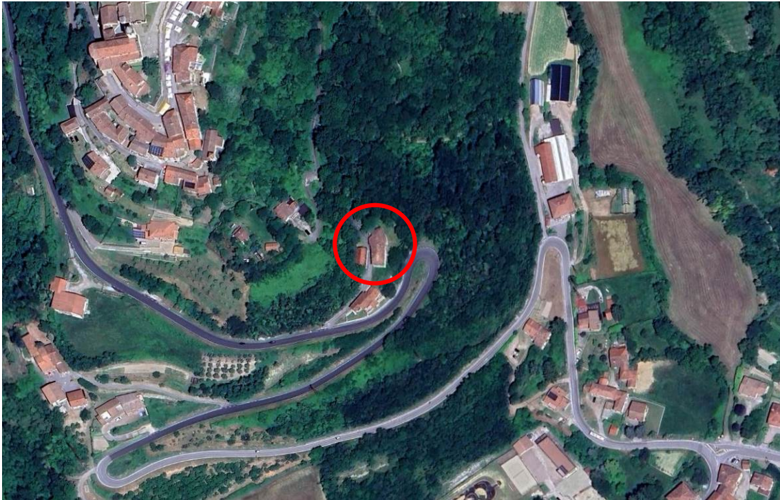
Fig. 1 – Ortofoto con vista della localizzazione dei fabbricati in oggetto.