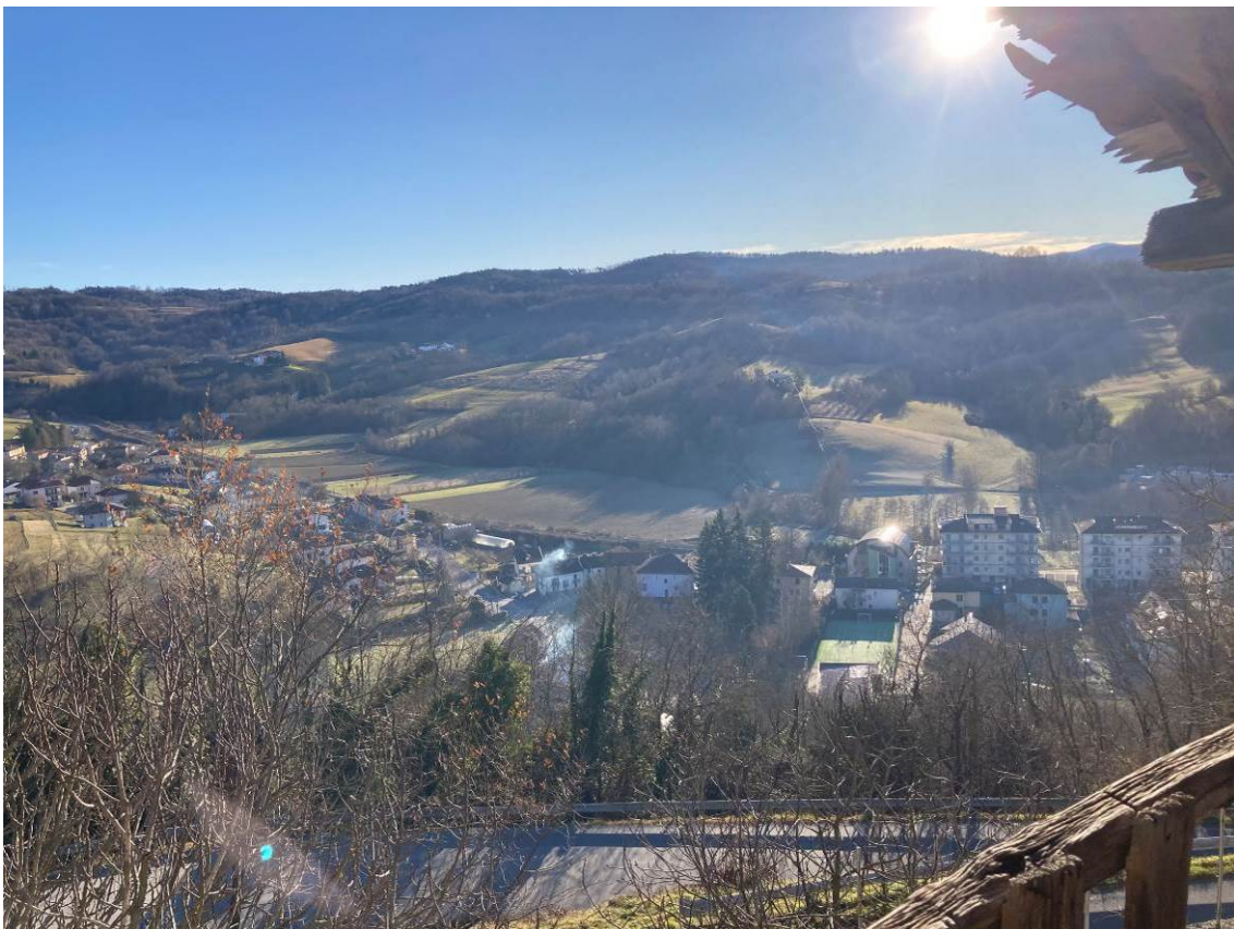
Fig. 35 – Vista della veduta panoramica dal terrazzo dell’abitazione.