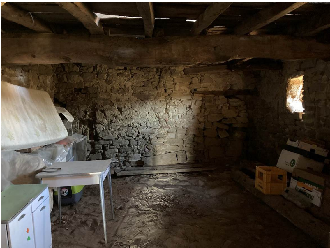
Fig. 28 – Vista di locale cantina dell'abitazione