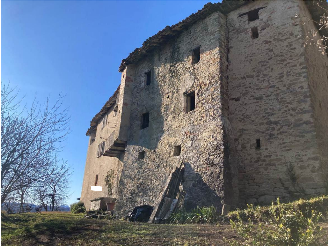
Fig. 5 – Vista esterna dell'abitazione, da valle.