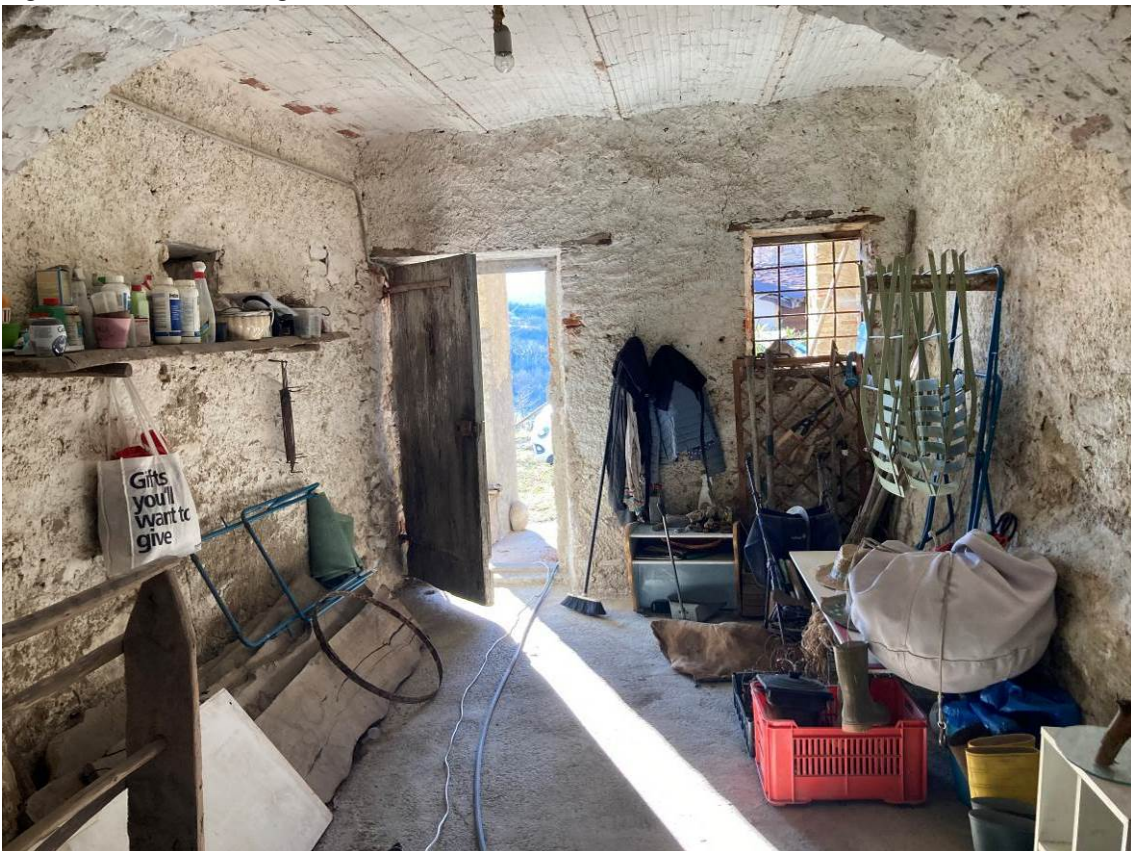
Fig. 33 – Vista di locale sgombero dell'abitazione.