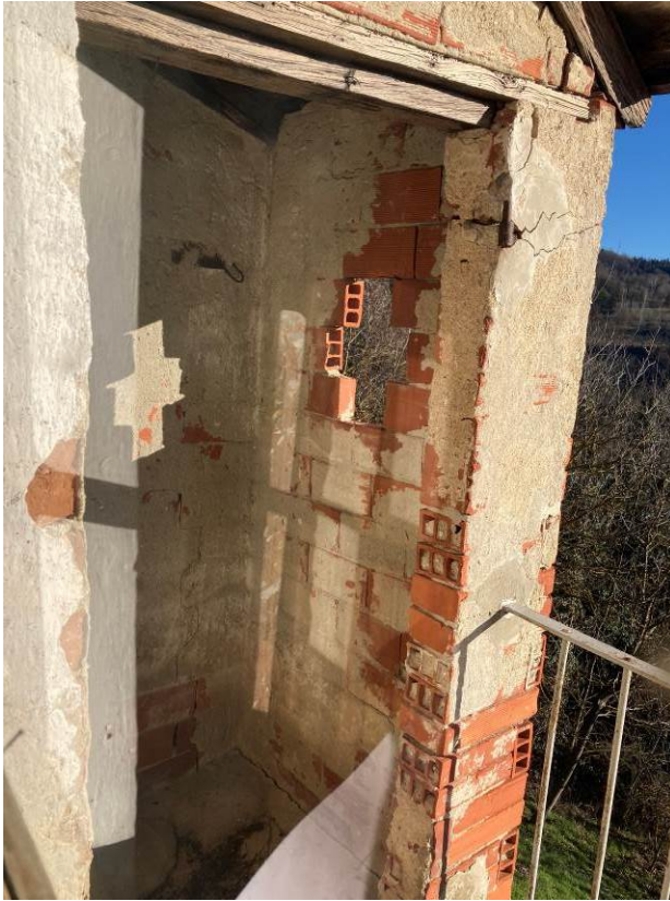
Fig. 21 – Vista del locale ex latrina esterna al piano secondo fuori terra dell'abitazione.