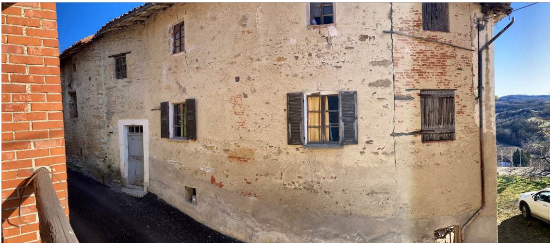
Fig. 4 – Vista esterna dell'abitazione, dal fienile del magazzino di fronte.