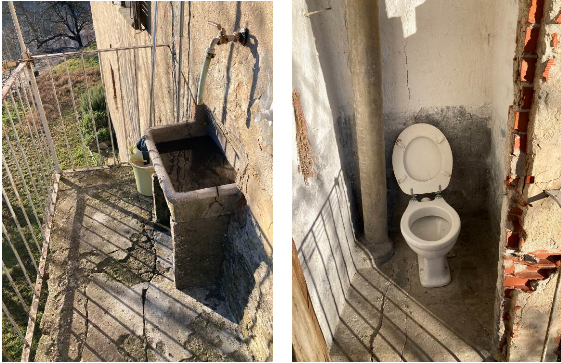
Figg. 14-15 – Vista del wc/latrina sul balcone al piano primo fuori terra dell’abitazione.