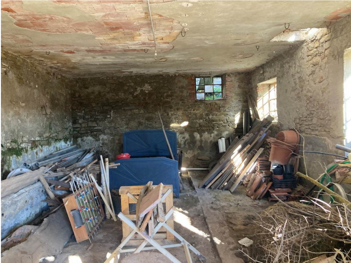
Fig. 44 – Vista interna del magazzino del fabbricato accessorio.