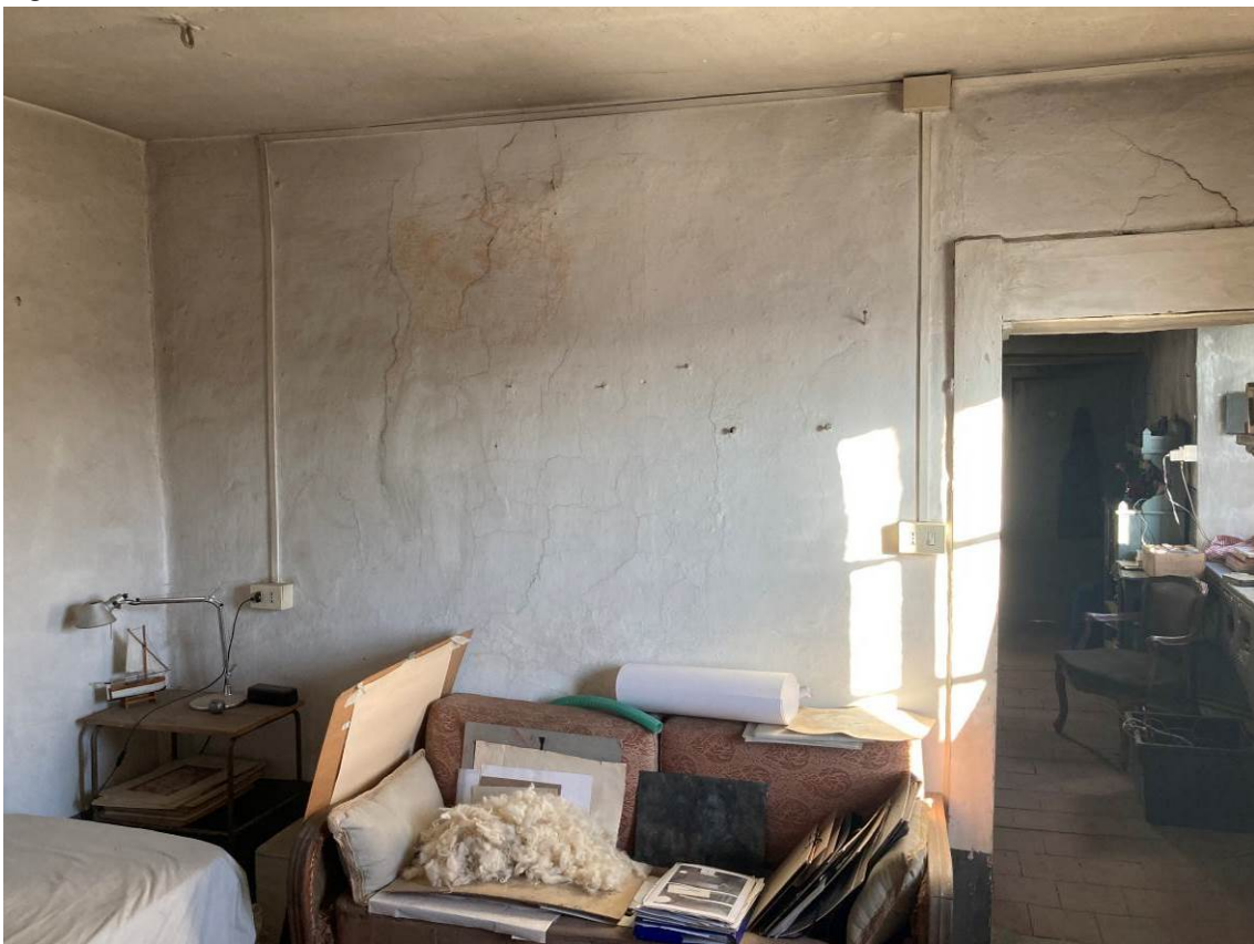
Fig. 8 – Vista interna del soggiorno dell'abitazione.