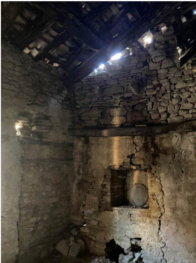
Fig. 24 – Vista interna di locale sottotetto dell’abitazione.