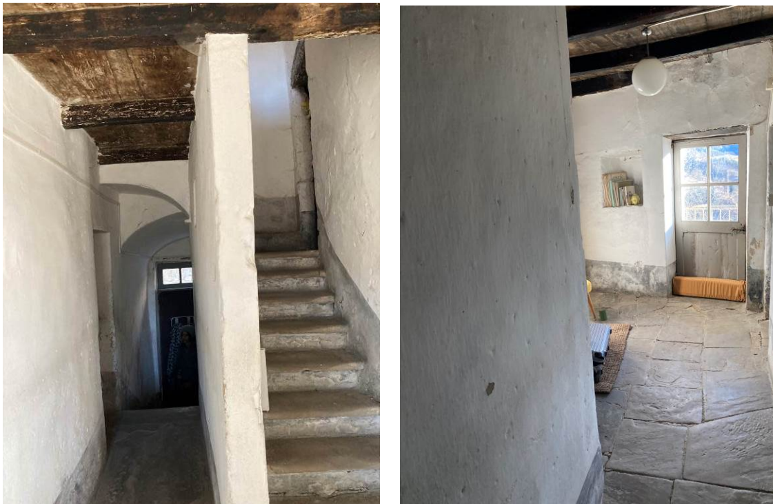
Figg. 12-13 – Vista interna del disimpegno al piano primo fuori terra dell’abitazione.