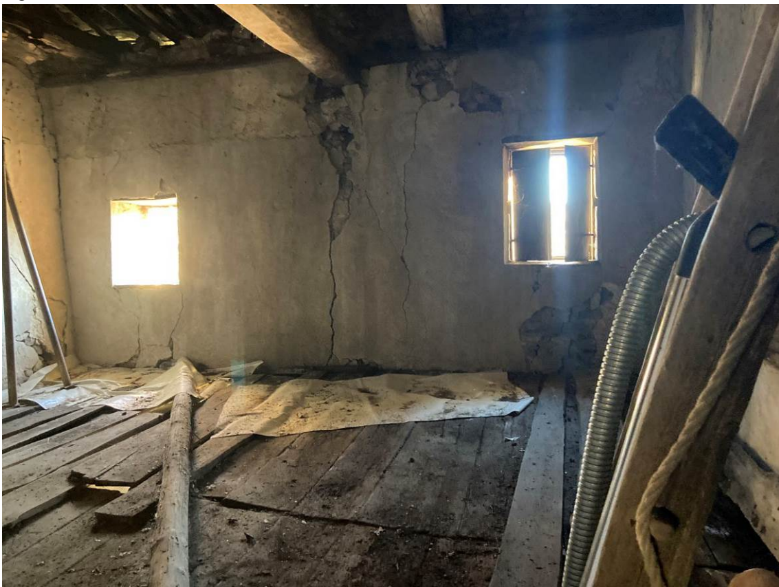
Fig. 26 – Vista di locale sottotetto dell'abitazione.