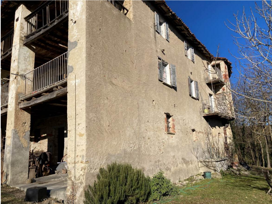
Fig. 7 – Vista esterna dell'abitazione, da valle.