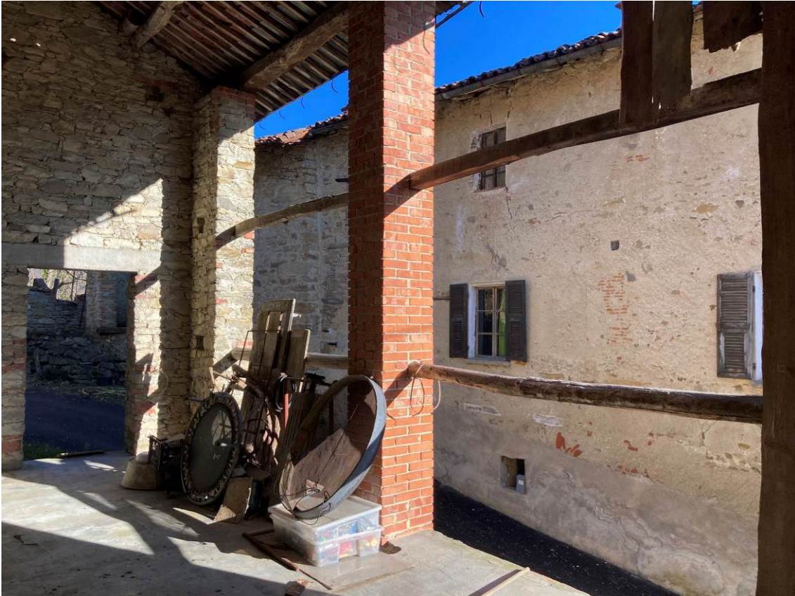
Fig. 43 – Vista interna del fienile del fabbricato accessorio.