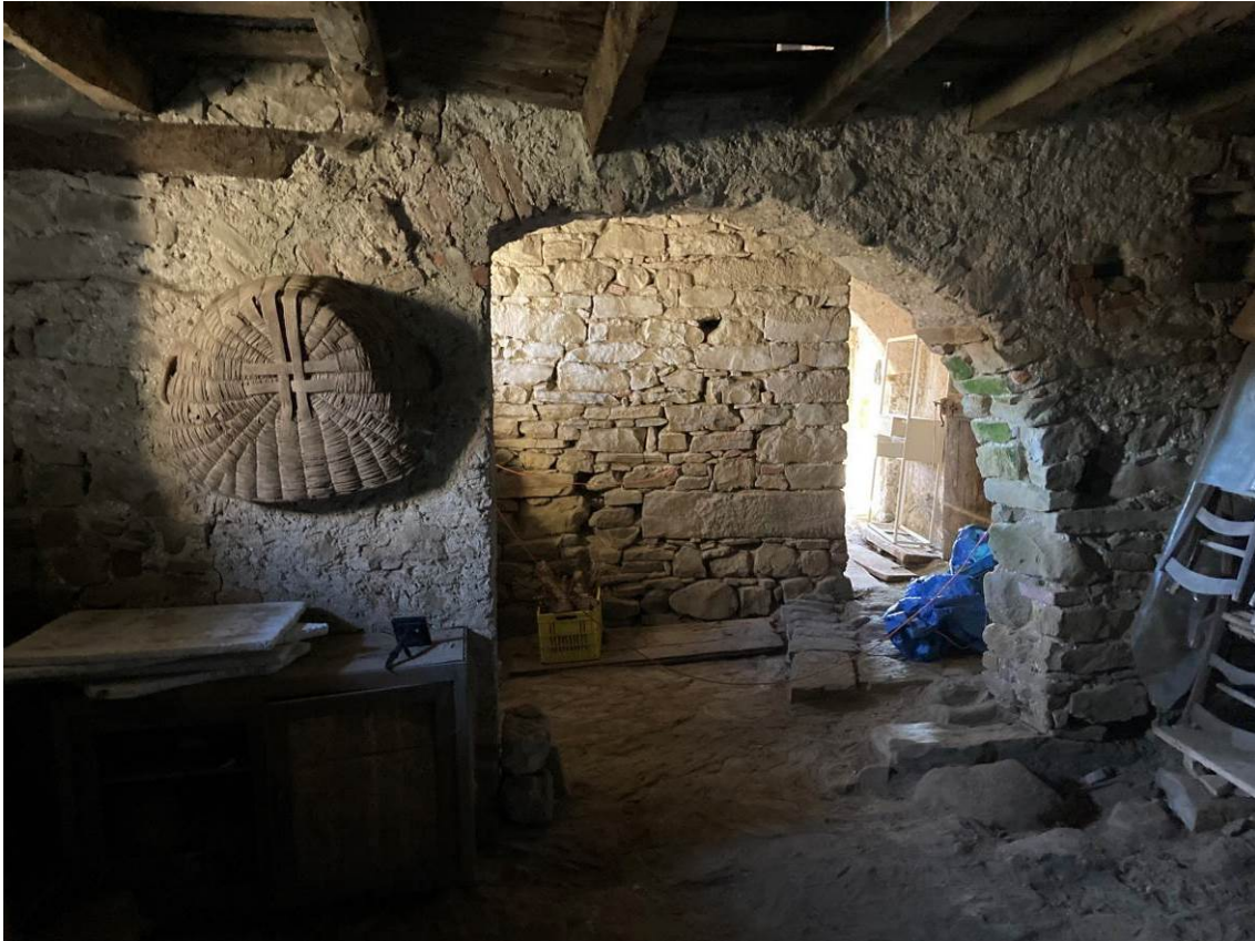
Fig. 29 – Vista di locale cantina dell’abitazione.