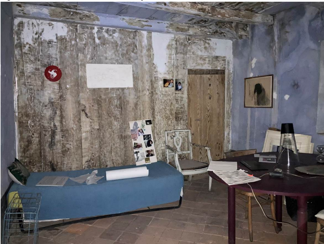
Fig. 22 – Vista di locale sgombero al piano secondo fuori terra dell'abitazione.