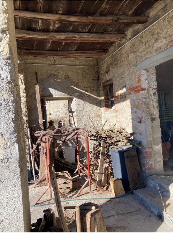
Fig. 34 – Vista del portico esterno dell’abitazione.