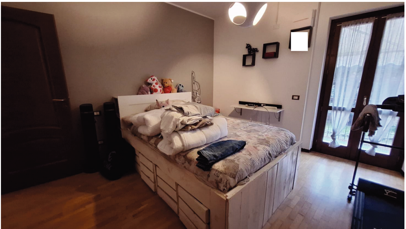
14) Camera da letto 2