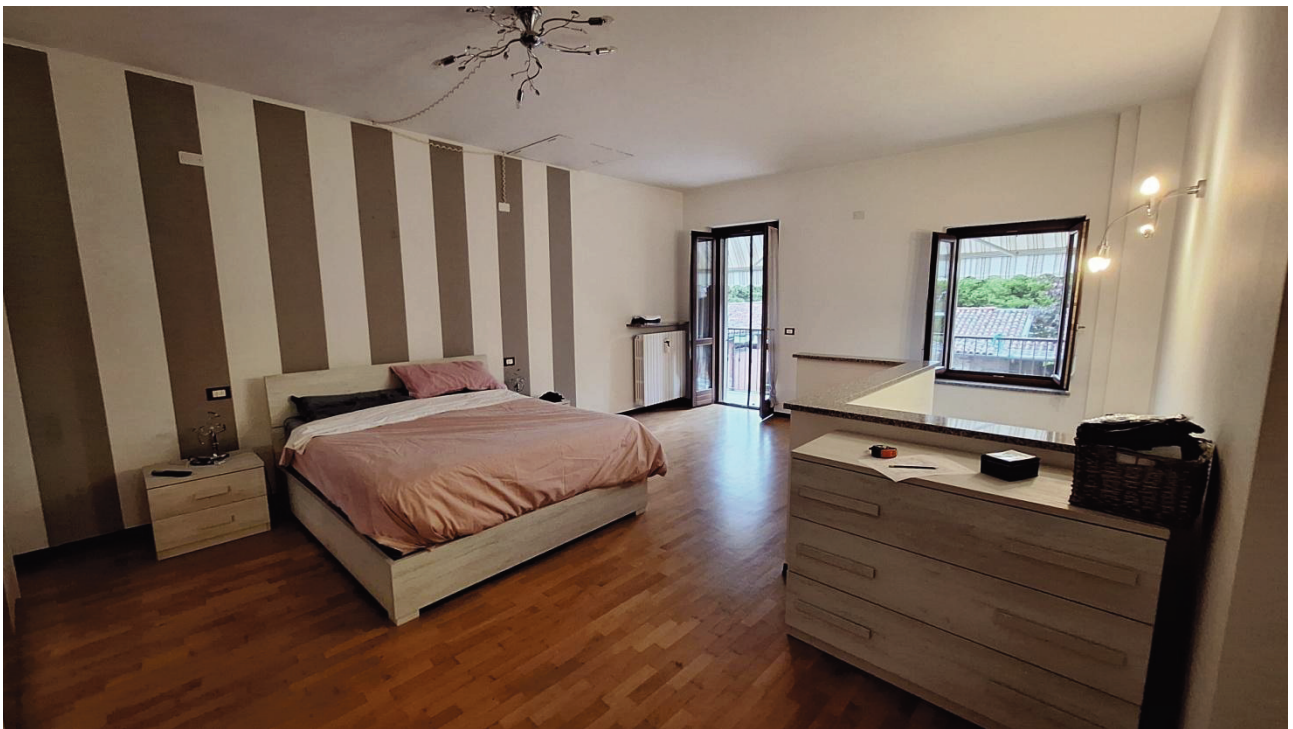
12) Camera da letto 1°P: