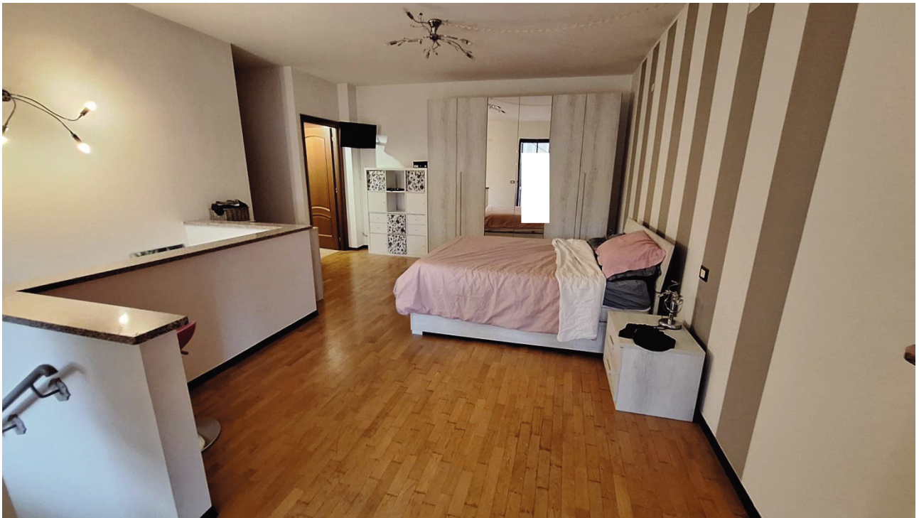
11) Camera da letto 1°P.