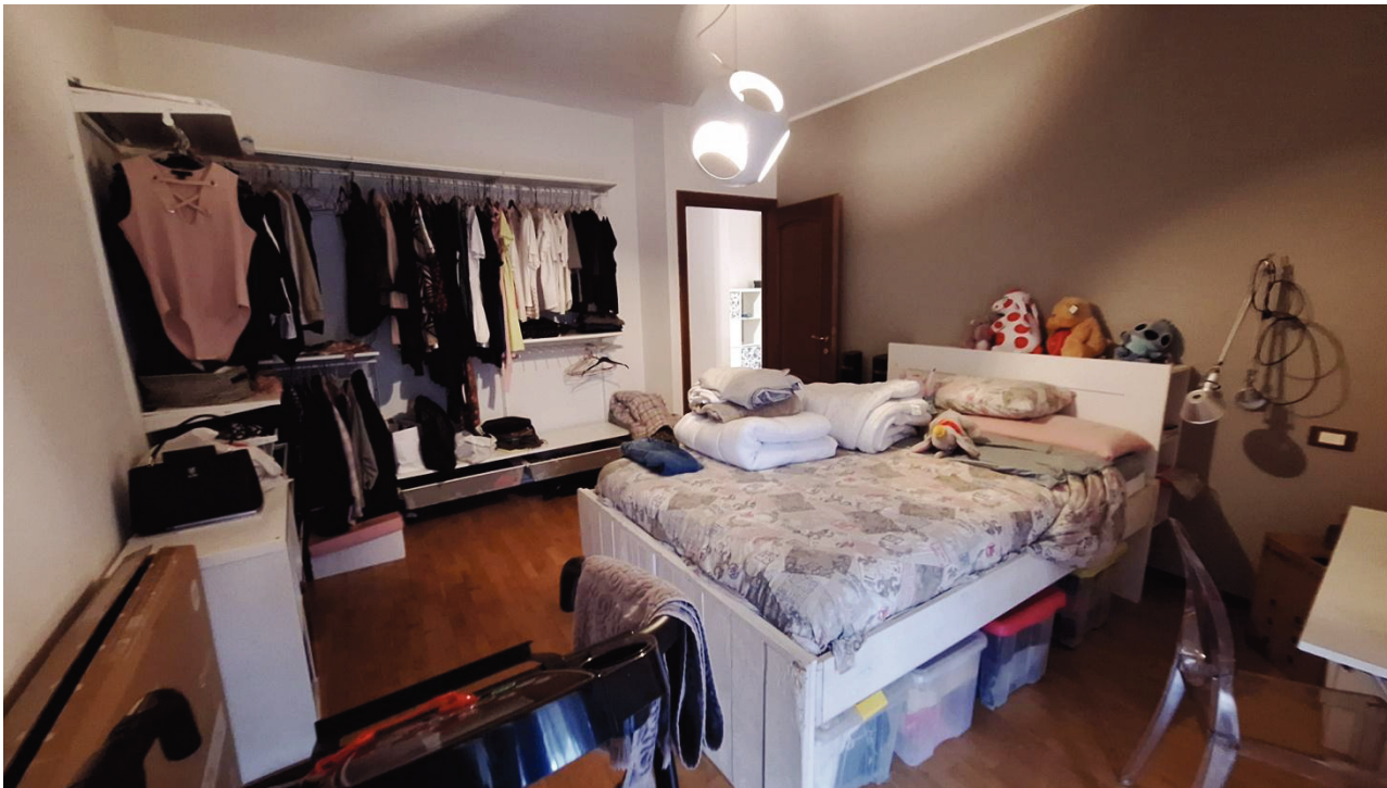
15) Camera da letto 2