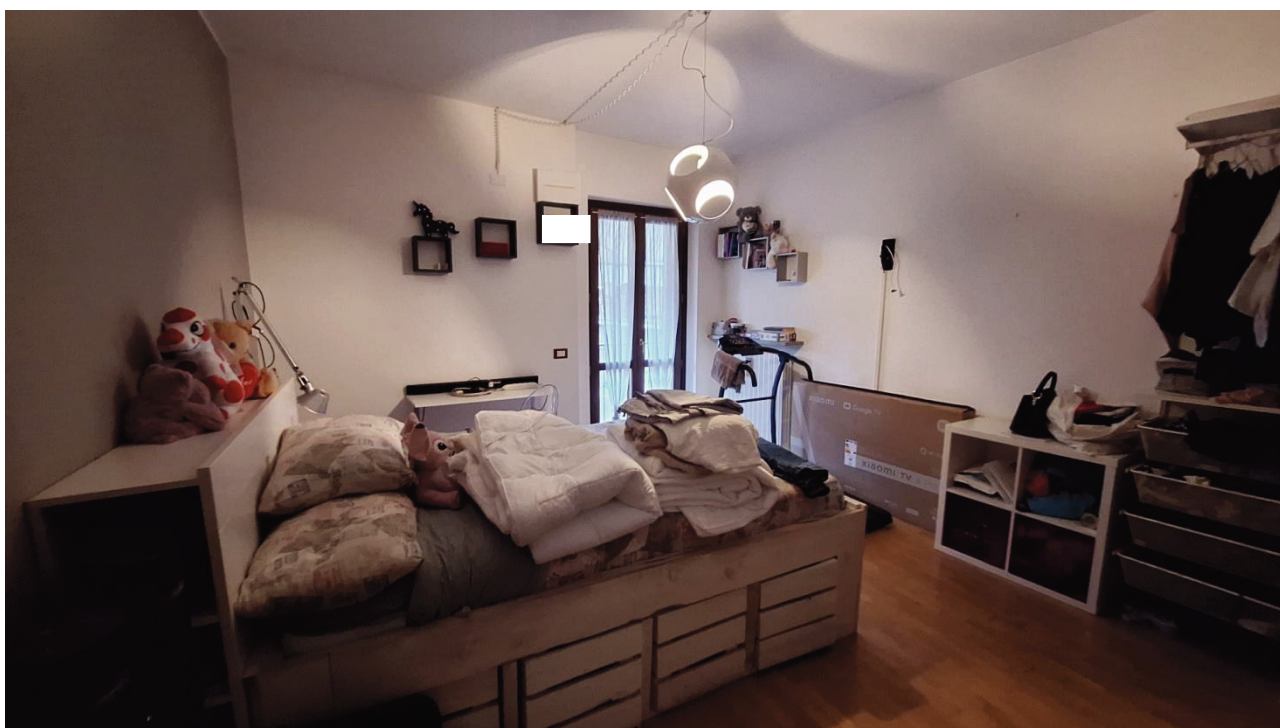
16) Camera da letto 2