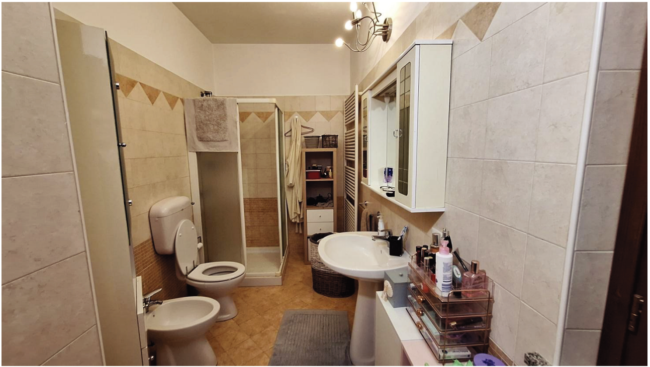
13) Bagno 1° P