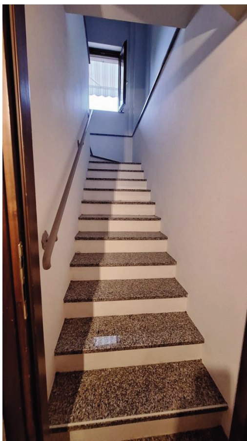
10) Scala accesso al 1°P.