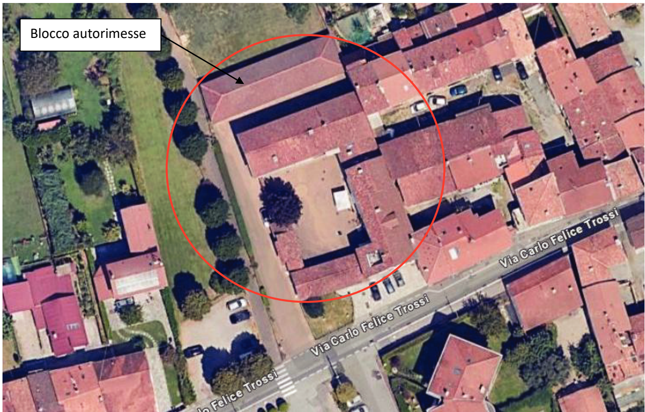
1) Ortofoto con posizione immobile via Felice Carlo Trossi Gaglianico