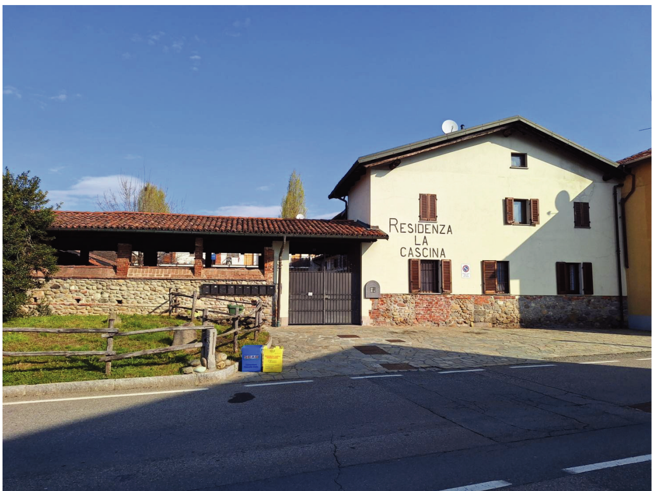
2) Ingresso al complesso immobiliare