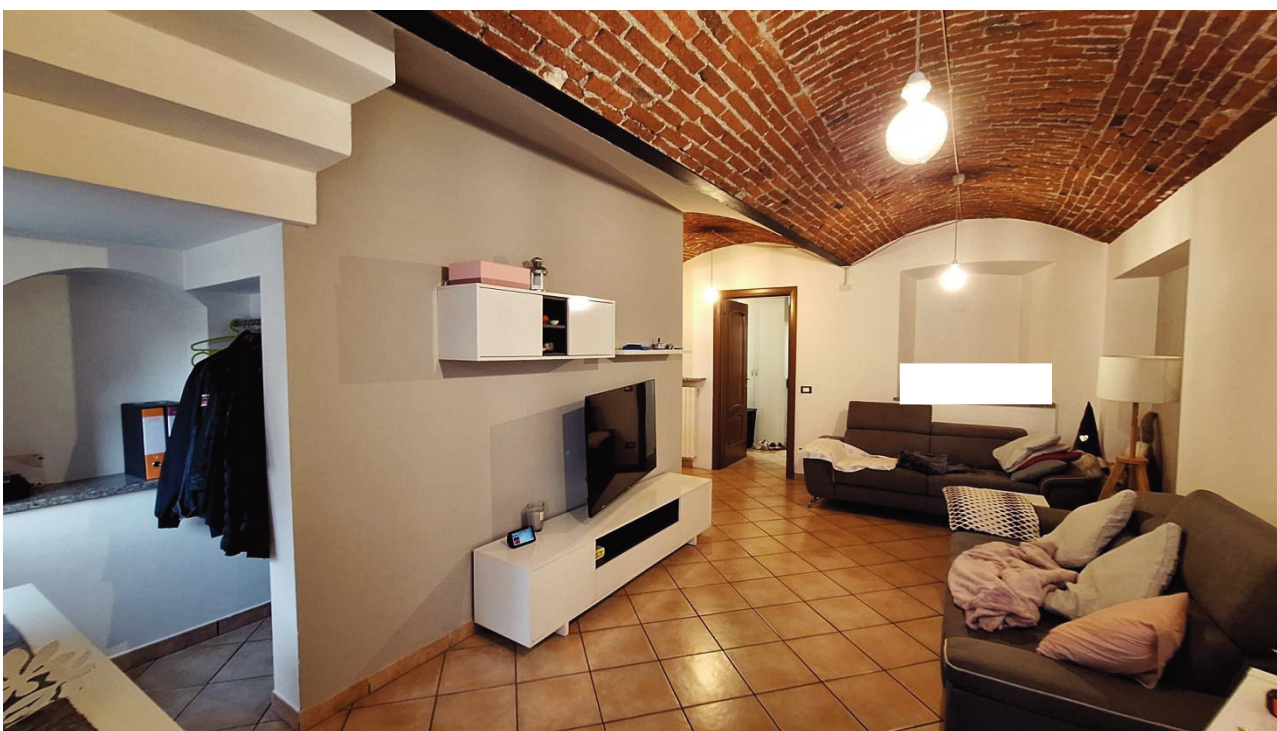
4) Ingresso – soggiorno