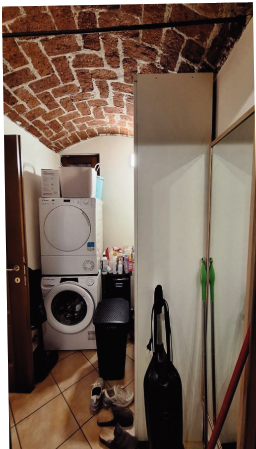
9) Antibagno a P.T. con lavanderia