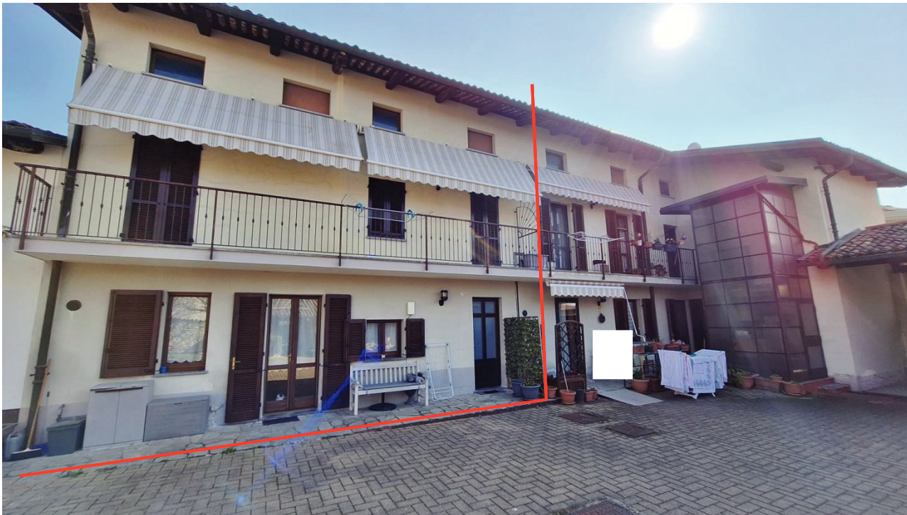
3) Vista facciata ovest