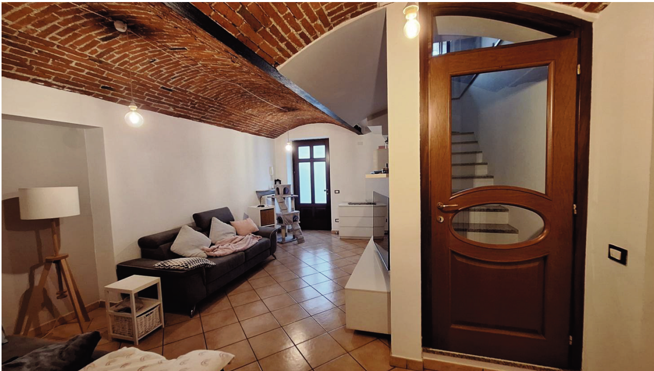
5) Soggiorno con scala accesso al 1°P.