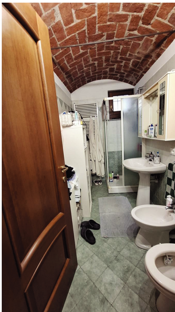
8) Bagno al P.T.