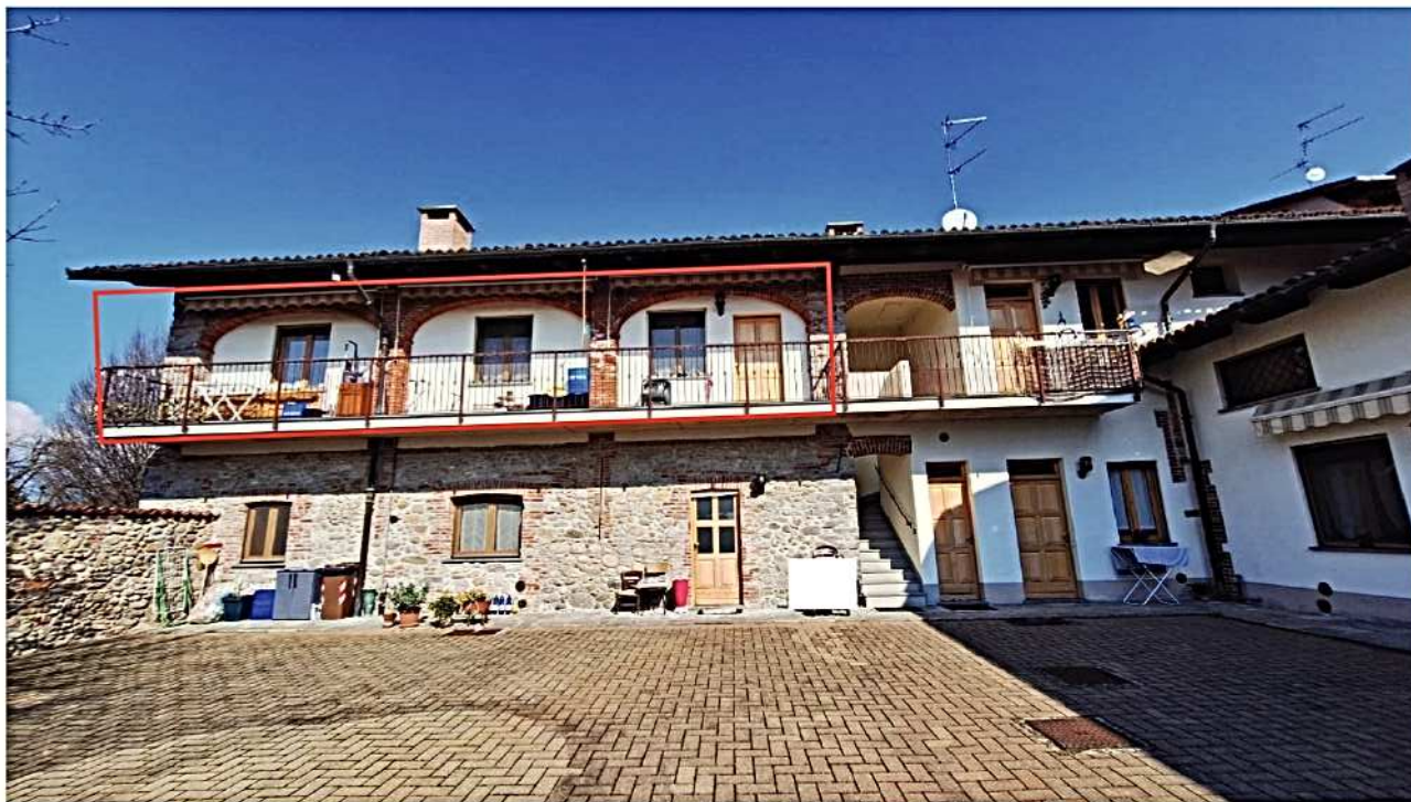
3) Vista alloggio 1° P. lato sud