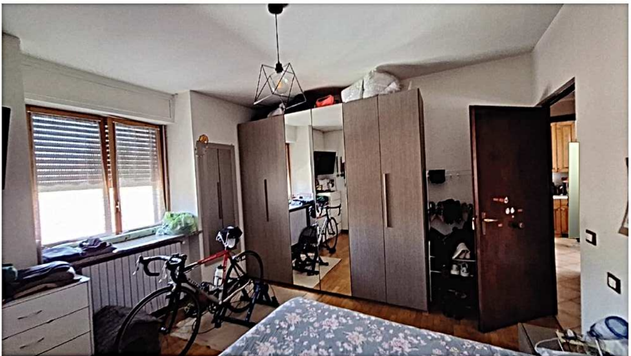
12) Camera matrimoniale