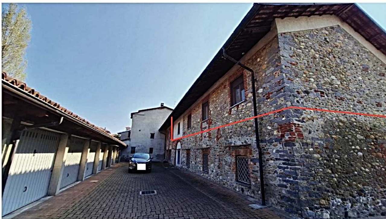
4) Vista alloggio 1° P. lati nord ed ovest