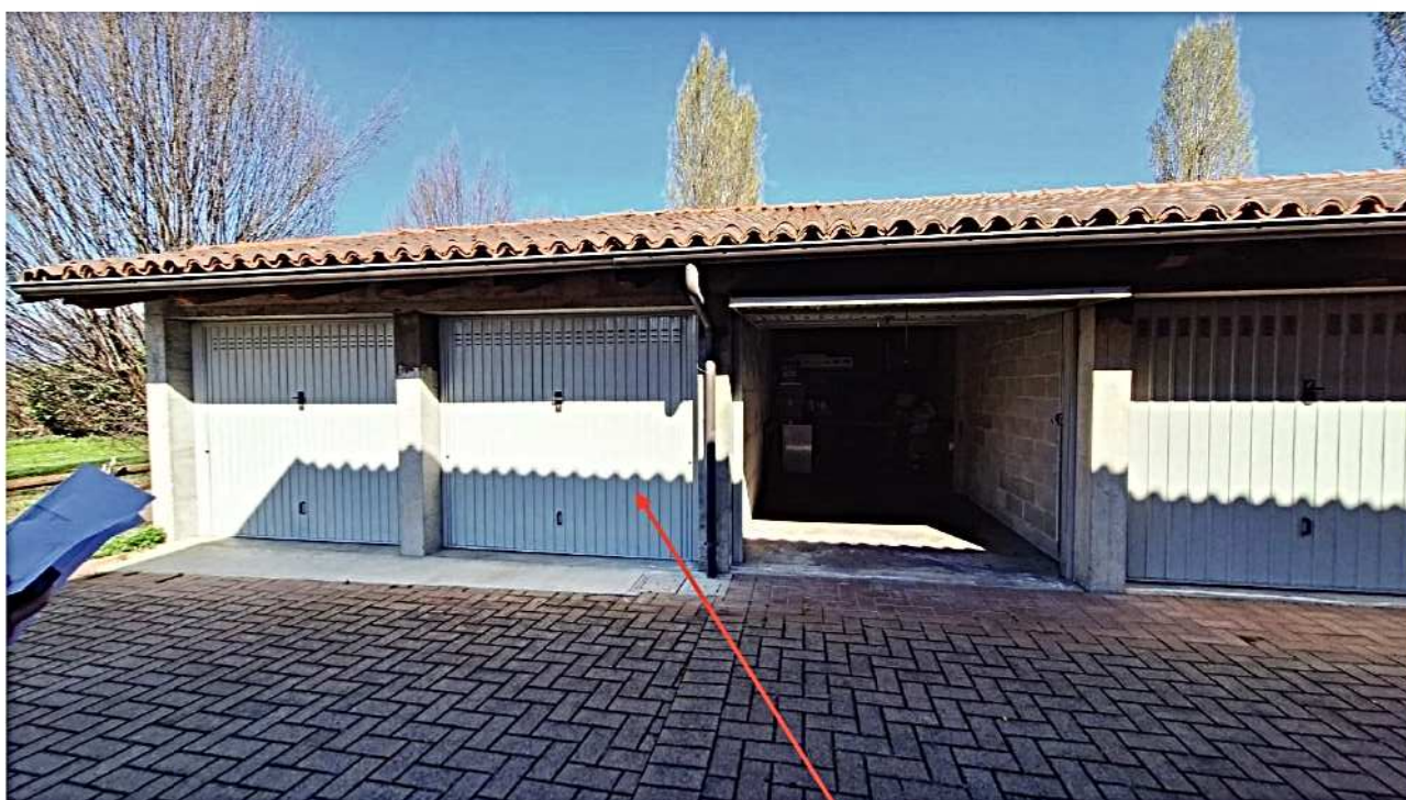
18) Autorimessa sub. 1-17