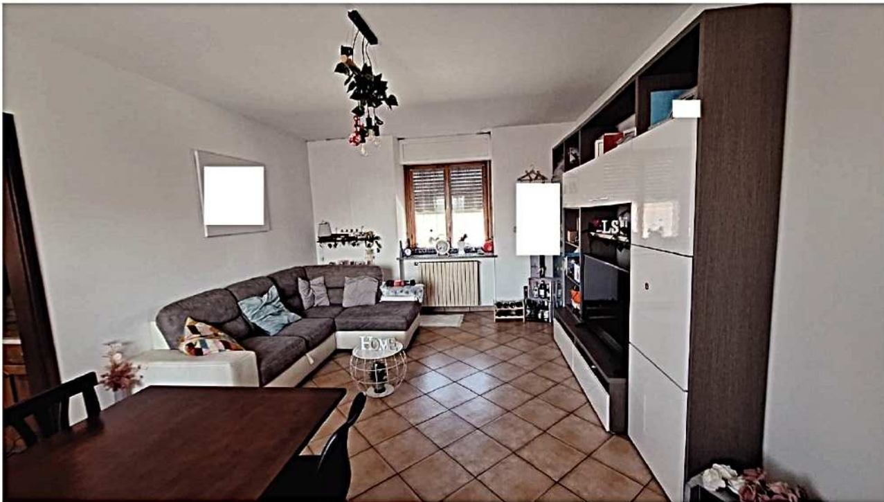
5) Vista ingresso – soggiorno - pranzo