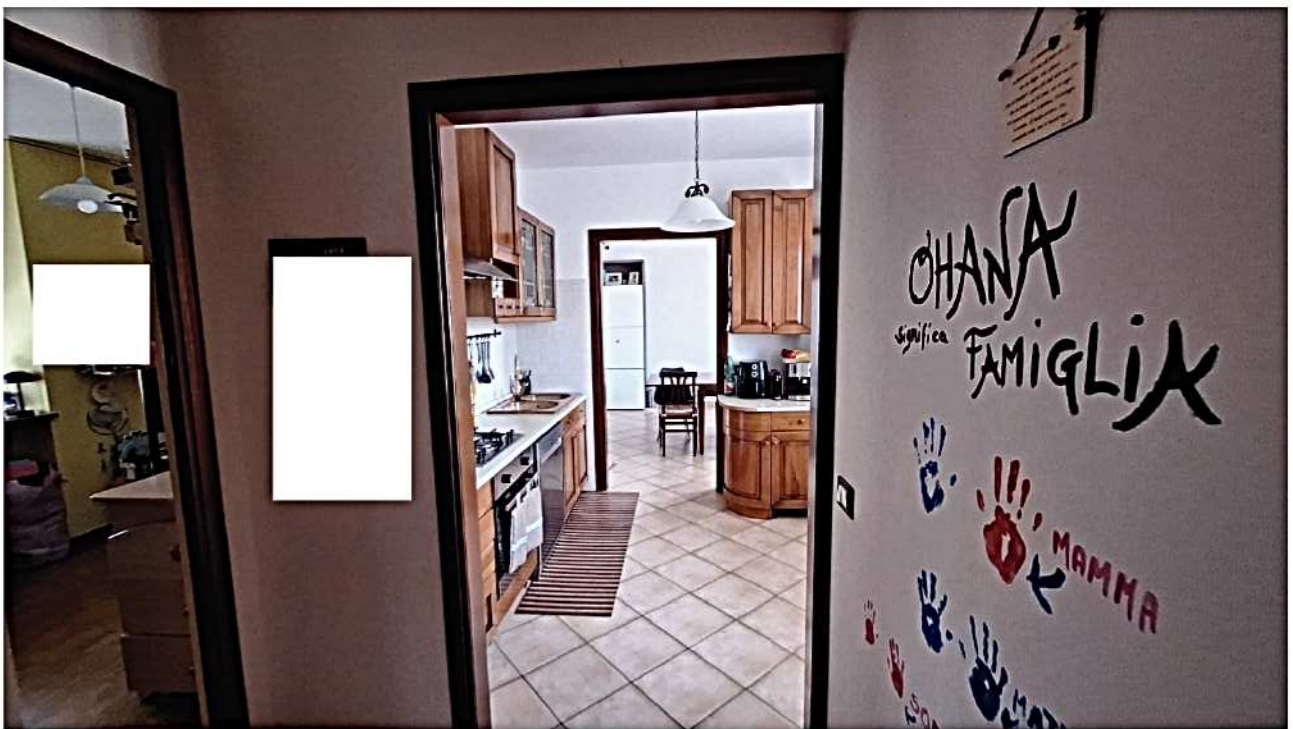
10) Cucina vista da disimpegno zona notte