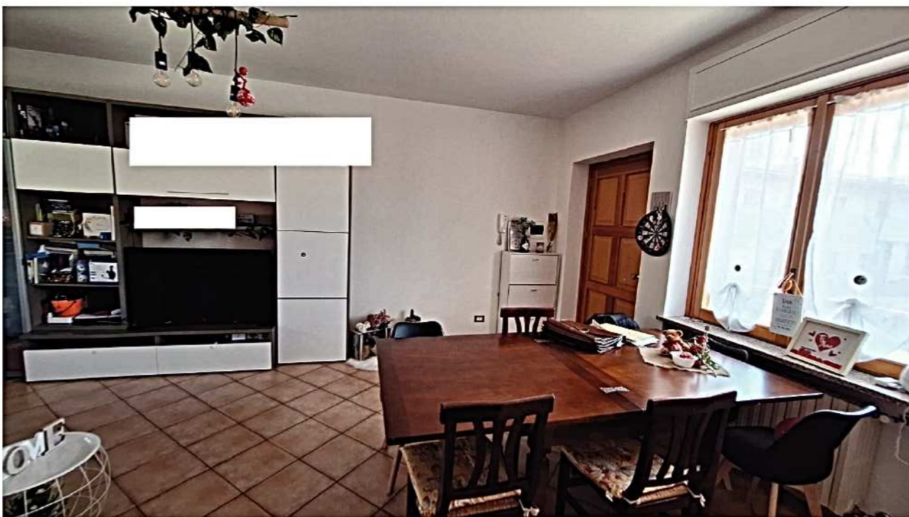
8) Vista ingresso – soggiorno - pranzo