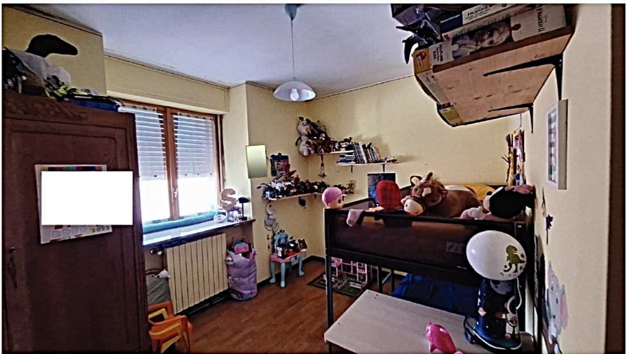
16) Camera ragazzi