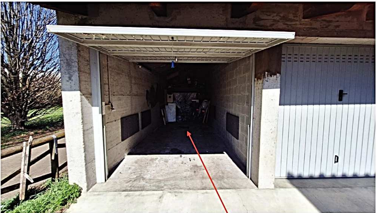
20) Autorimessa sub. 2