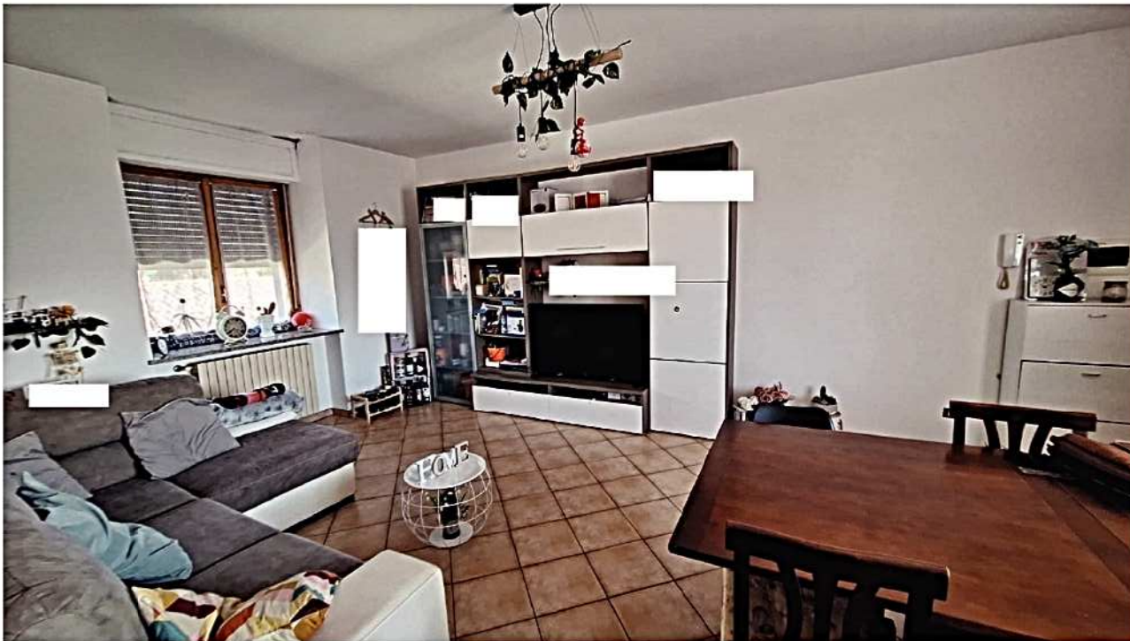
7) Vista ingresso – soggiorno - pranzo