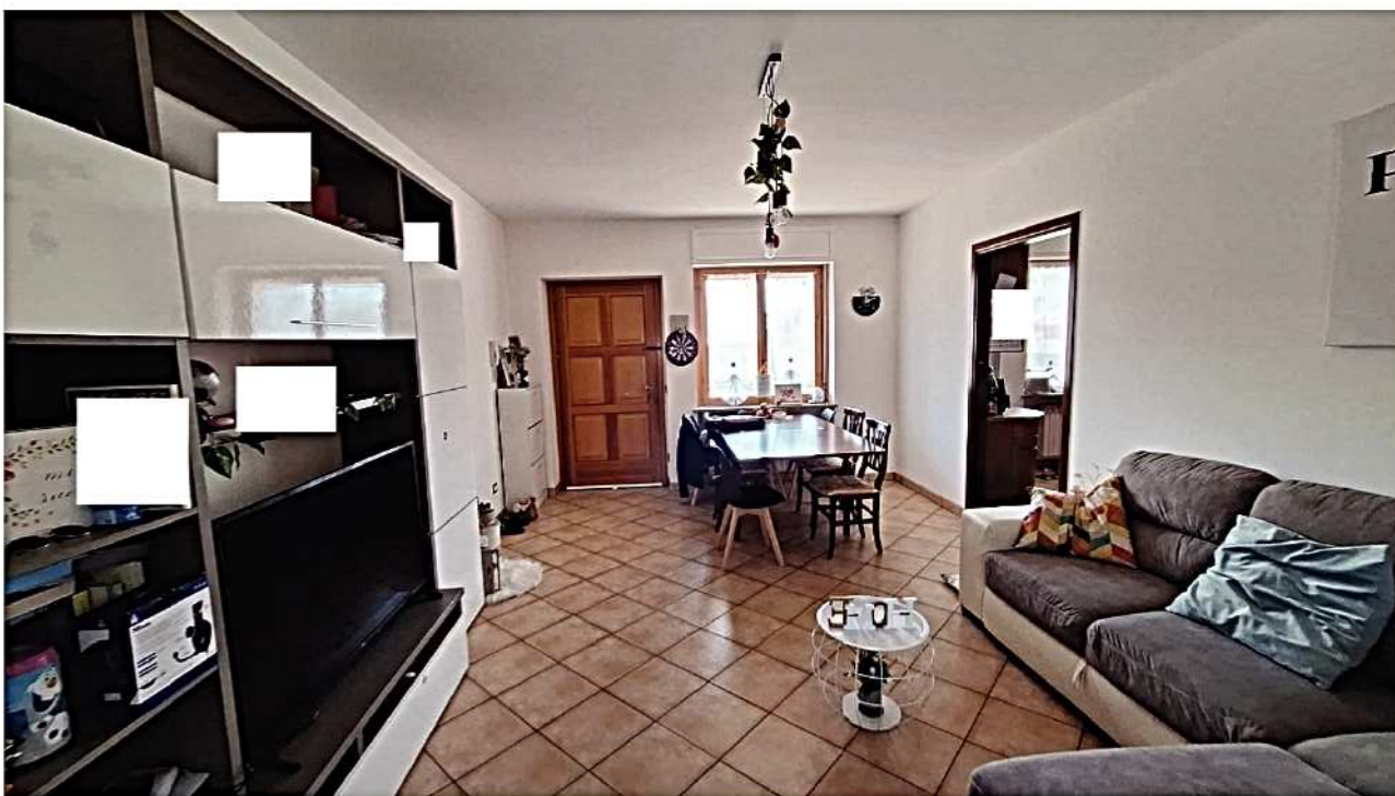
6) Vista ingresso – soggiorno - pranzo