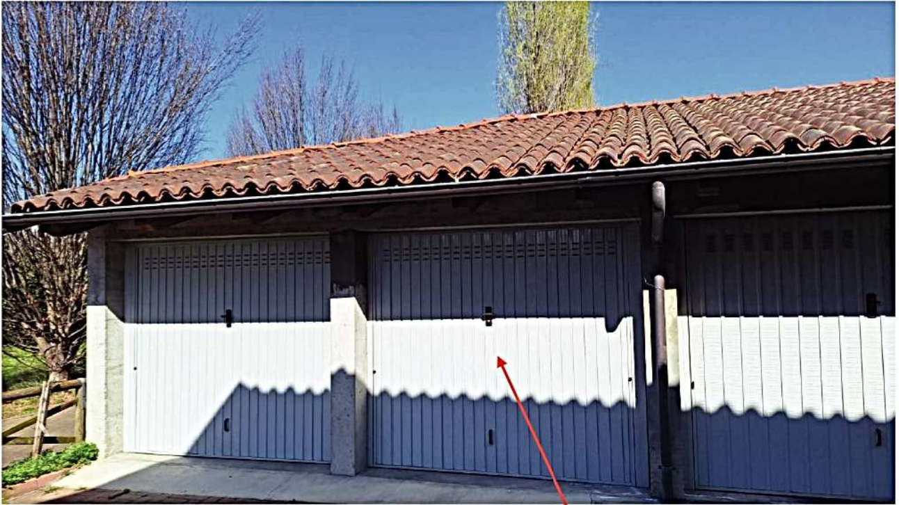
19) Autorimessa sub. 1-17