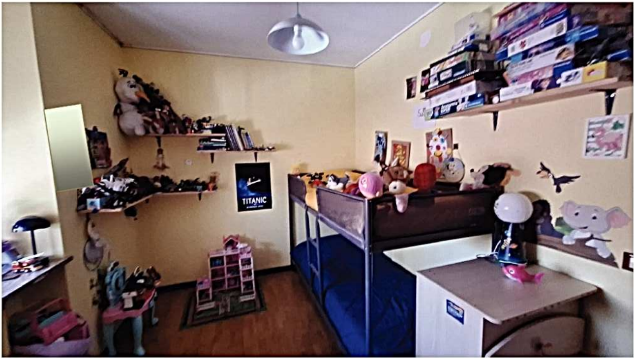
15) Camera ragazzi