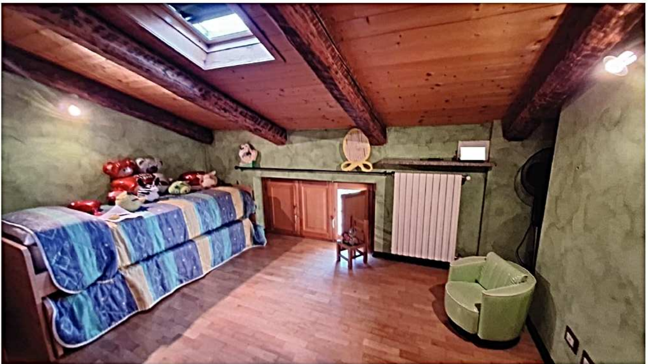
18) Camera da letto