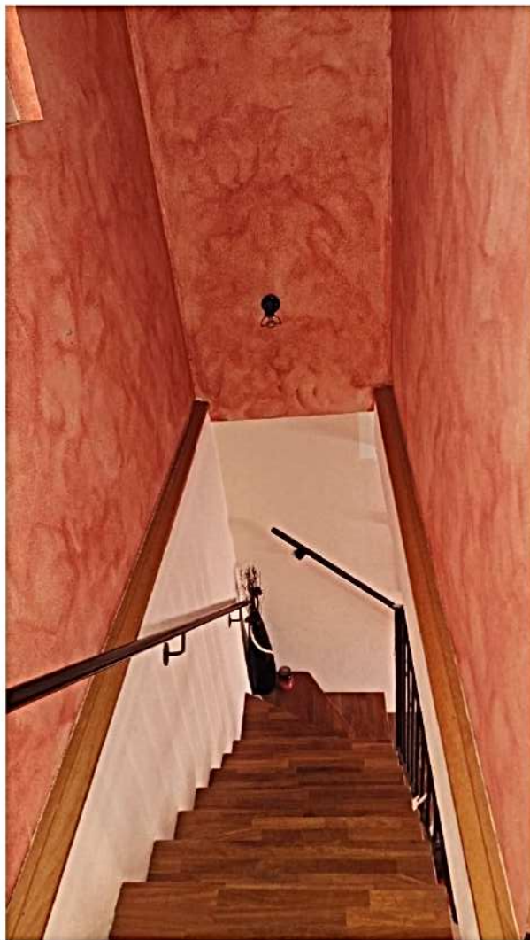
13) Scala accesso 1°P