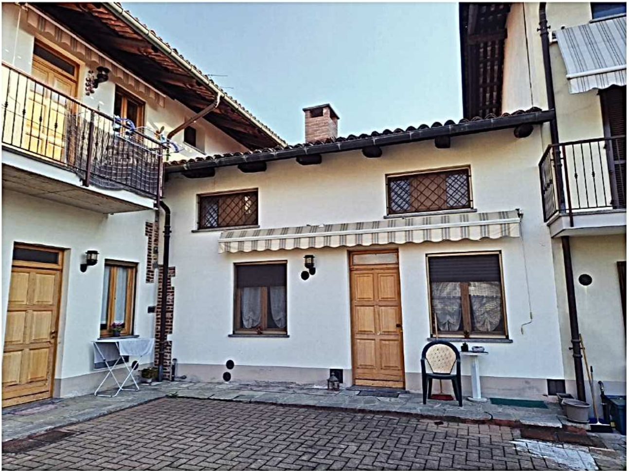
3) Vista unità immobiliare lato ovest