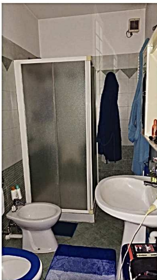
8) Bagno a P.T.