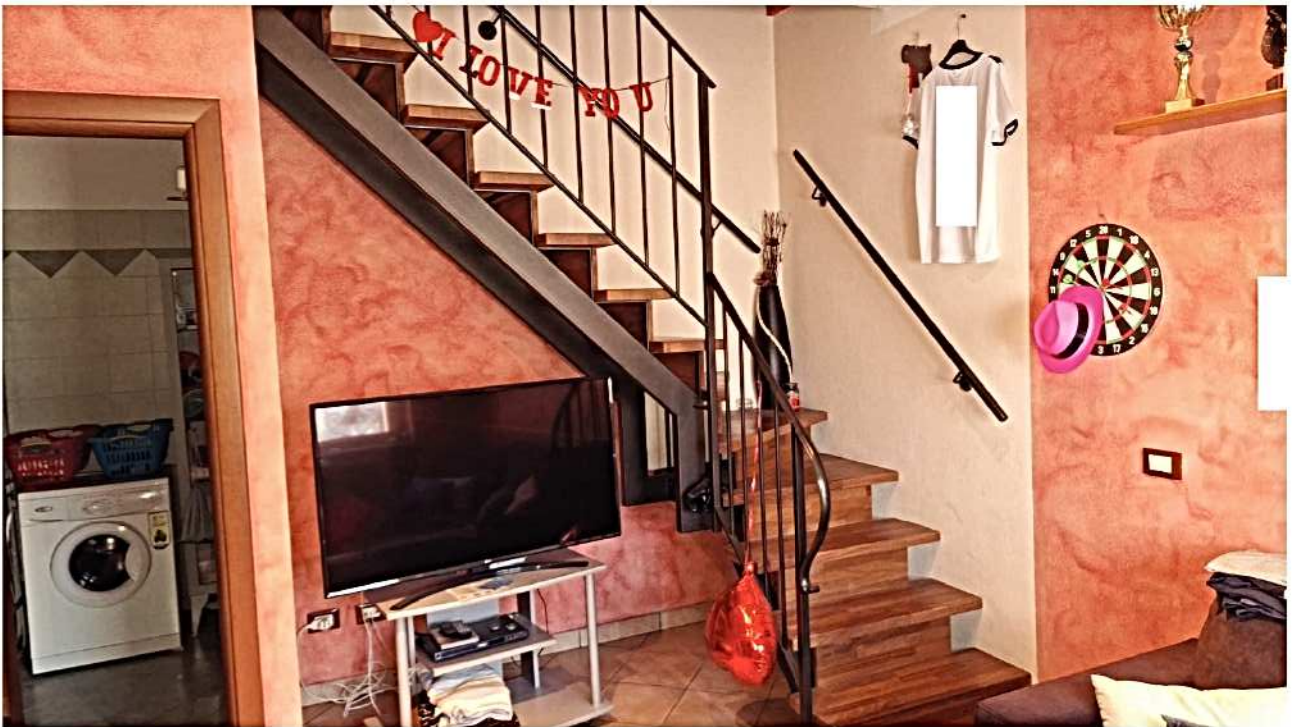
6) Soggiorno ingresso scala di accesso al 1°P.