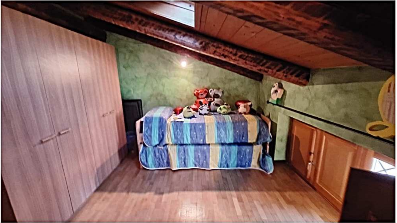
19) Camera da letto