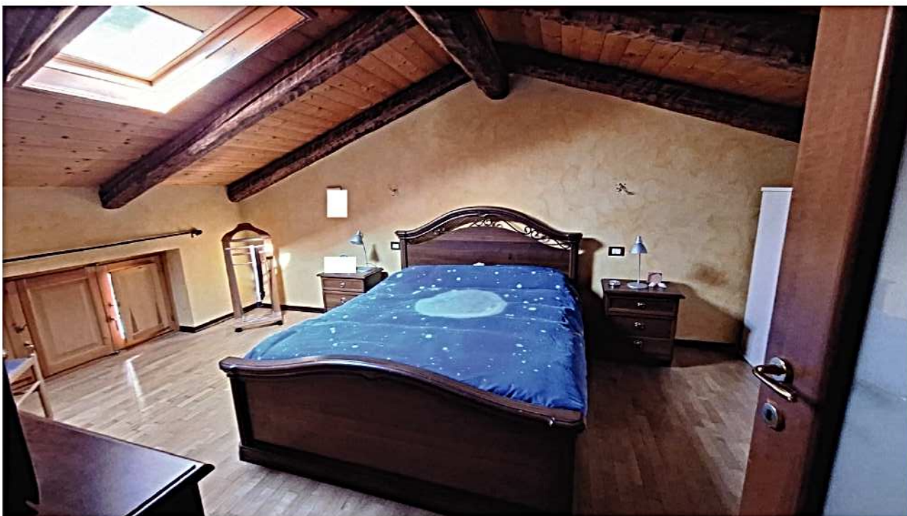
16) Camera da letto matrimoniale