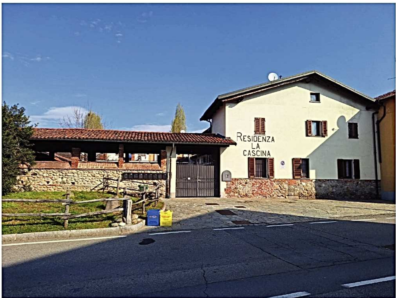
2) Ingresso al complesso immobiliare