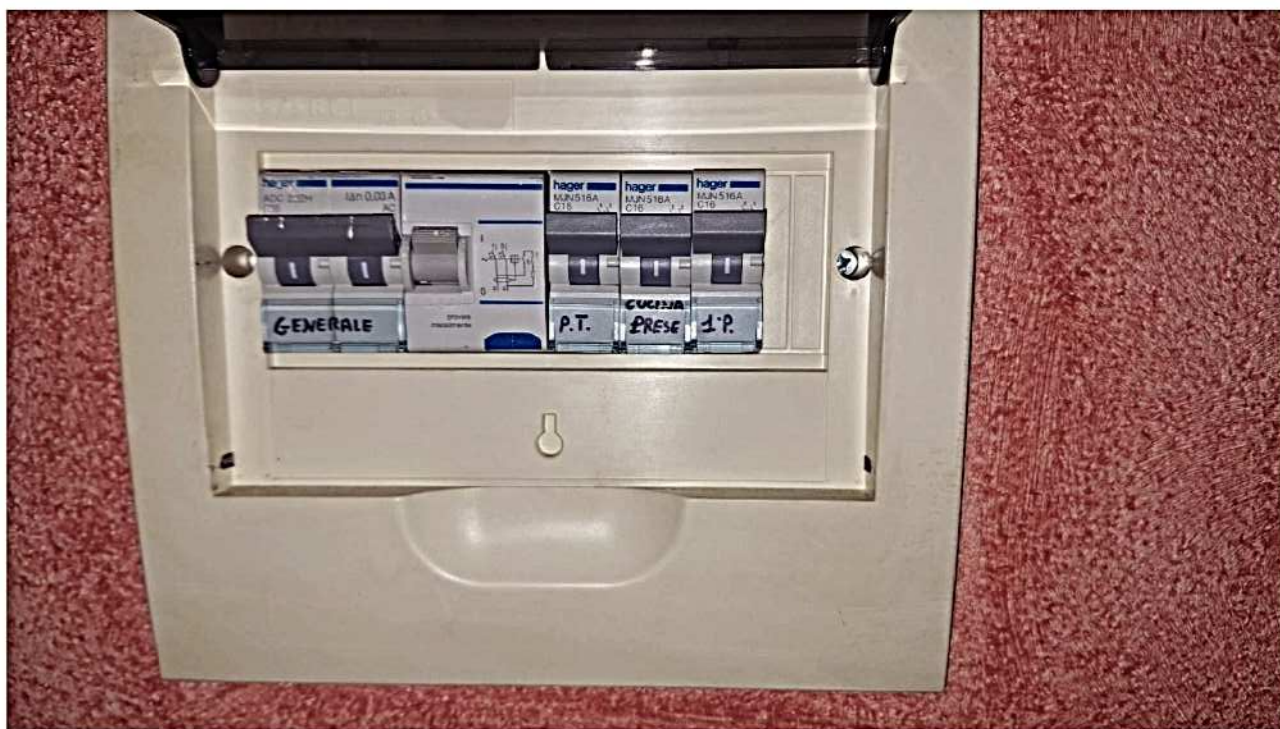
12) Quadro elettrico abitazione