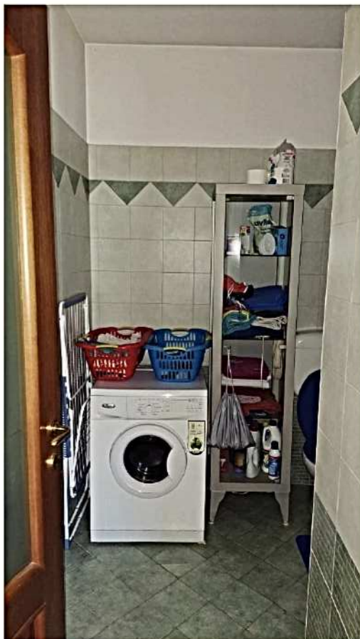
7) Bagno al P.T.