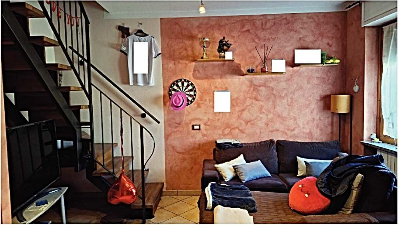
5) Soggiorno ingresso