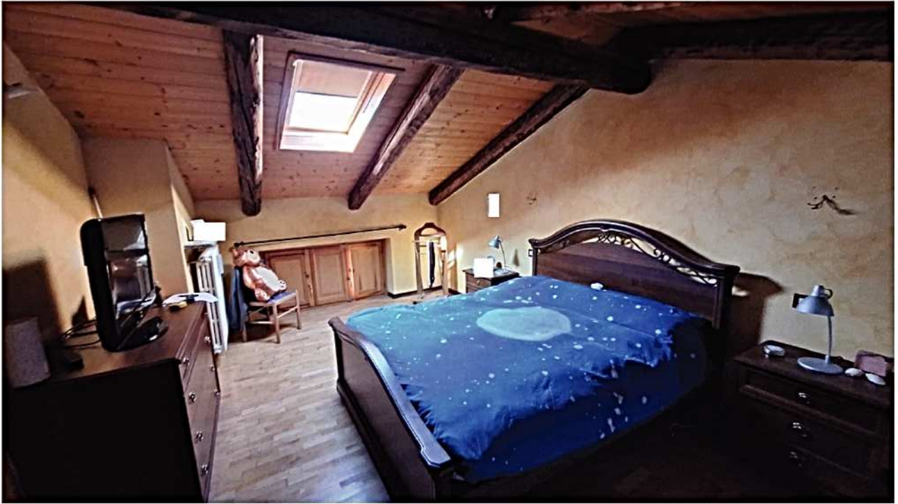
17) Camera da letto matrimoniale