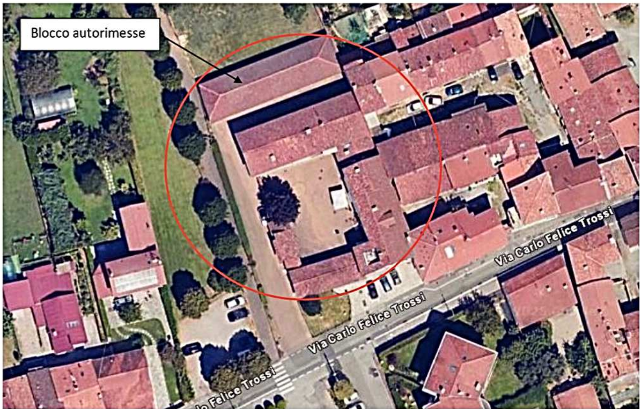
1) Ortofoto con posizione immobile via Felice Carlo Trossi Gaglianico