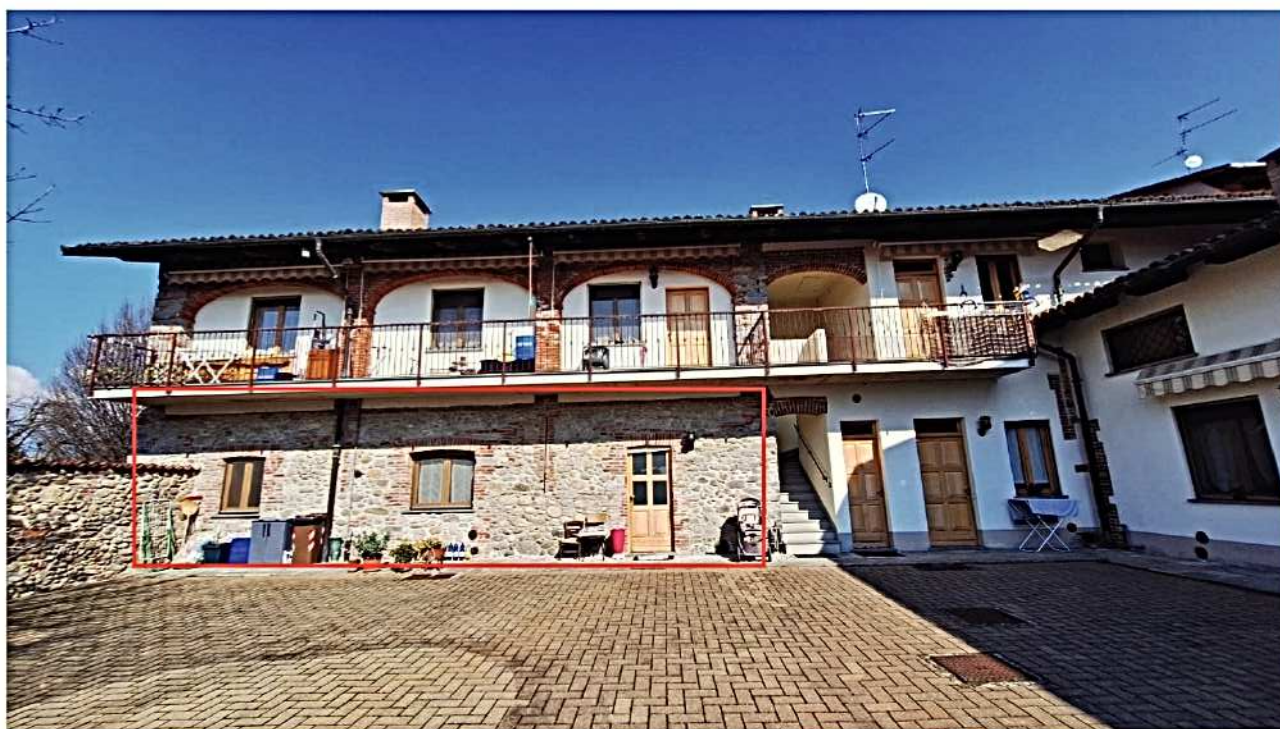
3) Facciata lato sud