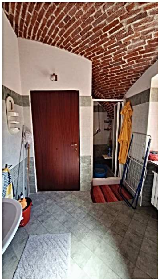
16) Bagno vista porta ingresso