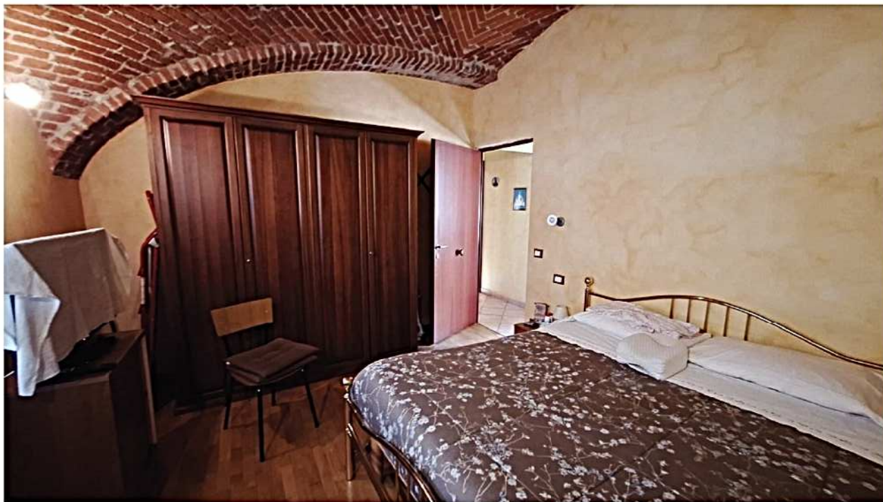
14) Camera matrimoniale