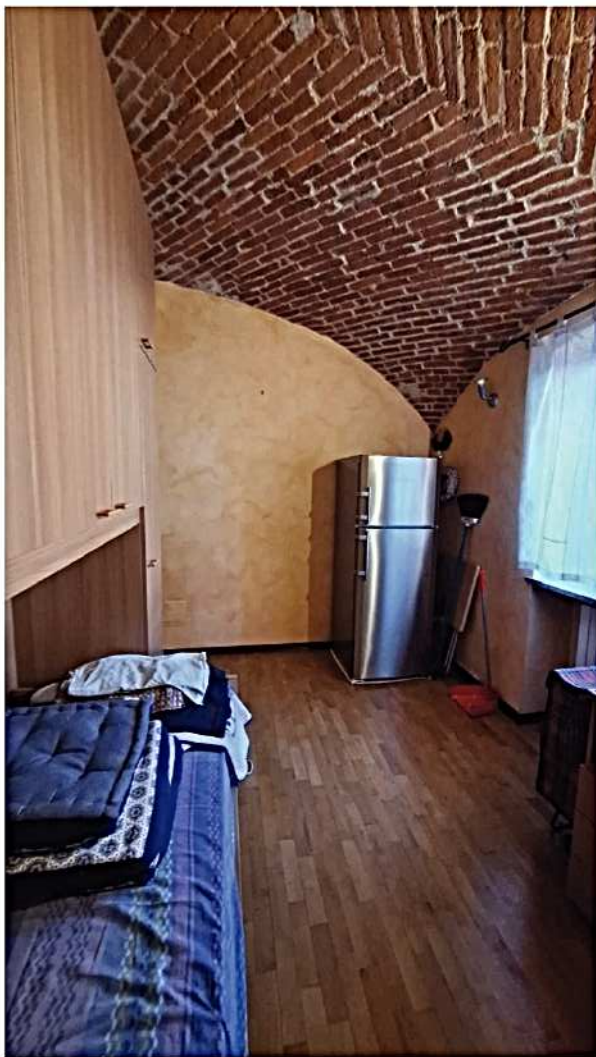
11) Camera da letto singola