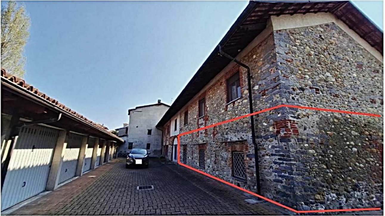
5) Facciate nord ed ovest