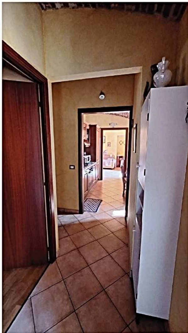
12) Disimpegno zona notte