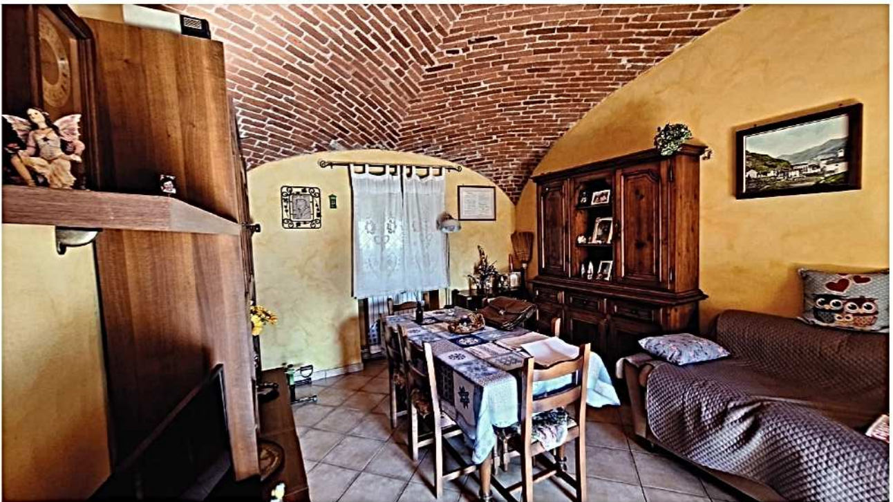
6) Ingresso su soggiorno