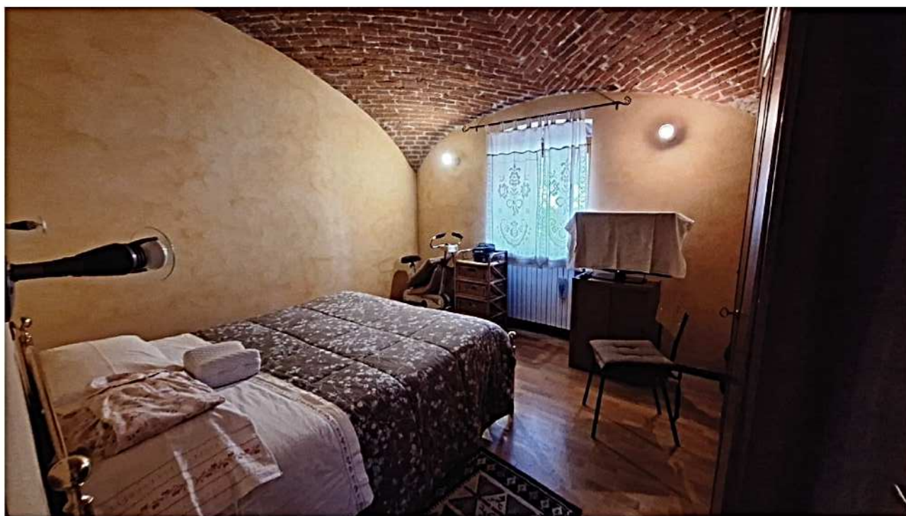
13) Camera matrimoniale