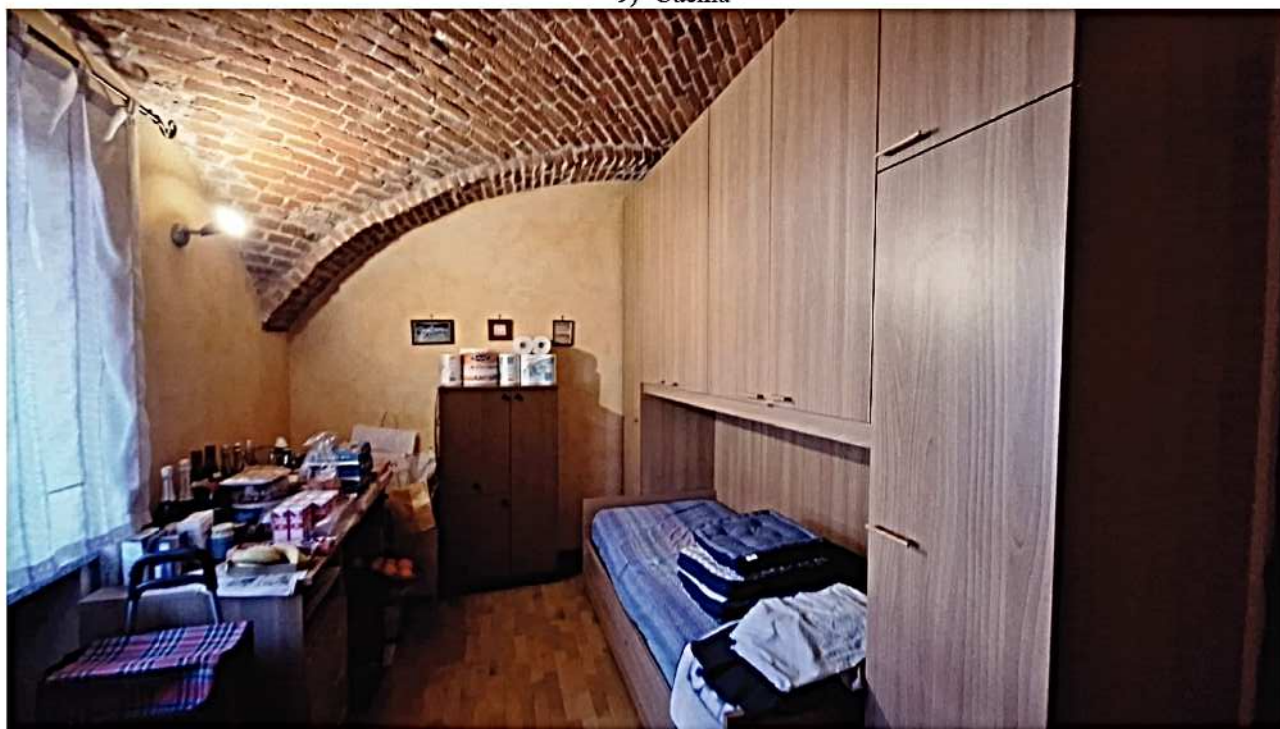
10) Camera da letto