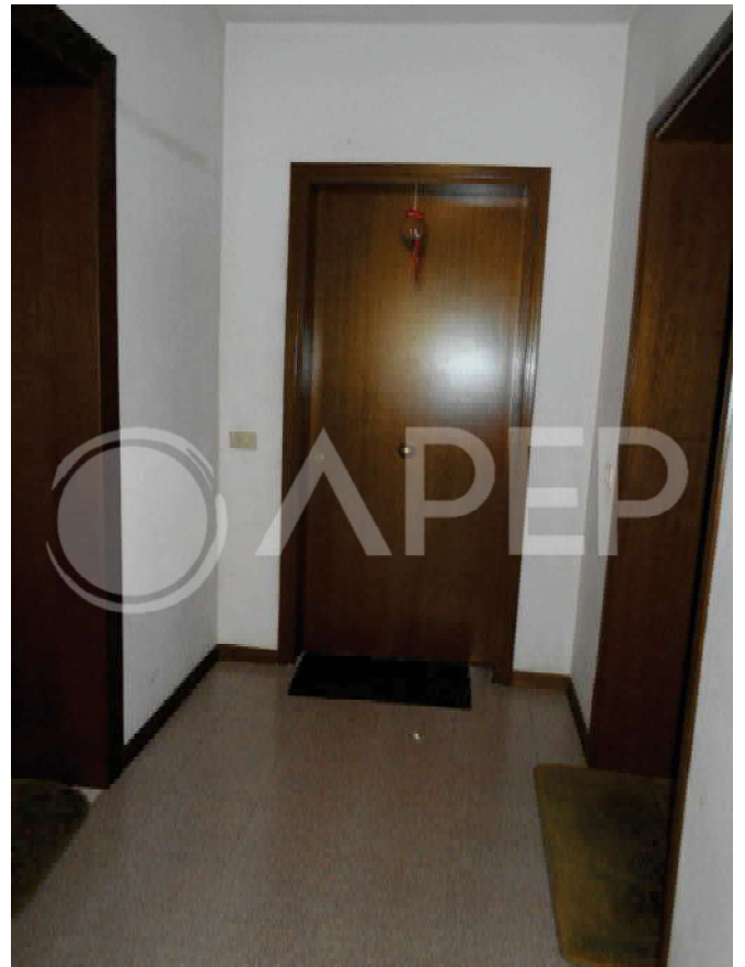
Foto 9: porta d'ingresso dell'appartamento dal corridoio condominiale