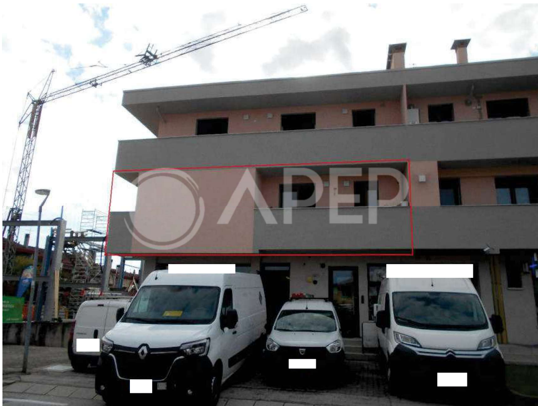
Foto 4: fabbricato condominiale, particolare facciata nord, evidenziata in rosso la porzione relativa all'appartamento pignorato