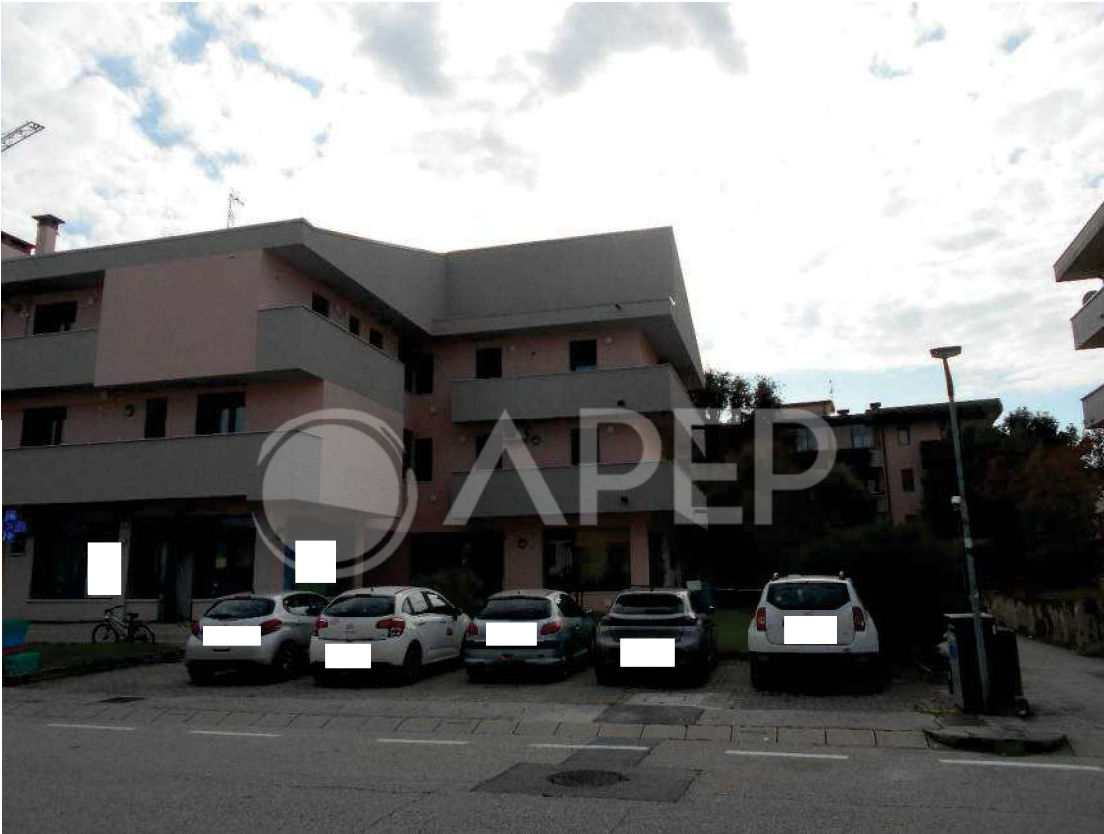
Foto 6: particolare facciata nord del fabbricato condominiale e cortile, vista da via Vivaldi