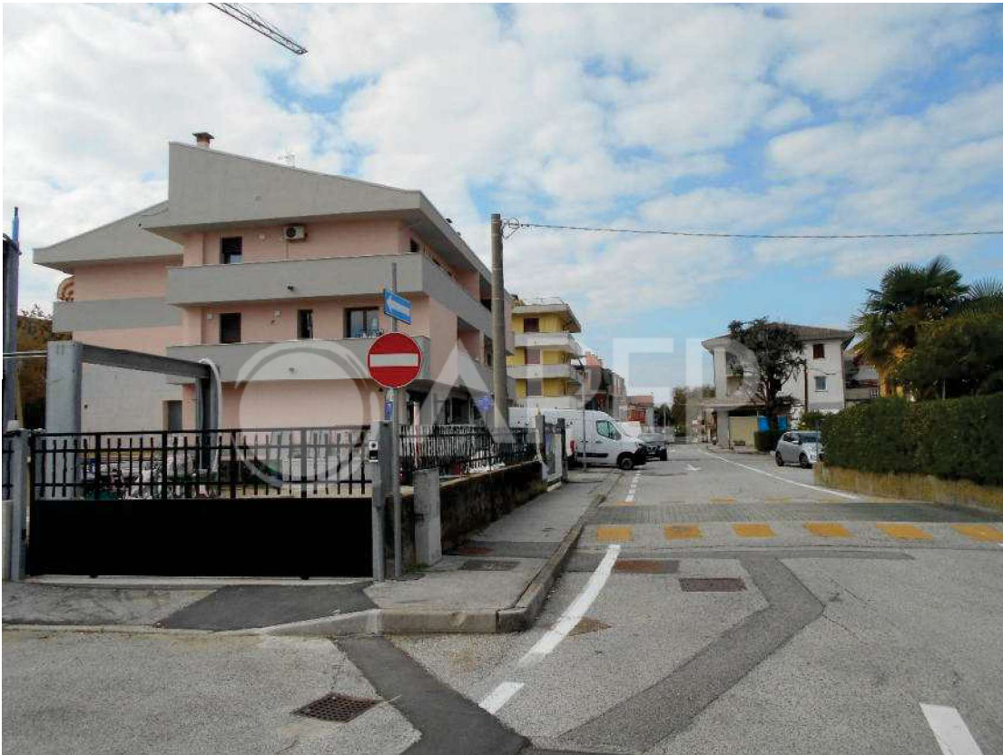
Foto 1: via Vivaldi, a sinistra il fabbricato condominiale di cui i beni fanno parte

APPARTAMENTO al piano primo e GARAGE al piano interrato, facenti parte del fabbricato condominiale denominato Condominio Elios , sito a San Giorgio in Bosco (PD), via Vivaldi n. 80