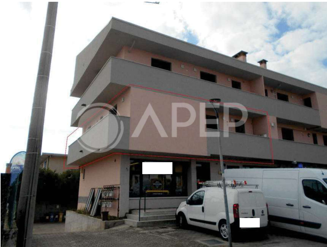
Foto 3: fabbricato condominiale, particolare facciate nord ed est, evidenziata in rosso la porzione relativa all'appartamento pignorato

via Santa Bertilla, 14 – 35030 Selvazzano D. (PD) email: claudiabonelli73@gmail.com PEC: claudia.bonelli@archiworldpec.it