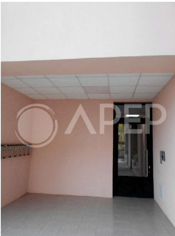
Foto 7: loggia d'ingresso condominiale (lato ovest del fabbricato)