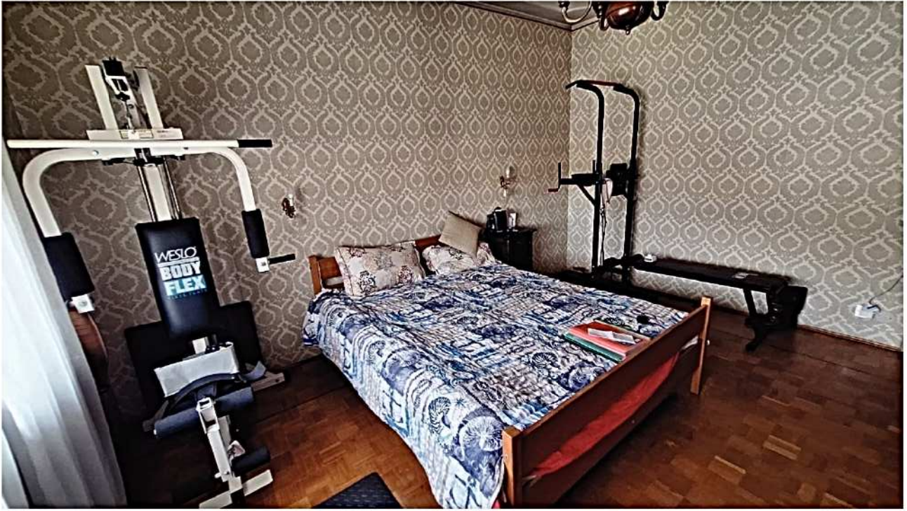
23) Camera matrimoniale