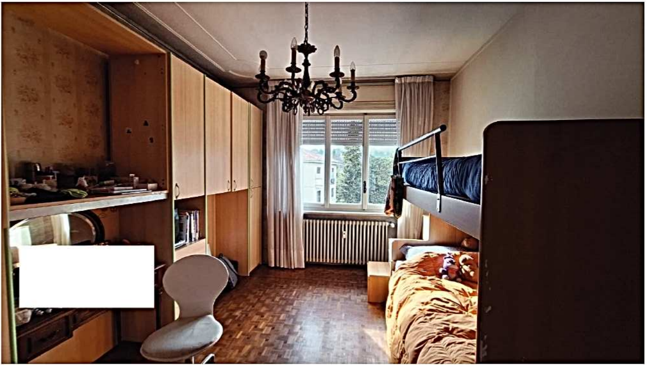
16) Camera da letto