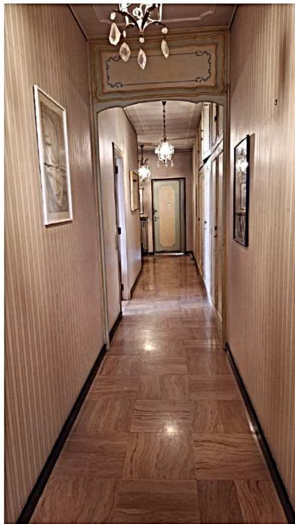
8) Corridoio, sullo sfondo porta di ingresso