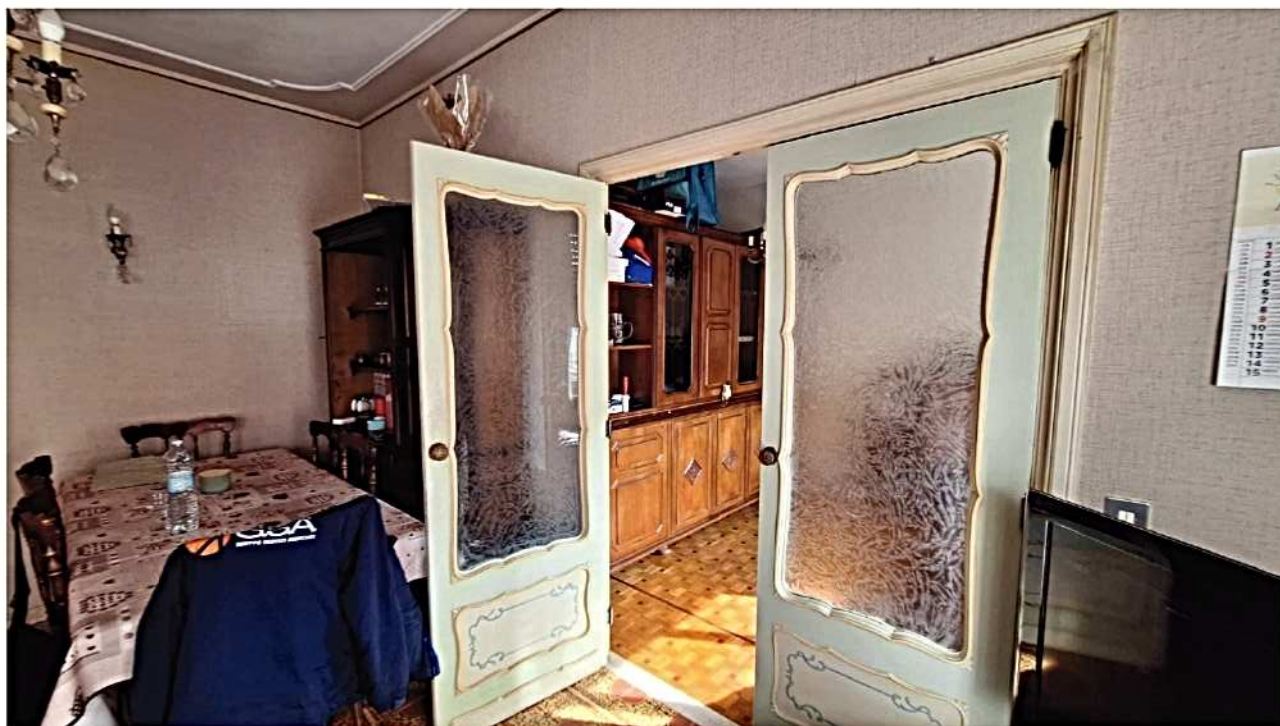
11) Porta comunicazione tra salotto e camera divisa in 2 da mobile