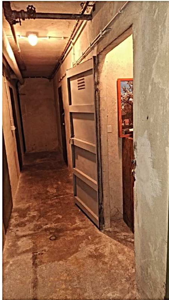
24) Cantina ingresso