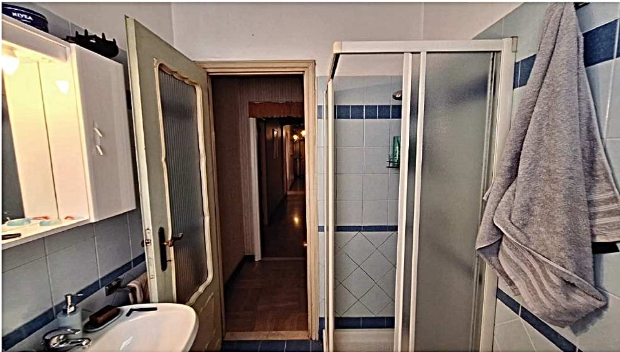
19) Bagno 1