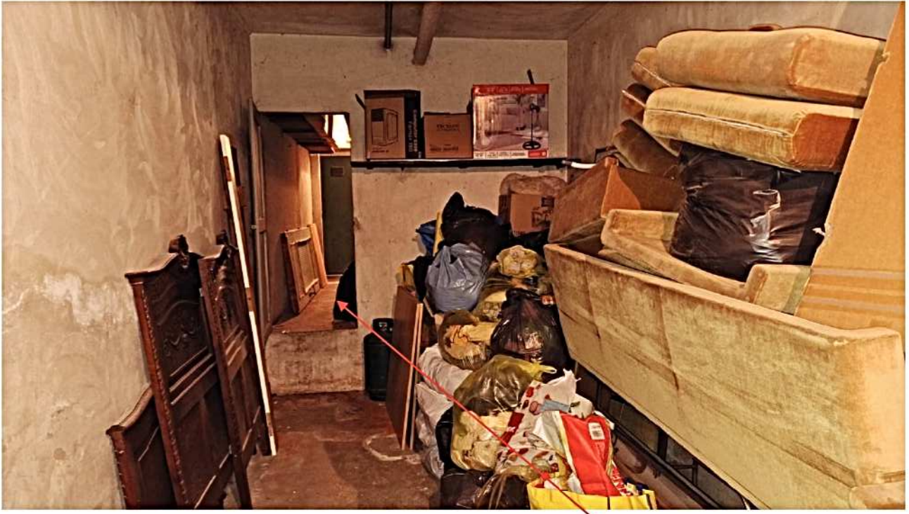
27) Autorimessa sullo sfondo la cantina