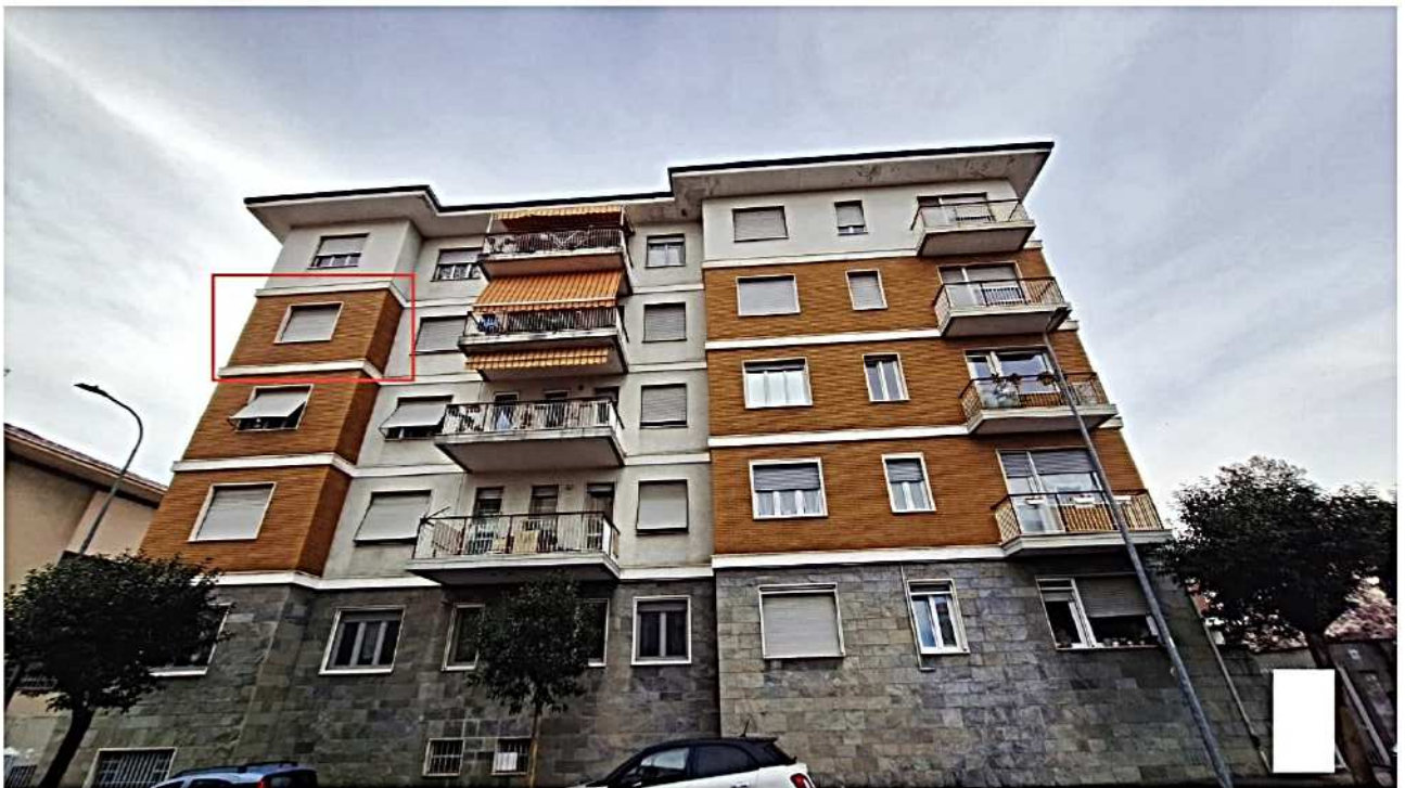
2) Facciata lato est Alloggio 4°P.