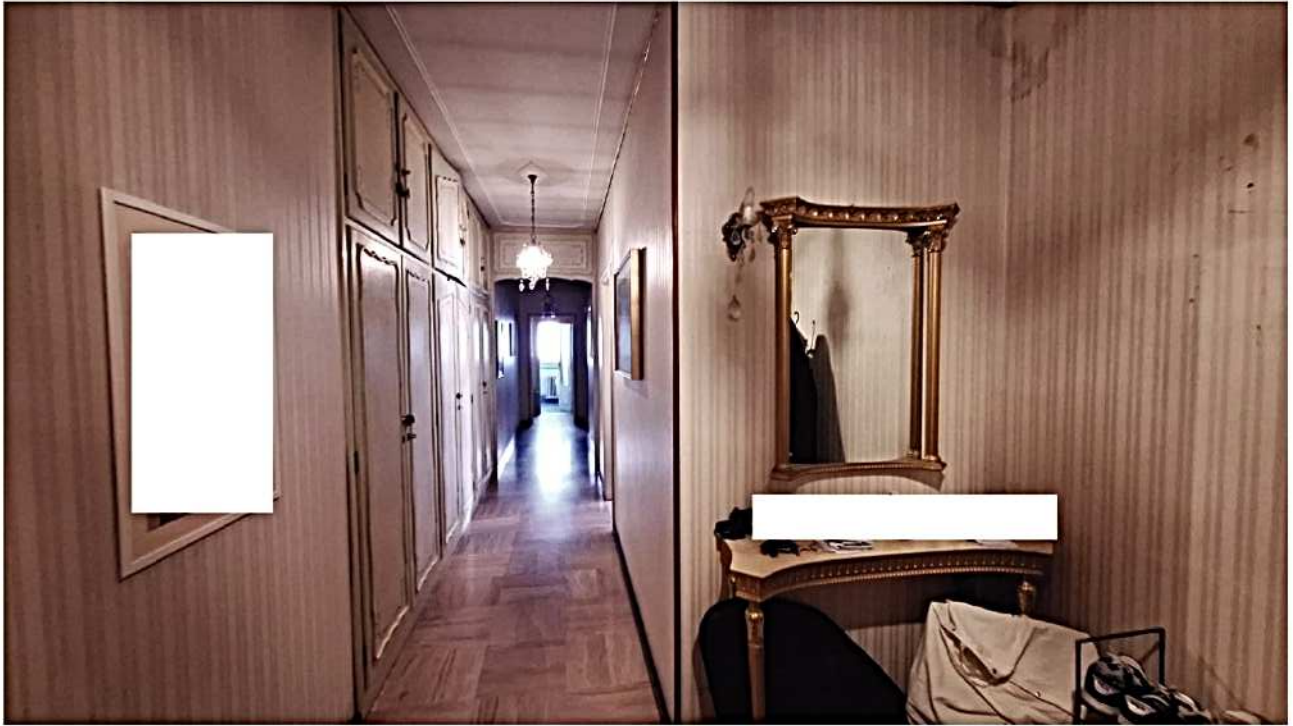
7) Corridoio visto dal portoncino di ingresso