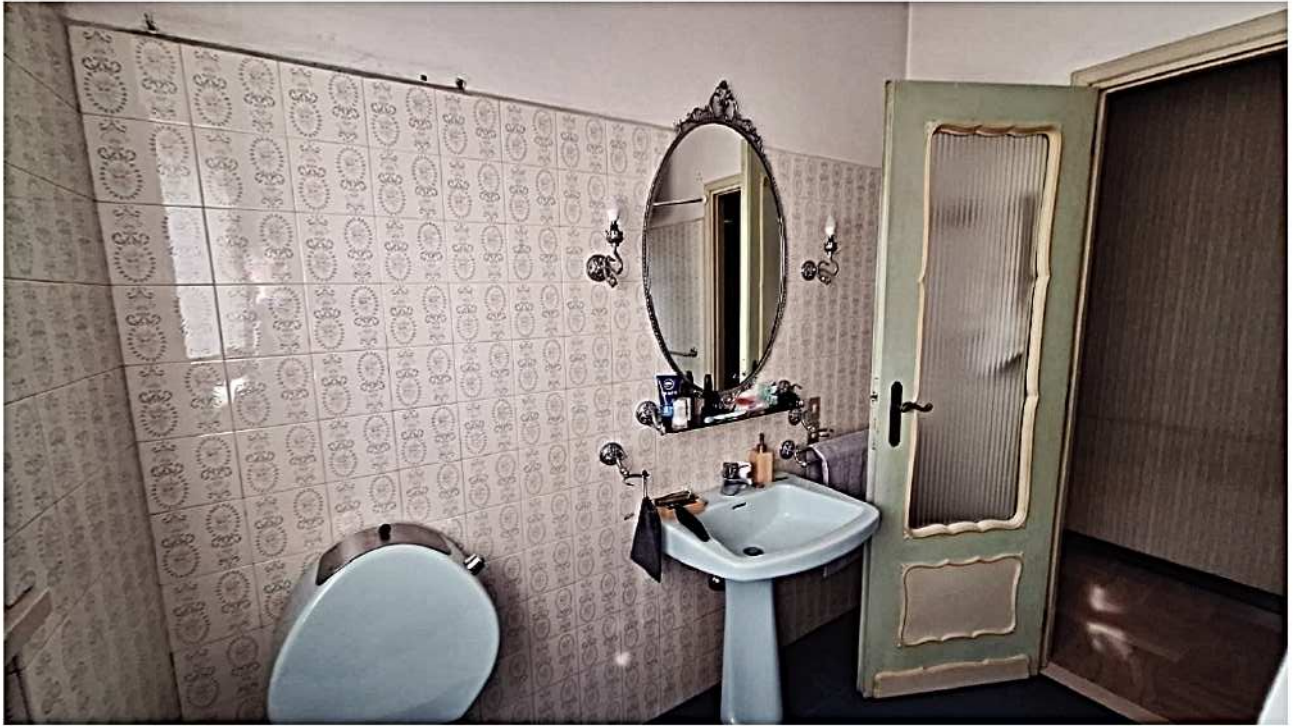
21) Bagno 2