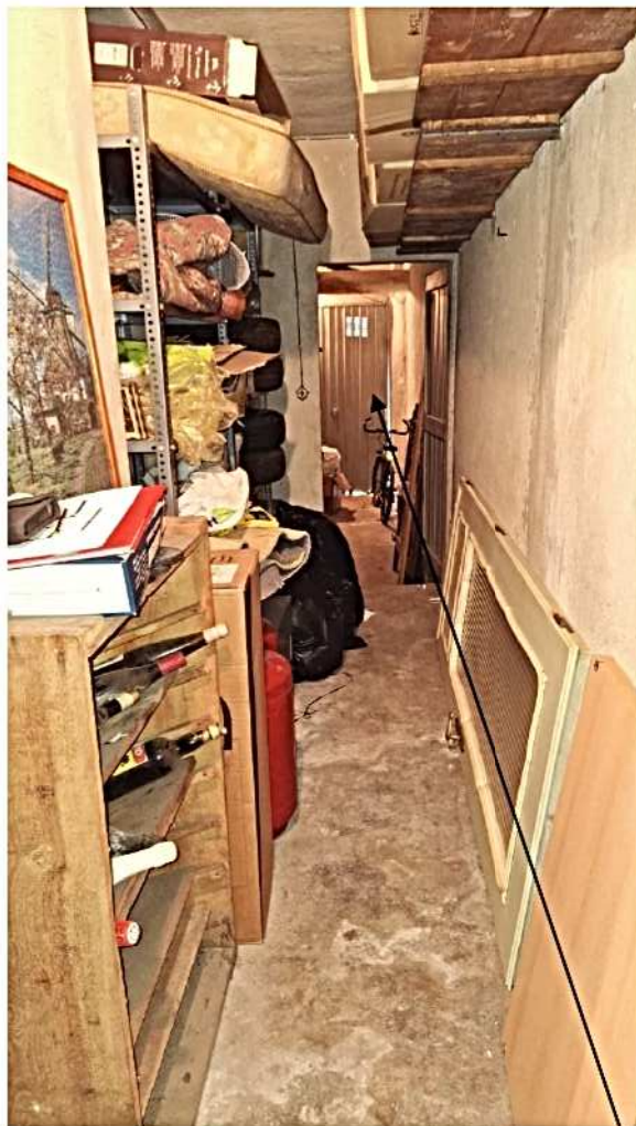
25) Cantina sullo sfondo la porta autorimessa