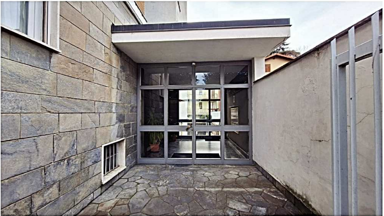
4) Ingresso condominiale