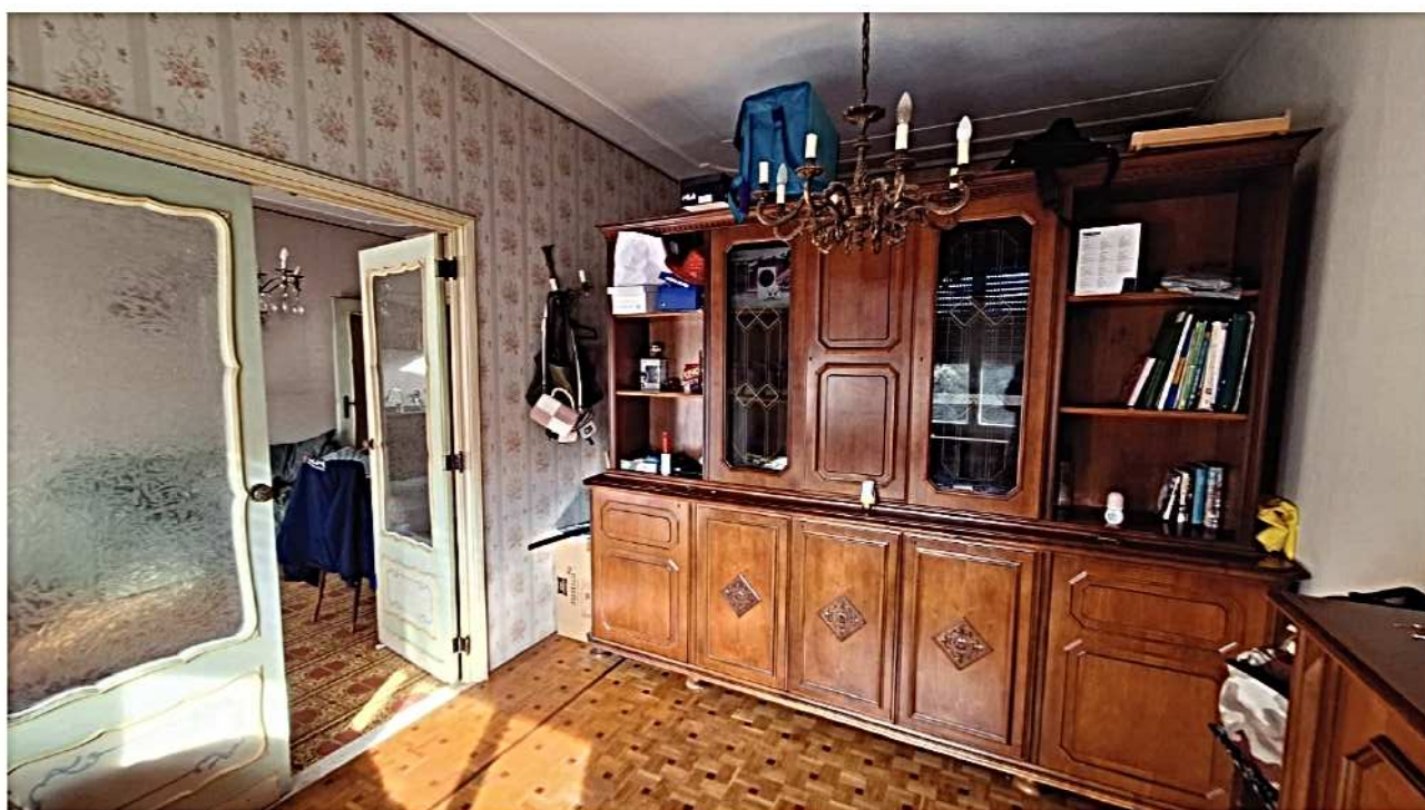
12) Ex sala adibita a camera