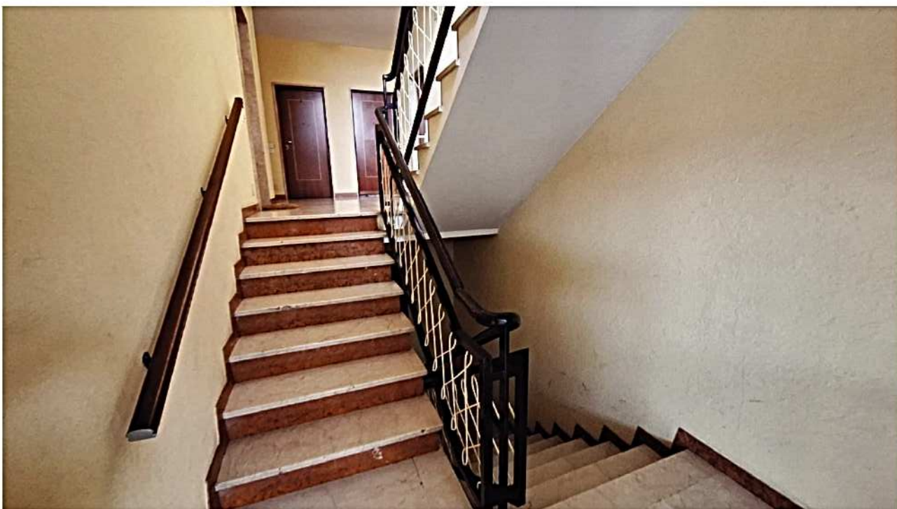
6) Scale di accesso ai piani