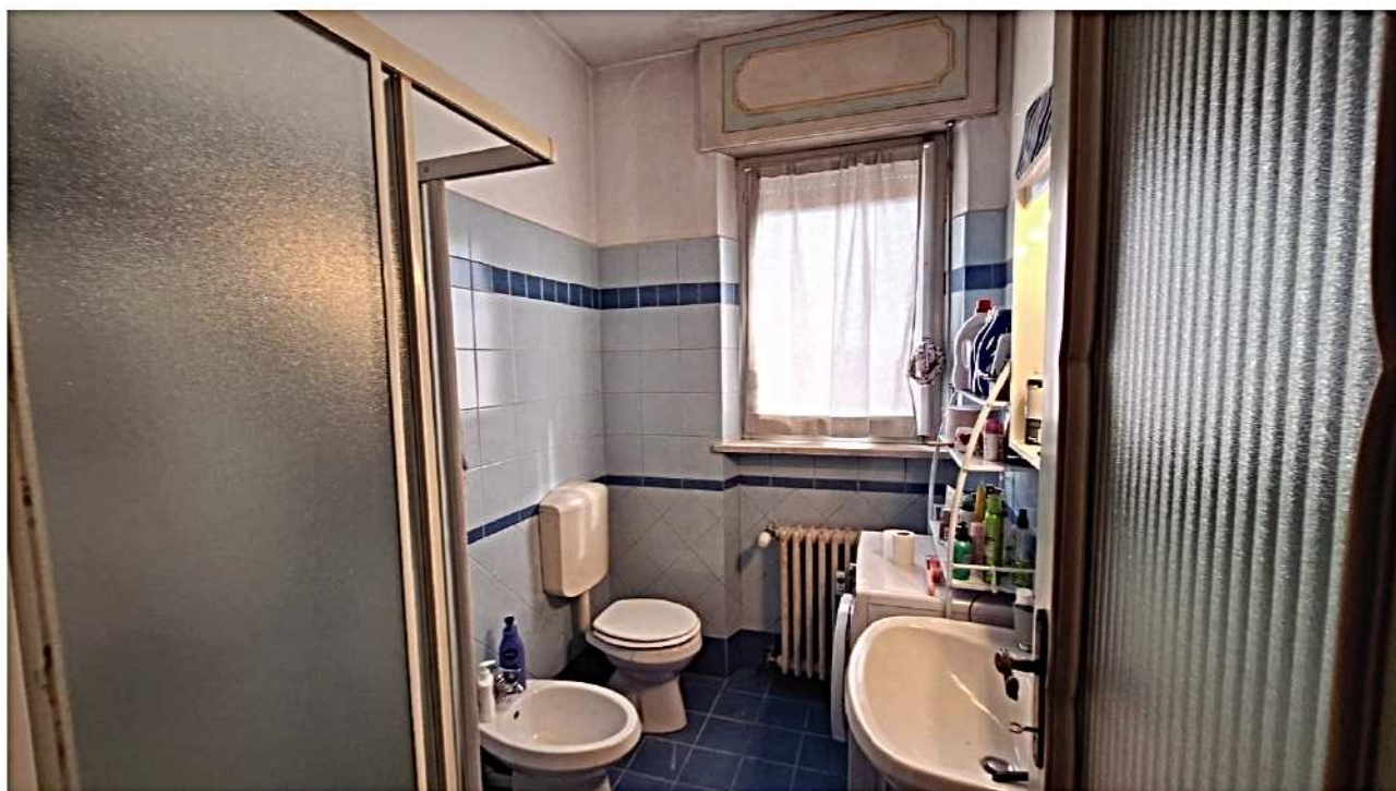
18) Bagno 1