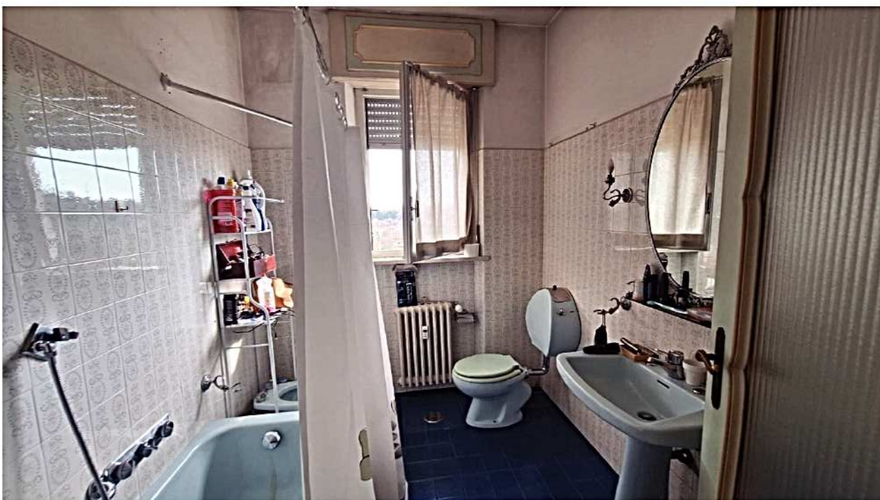
20) Bagno 2