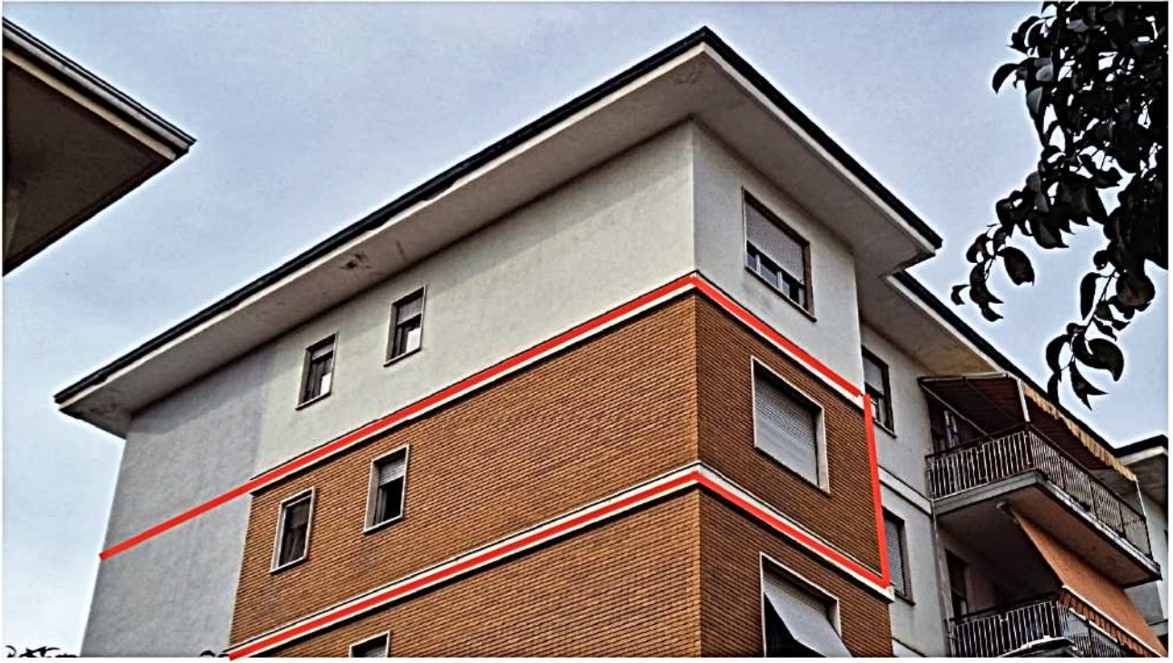
3) Facciata lato sud-est Alloggio 4° P.