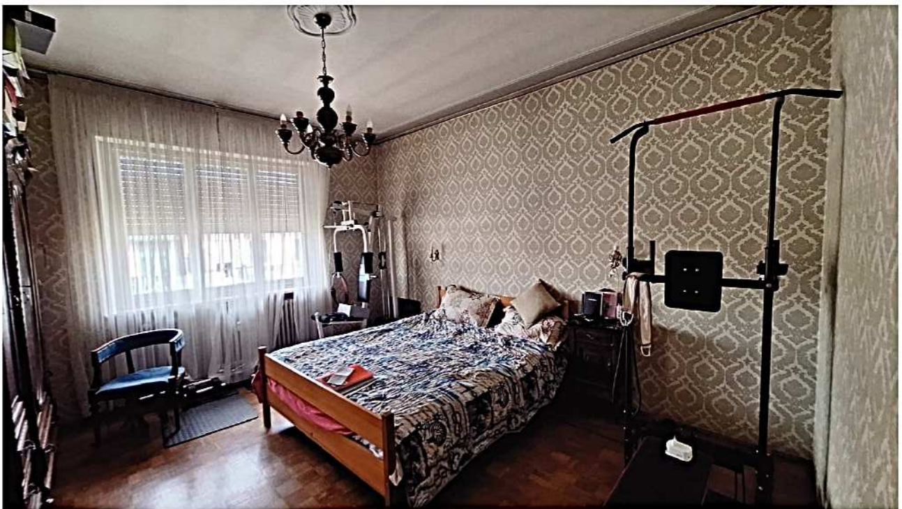
22) Camera matrimoniale