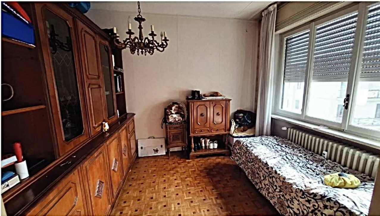
13) Ex sala adibita a camera