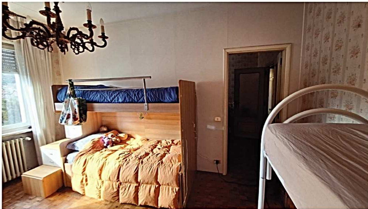
17) Camera da letto