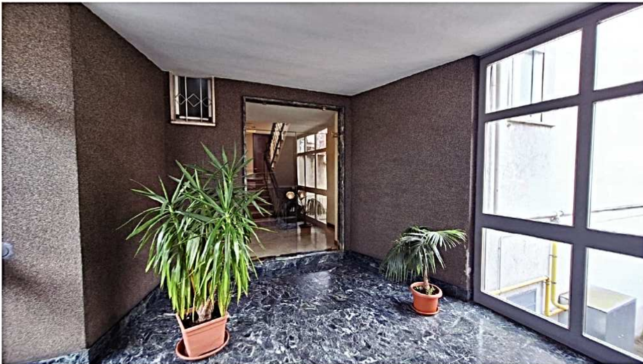
5) Atrio di ingresso