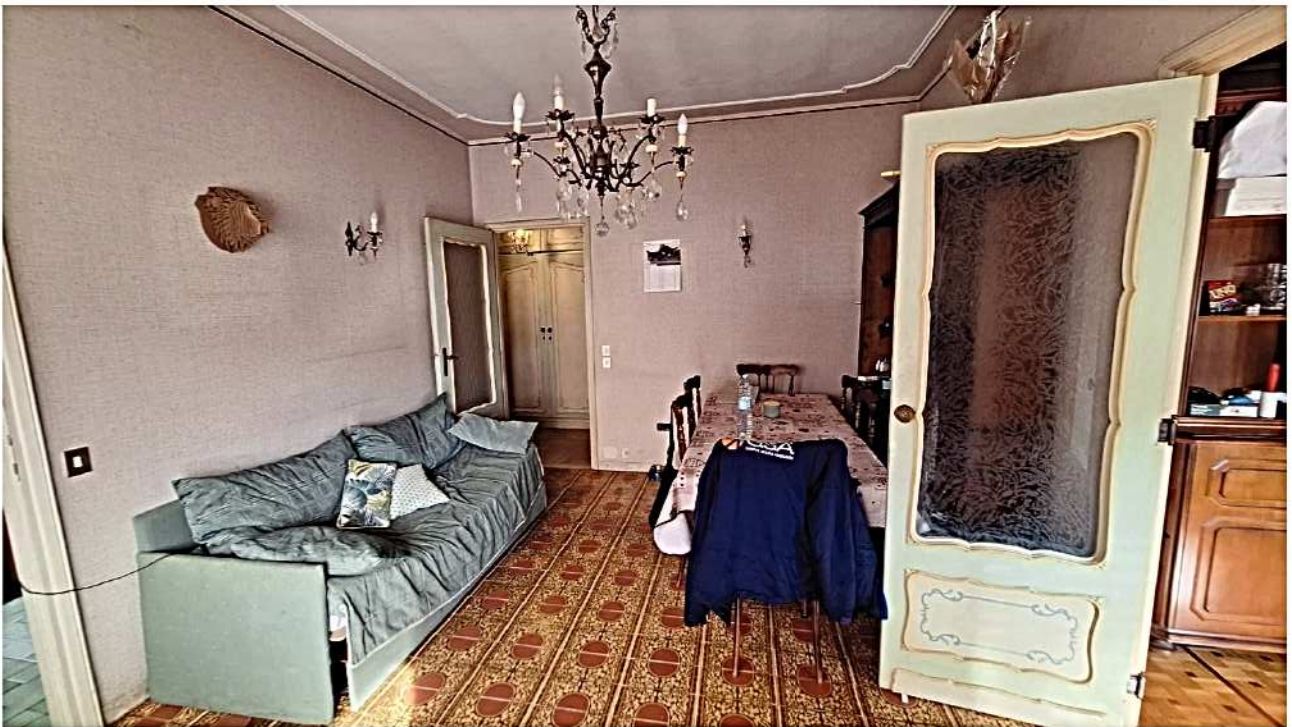
10) Salotto e camera da pranzo