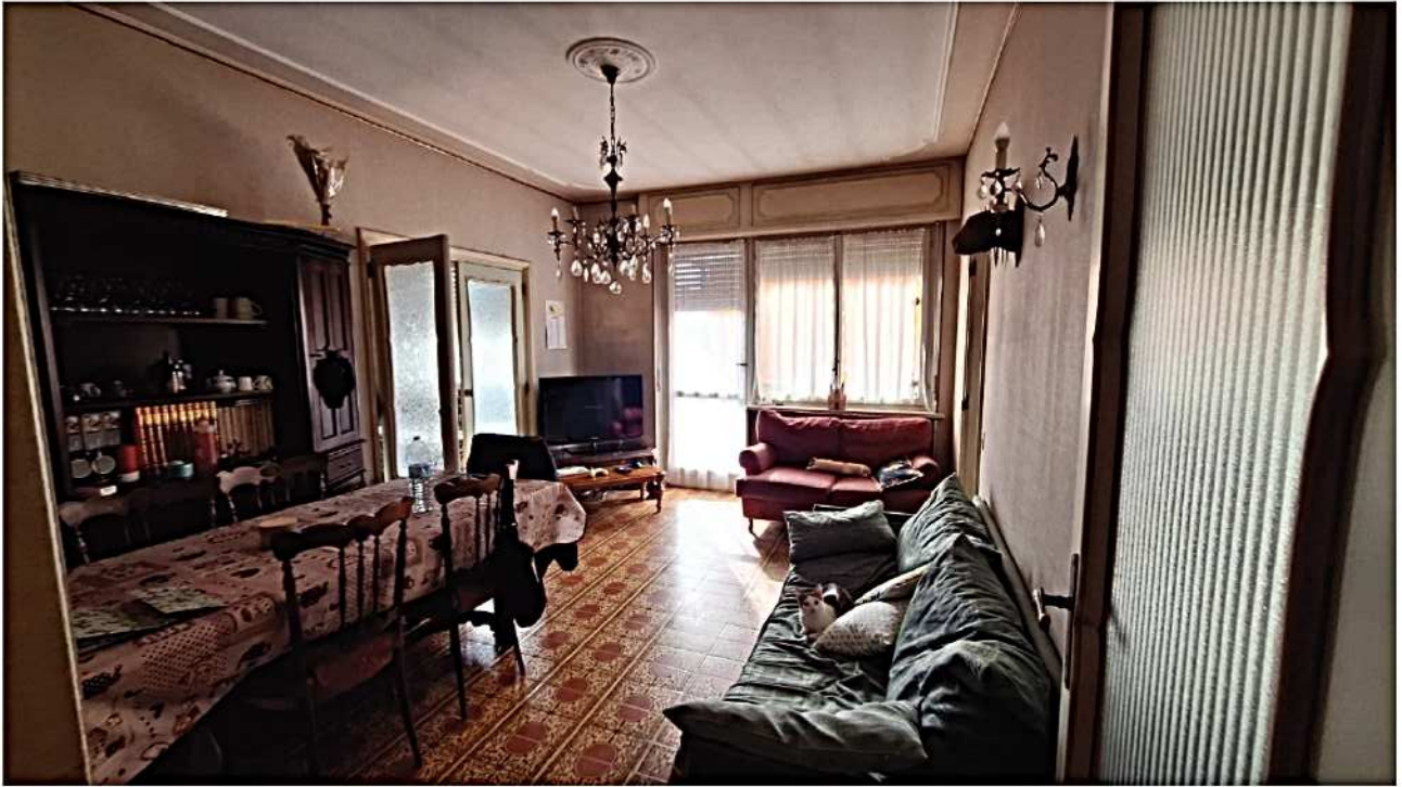
9) Salotto e camera da pranzo