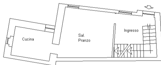
Pianta Piano Terra h=m2.60