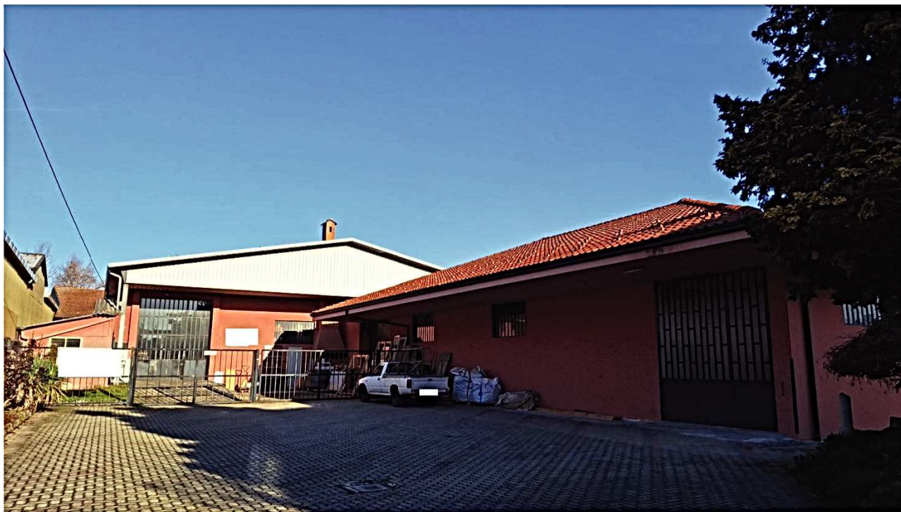
6) Facciata sud-ovest vista da cancello di ingresso sullo sfondo Lotto 2