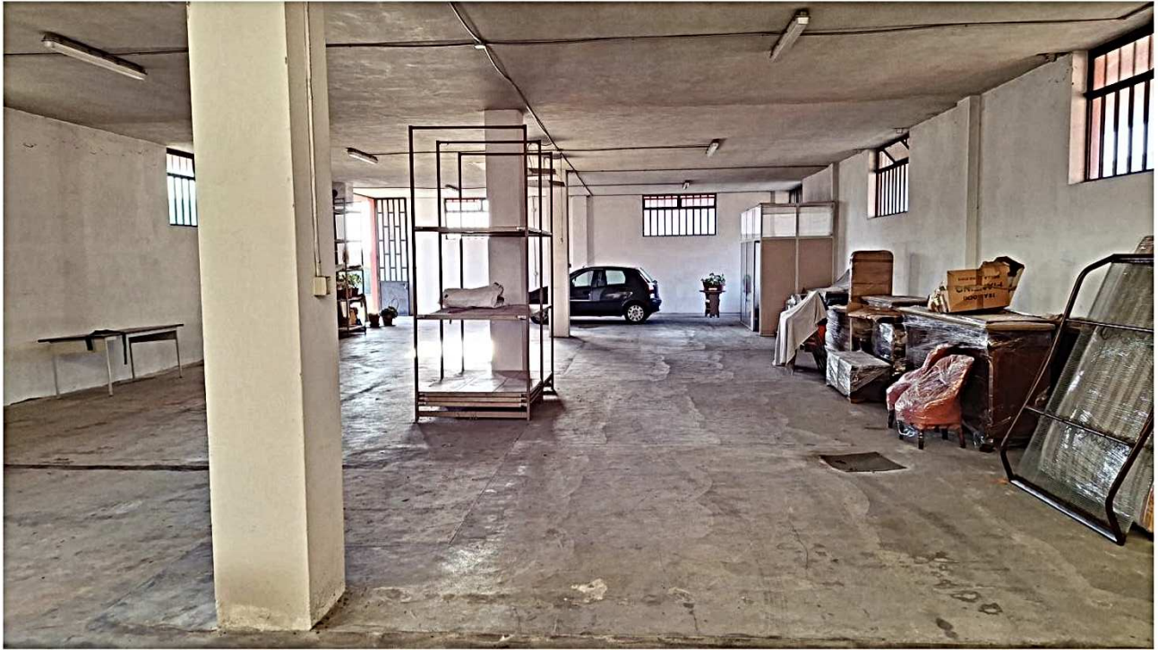
12) Vista interna direzione nord-sud