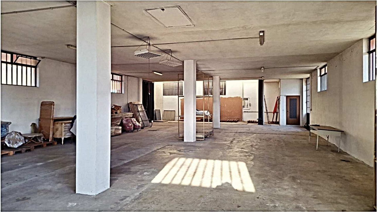
14) Vista interna direzione sud-nord la porta in fondo sulla dx è un bagno