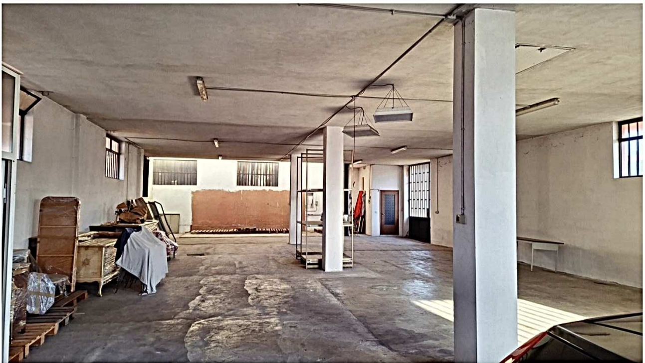
13) Vista interna direzione sud-nord