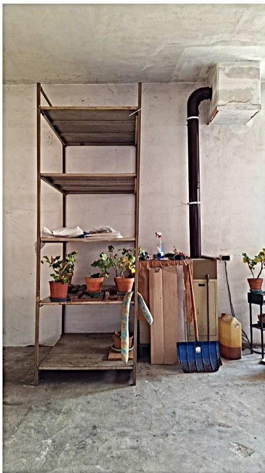
16) Impianto riscaldamento con caldaia interna attualmente non attivo