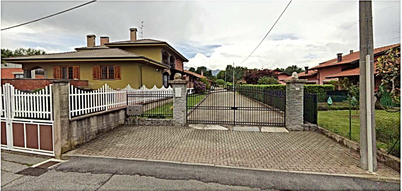
4) Ingresso comune ai 3 lotti