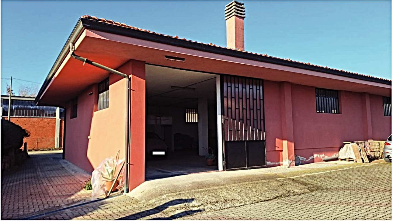
8) Facciate sud-est e nord est