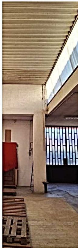
15) Vista da ovest ad est