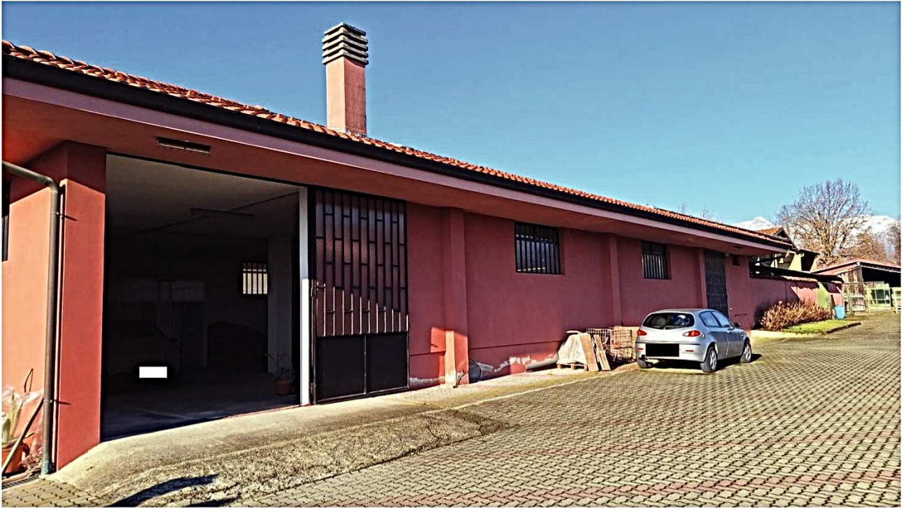
10) Vista Lato nord-est