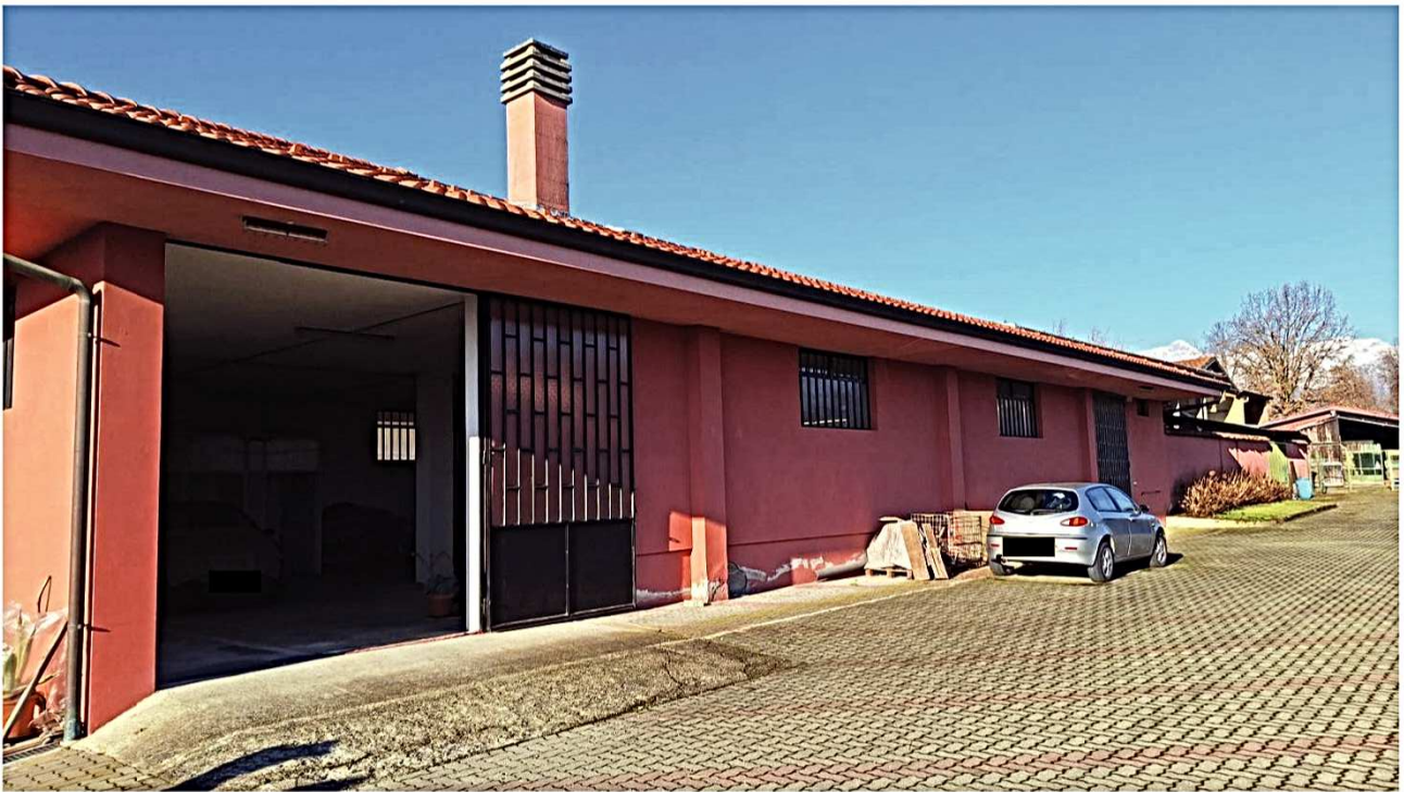
9) Vista Lato nord-est