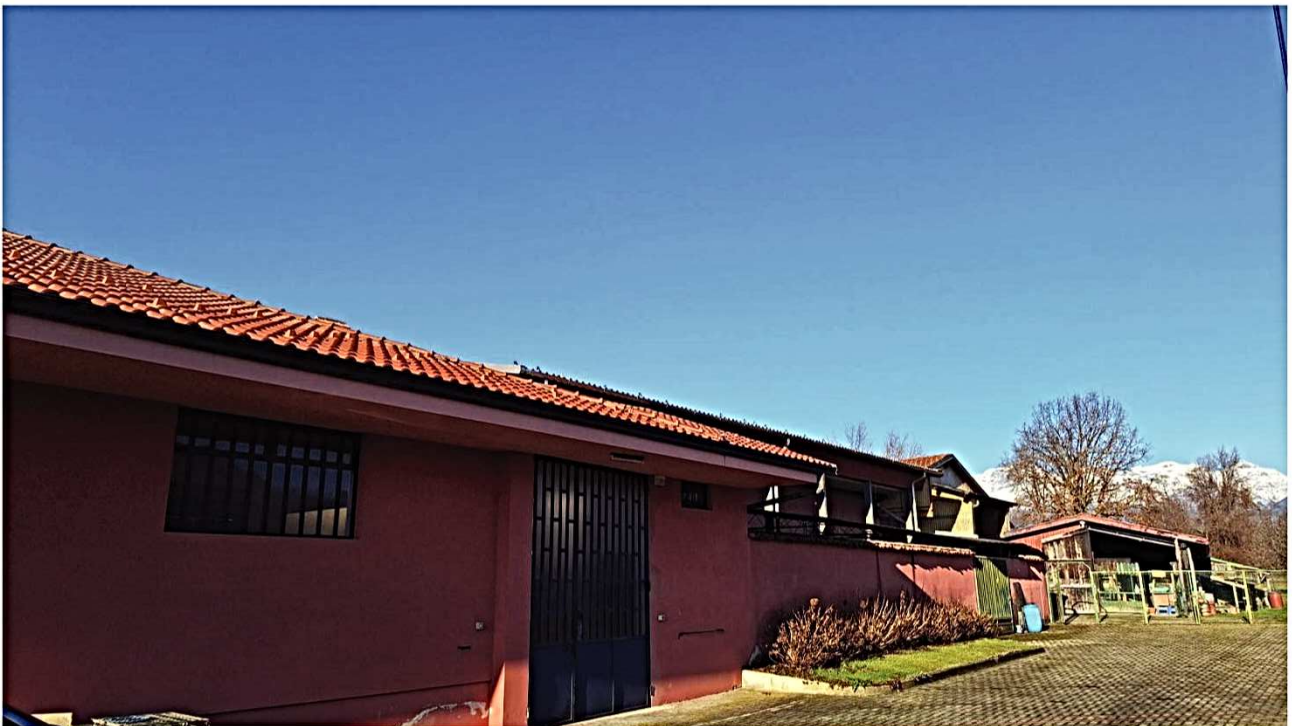
11) Vista Lato nord-est sullo sfondo Lotto 3