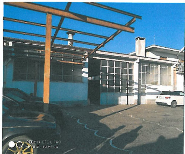
Particolare terreno comune part. 3089 e pavimentazione in porfido.