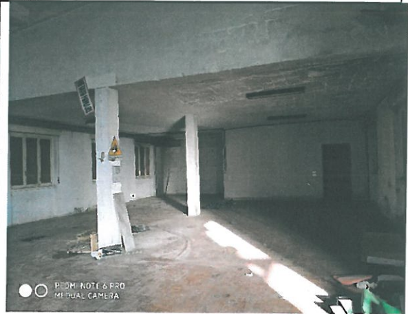
Interno – finiture.