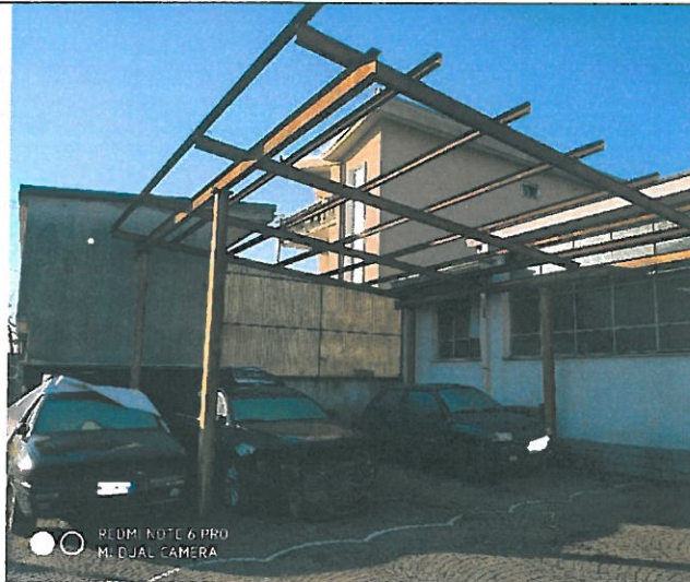
Vista struttura in ferro insistente su terreno comune part. 3089 (oggetto di condono).