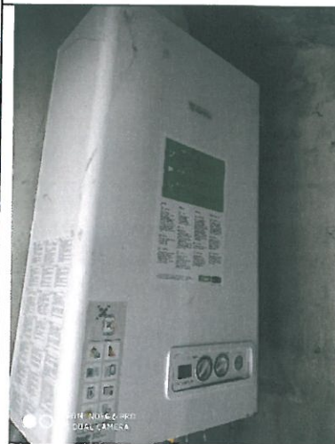
Caldia murale – vano esterno