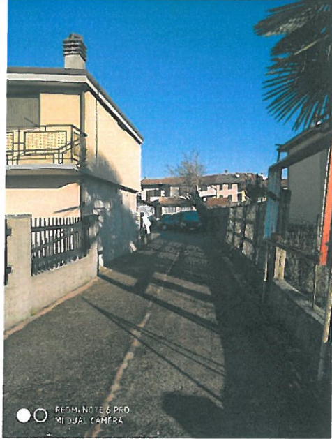
Vista ingresso da via A.Toscanini.

Accesso da via A.Toscanini C] Terreno comune part. 3089.