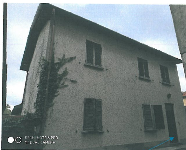
Prospetto da cortile di terzi (particella 4874).