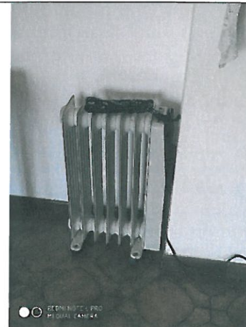
Elemento riscaldante elettrico