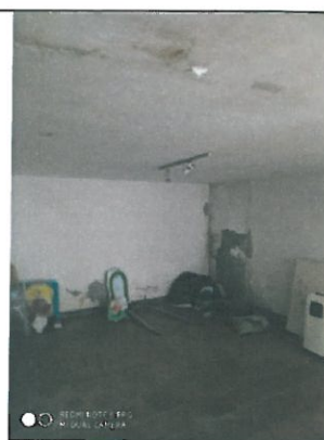
Interno - finiture