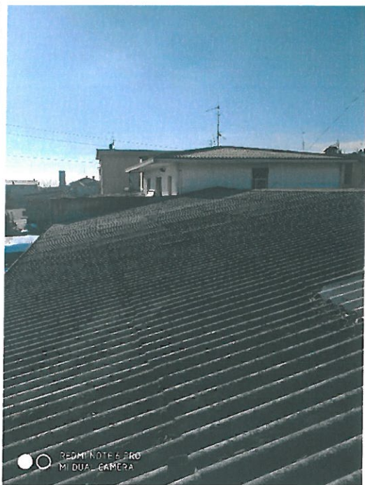
Copertura in amianto – cemento.