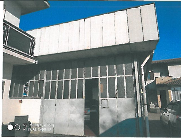
Vista ingresso officina.

A] Officina – piano terra -Particelle graffate 3089/1-5961/1 catasto fabbricati