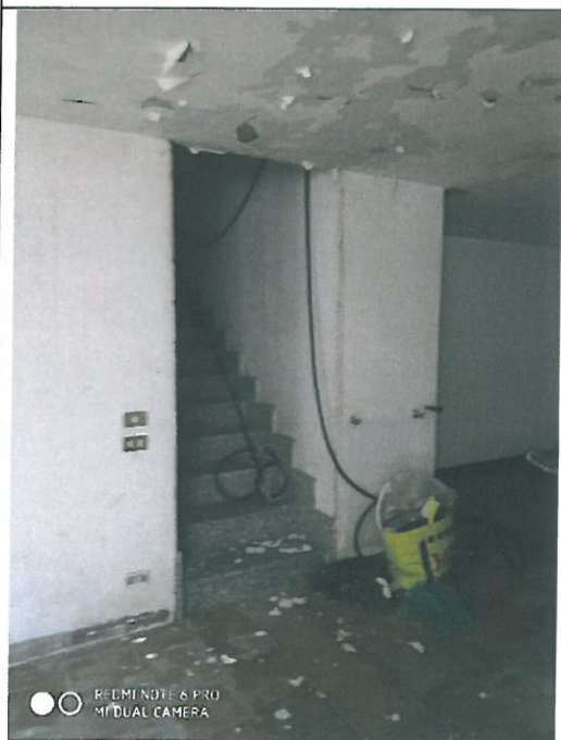
Scala d'accesso al deposito al piano cantina (da interno piano terra) e particolare efflorescenze e distacchi intonaco.