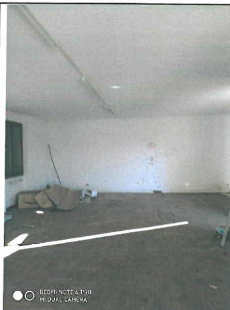
Interno deposito piano primo.