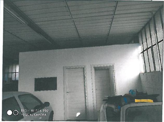
Particolare finiture ufficio e accessori officina.