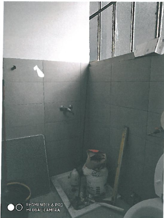
Finiture interne servizio igienico officina.