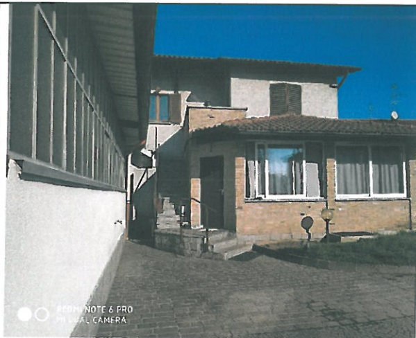
Vista ingresso e prospetto - da terreno comune part. 3089.

A] Ufficio / deposito adattato a residenza – piano terra -Particelle graffate 3089/1-5961/1 catasto fabbricati