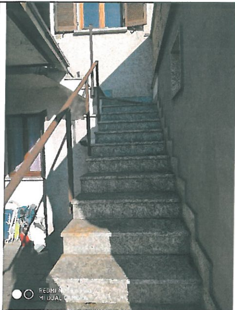
Scala d'accesso al deposito al piano primo.

A] Depositi – piani primo e interrato (piano cantina) -Particelle graffate 3089/1-5961/1 catasto fabbricati