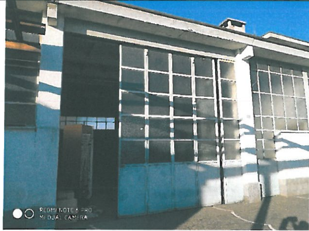
Vista ingresso / finiture esterne - capannone / laboratorio.

A] Capannone / laboratorio – piano terra -Particelle graffate 3089/1-5961/1 catasto fabbricati