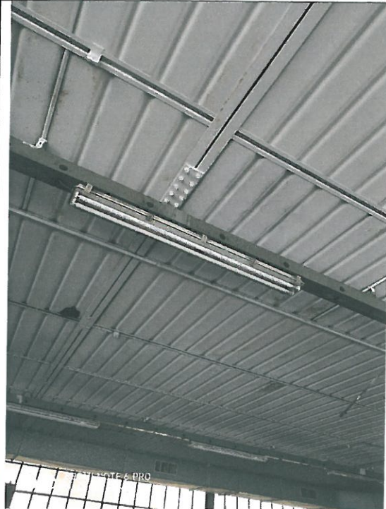
Particolare copertura – interno officina.