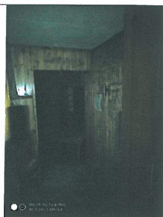
Caldaia murale – vano esterno