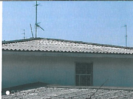
Particolare copertura abitazione in amianto – cemento.