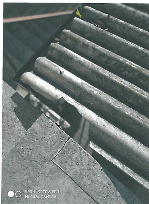
Particolare copertura in amianto – cemento.