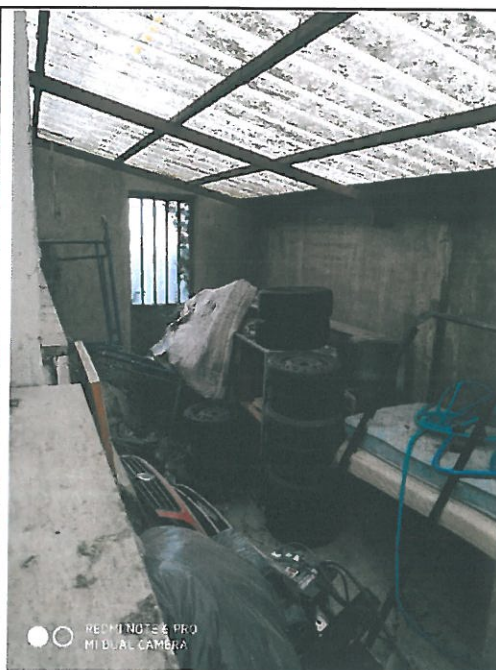
Accessori esterni (in aderenza al capannone / laboratorio).