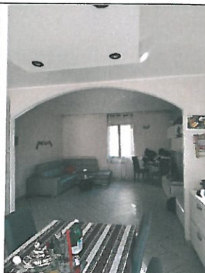
Interno - finiture