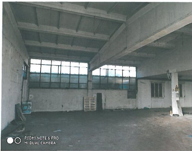
Interno – finiture.