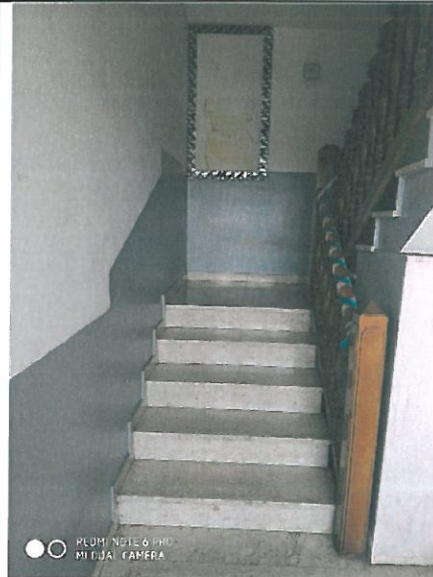
Vano scala – finiture.