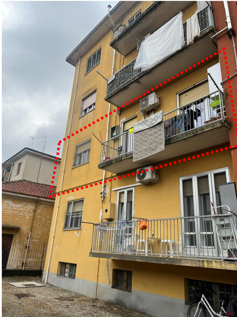
Foto 3. Identificazione dell'appartamento sul prospetto est