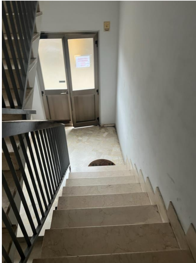
Foto 6. Vano scala