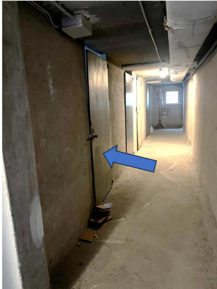
Foto 18. Ingresso cantina