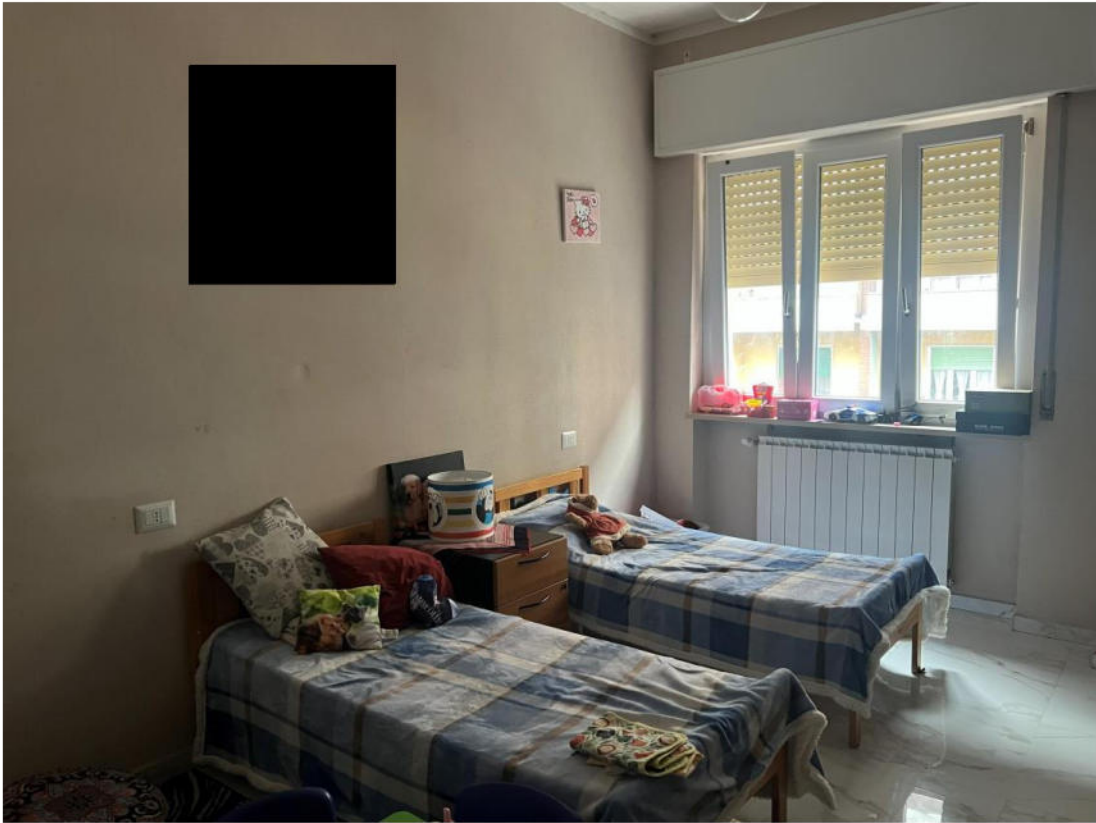
Foto 12. Camera 2