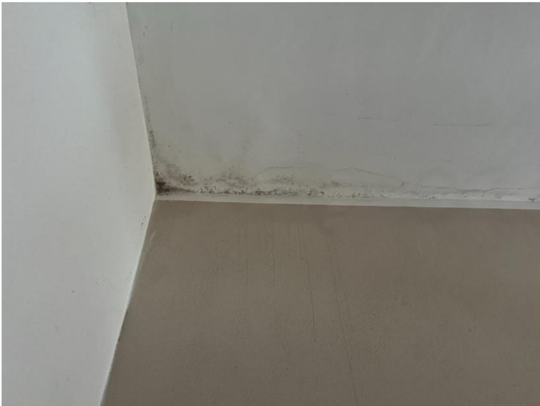
Foto 15. Particolare fenomeni di muffa camera da letto