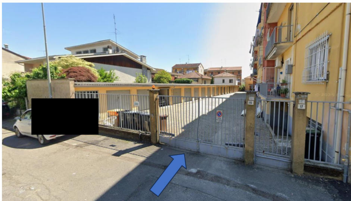
Foto 20. Accesso carrabile area esterna box