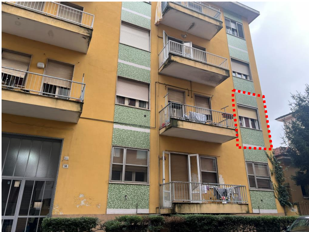
Foto 5. Identificazione dell'appartamento sul prospetto ovest