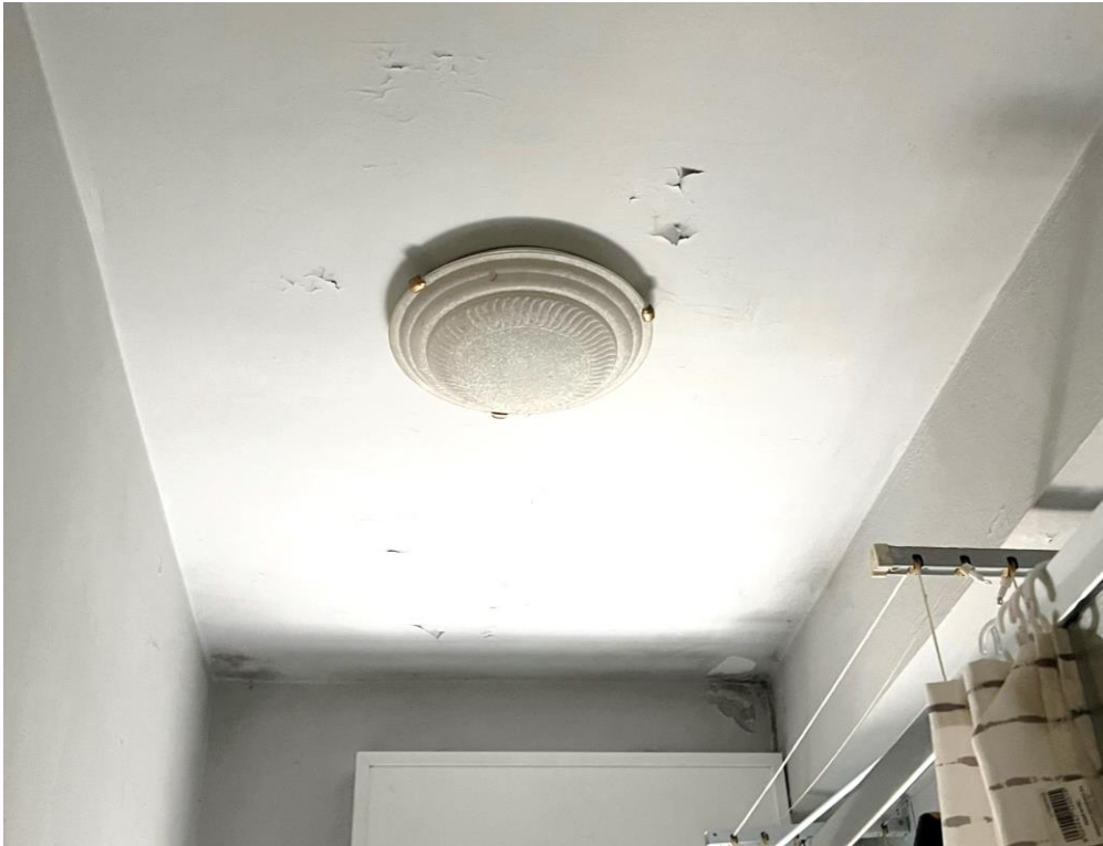
Foto 16. Particolare fenomeni di esfoliazione soffitto bagno