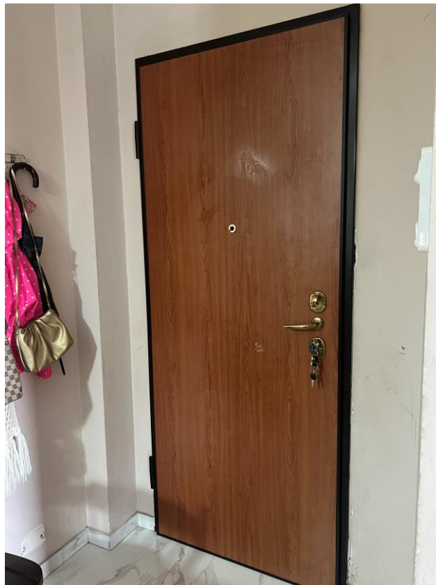
Foto 7. Ingresso