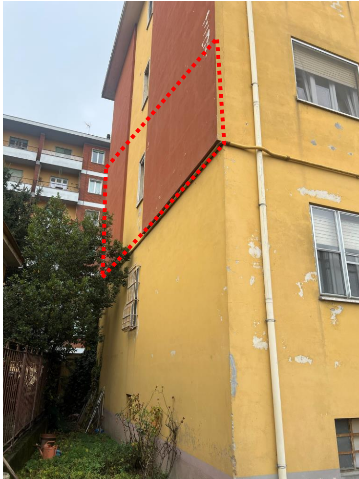
Foto 4. Identificazione dell'appartamento sul prospetto sud