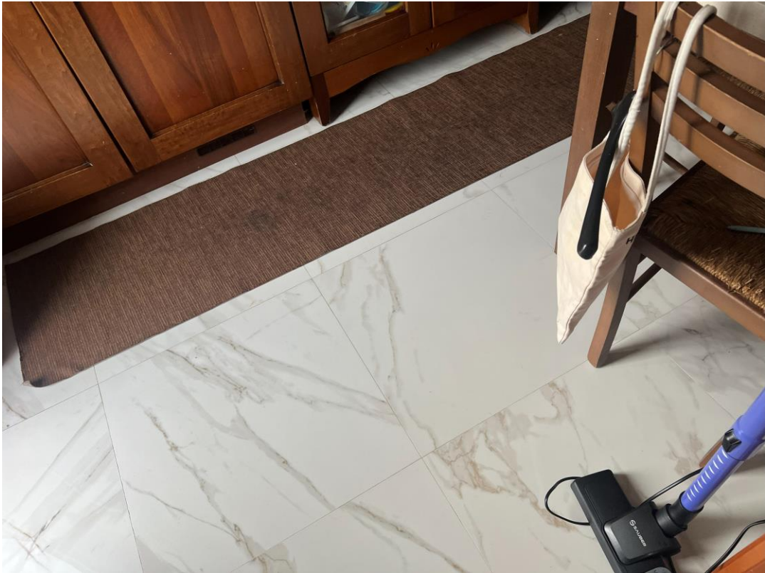
Foto 10. Particolare pavimenti in piastrelle