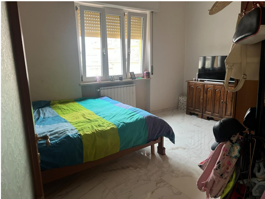
Foto 11. Camera 1