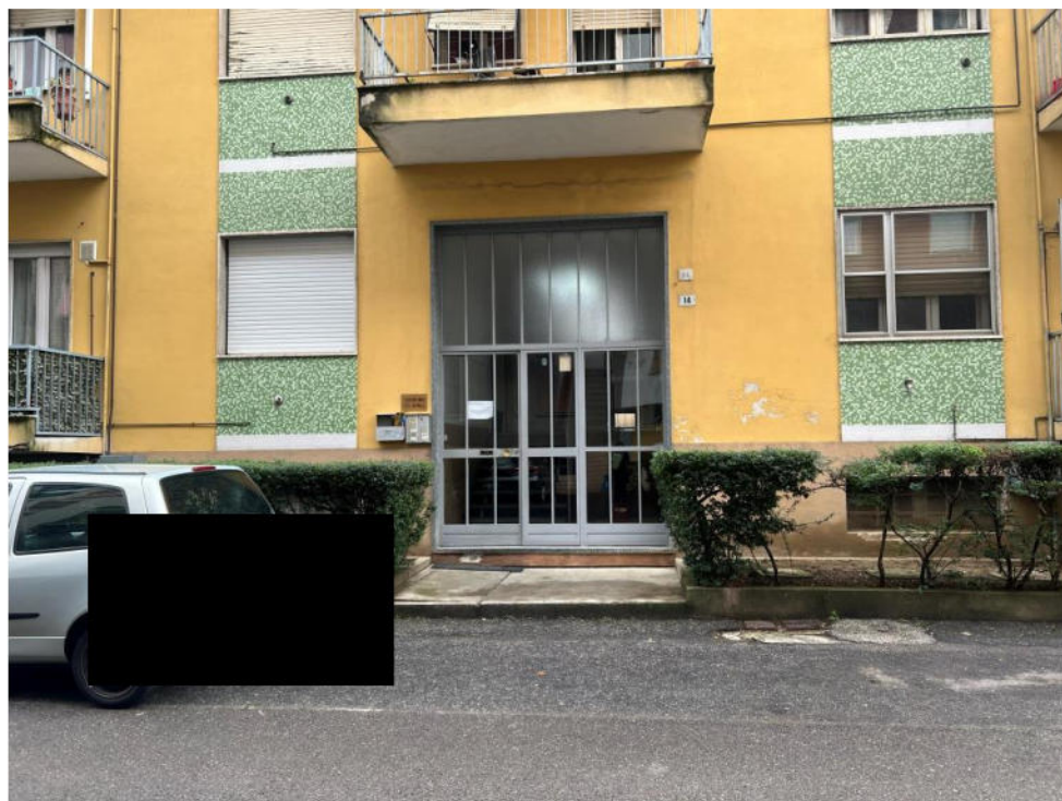
Foto 2. Ingresso pedonale sulla pubblica via