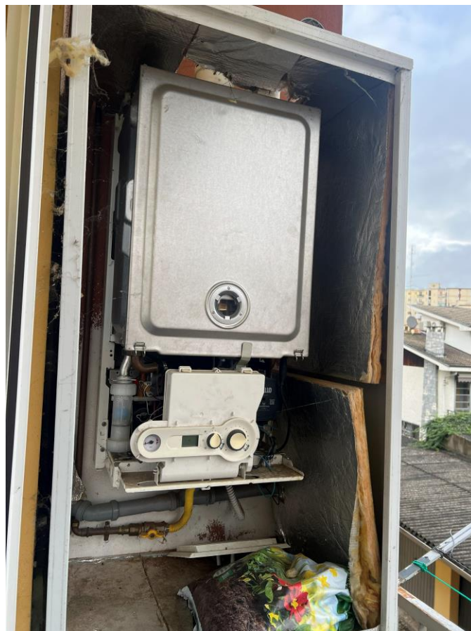
Foto 17. Stato attuale calderina