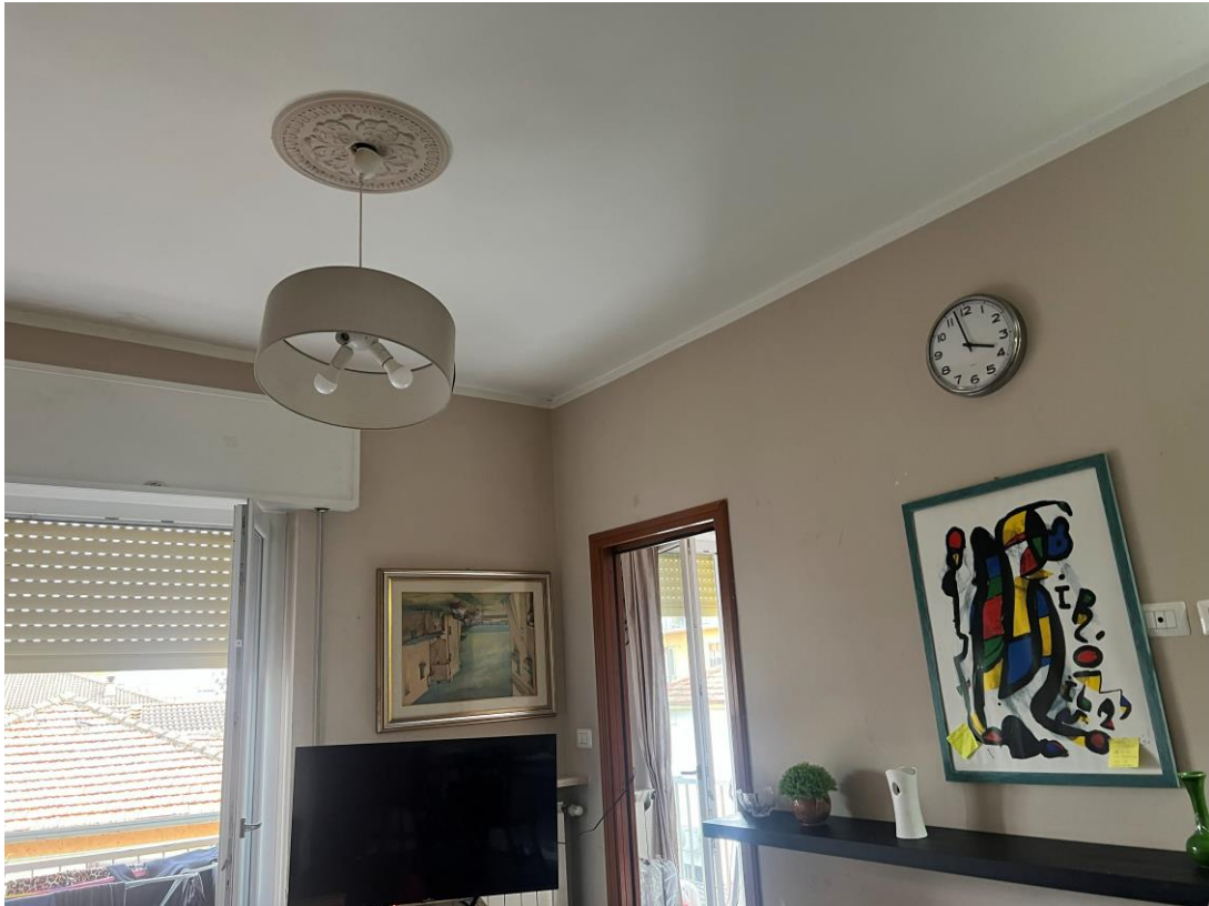
Foto 8. Soggiorno