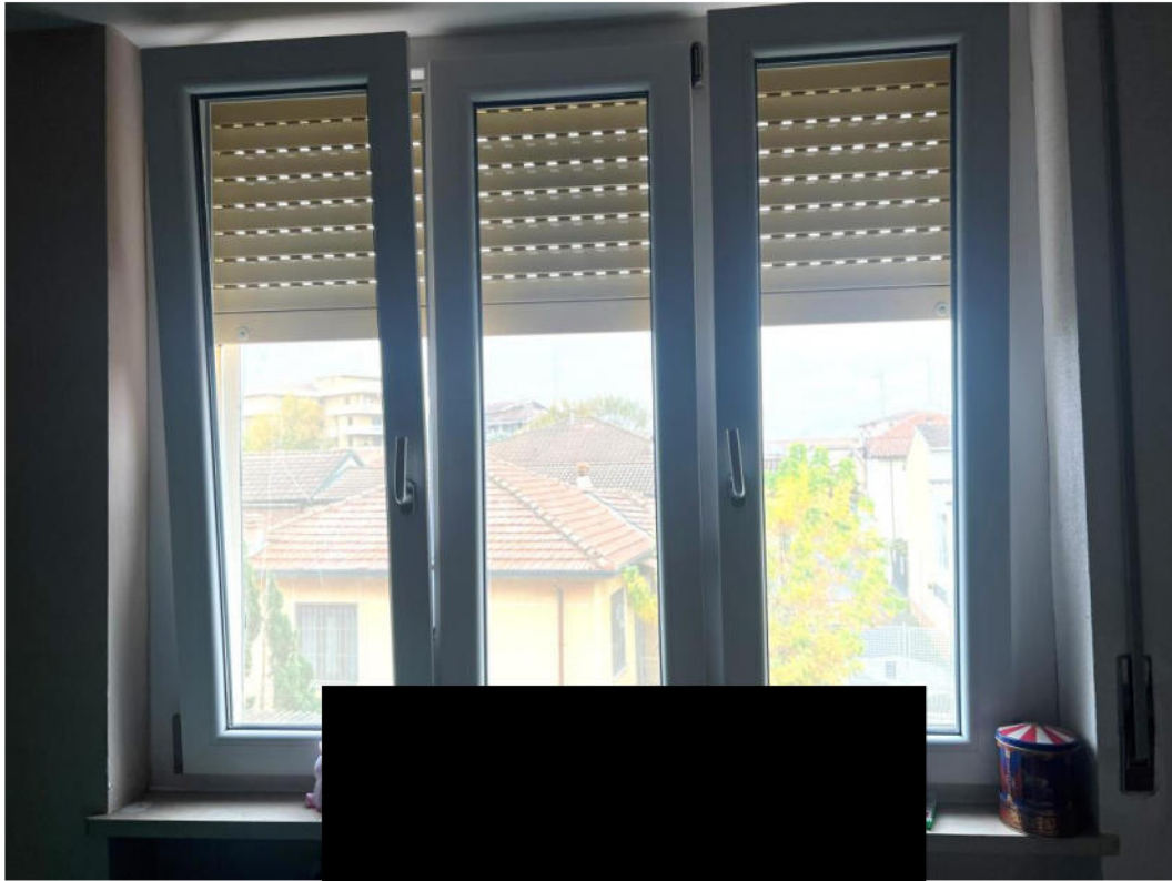
Foto 14. Particolare infissi esterni