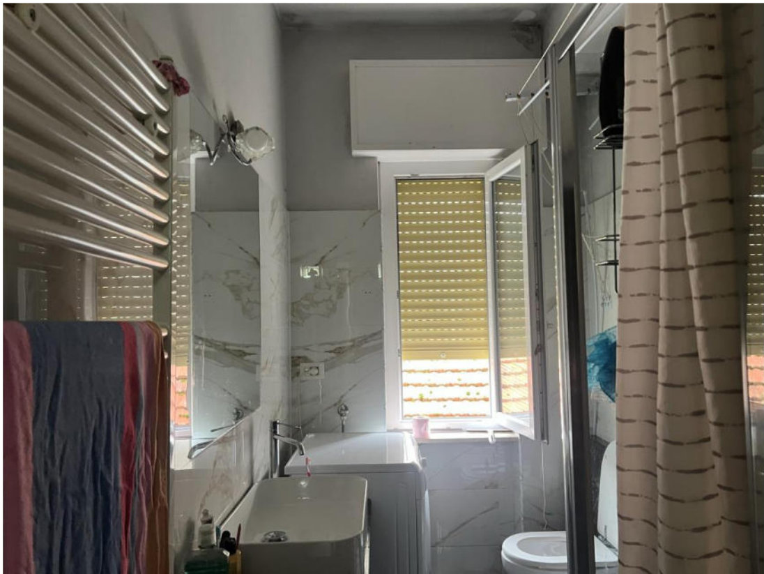
Foto 13. Bagno