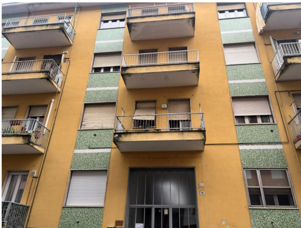
Foto 1. Fabbricato di cui fa parte l'immobile oggetto di stima