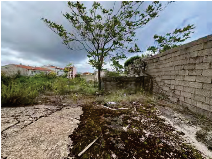
FOTO INGRESSO TERRENO