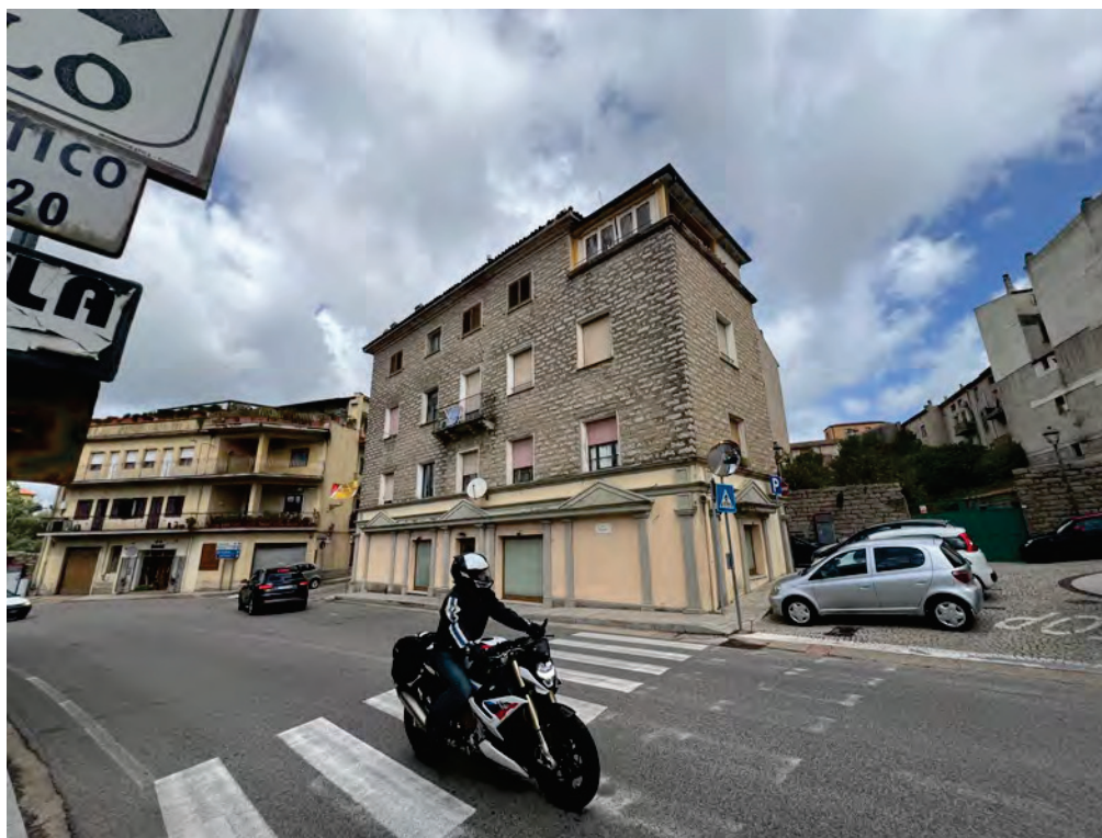
FOTO ESTERNE - PROSPETTO INGRESSO