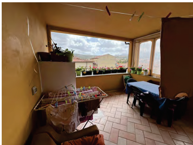
FOTO TERRAZZO COPERTO