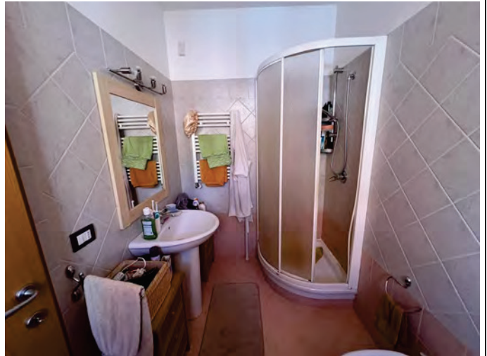
FOTO BAGNO 2