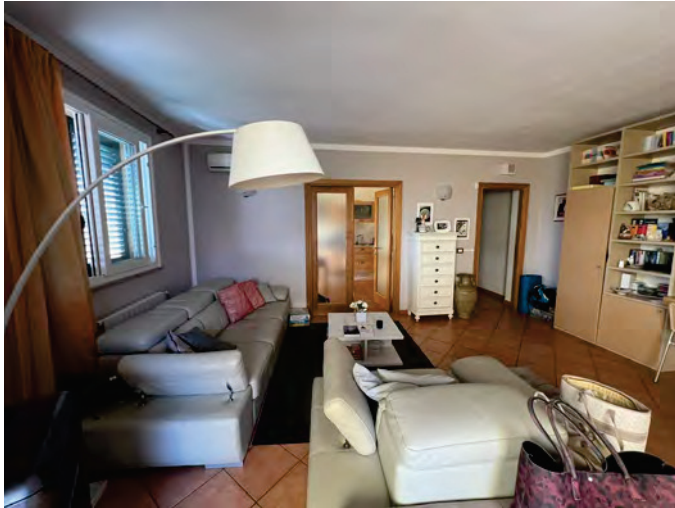
FOTO SOGGIORNO PRANZO