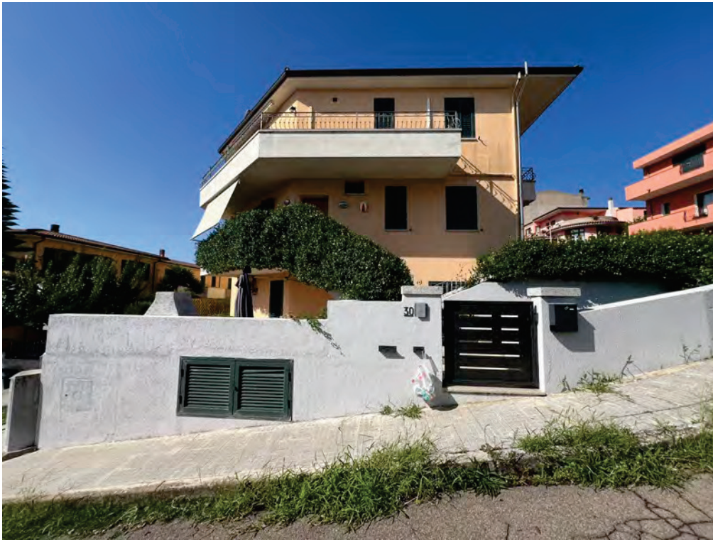
FOTO ESTERNE - PROSPETTO LATERALE