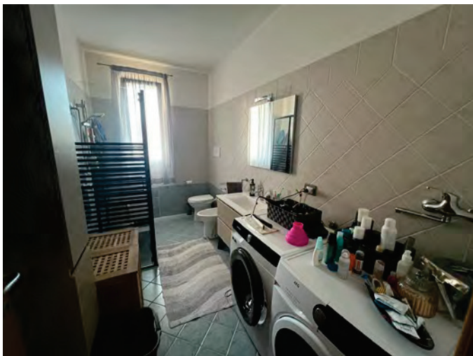
FOTO CAMERA 1