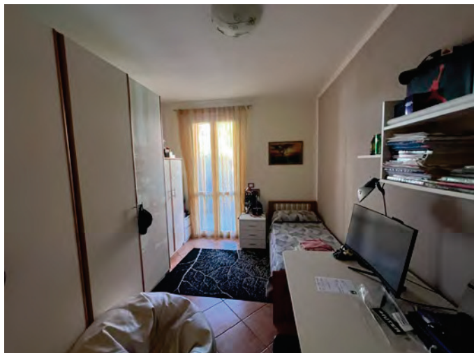
FOTO CAMERA 3