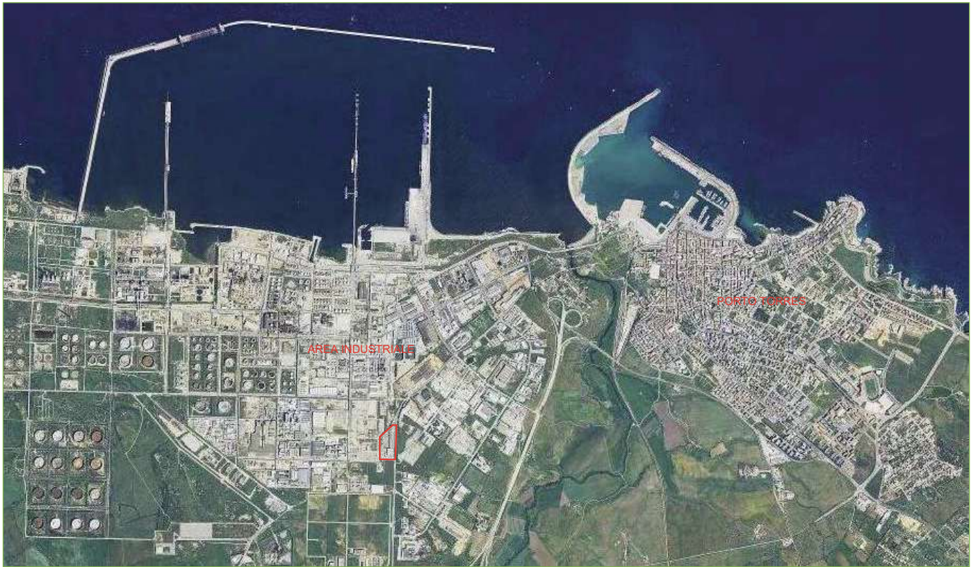
Foto n° 1: Inquadramento territoriale del compendio industriale in esame