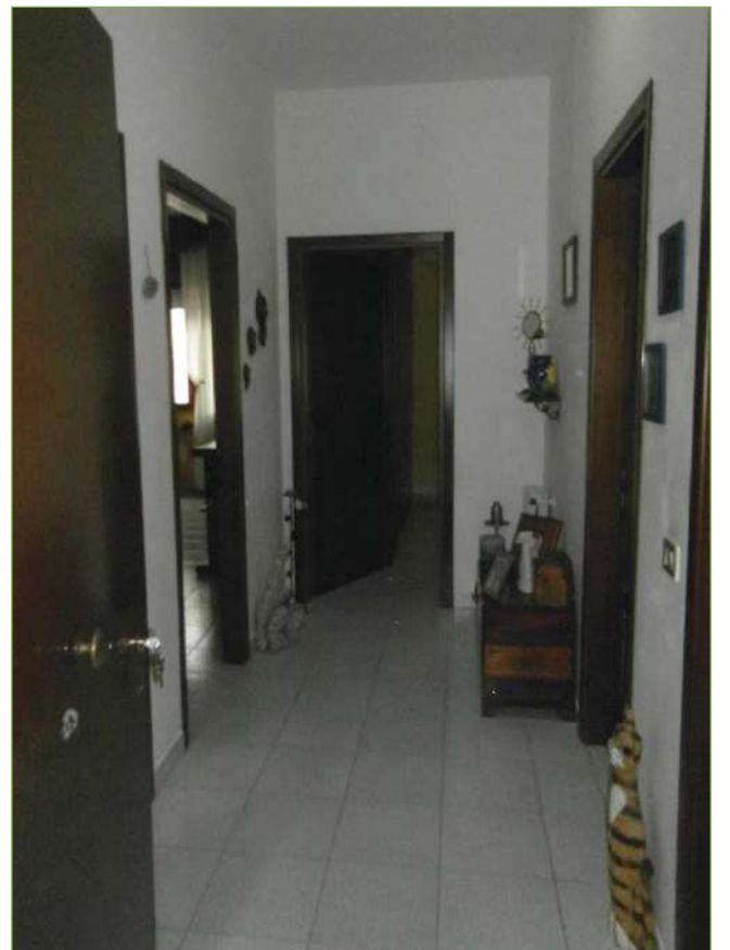
Foto n° 71: Palazzina – Piano I – Disimpegno unità lato Ovest (appartamento Custode)