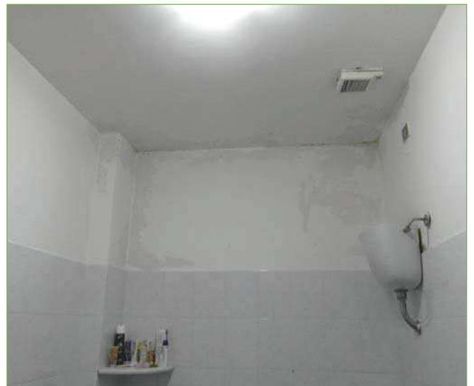
Foto n° 79: Palazzina – Piano I – Bagno unità lato Ovest (appartamento Custode) – Macchie umidità