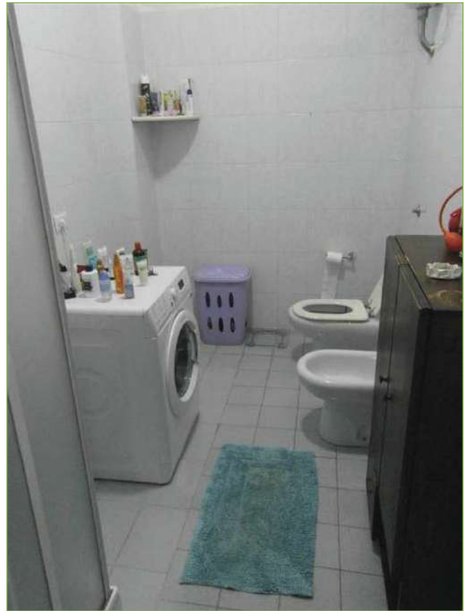
Foto n° 78: Palazzina – Piano I – Bagno unità lato Ovest (appartamento Custode)