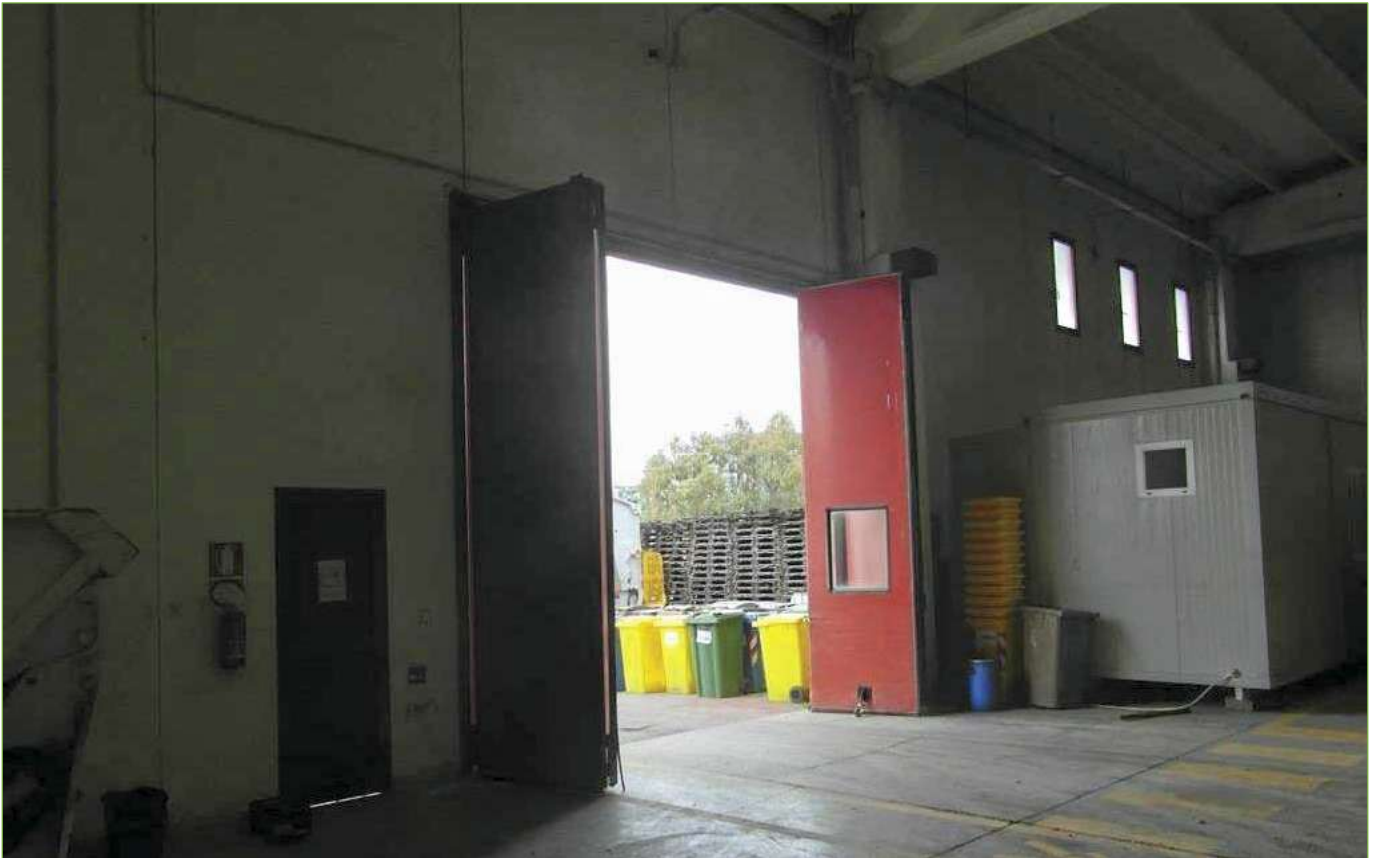
Foto n° 94: Capannone di nuova edificazione (Sub.4) – Portellone di accesso mezzi