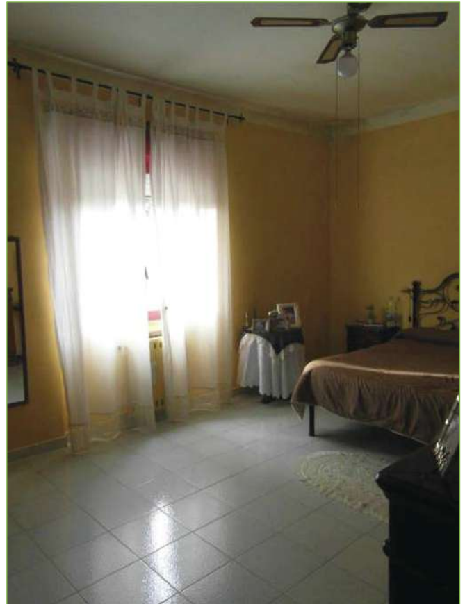
Foto n° 74: Palazzina – Piano I – Camera matrimoniale unità lato Ovest (appartamento Custode)