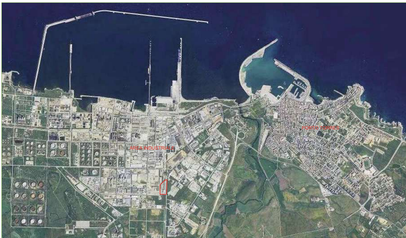
Foto n° 1: Inquadramento territoriale del compendio industriale in esame (fonte SardegnaFotoAeree – immagine anno 2006)