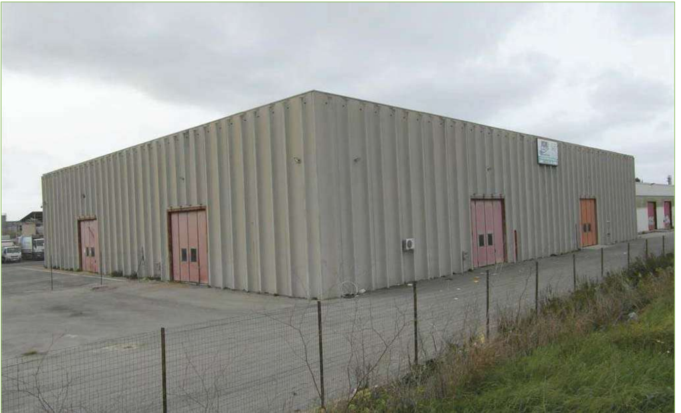
Foto n° 80: Capannone di nuova edificazione – Prospetti Sud ed Est