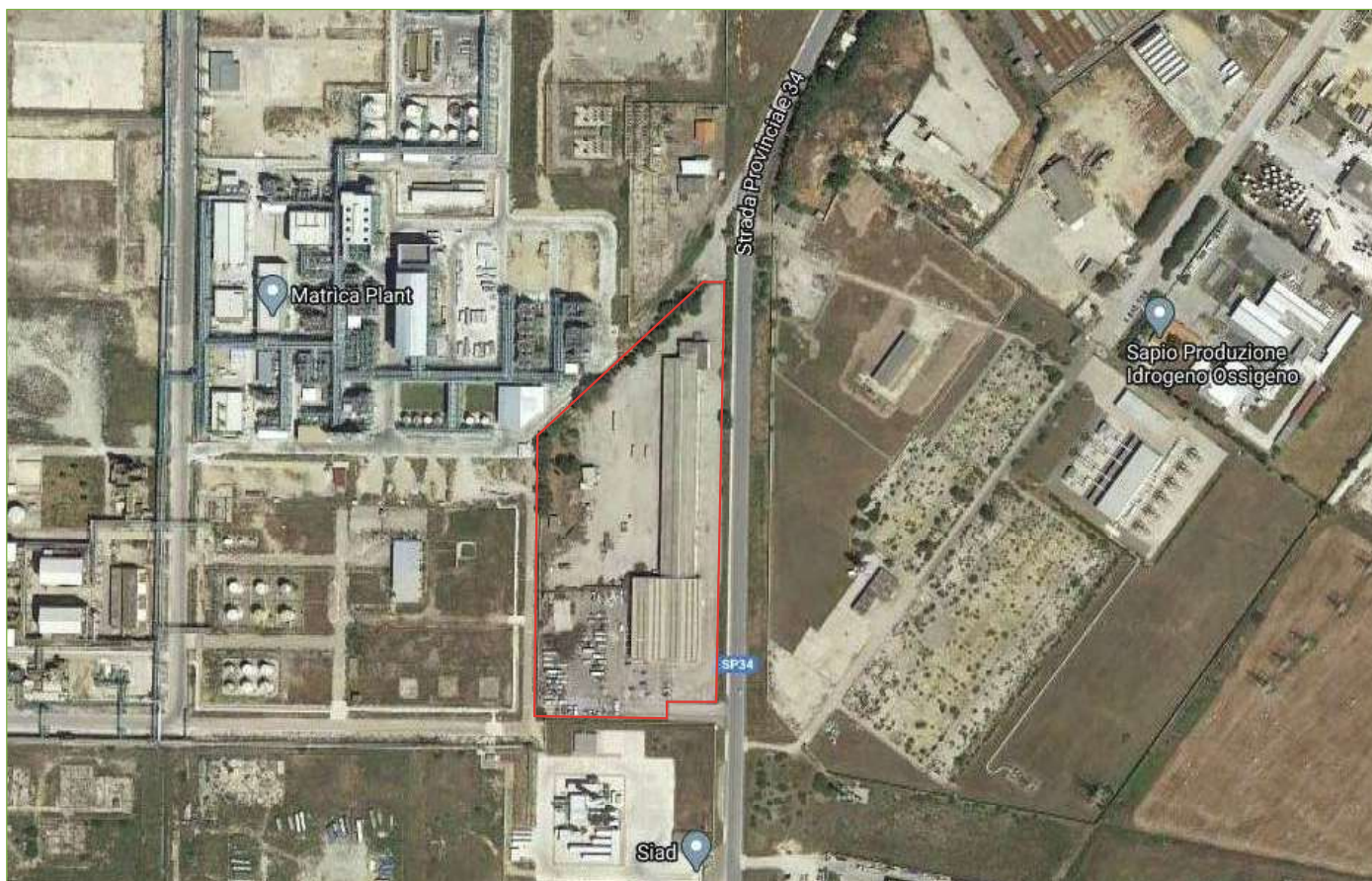
Foto n° 2: Vista aerea del compendio industriale in esame