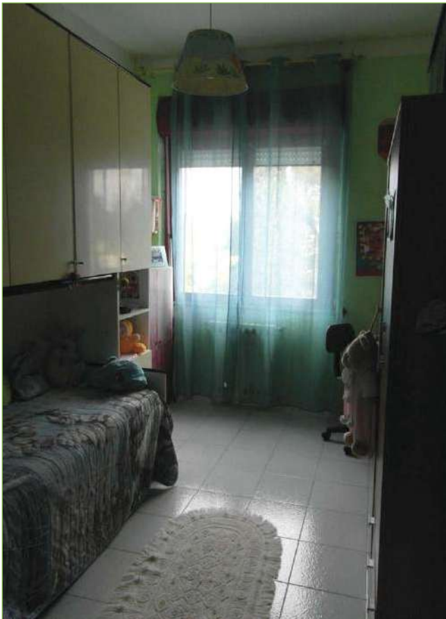
Foto n° 73: Palazzina – Piano I – Camera singola unità lato Ovest (appartamento Custode)