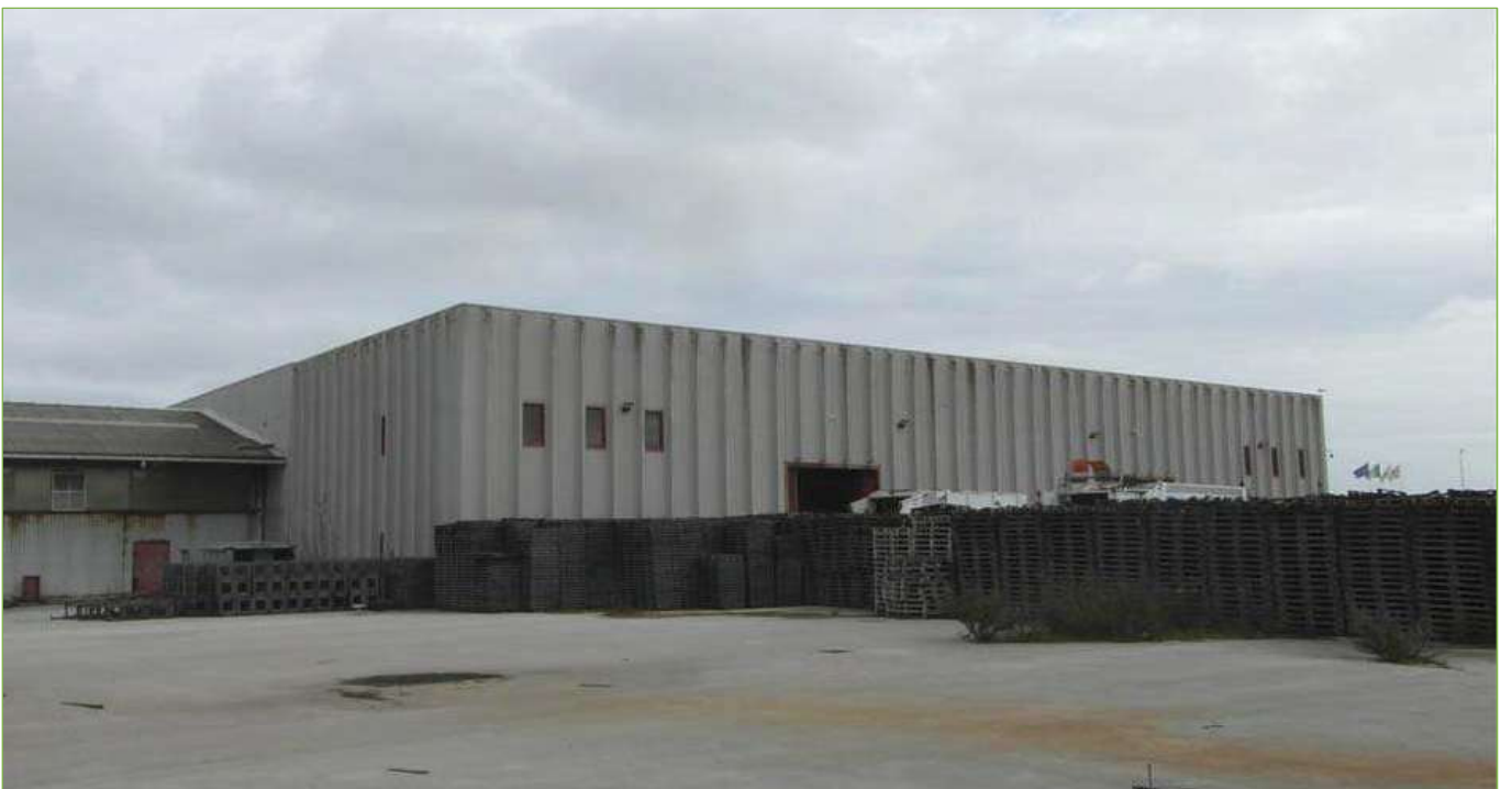
Foto n° 89: Capannone di nuova edificazione – Vista da piazzale Capannone principale (Sub.1)