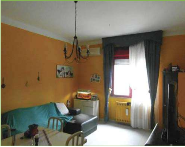
Foto n° 76: Palazzina – Piano I – Soggiorno unità lato Ovest (appartamento Custode)