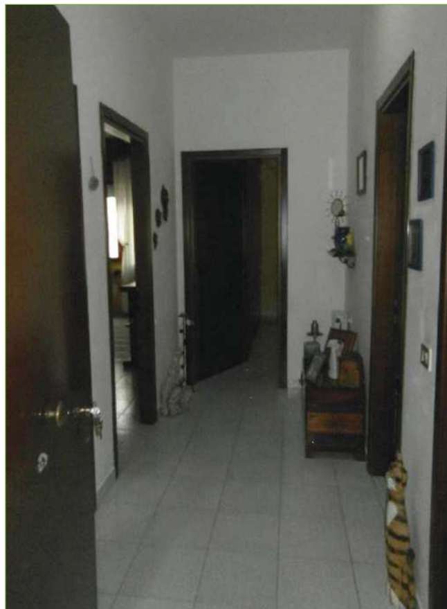
Foto n° 71: Palazzina – Piano I – Disimpegno unità lato Ovest (appartamento Custode)