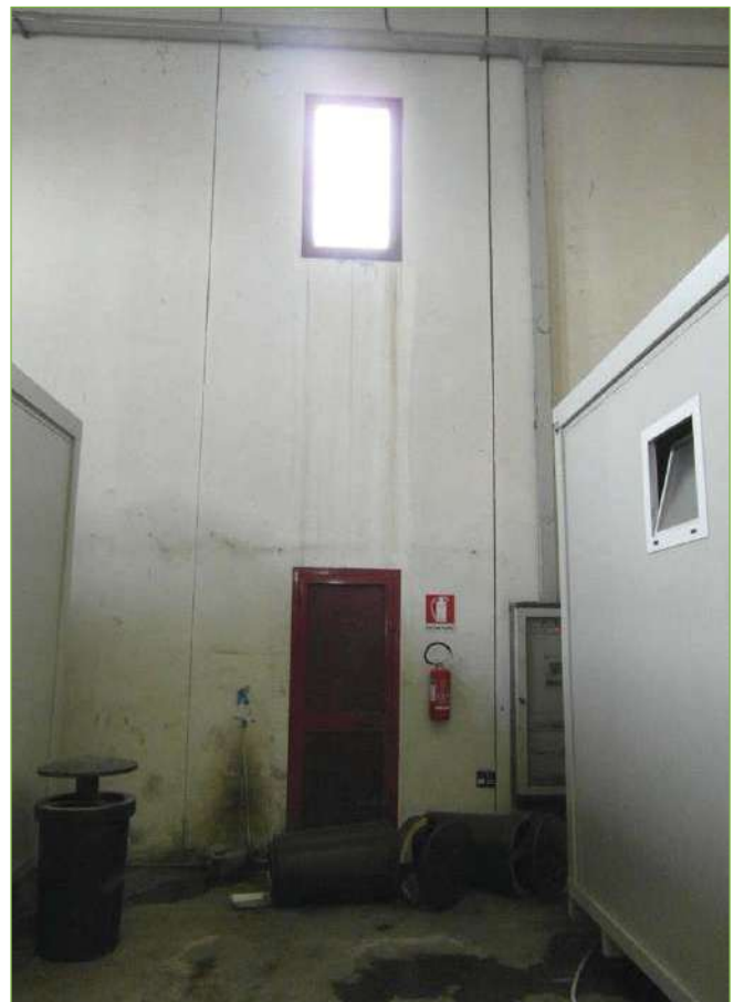
Foto n° 96: Capannone di nuova edificazione – Serramenti lato Nord