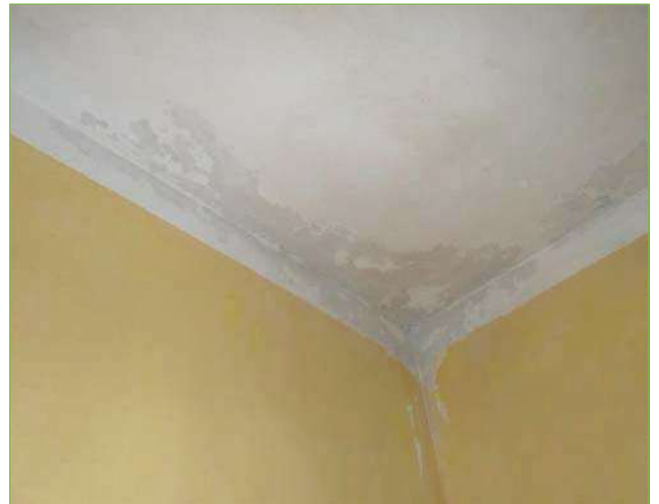
Foto n° 75: Palazzina – Piano I – Camera matrimoniale unità lato Ovest (appartamento Custode) – Macchie umidità