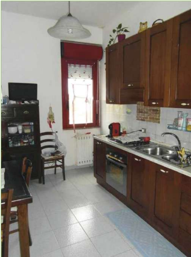
Foto n° 72: Palazzina – Piano I – Cucina unità lato Ovest (appartamento Custode)