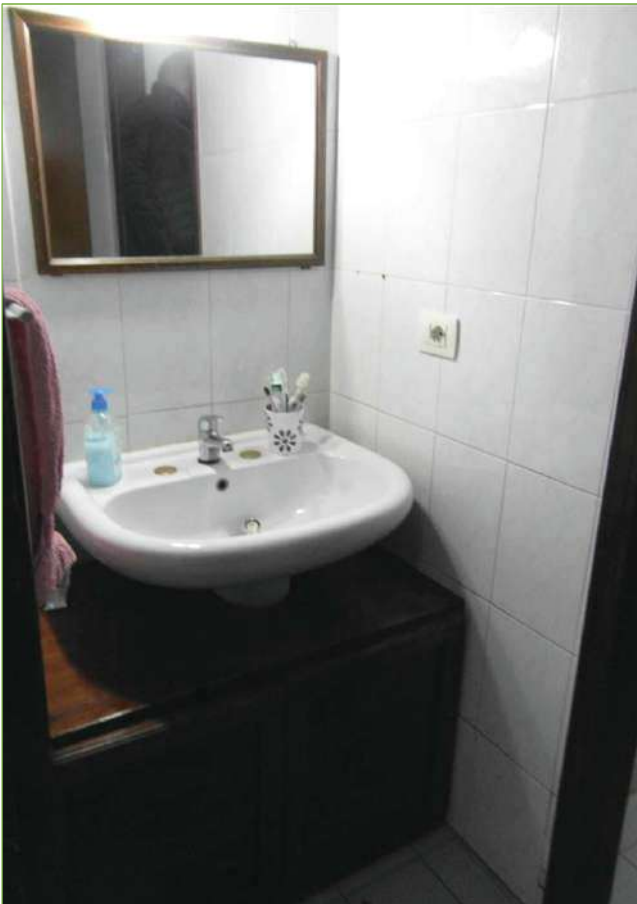
Foto n° 77: Palazzina – Piano I – Antibagno unità lato Ovest (appartamento Custode)