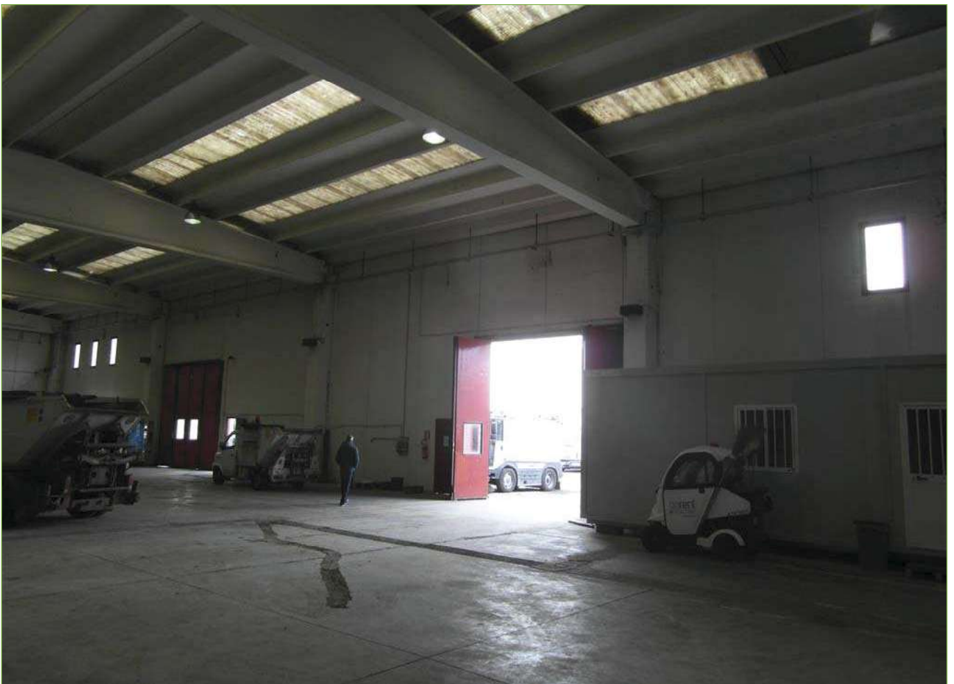
Foto n° 93: Capannone di nuova edificazione (Sub.4) – Portelloni lato Ovest