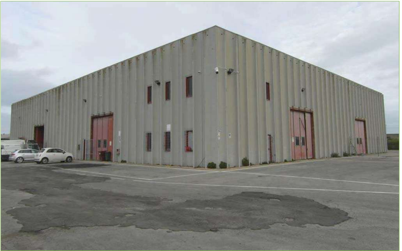
Foto n° 82: Capannone di nuova edificazione – Prospetti Sud ed Ovest