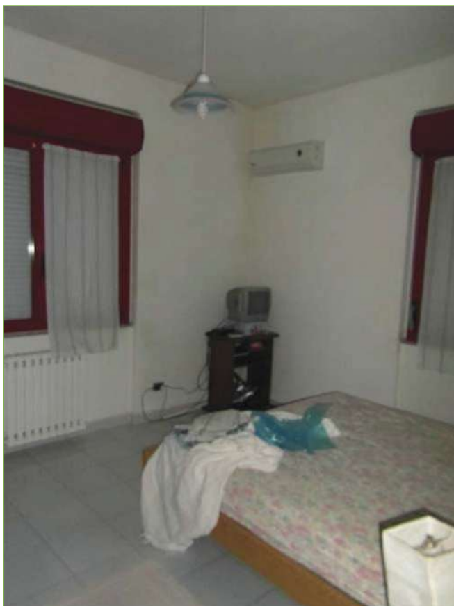
Foto n° 69: Palazzina – Piano I – Camera matrimoniale unità lato Est