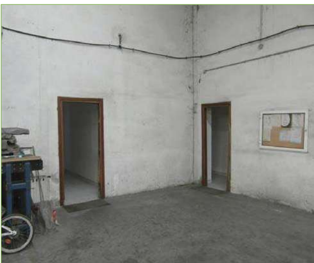
Foto n° 37: Capannone principale – Porte di collegamento alle zone servizi e uffici