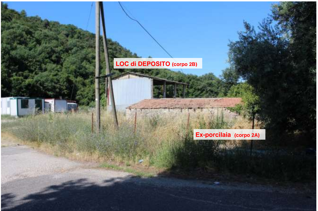
FOTO 09 – Esterno Fg. 89 P.Ila 267 (Locale di deposito ed Ex-porcilaia)