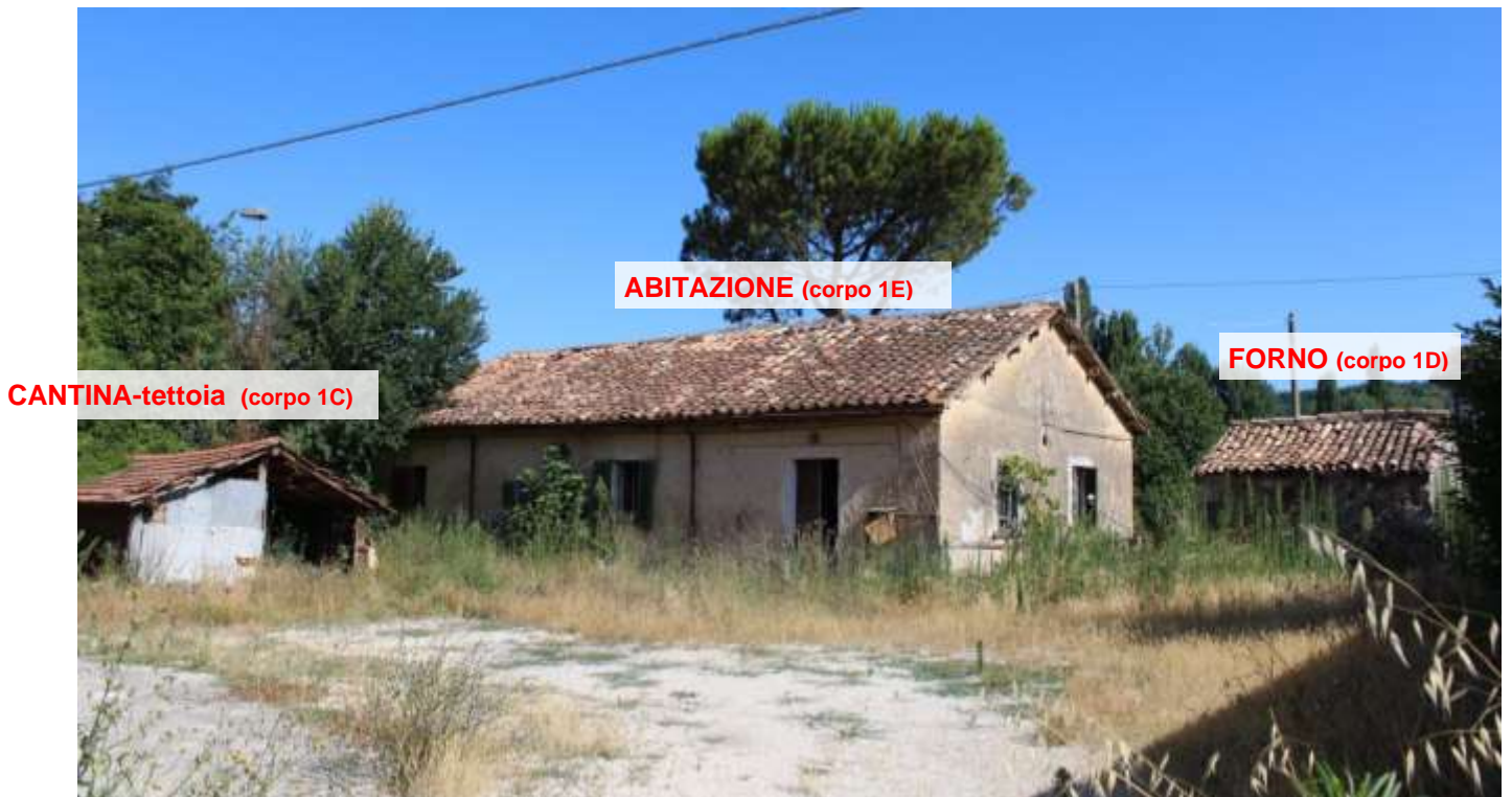
FOTO 01 – Esterno Fg. 89 P.Ila 9 (Abitazione con forno e cantina-tettoia)