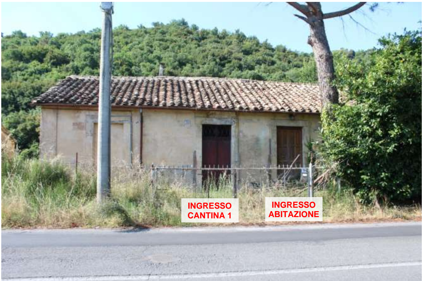
FOTO 07 – Esterno Fg. 89 P.Ila 9 (Abitazione e cantina_1) Corpo 1E