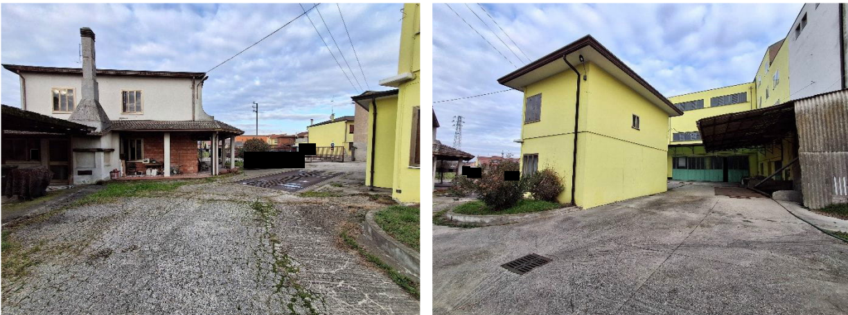
Figura 2: area di corte comune (bcnc sub 6)