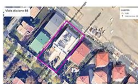
Individuazione accessi e confini