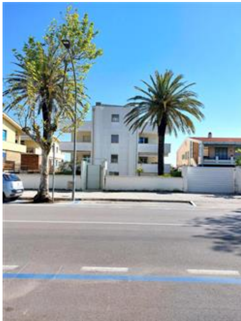
Vista esterna intero fabbricato