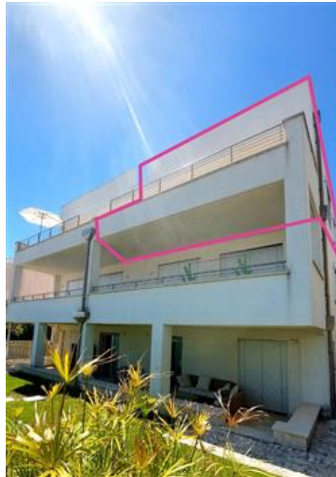
Vista esterno sub 23