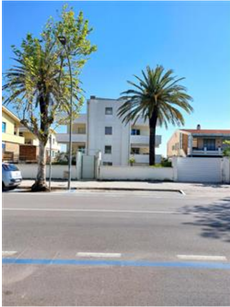
Vista esterna intero fabbricato