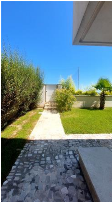
Vista esterna sub 16 - accesso pedonale diretto sull'arenile