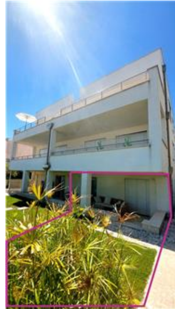
Vista esterna sub 16