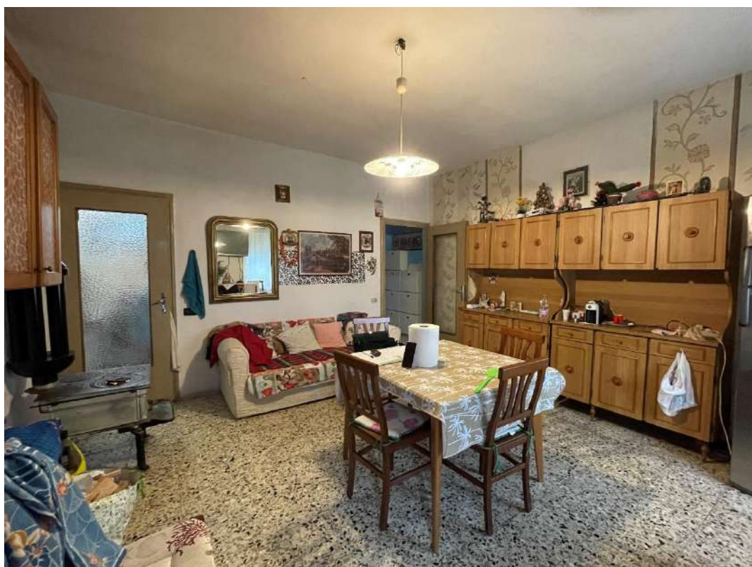
Ingresso - Zona pranzo