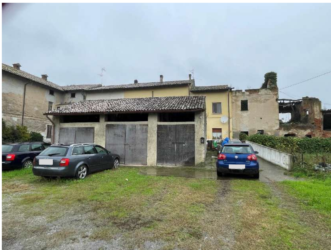
Accesso all'immobile – Area esterna