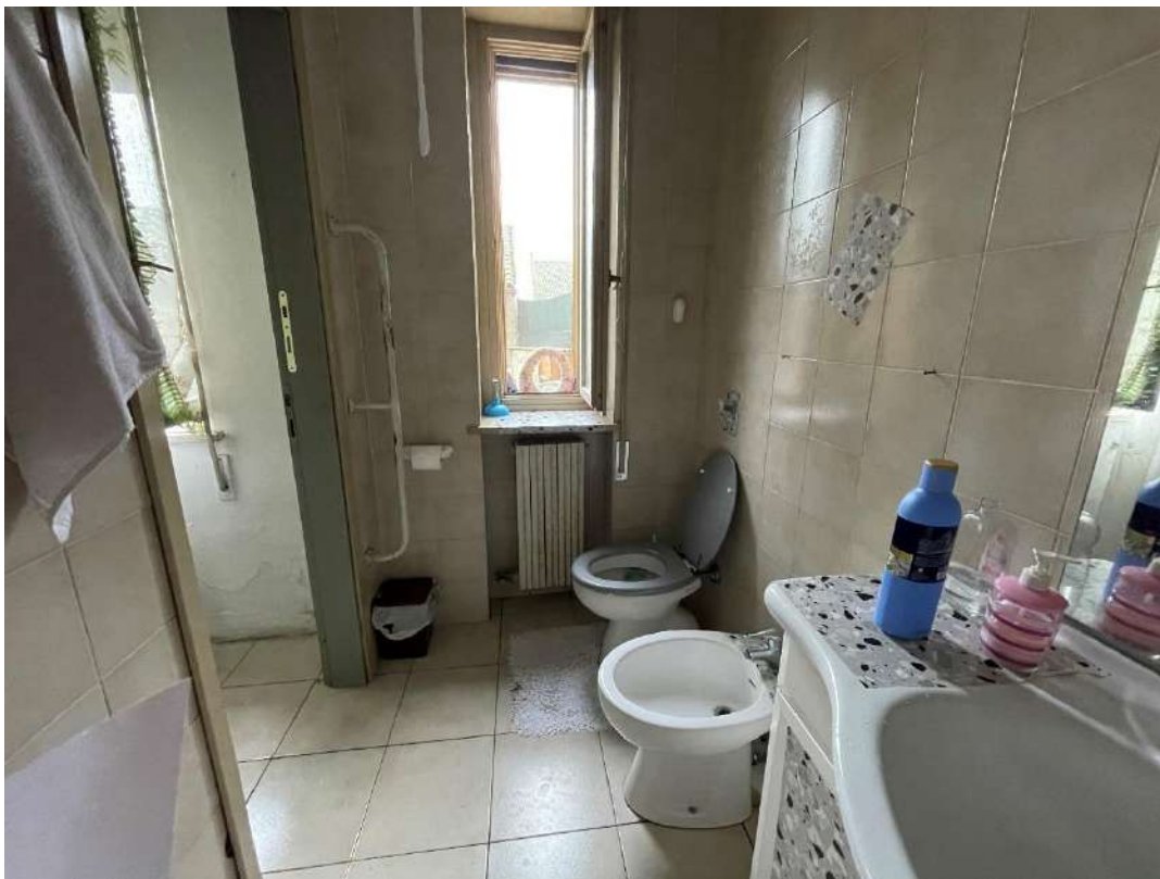
Bagno al piano terra