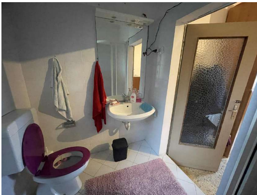
Bgno al piano primo