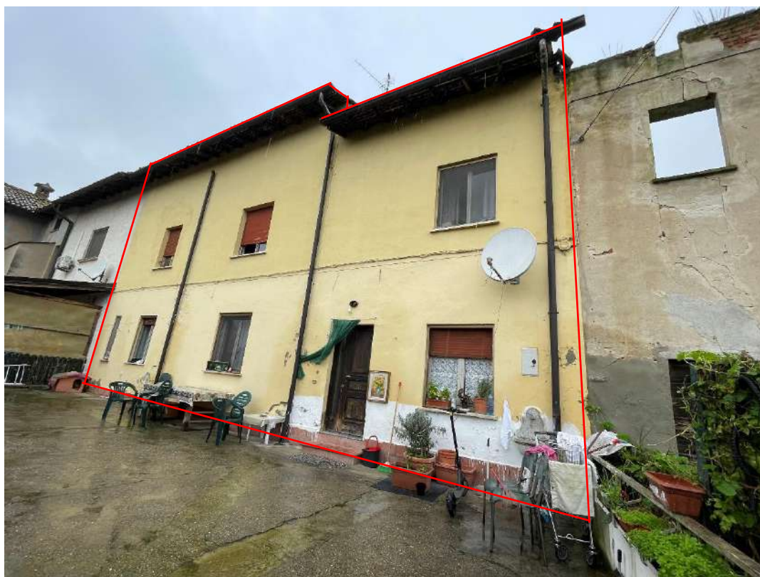
Ingresso unità immobiliare – Individuazione dei beni