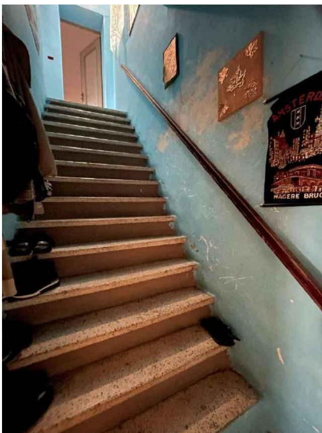
Scala di accesso al piano primo