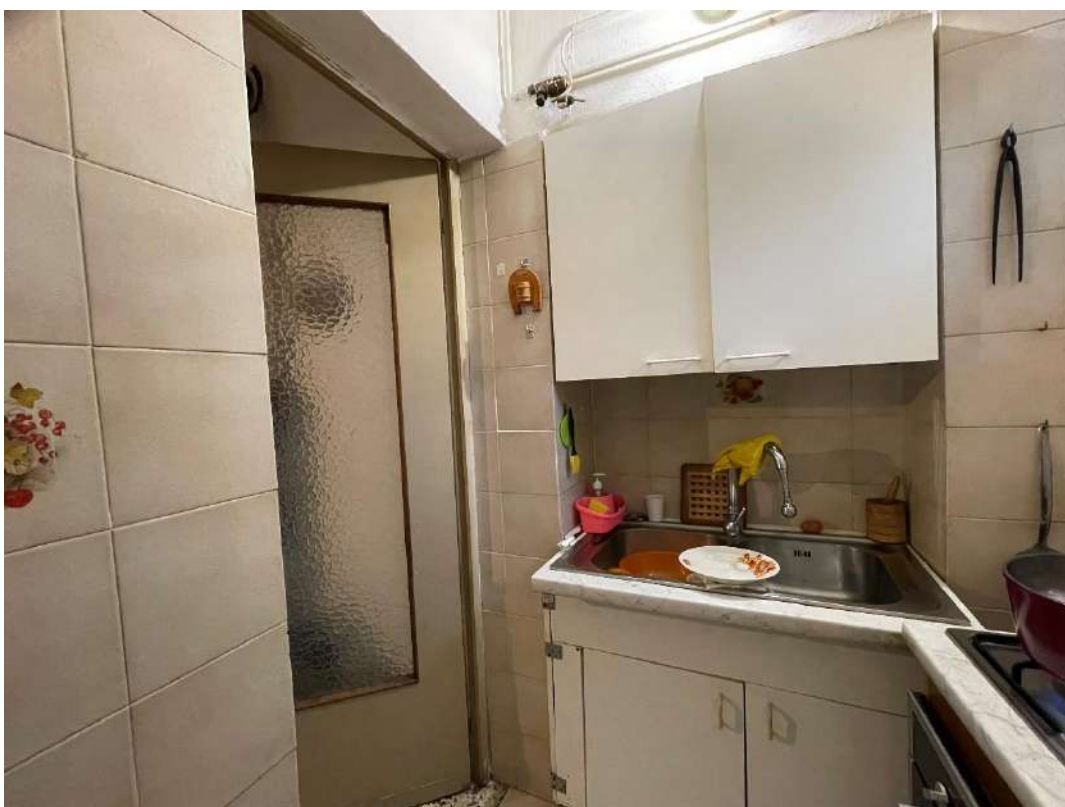
Sottoscala - Zona cottura