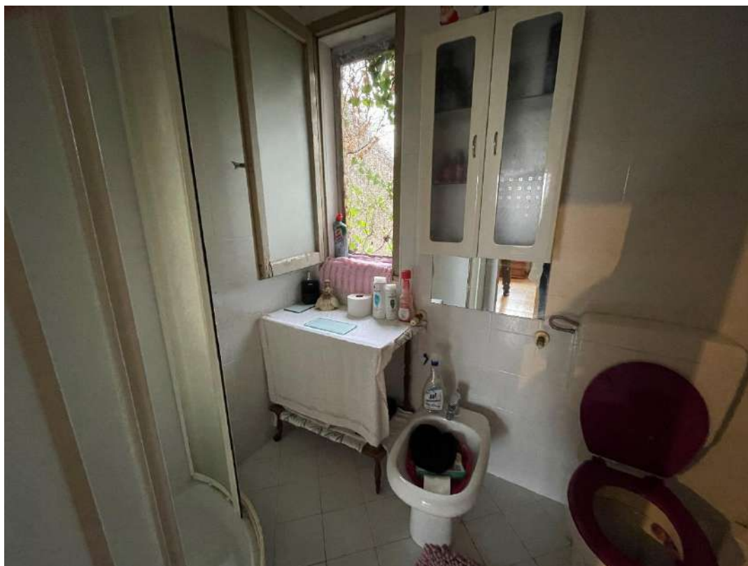
Bagno al piano primo