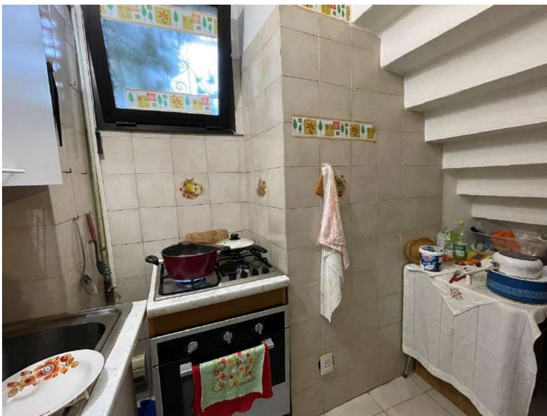
Sottoscala - Zona cottura