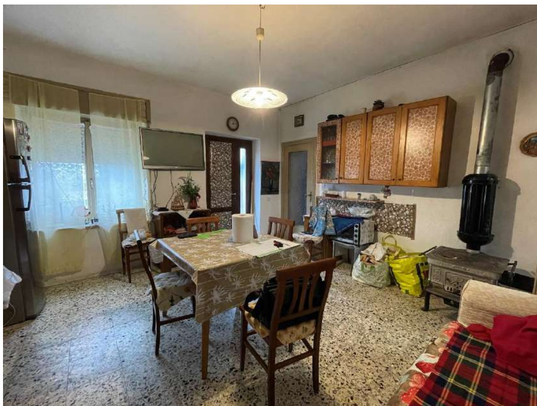
Ingresso - Zona pranzo