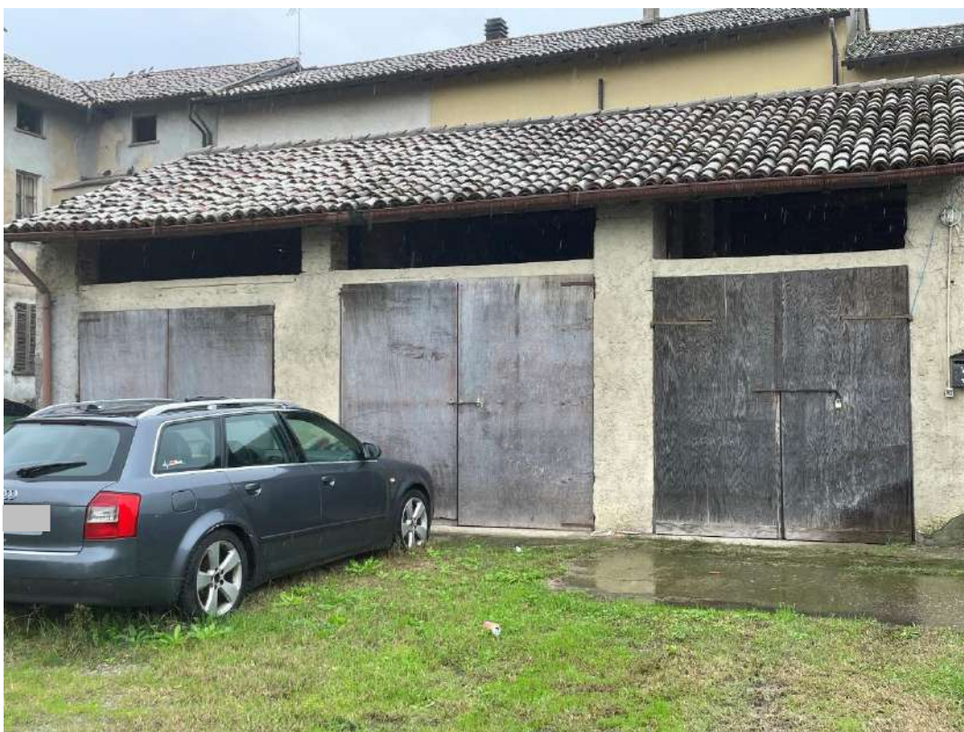
Ripostigli in corpo staccato