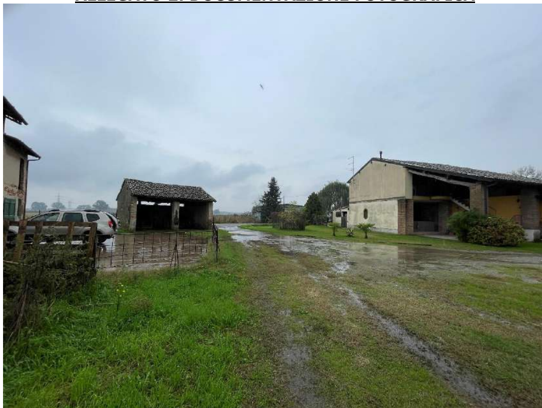
Accesso all'immobile – Area esterna