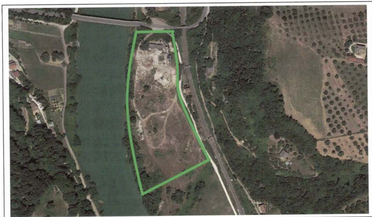
Localizzazione dell'area e dell'Impianto di betonaggio

La viabilità locale, mediamente buona è contraddistinta principalmente dalla Provinciale Via Tiberina (S.P. 15/A), dalla SS 313 e dalla Strada regionale Sabina.