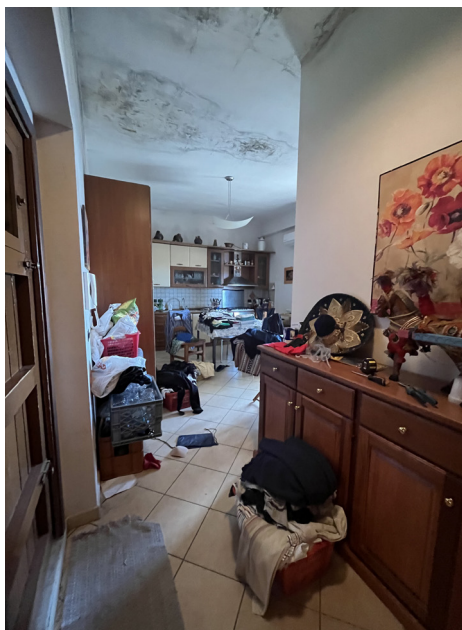
Foto 21 - Vano cucina presente al secondo piano