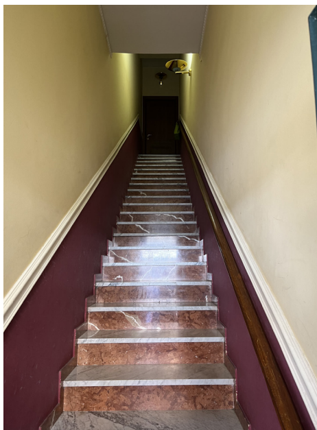
Foto 9 - Scala di collegamento tra il piano tera ed il piano primo