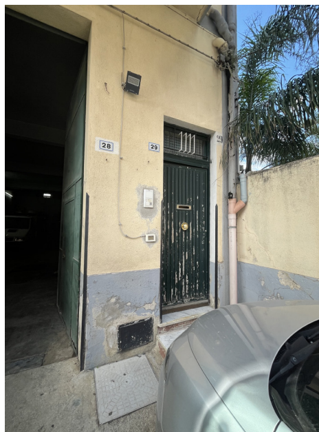
Foto 5 - Portone di accesso al Corpo 2