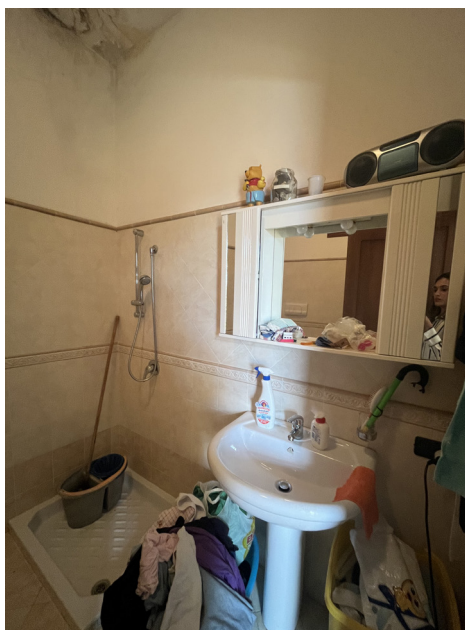
Foto 23 - Servizio igienico