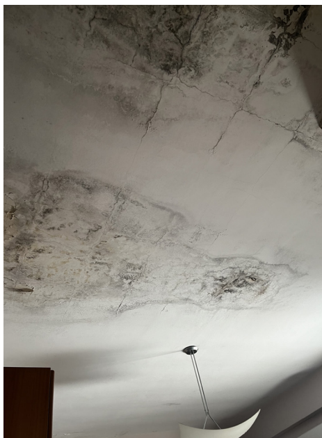
Foto 27 - Ammaloramento presente al secondo piano