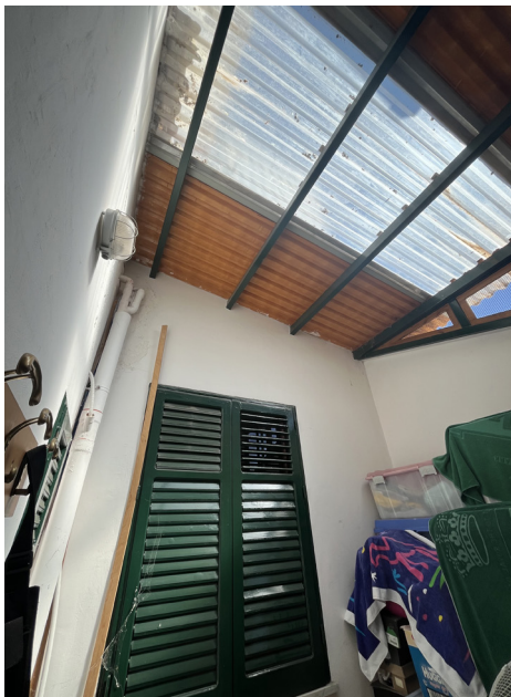
Foto 19 - Pozzo luce