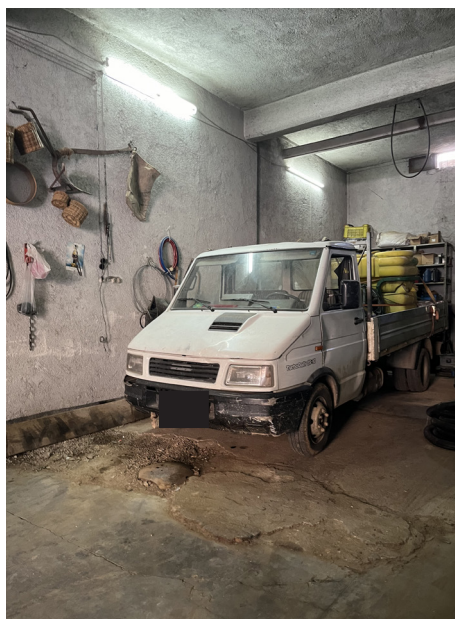
Foto 3 - Vista interna del Corpo 1