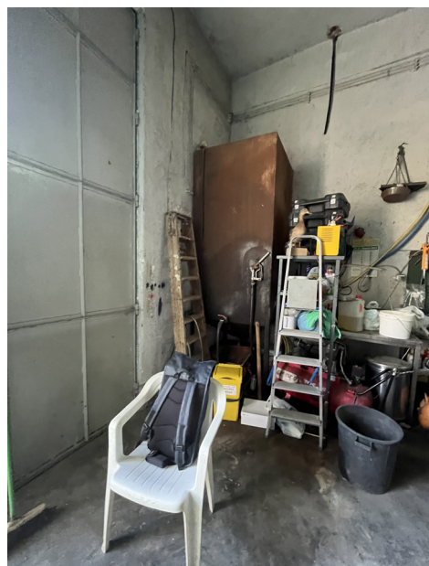
Foto 4 - Vista interna del Corpo 1