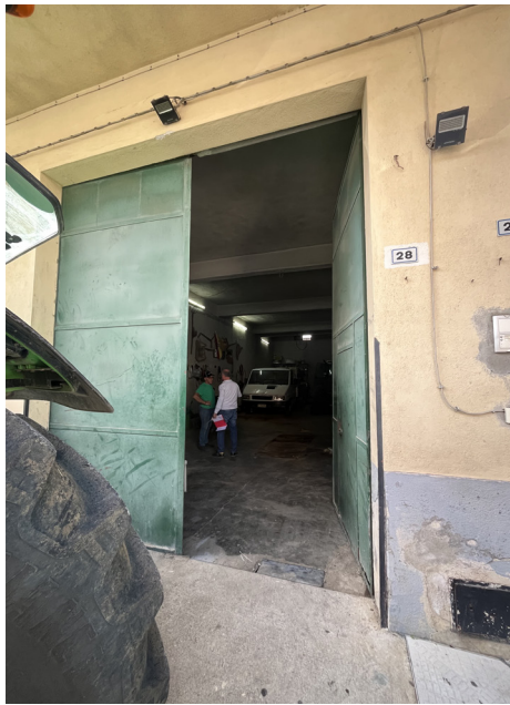
Foto 1 - Accesso al Corpo 1