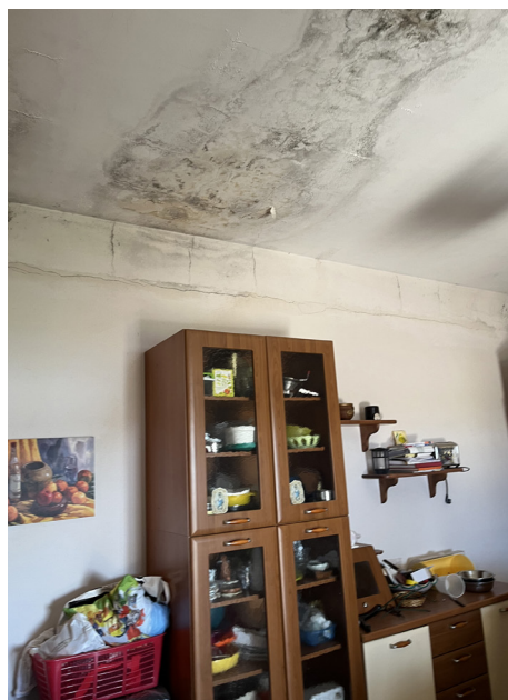
Foto 22 - Ammaloramenti presenti al secondo piano