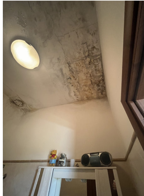
Foto 26 - Ammaloramento presente al secondo piano