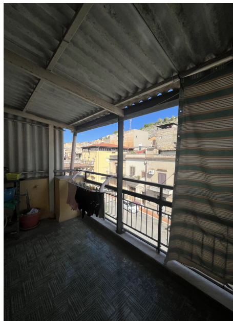
Foto 32 -Terrazza fronte Nord-Est avente copertura in ETERNIT