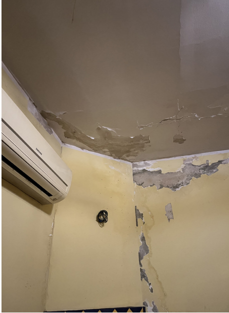
Foto 17 - Ammaloramenti su parete ed intradosso del vano cucina/soggiorno