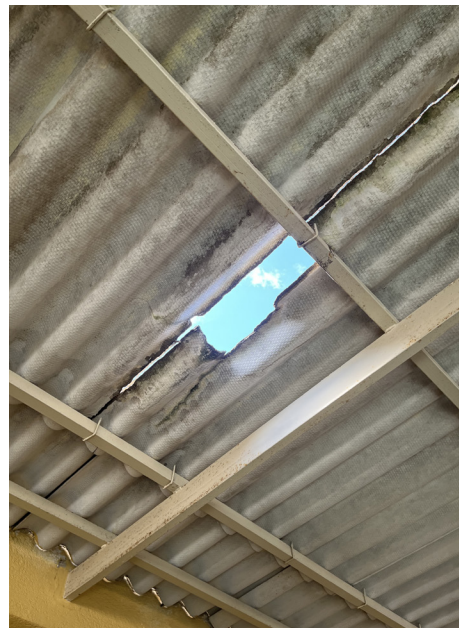
Foto 36 -Ammaloramento riscontrato nella copertura in ETERNIT