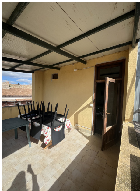
Foto 29 - Terrazza fronte Sud-Ovest