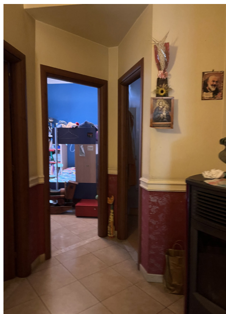
Foto 16 -Disimpegno