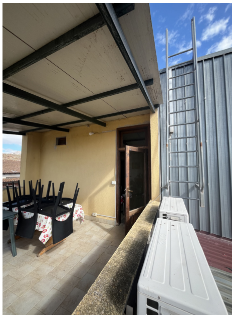
Foto 31 -Terrazza fronte Sud-Ovest