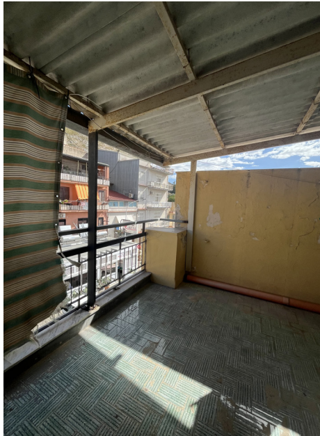
Foto 33 - Terrazza fronte Nord-Est avente copertura in ETERNIT