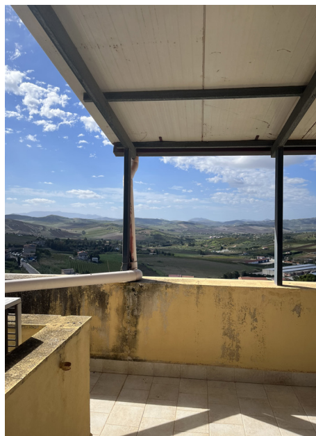
Foto 30 - Terrazza fronte Sud-Ovest