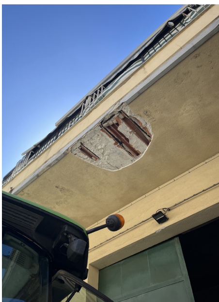
Foto 8 - Ammaloramento dell'intradosso del balcone