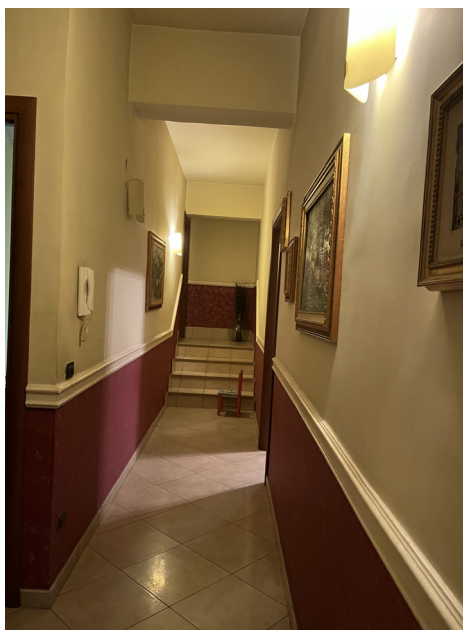
Foto 15 - Disimpegno