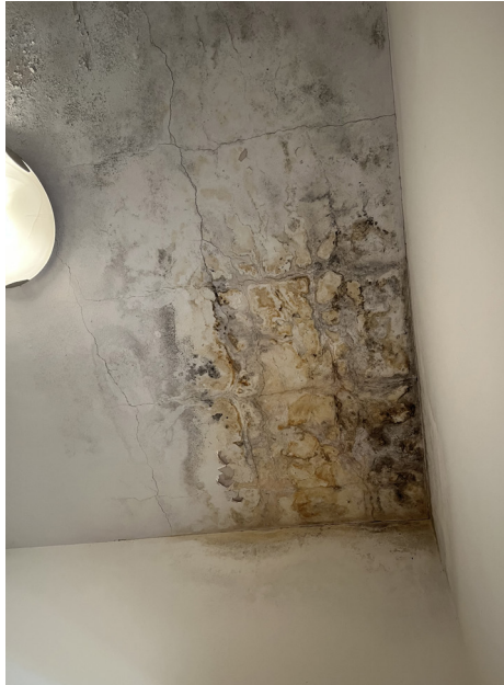
Foto 25 - Ammaloramento presente al secondo piano