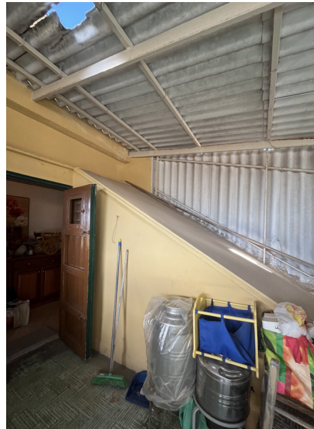
Foto 34 - Terrazza fronte Nord-Est avente copertura in ETERNIT