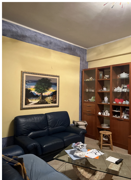
Foto 10 - Vano Soggiorno