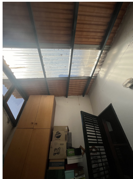
Foto 20 - Pozzo luce