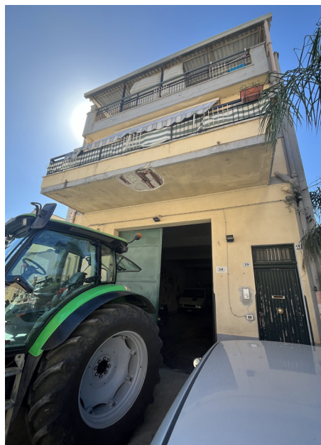
Foto 6 - Fabbricato in cui ricadono i corpi