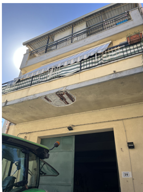
Foto 7 - Fabbricato in cui ricadono i corpi