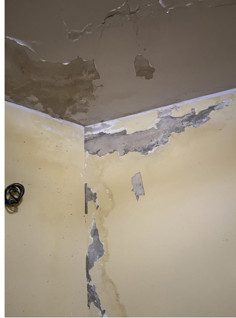
Foto 18 - Ammaloramenti su parete ed intradosso del vano cucina/soggiorno