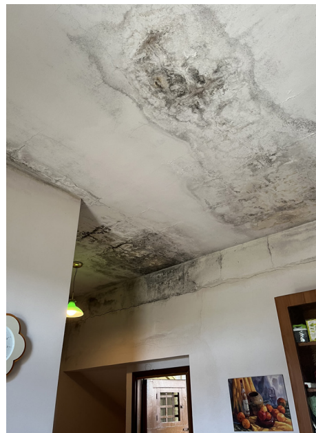
Foto 28 - Ammaloramento presente al secondo piano