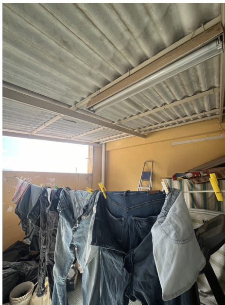
Foto 35 -Terrazza fronte Nord-Est avente copertura in ETERNIT