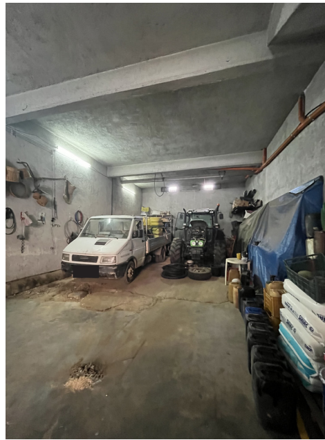
Foto 2 - Vista interna del Corpo 1