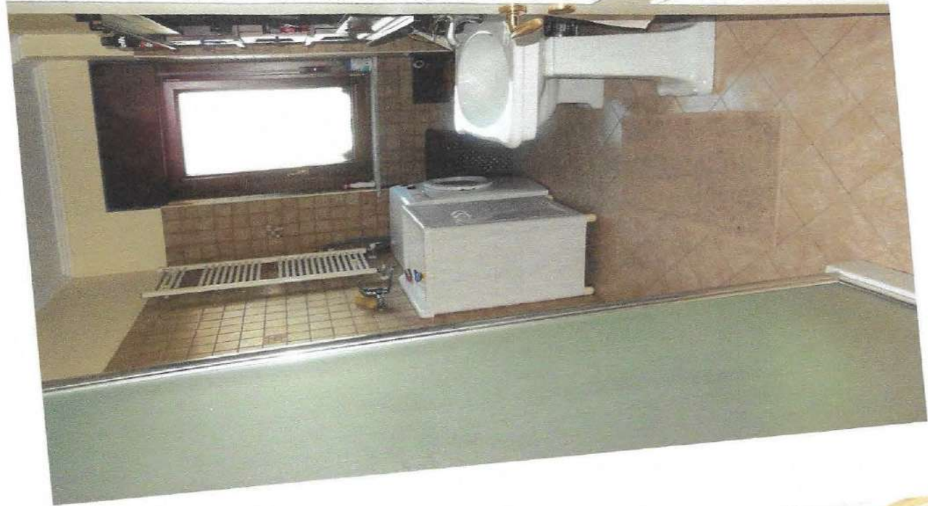
9 - Part. bagno di servizio

INGEGNERI DEL DOTT. [signature] FROSINONE 1919985