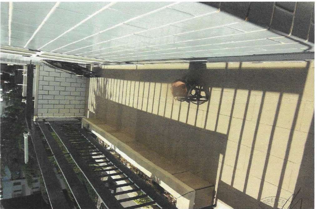
12 – Part. balcone