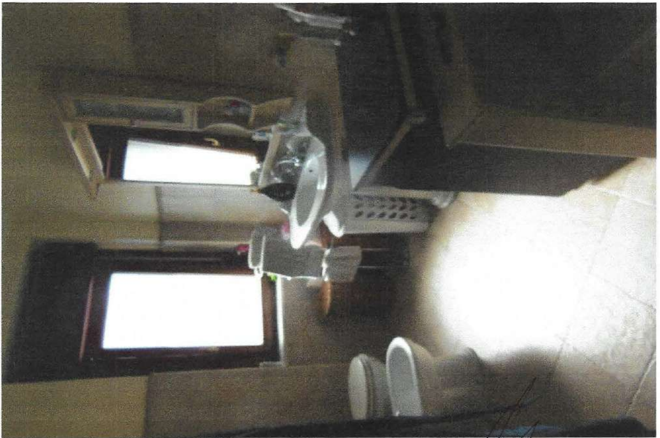
8 – Part. bagno padronale

UFFICIO DELLA CASA E CANTIERI S.p.A. [Signature]