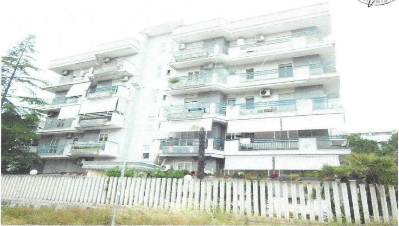
1 – Part. prospetto principale edificio