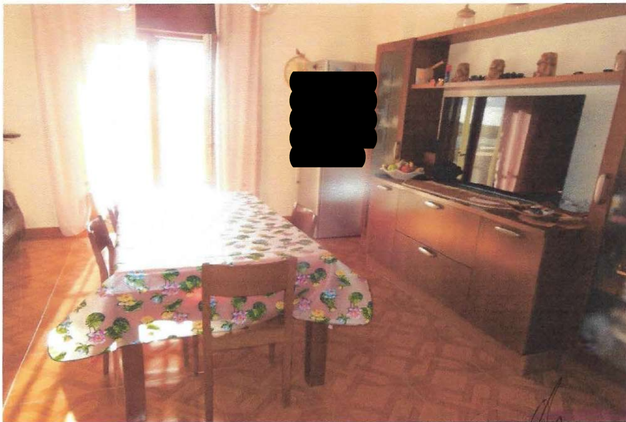
4 – Part. ambiente tinello

PROVINCIA DI ... [Handwritten signature]