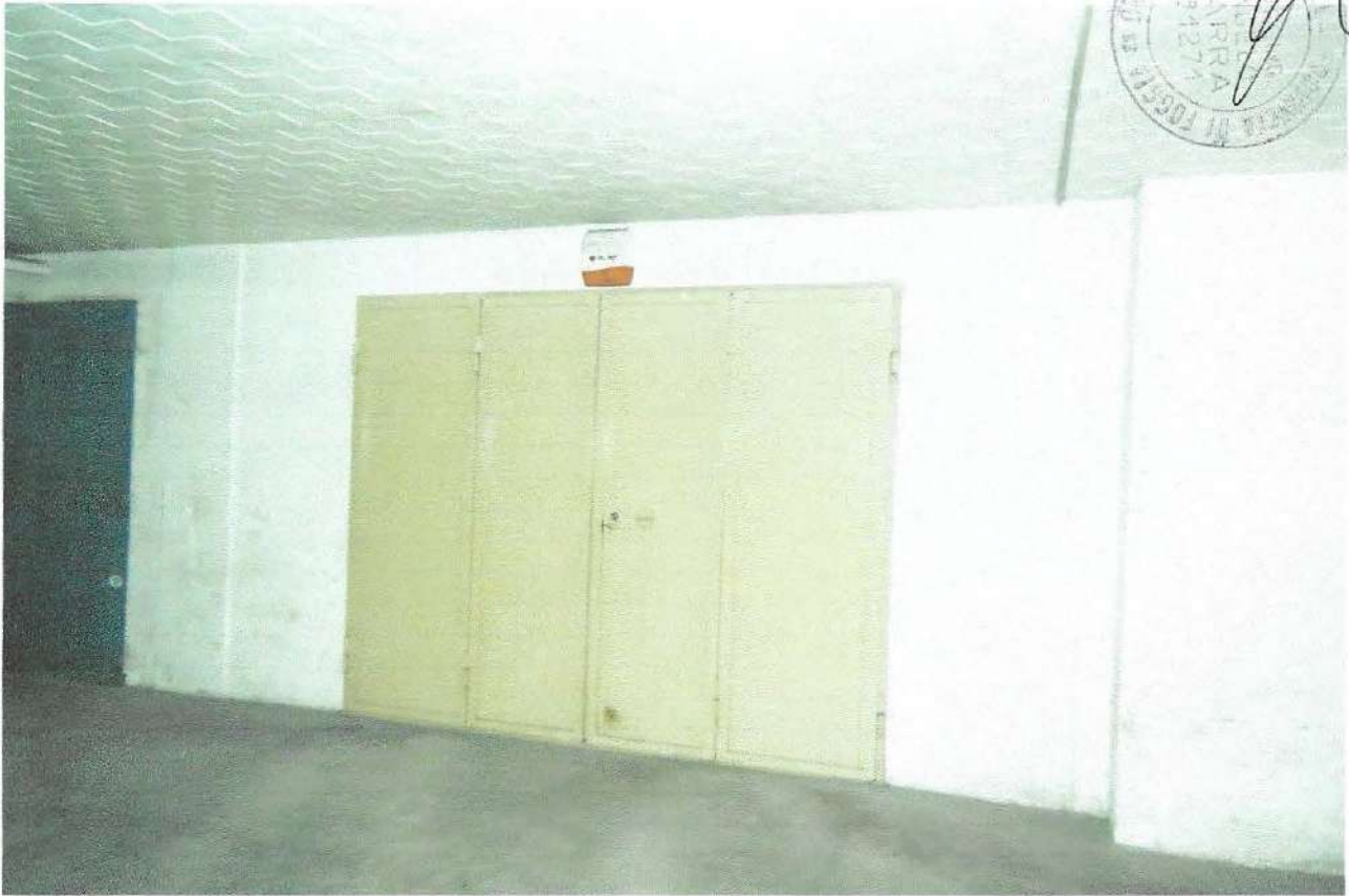
13 – Part. ingresso box