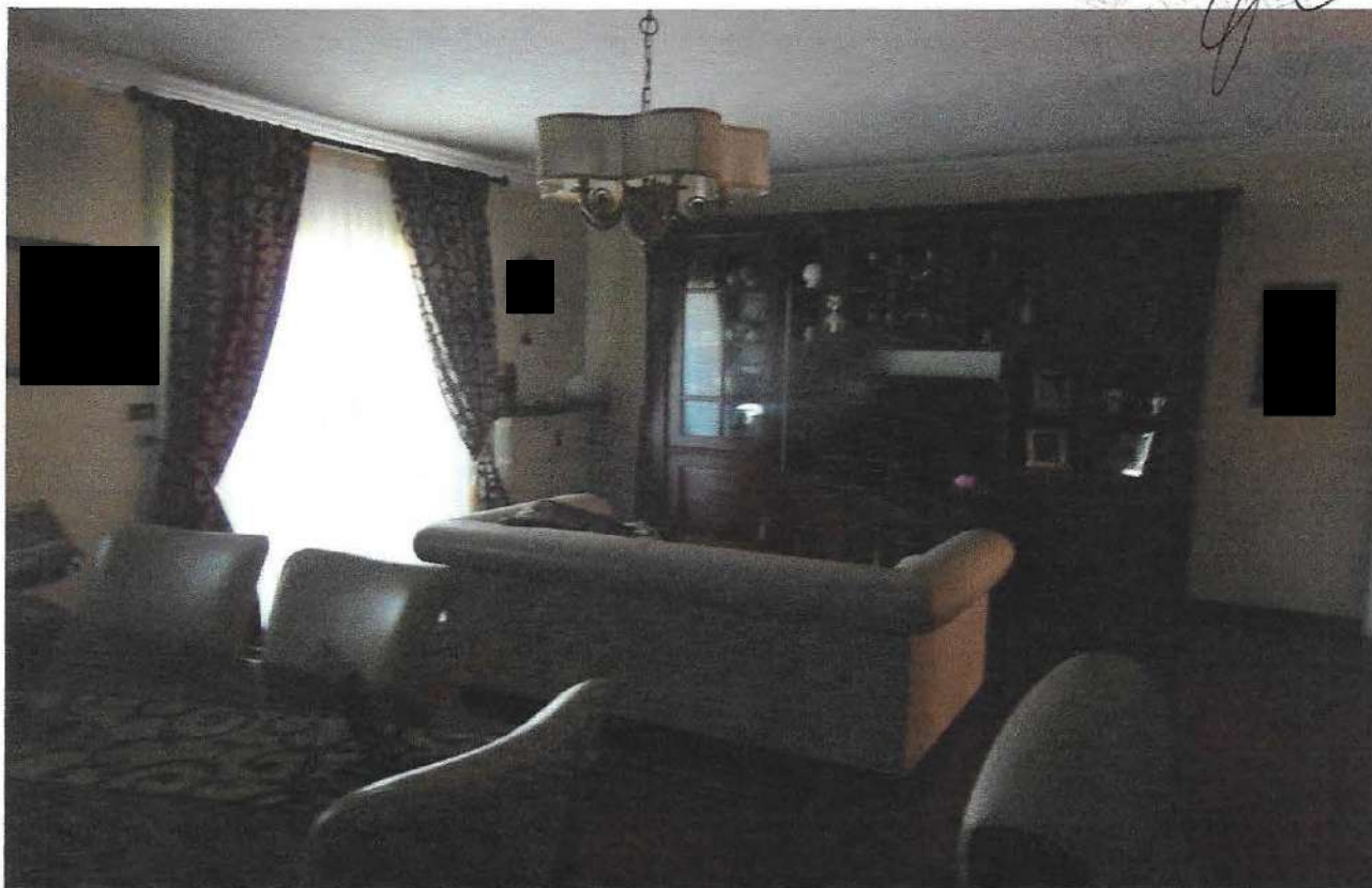
3 – Part. ambiente soggiorno-pranzo

PROVINCIA DI ... [Handwritten signature]