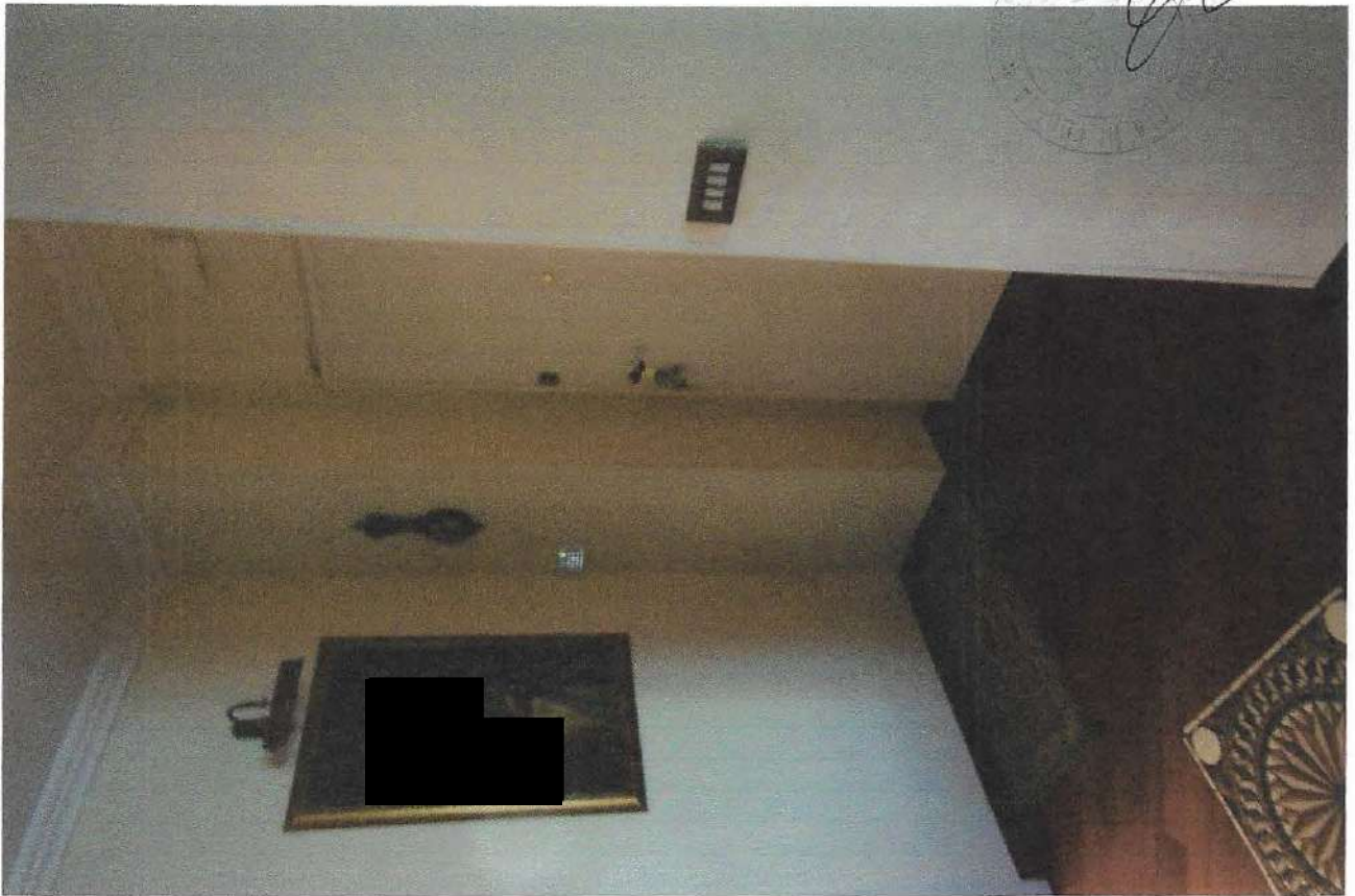
11 – Part. ingresso