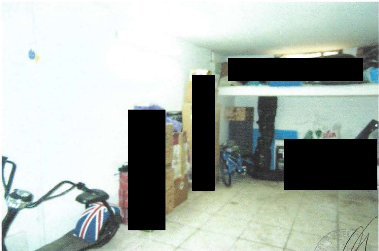
14 – Part. interno box