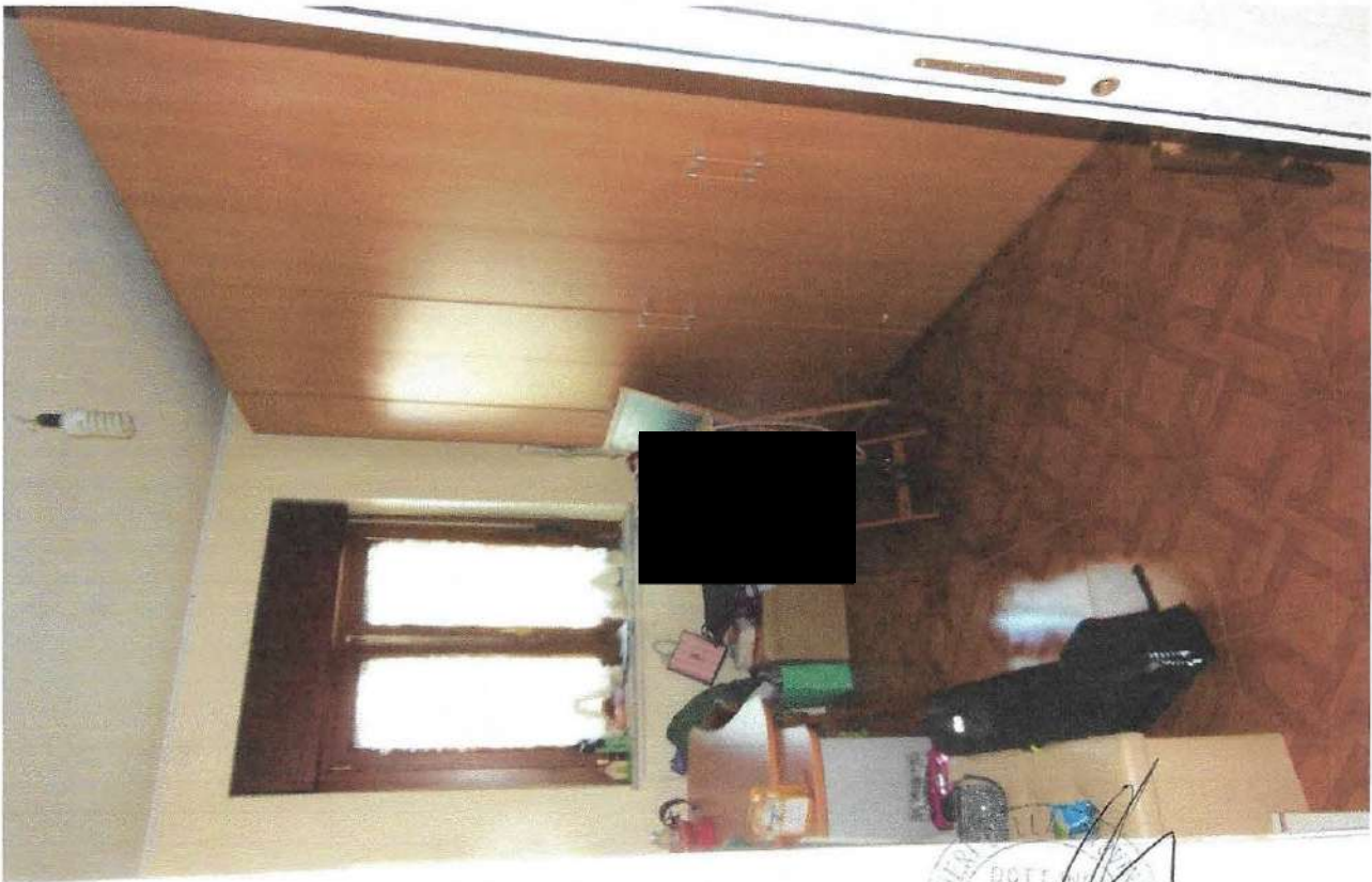
6 – Part. cameretta tipo

PROVINCIA DELLA PROV. DOTT. ANGELO ANGELO