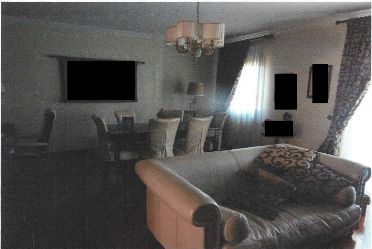
2 – Part. ambiente soggiorno-pranzo