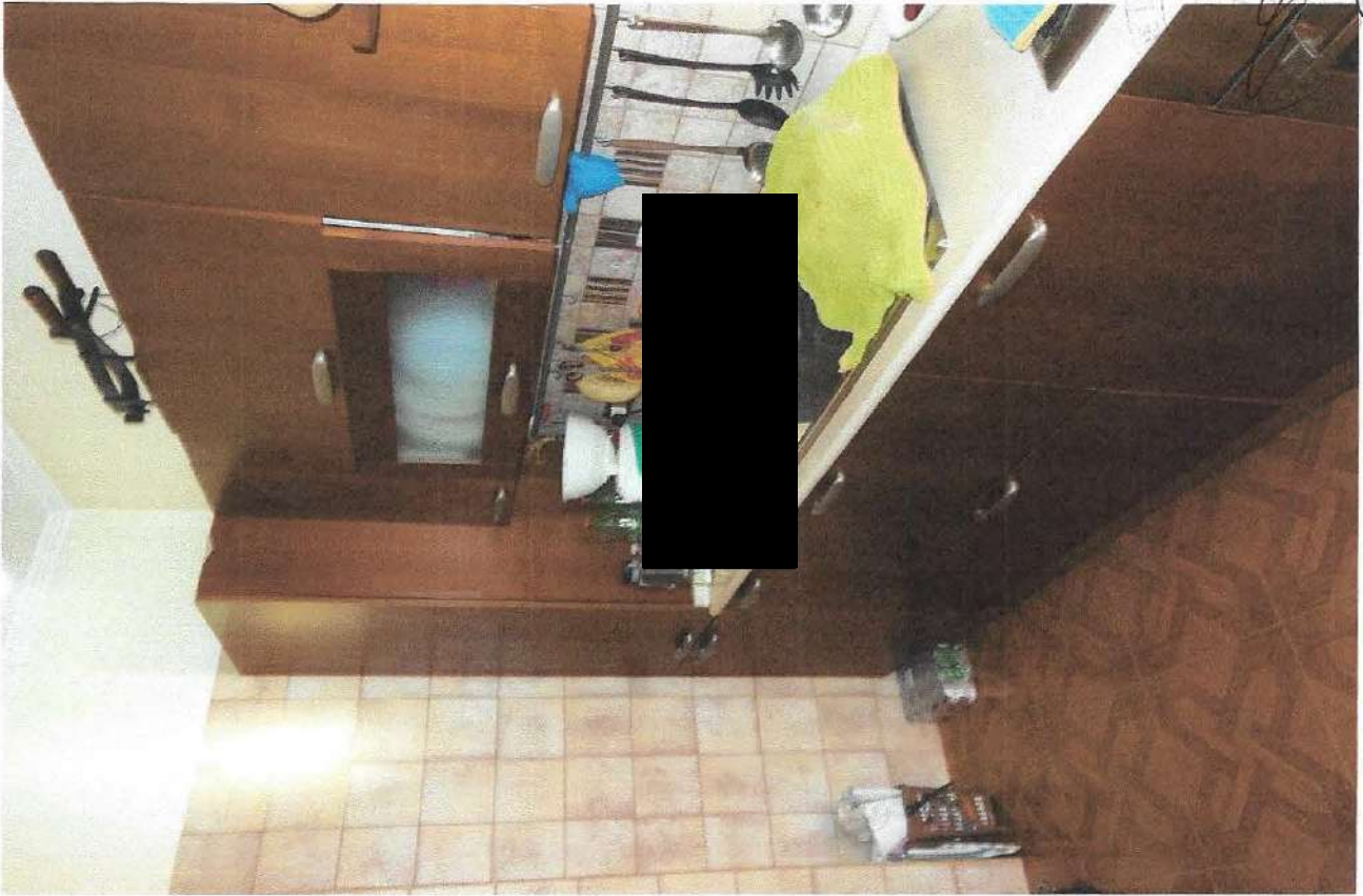
7 – Part. cucina

UFFICIO DELLA CASA E CANTIERI S.p.A. [Signature]