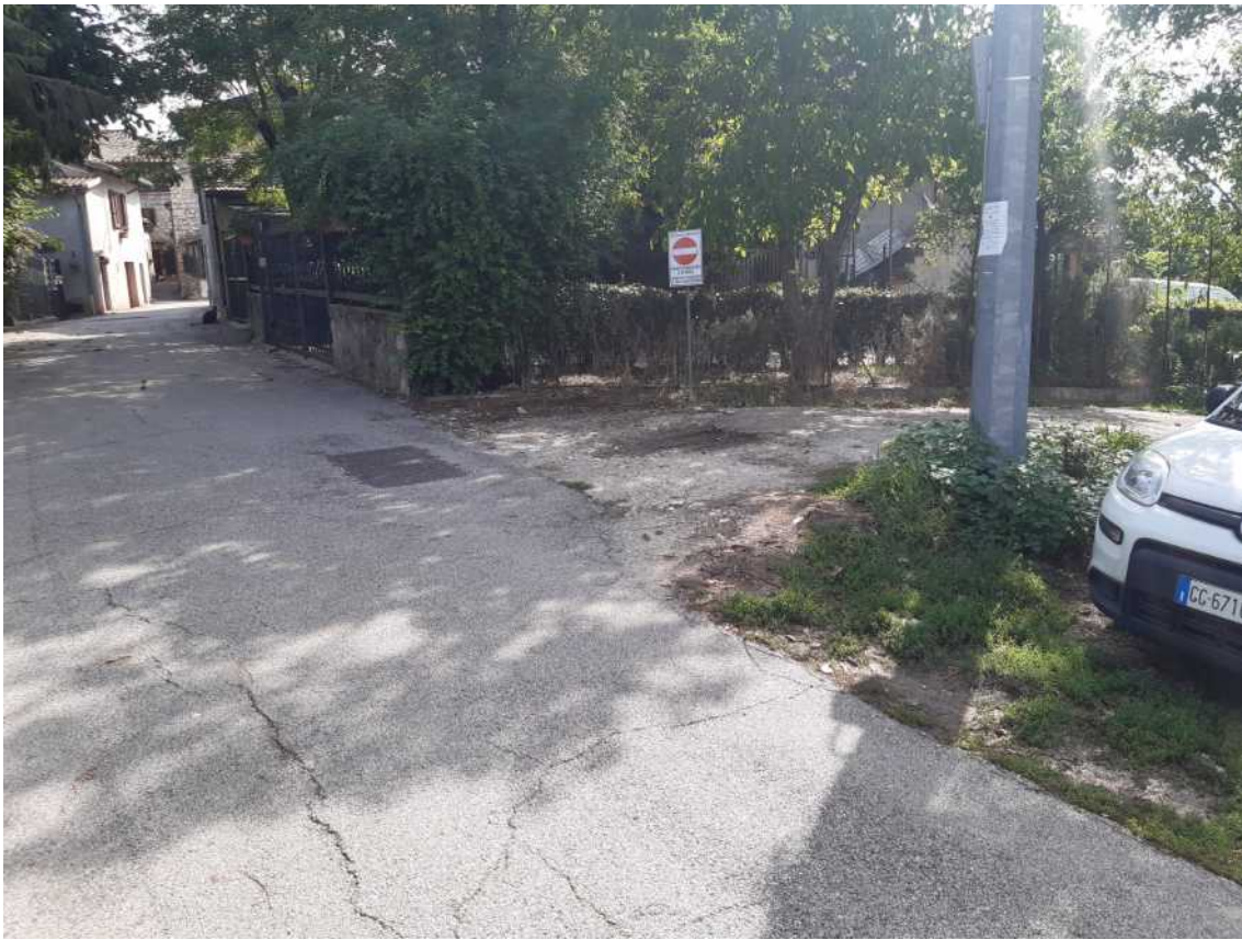
1 ACCESSO STRADA