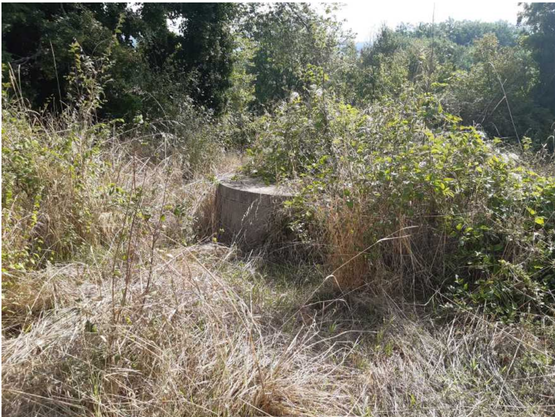
6 FOSSA BIOLOGICA