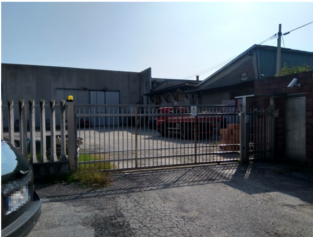
Vista esterna: Ingresso carraio e pedonale al complesso industriale. Via Galvani n. 2.