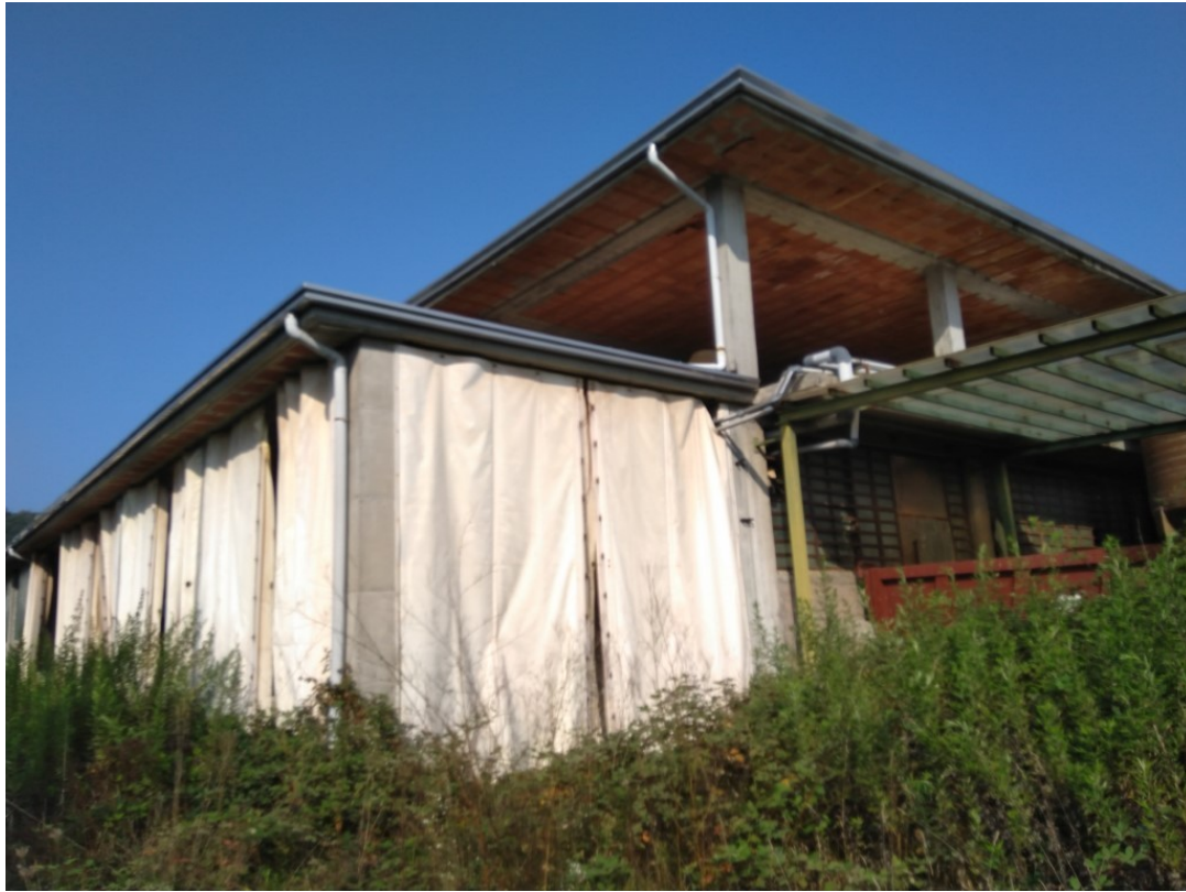
Vista esterna: capannone angolo Sudest