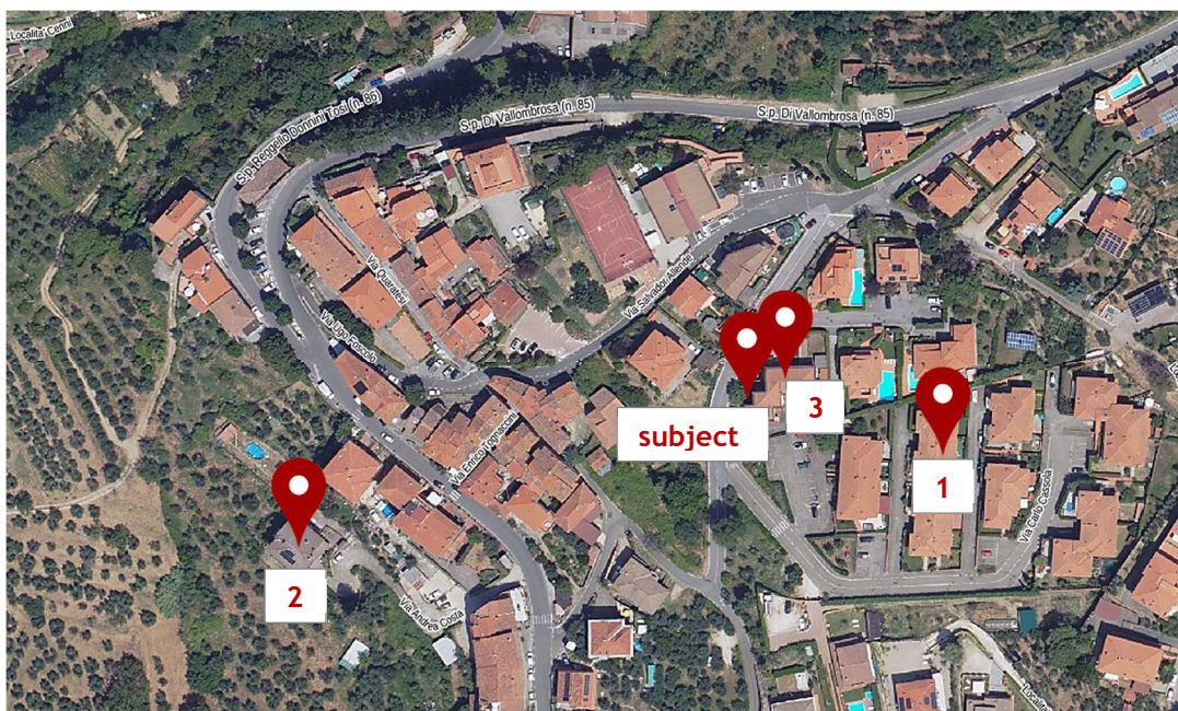
Localizzazione dei comparabili rispetto al bene oggetto di stima ("subject")

Di seguito si riportano i risultati della stima ottenuta con l'ausilio dell'applicativo " Expert Stime " di Geonetwork.