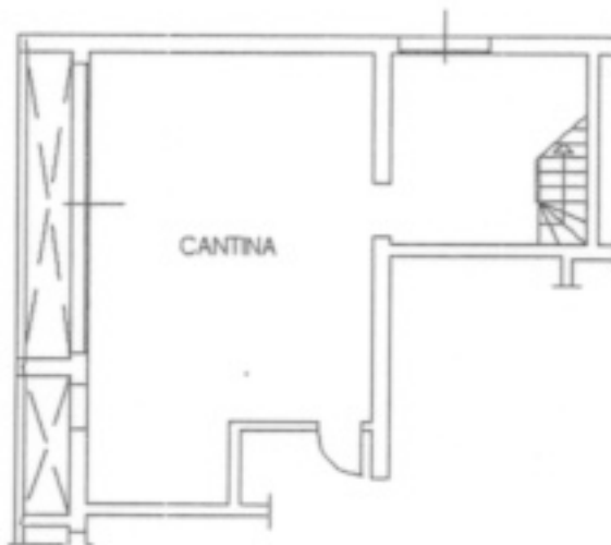
PIANO INTERRATO H=2.50m

COPIA CONFORME AL DOCUMENTO PRESENTATO ALL'U.T.E. DI BOLOGNA IN DATA 23.3.04 PROT. N° 56426 IL TECNICO INCARICATO