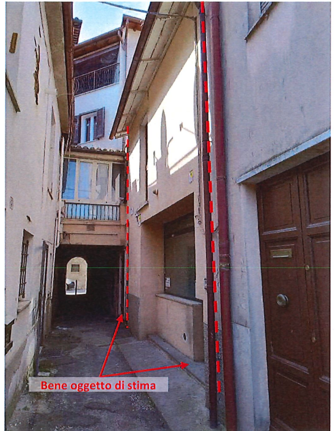
Foto 3 e 4 – Vista esterna ed accesso da vicolo dell' Arco Oscuro