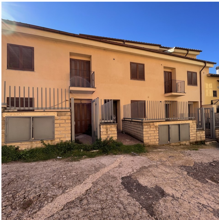
Prospetto frontale edificio con accesso da via del Fontanile