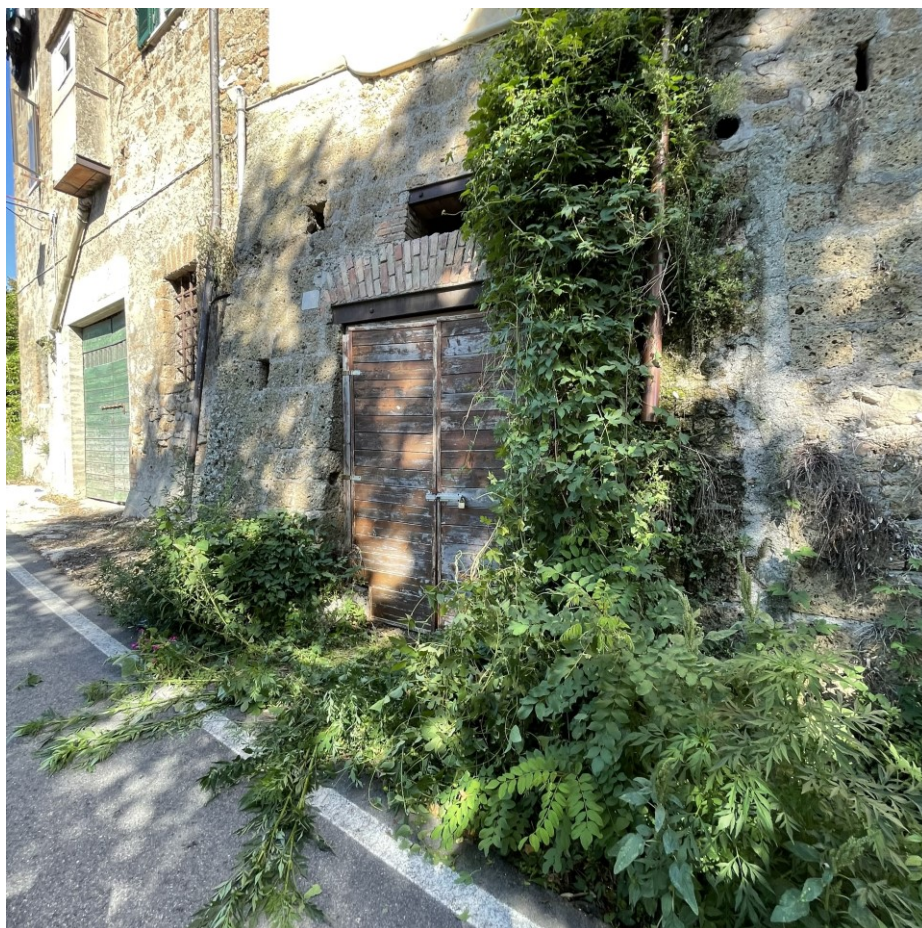
Dettaglio accesso originale magazzino sub1 - pt inf