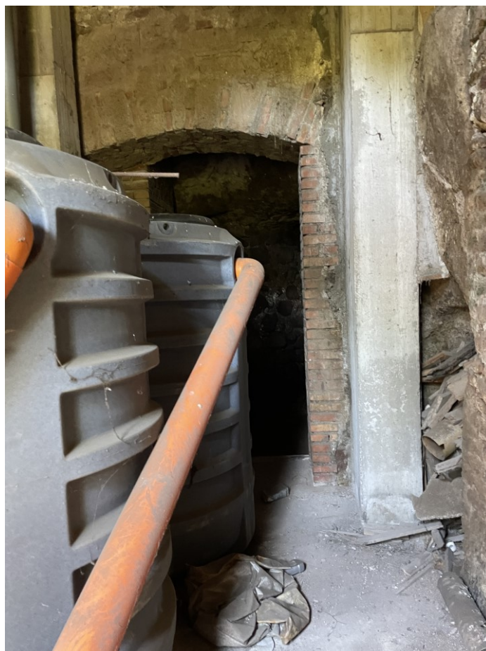
Dettaglio magazzino adibito a locale tecnico – cat C/6