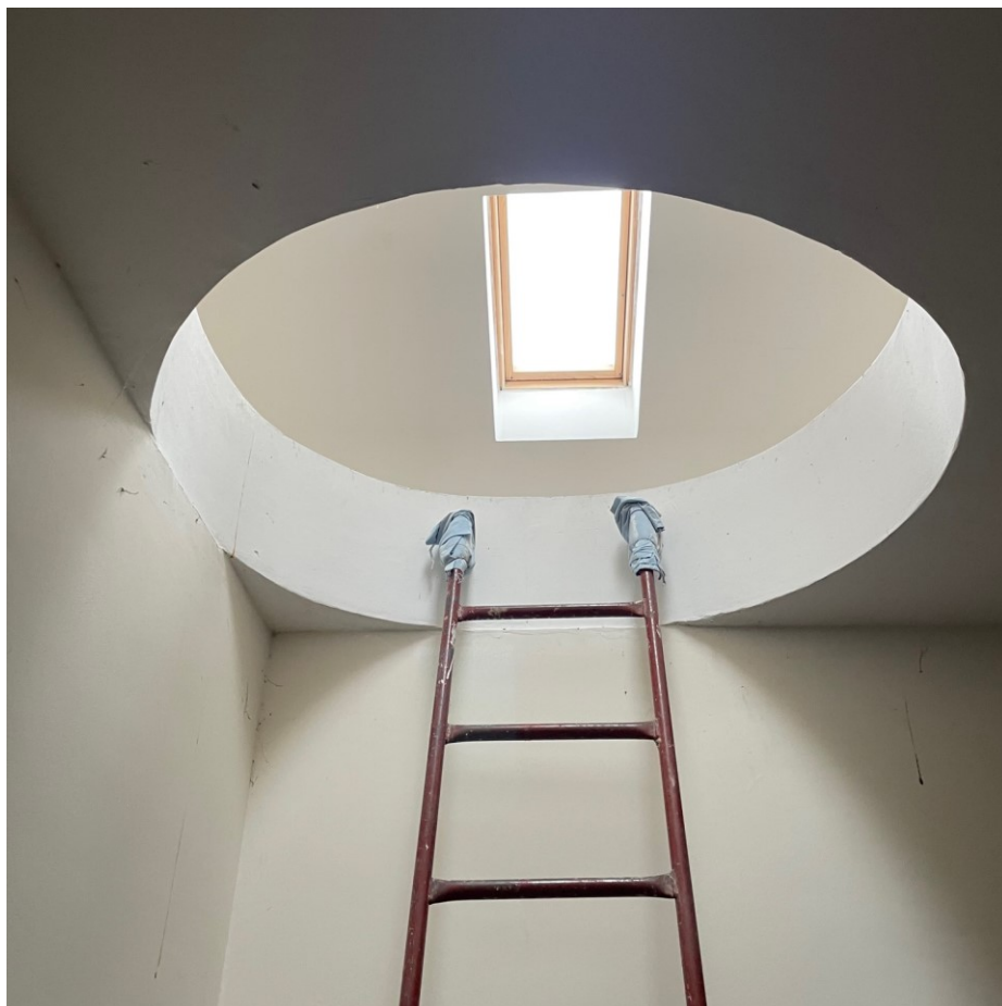
Dettaglio collegamento interno in completamento – cat F/3