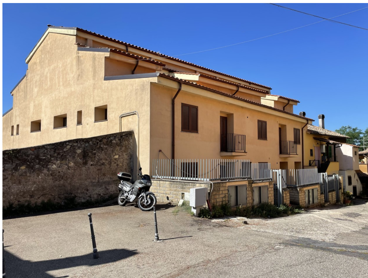
Fabbricato residenziale ex-opificio staggio