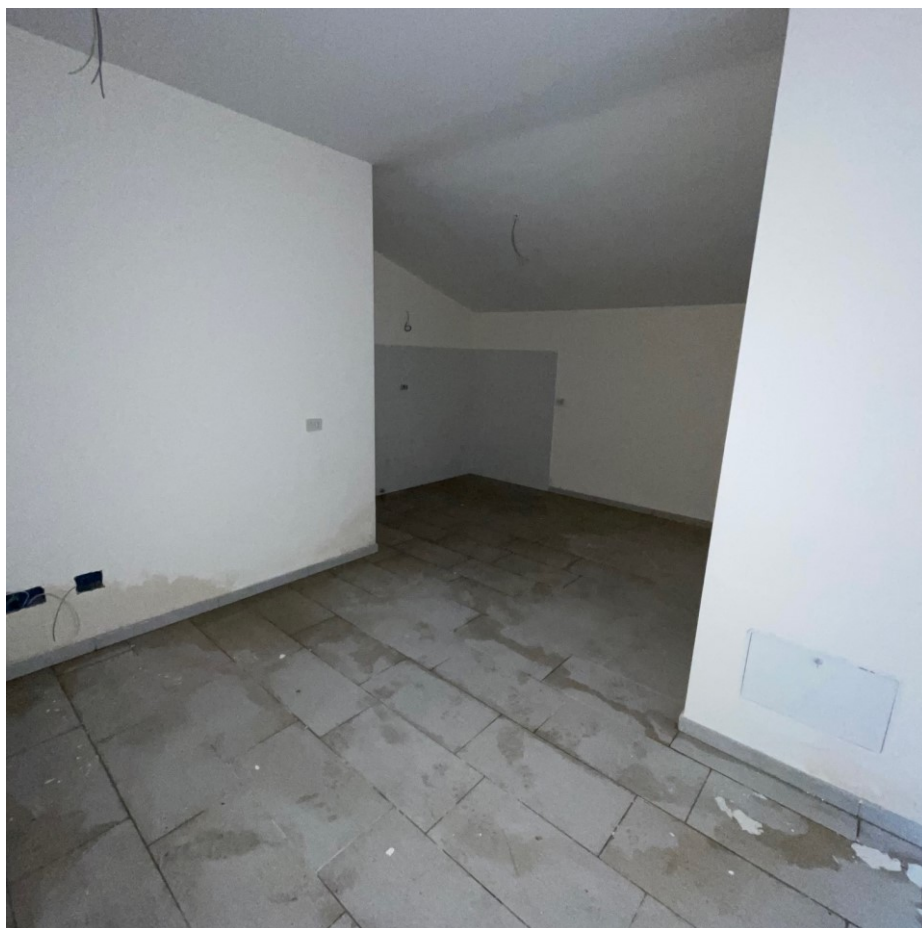
Dettaglio ambiente duplex con esiti allagamento sub 15 – pII