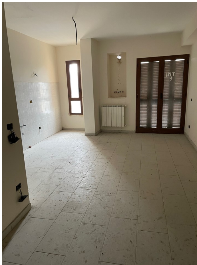
Dettaglio ambiente bilocale sub 13 – pl