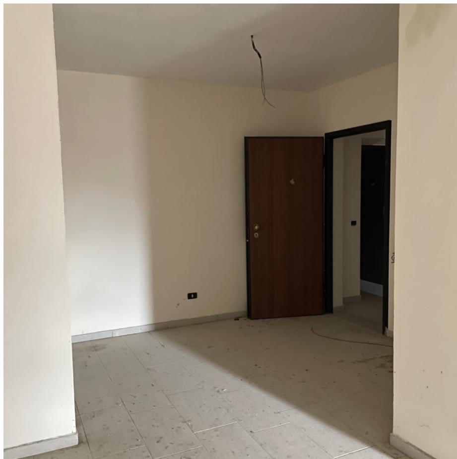
Dettaglio ingresso abitazione in completamento – cat F/3