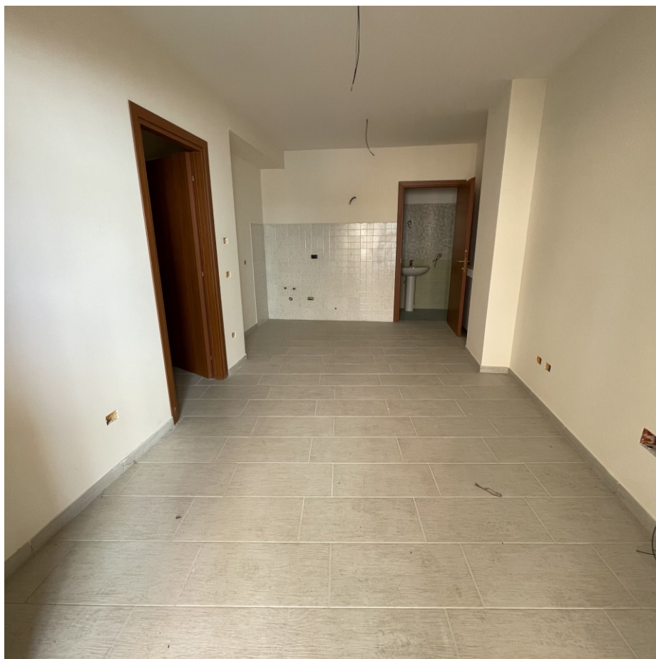
Dettaglio interno abitazione in completamento – cat F/3