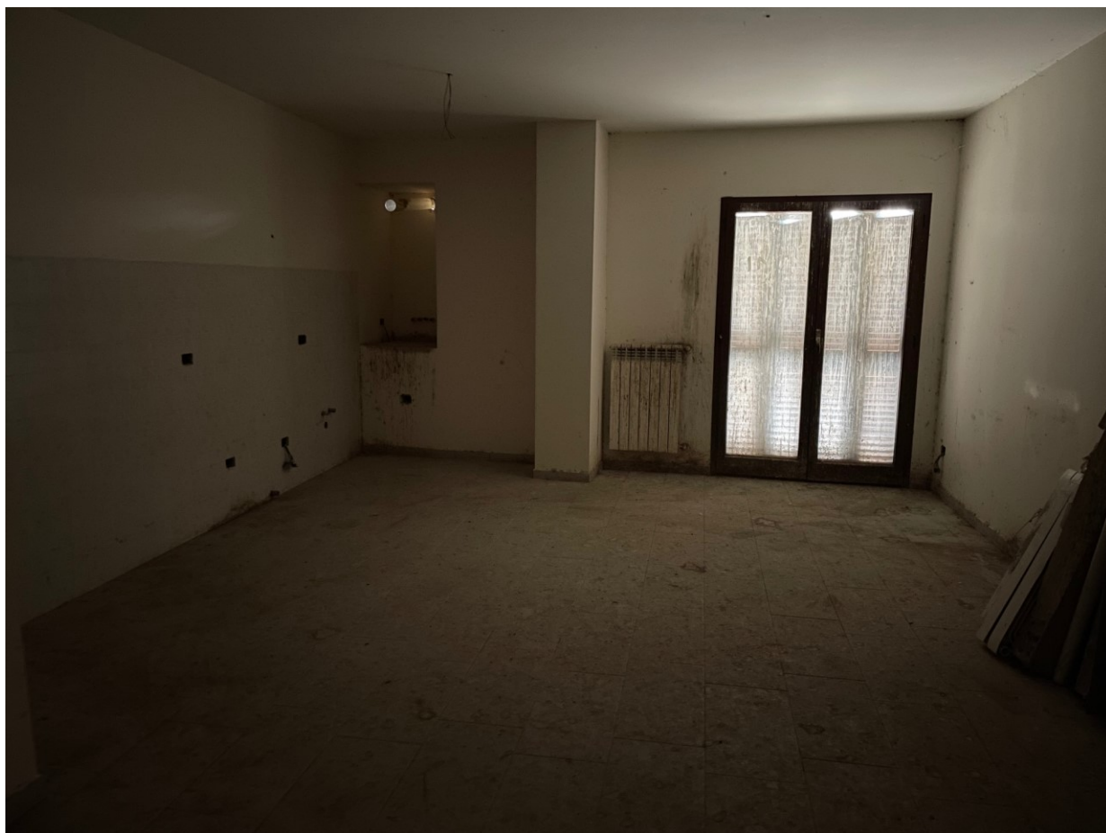
Dettaglio ambiente trilocale sub 10 – pl