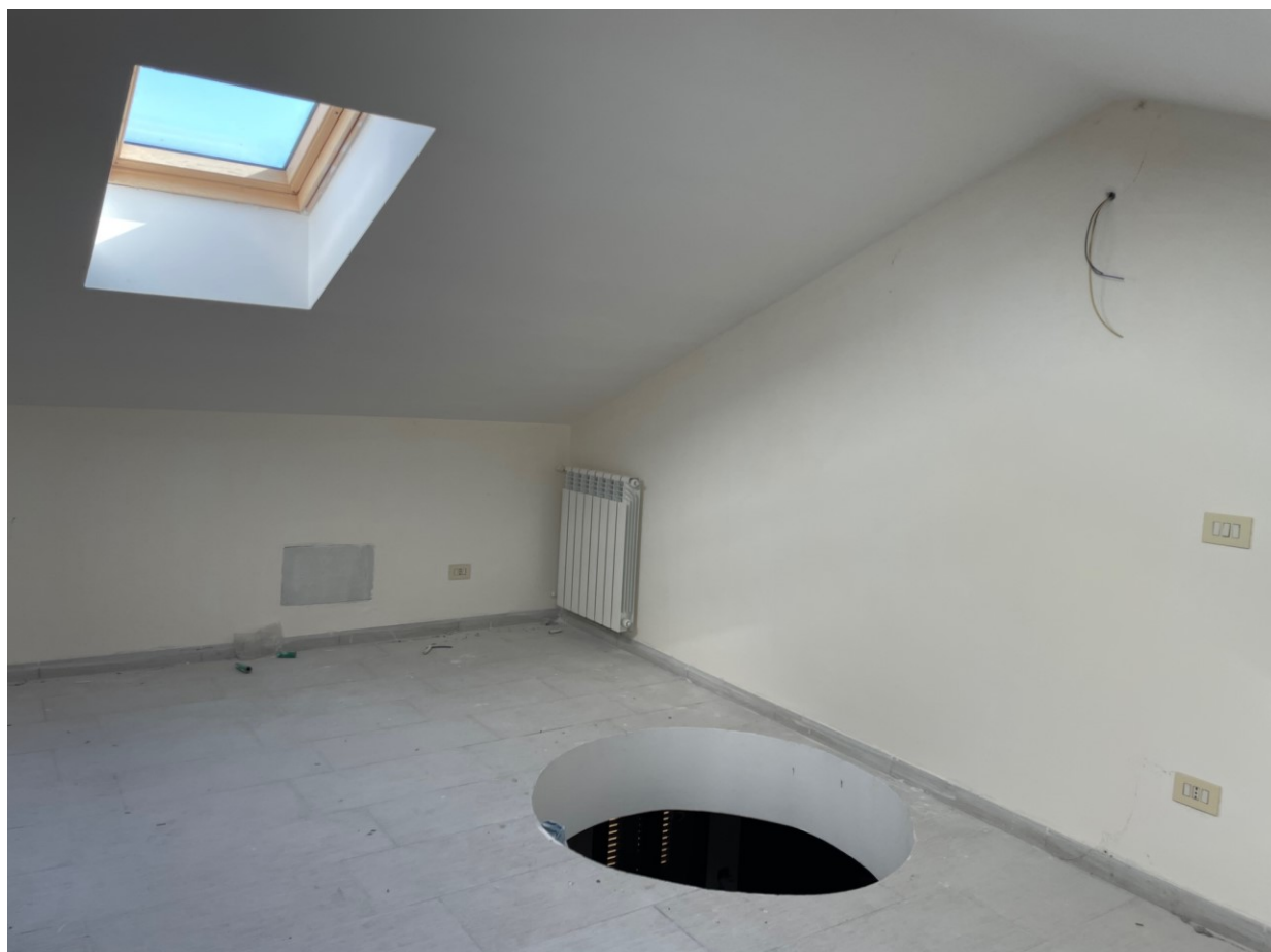
Dettaglio ambiente duplex – pIII cat F/3