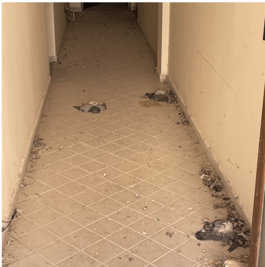
Vista spazi distributivi interni oggetto di disinfestazione sub 32 – pt