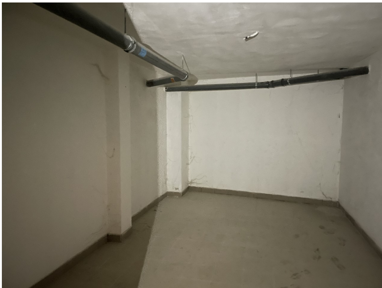
Dettaglio cantina sub 27 – ps cat F/3