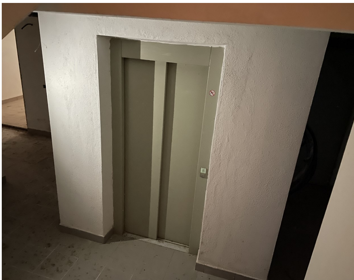
Vista vano ascensore da sanare sub 32 – cat bcnc