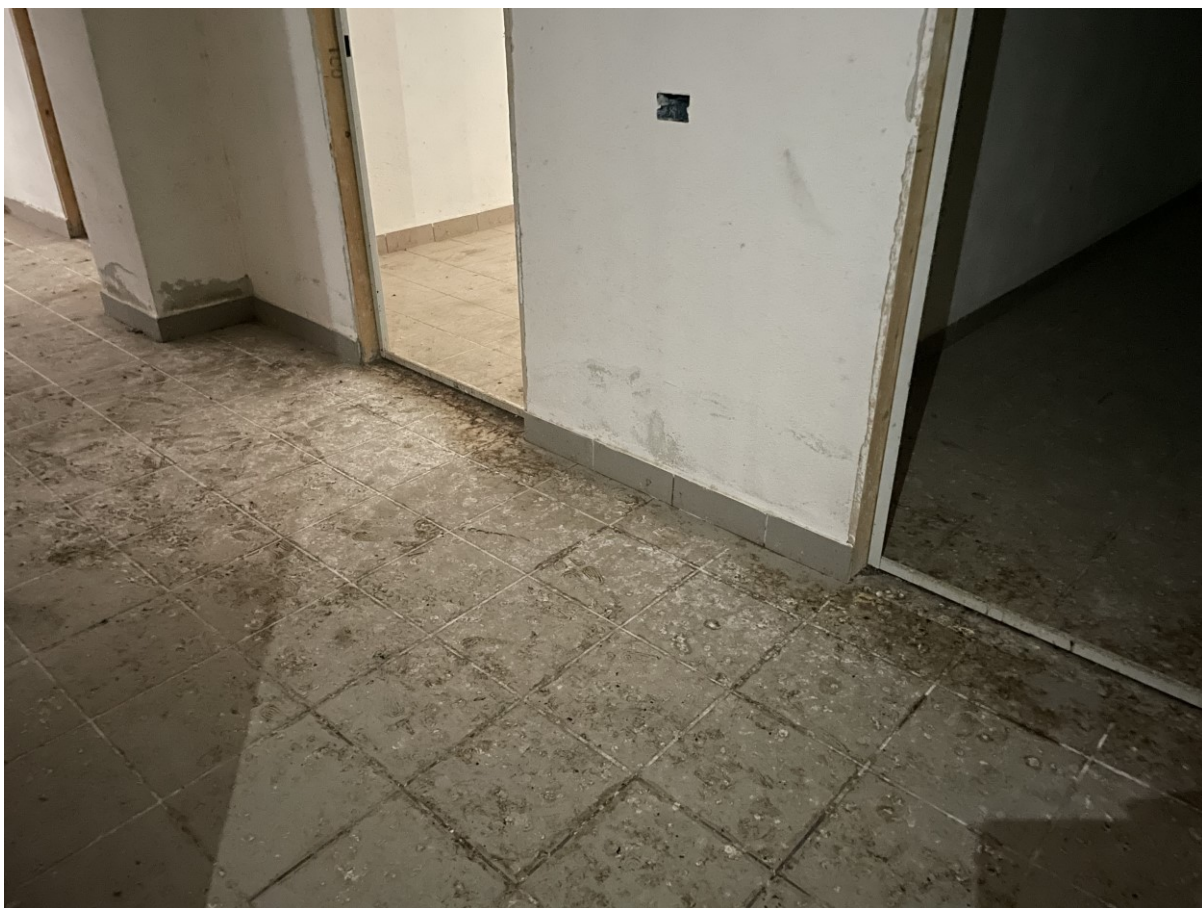
Vista spazi distributivi interni oggetto di disinfestazione sub 32 – ps