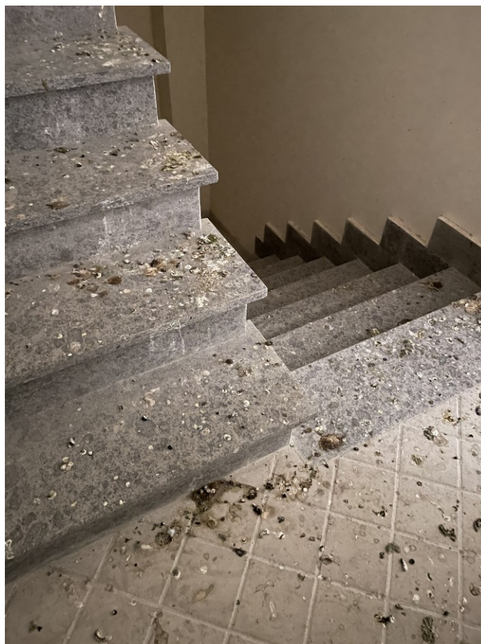
Vista vano scala oggetto di disinfestazione sub 32 – cat bcnc