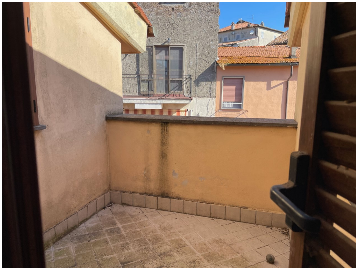
Dettaglio terrazzo abitazione sub 17 – pII