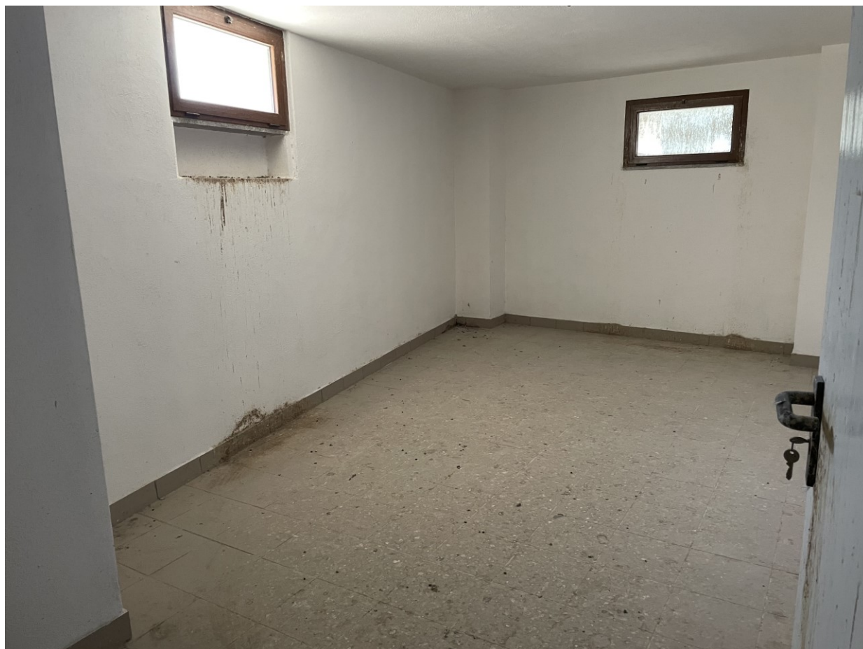
Dettaglio cantina sub 20 – ps cat F/3