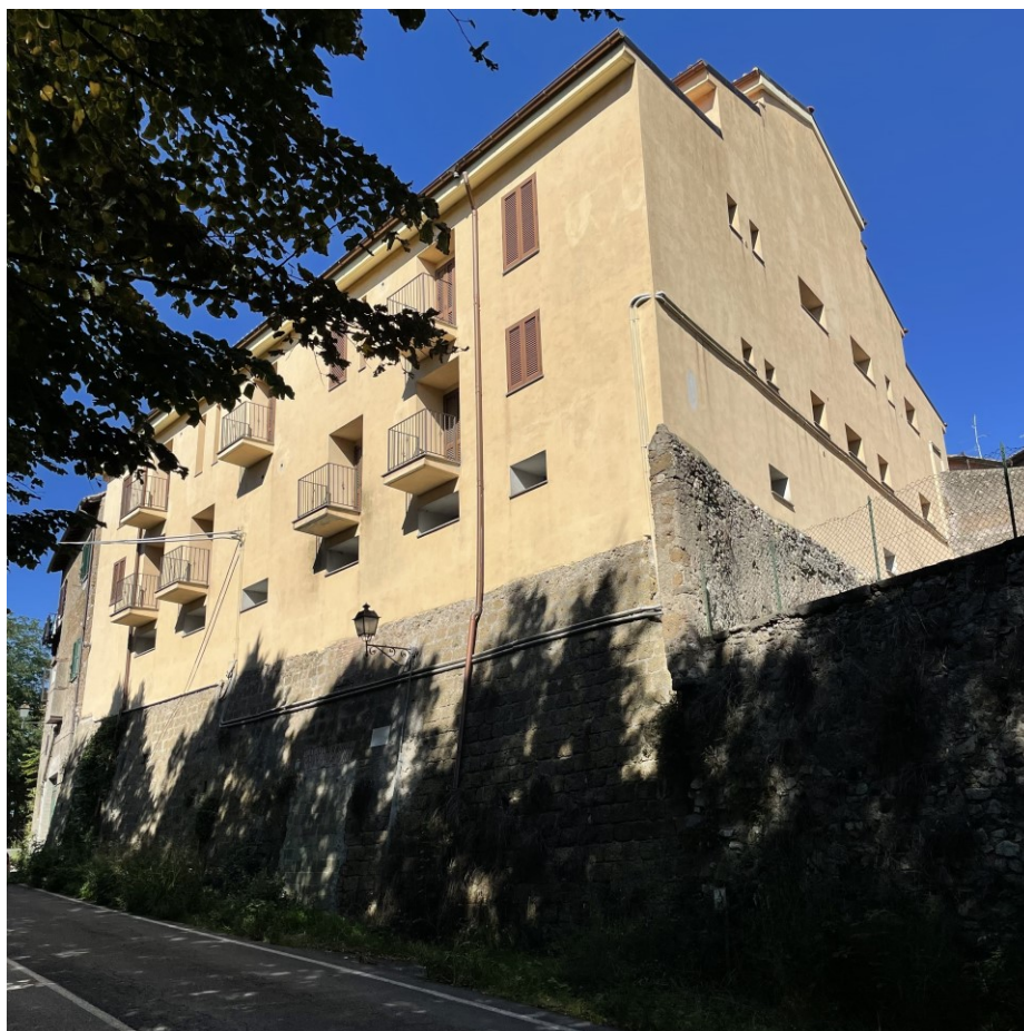
Vista generale del fabbricato da via Aurelia bis