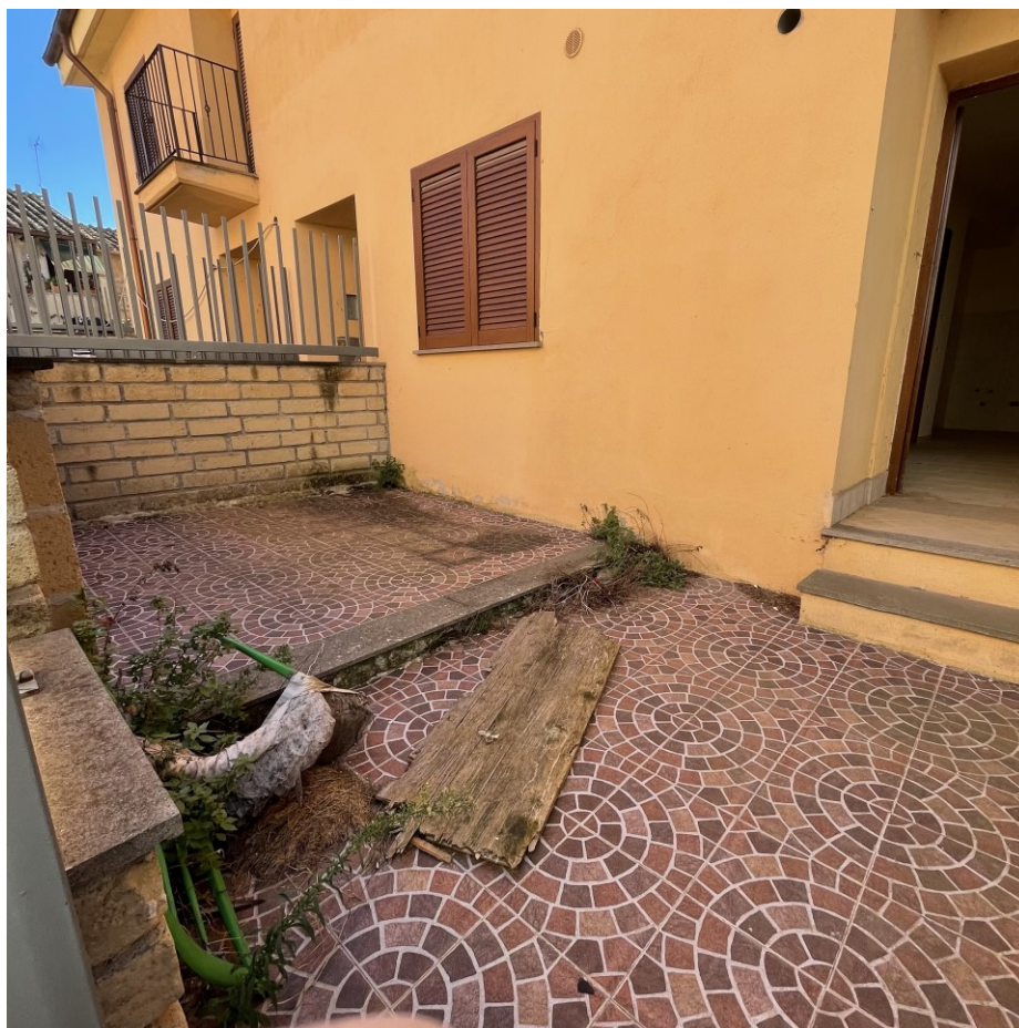
Dettaglio area esterna bilocale sub 5 – pt sup