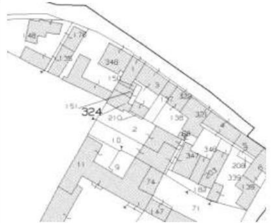
STRALCIO DELLA CARTOGRAFIA DI CATASTO TERRENI FOGLIO 12 IN COMUNE DI BORGO PRIOLO