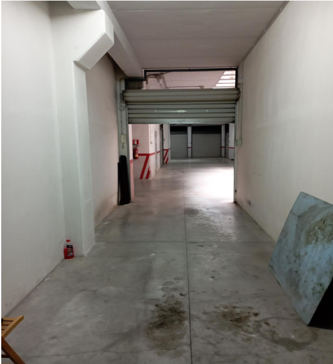
FOTO n.4 Vista dall'interno Box n.25