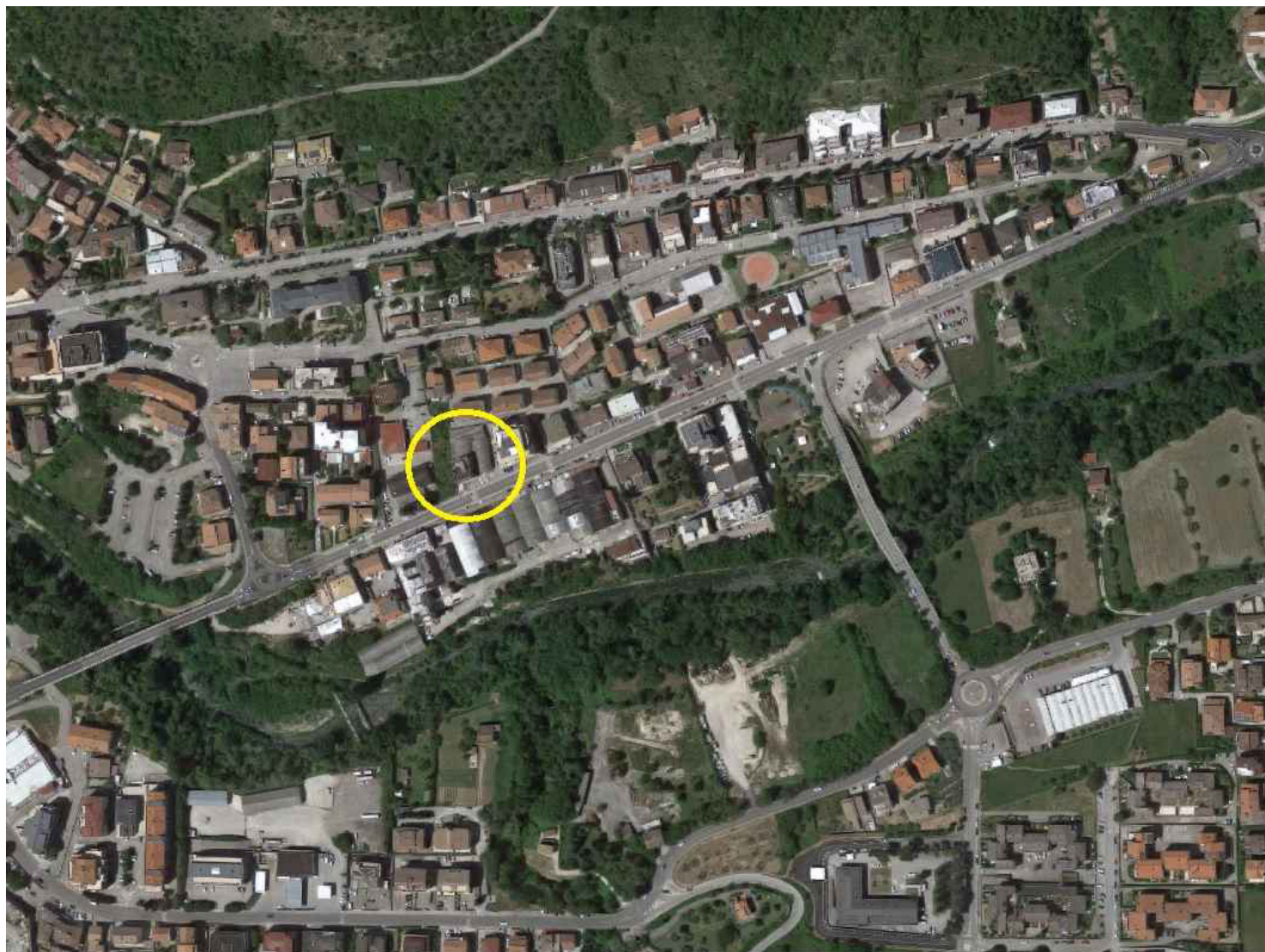
Vista della Zona