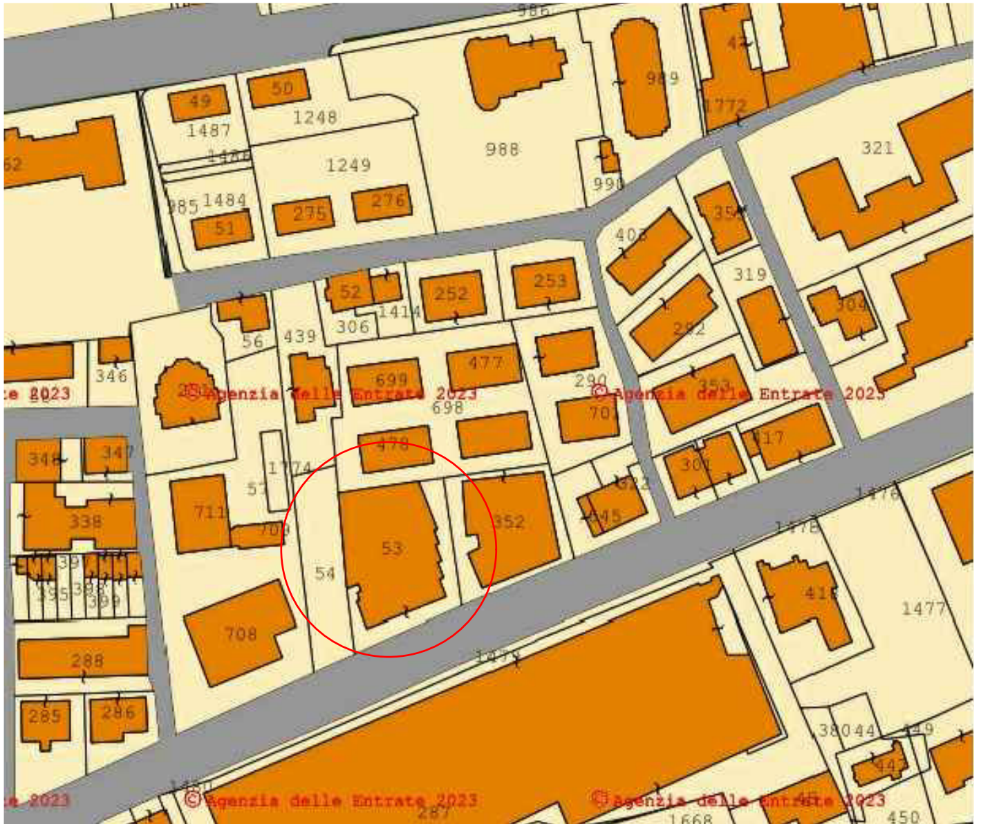
Stralcio di mappa Fg 37 p.lla 53