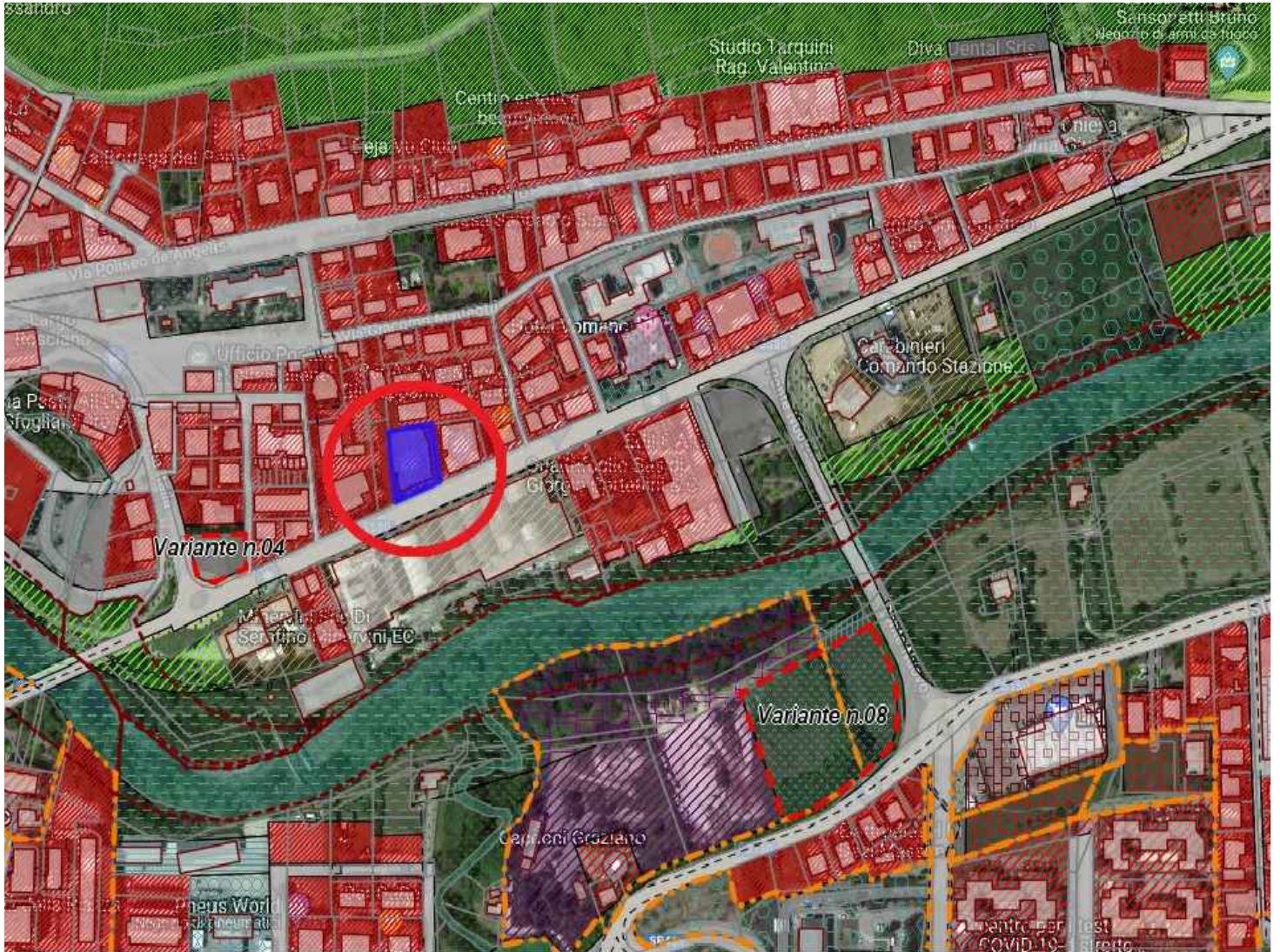
Stralcio di PRG Vista Generale