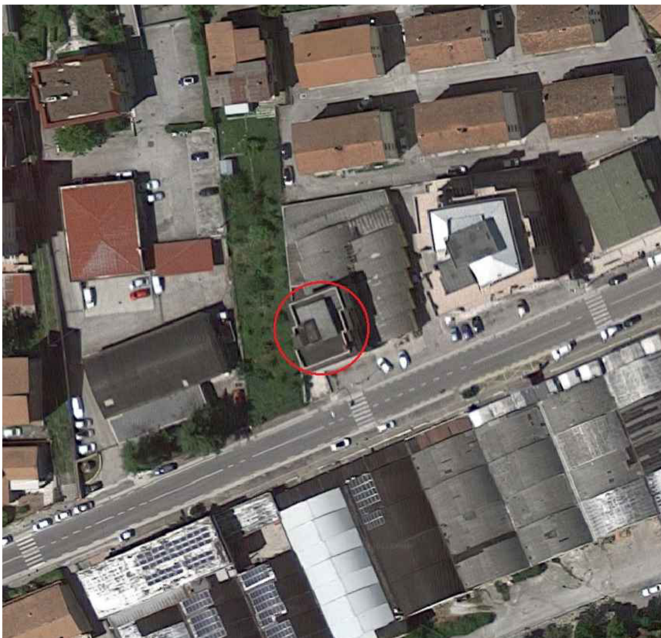
Vista dall'alto del Fabbricato