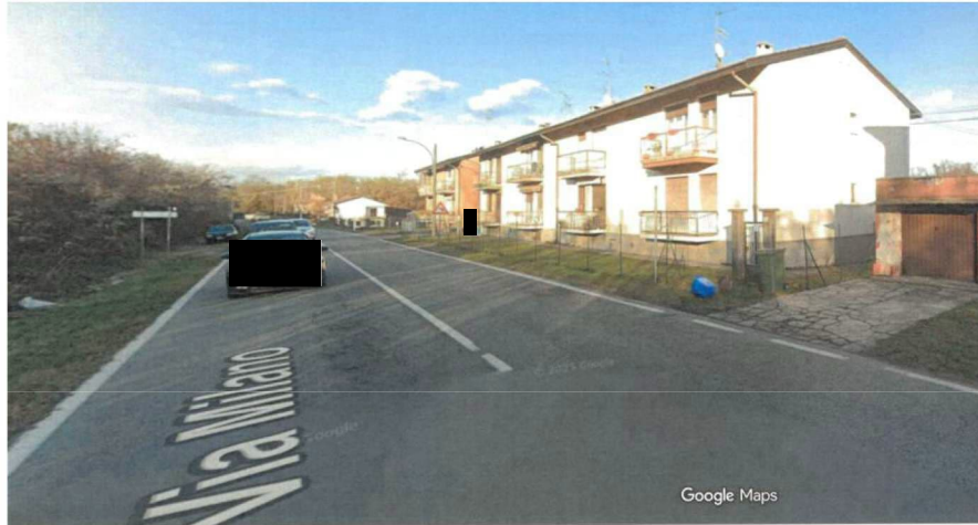
Foto da Google Maps che riprende la palazzina ove è ubicata l'unità in oggetto, l'antistante strada e l'adiacente striscia di terreno a prato nella quale in termini impropri anche per la sicurezza vengono lasciate le automobili, fino a quando le autorità lo consentiranno.