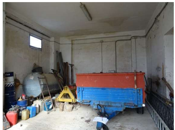
Fotografia A.8 - LOTTO 1 - 1018 sub4_DSC05298