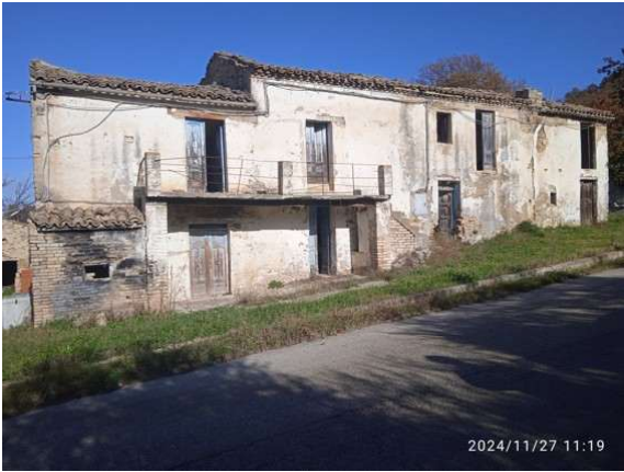
Fotografia A.17 - LOTTO 1 - PROSPETTO 1020 e 1021