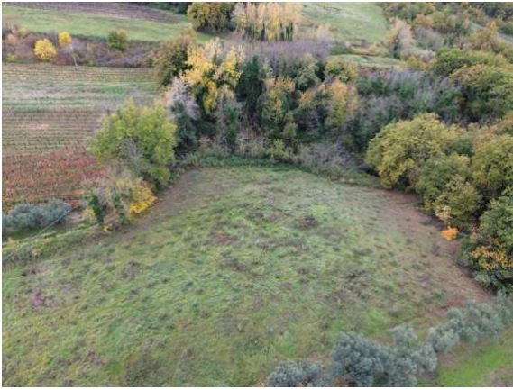
Fotografia A.21 - LOTTO 1 - 224-225-Filetto 68_DJI_0280