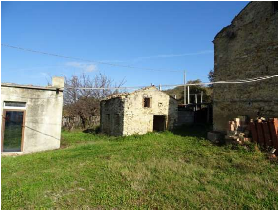
Fotografia A.1 - LOTTO 1 - 1018 SUB2 COLLAB E CORTE_DSC05232