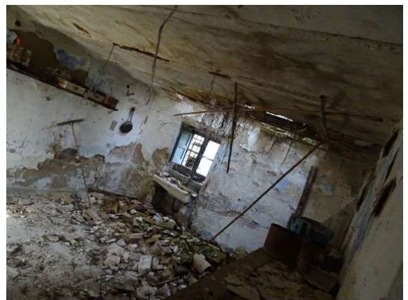
Fotografia A.12 - LOTTO 1 - 1020 e 2021 interni_DSC05316