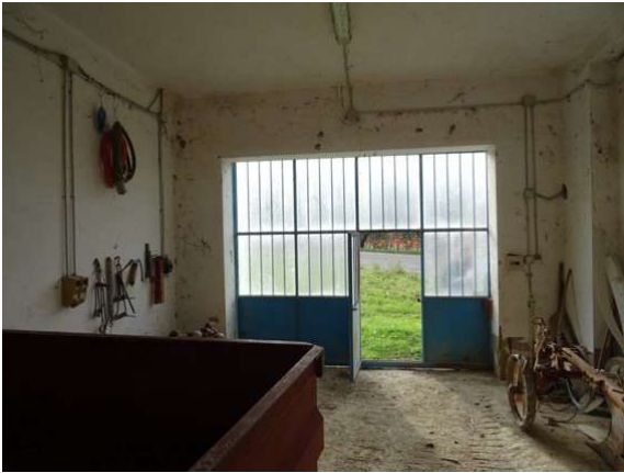
Fotografia A.9 - LOTTO 1 - 1018 sub4_DSC05299