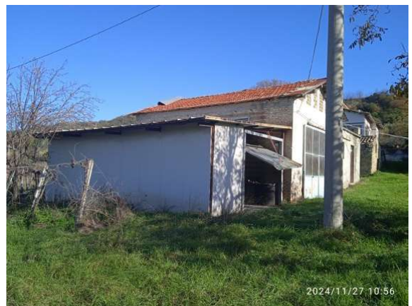
Fotografia A.16 - LOTTO 1 - appendice a 1018 da demolire_1732805089228