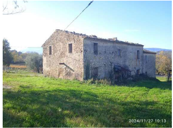
Fotografia A.18 - LOTTO 1 - RETRO vista 1021 e 1020