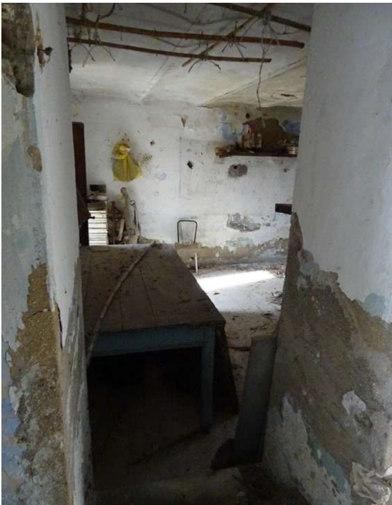
Fotografia A.11 - LOTTO 1 - 1020 e 2021 interni_DSC05313