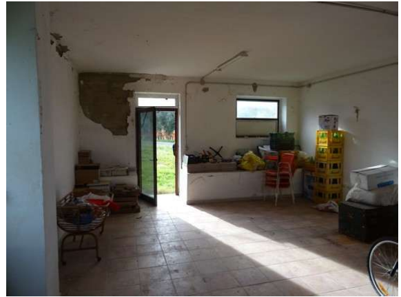
Fotografia A.6 - LOTTO 1 - 1018 sub3_DSC05302