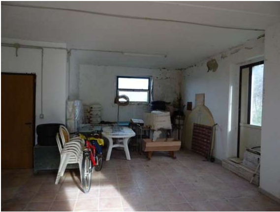
Fotografia A.5 - LOTTO 1 - 1018 sub3_DSC05301