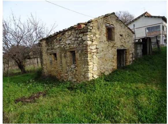
Fotografia A.2 - LOTTO 1 - 1018 sub2_DSC05306