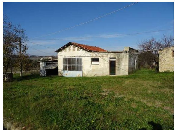
Fotografia A.4 - LOTTO 1 - 1018 SUB3 e 4_DSC05231