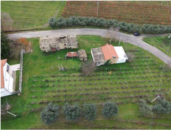
Fotografia A.13 - LOTTO 1 - 1021-1020 E 1018_- LOTTO 2 vigneto 1079_DJI_0316