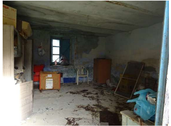
Fotografia A.10 - LOTTO 1 - 1020 e 2021 interni_DSC05312