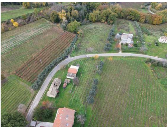
Fotografia A.15 - LOTTO 1 - 1021-1020 E 1018_e terreni lato OVEST_DJI_0324