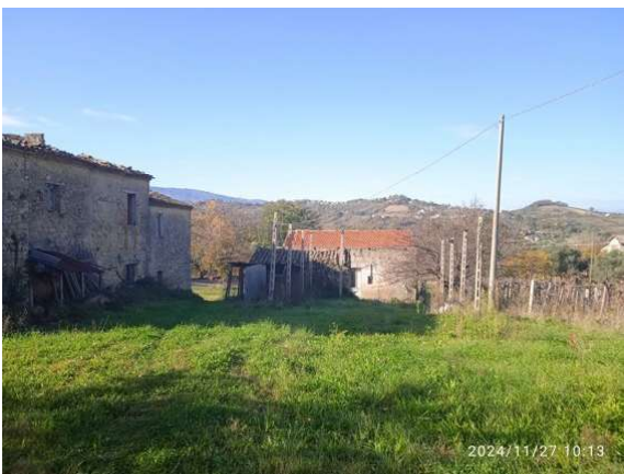
Fotografia A.19 - LOTTO 1 seminat ex321CENTR