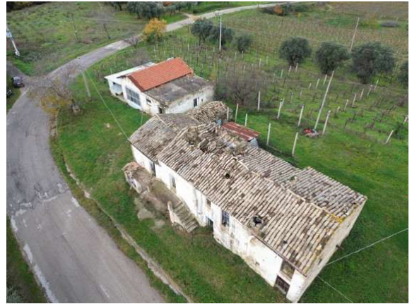
Fotografia A.14 - LOTTO 1 - 1021-1020 E 1018_DJI_0332