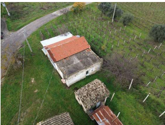
Fotografia A.3 - LOTTO 1 - 1018 sub2-3-4_DJI_0334