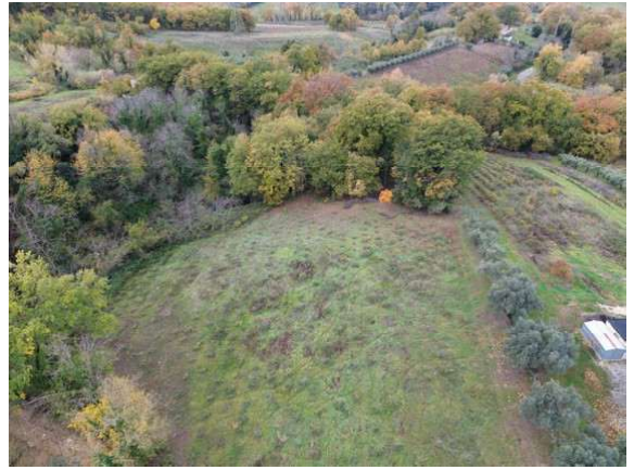
Fotografia A.22 - LOTTO 1 - 226-225-Filetto68_DJI_0279