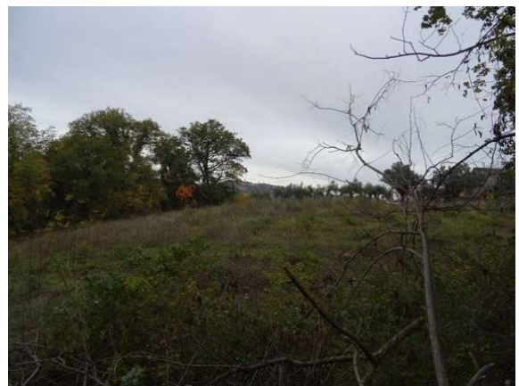
Fotografia A.20 - LOTTO 1 - 224-225-226-1067_DSC05292