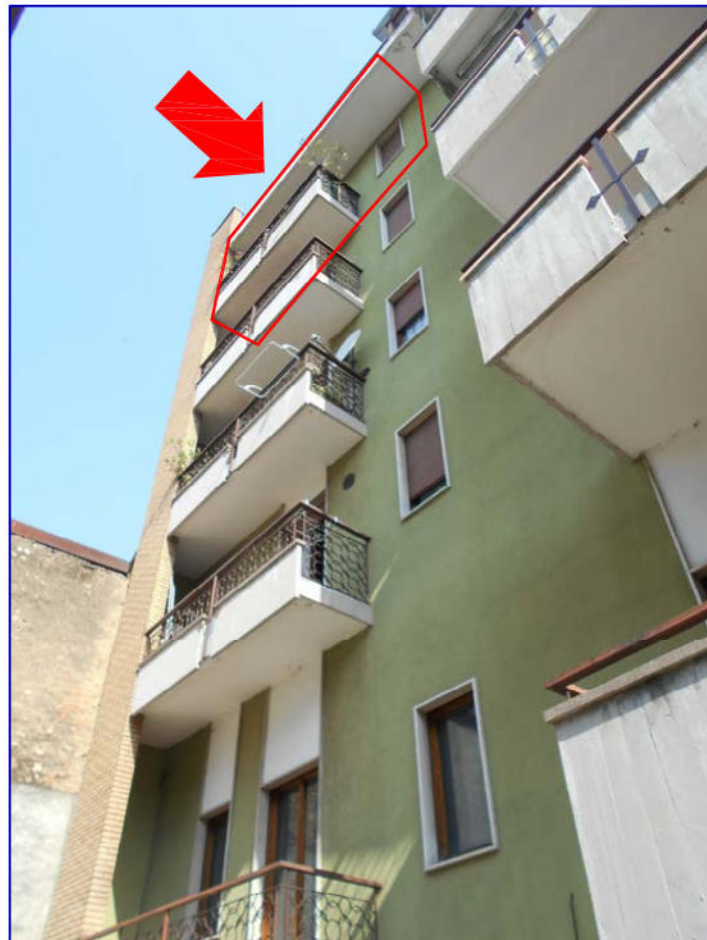
Foto 3: Fronte Sud del condominio (su cortile interno) in cui sono ubicati i beni oggetto di perizia con individuazione dell'appartamento pignorato sito al quarto piano (Sub. 13).