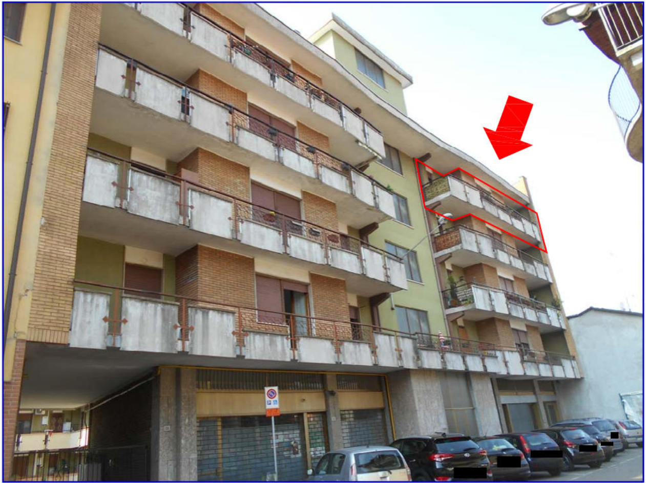
Foto 2: Fronte Nord del condominio (su via Italia) in cui sono ubicati i beni oggetto di perizia con individuazione dell'appartamento pignorato sito al quarto piano (Sub. 13).