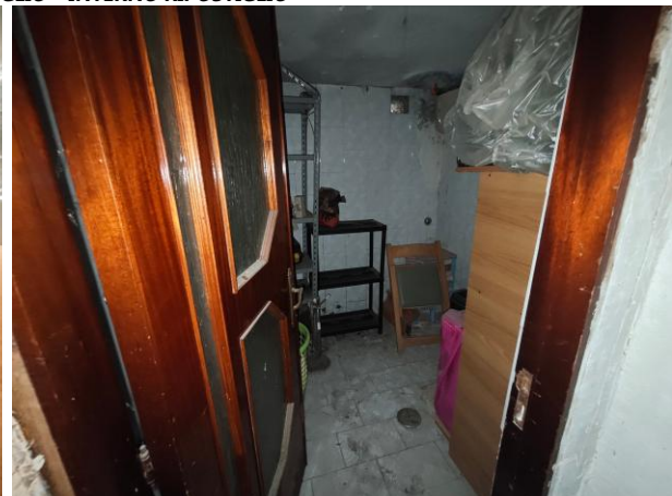
Foto 9/10 - BAGNO