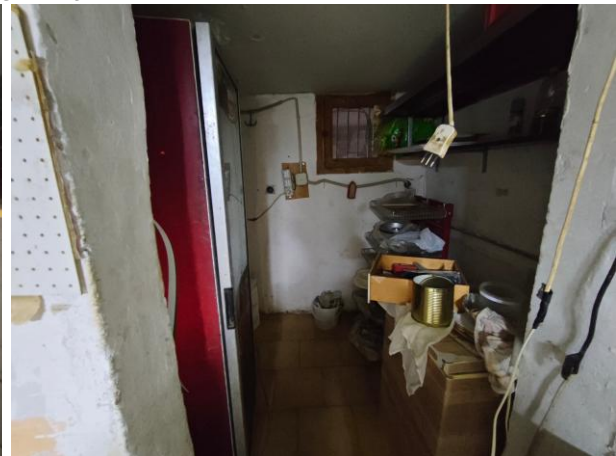
Foto 7/8 - ACCESSO RIPOSTIGLIO - INTERNO RIPOSTIGLIO