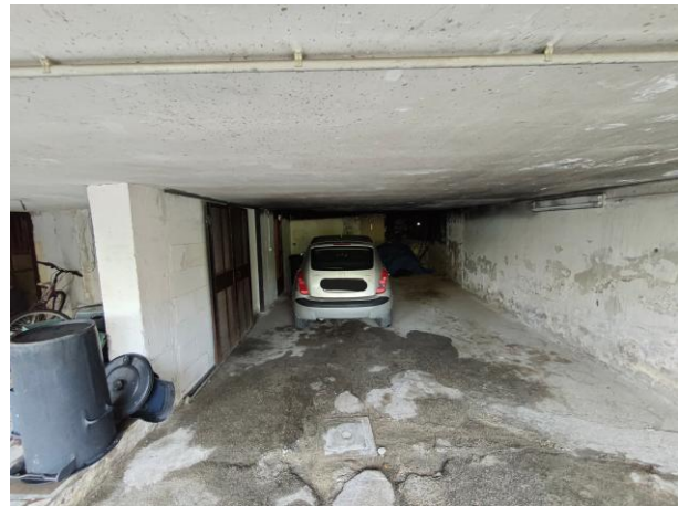
Foto 3/4 - ZONA GARAGE