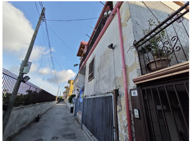
Foto da 1/2 - ACCESSO DA VIA CONSOLARE CAMPANA - VISTA ACCESSO CARRABILE