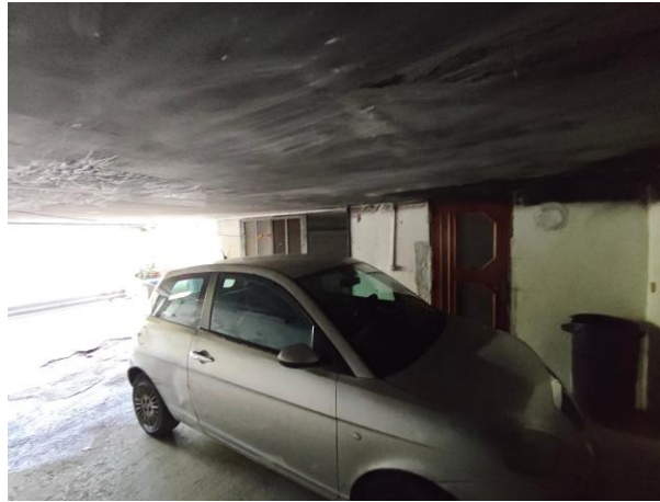
Foto 5 - INDIVIDUAZIONE ACCESSI DEPOSITO E CANTINOLA