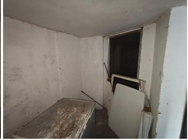
Foto 11/12 - DEPOSITO