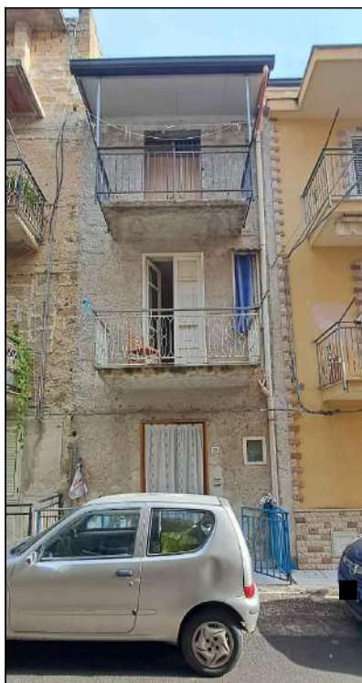
prospetto su via Giacomo Matteotti