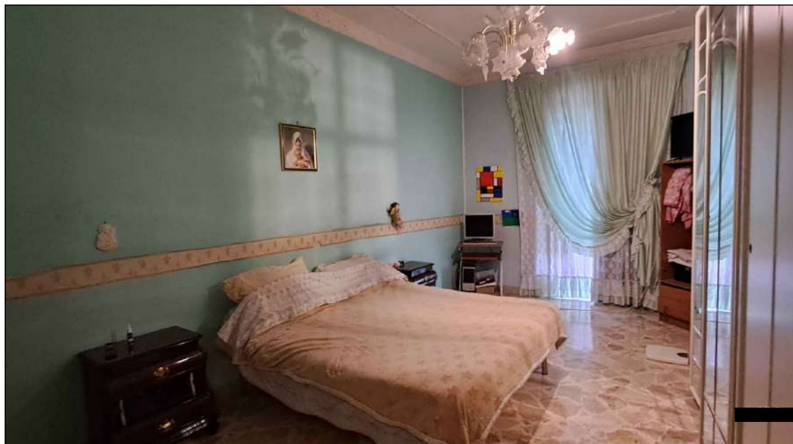
cameretta del 1° lato Calcedonio Giordano