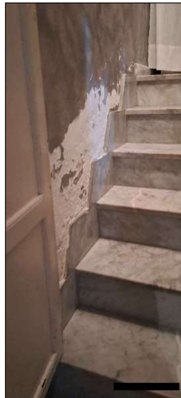
scaletta di collegamento dei due livelli del PT esfoliazione