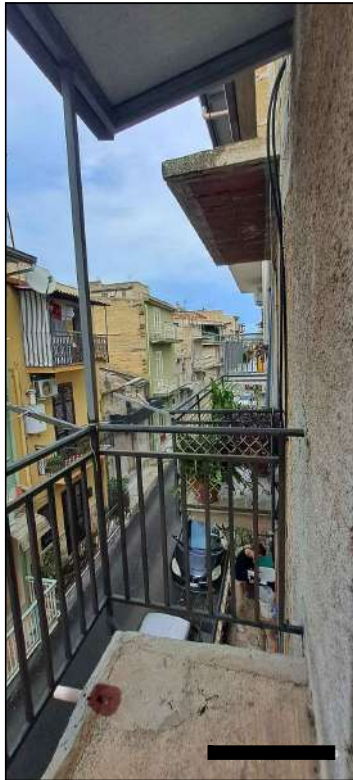
balcone su via Calcedonio Giordano