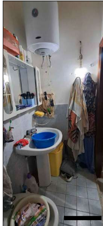
bagno piano terra