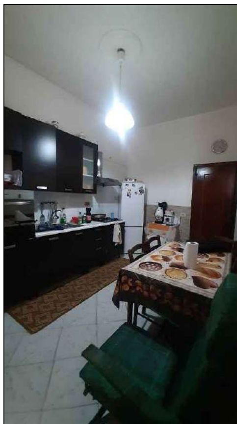
cucina-soggiorno -PT- lato Giacomo Matteotti