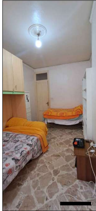
cameretta del PI° lato Giacomo Matteotti