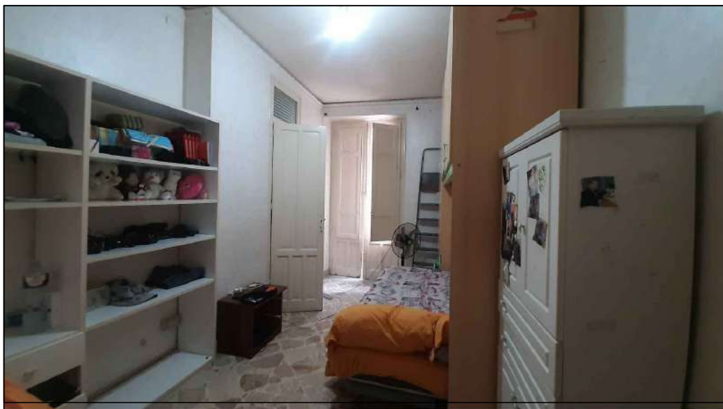
cameretta del PI° lato Giacomo Matteotti