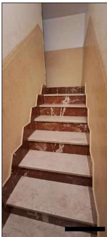
scaletta di collegamento dei due livelli del PI°