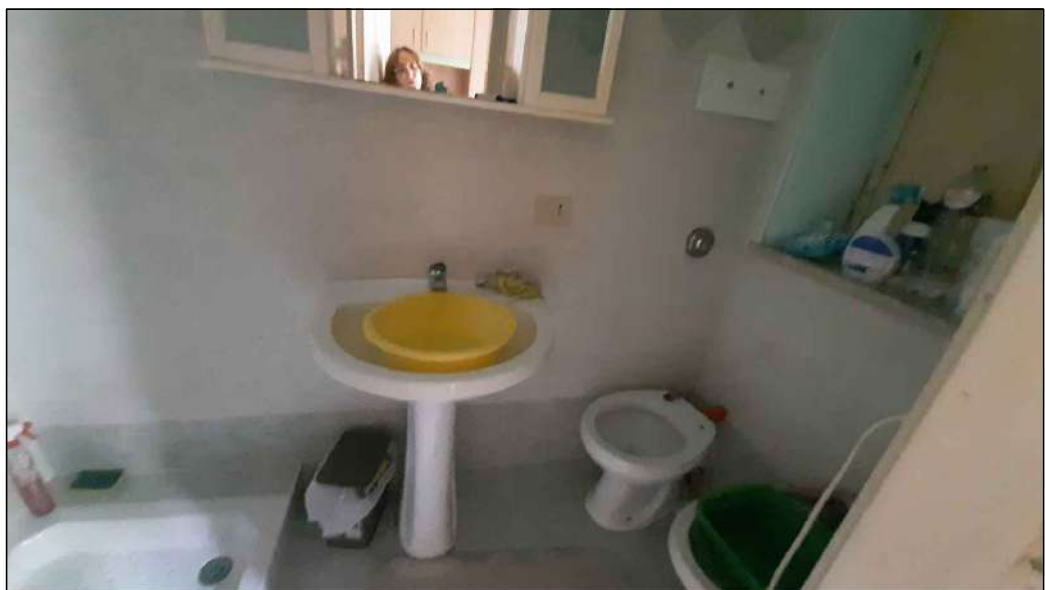
bagno piano primo