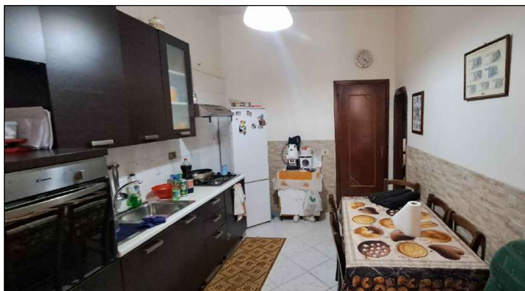
cucina-soggiorno -PT- lato Giacomo Matteotti