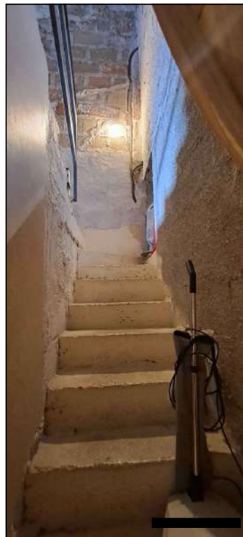
scala di accesso al piano secondo