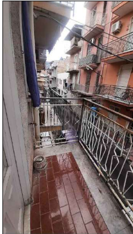
balcone su via Giacomo Matteotti