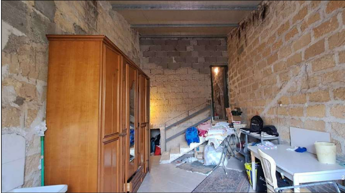
piano secondo in fase di definizione , lato Giacomo Matteotti