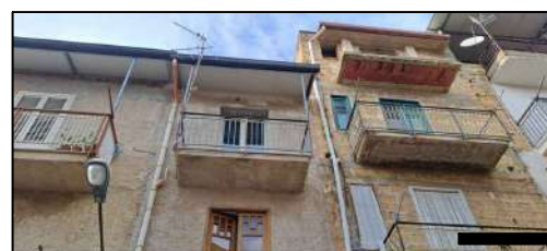
prospetto su via Calcedonio Giordano - PII°