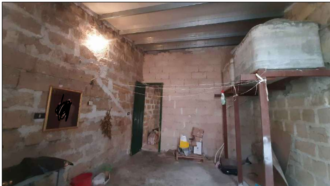
piano secondo in fase di definizione , lato Calcedonio Giordano