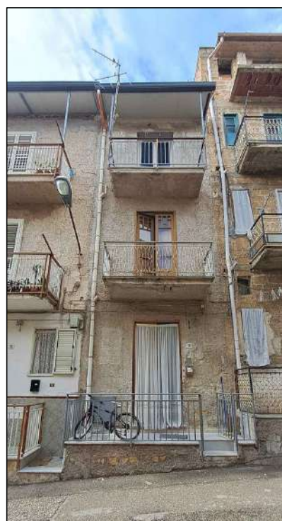
prospetto su via Calcedonio Giordano