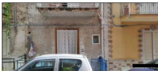
prospetto su via Giacomo Matteotti- PT