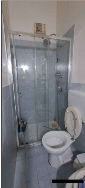
bagno piano terra