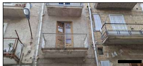
prospetto su via Calcedonio Giordano - PI°