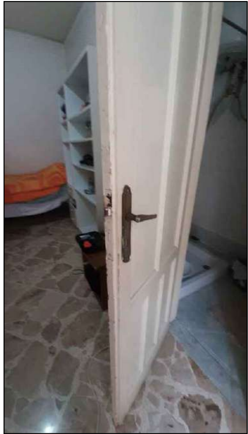
bagno piano primo