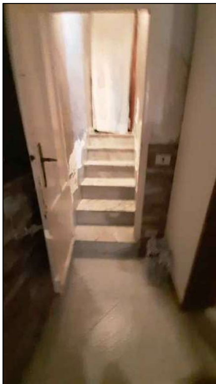
scaletta di collegamento dei due livelli del PT