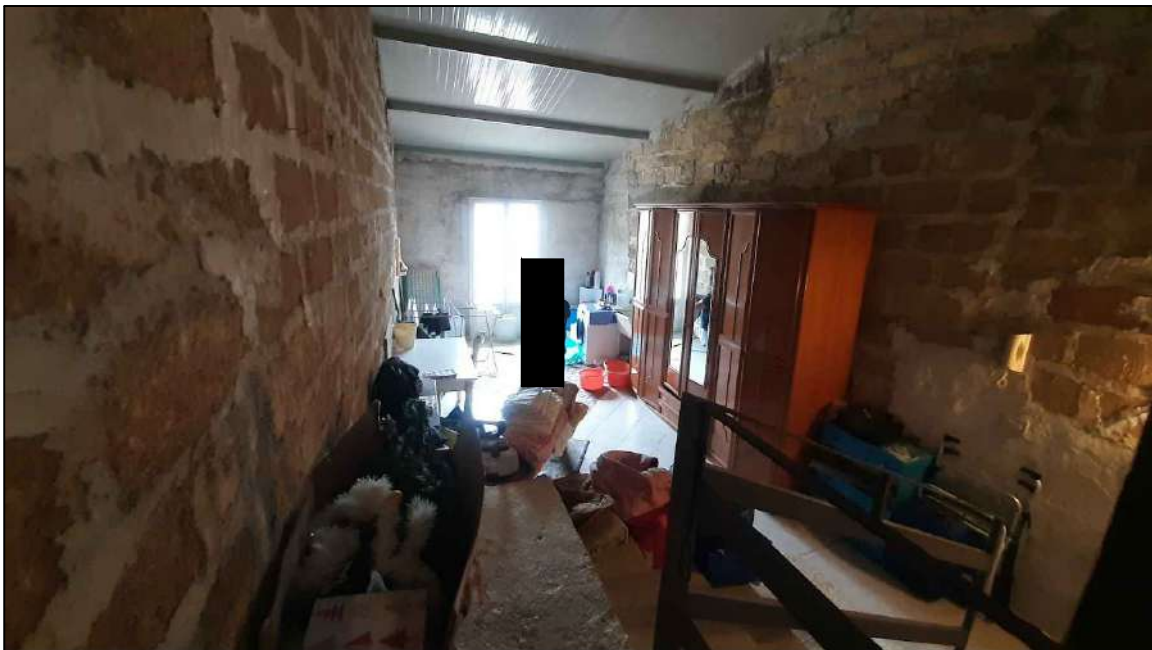
piano secondo in fase di definizione , lato Giacomo Matteotti