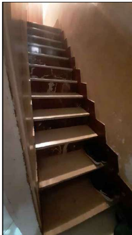
scala che conduce al PI°