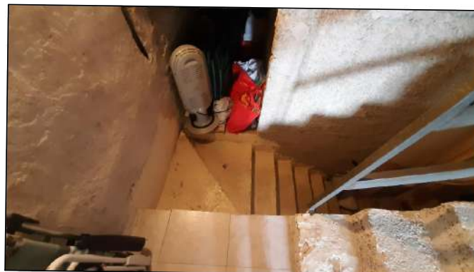
scala di accesso ai piani sfalsati del piano secondo