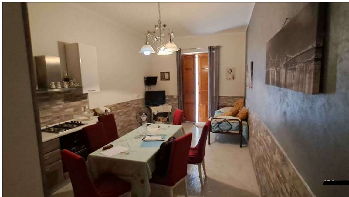
cucina-soggiorno su via Calcedonio Giordano