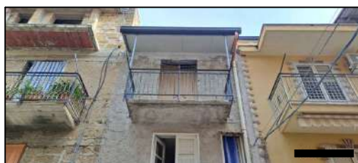
prospetto su via Giacomo Matteotti- PII°