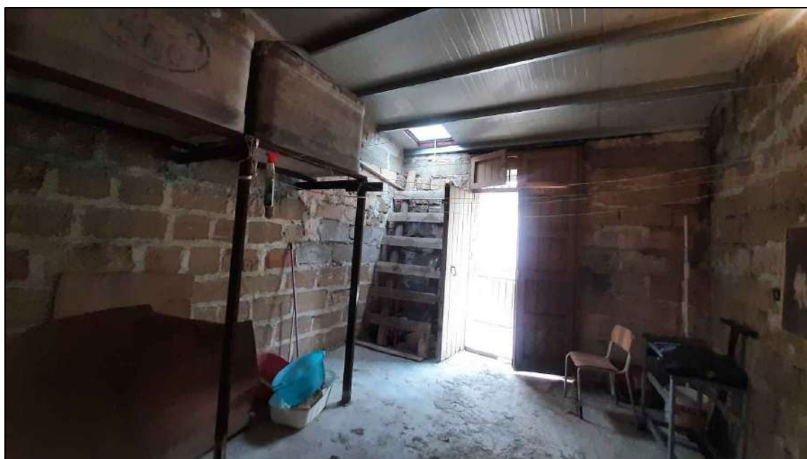
piano secondo in fase di definizione , lato Calcedonio Giordano