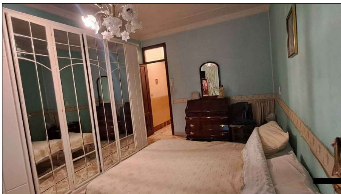
cameretta del 1° lato Calcedonio Giordano