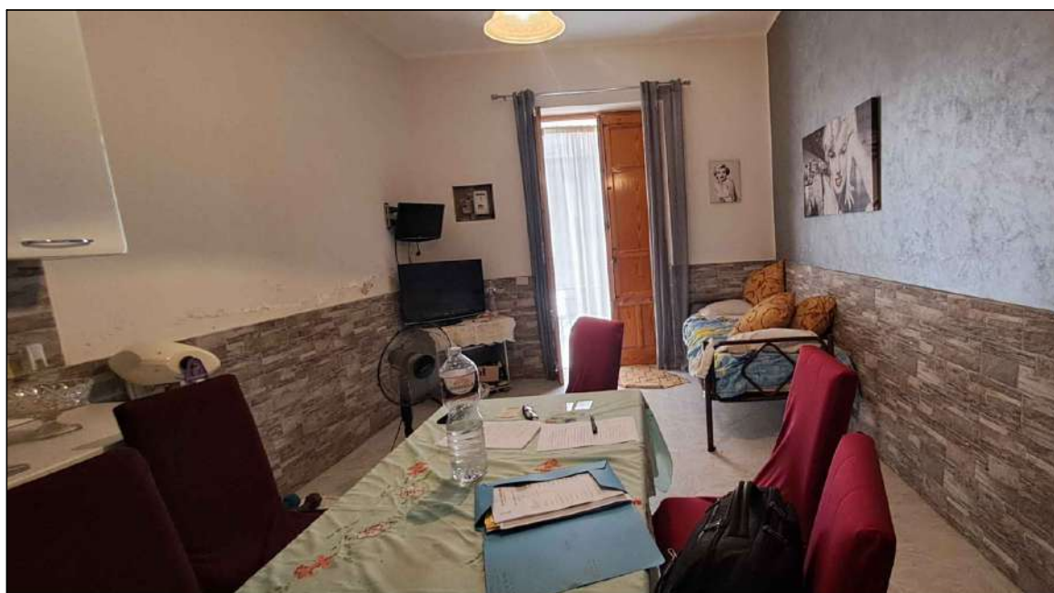
cucina-soggiorno su via Calcedonio Giordano