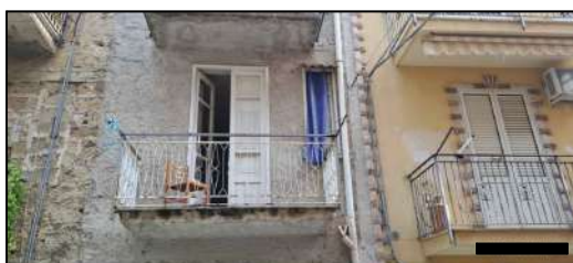
prospetto su via Giacomo Matteotti- PI°