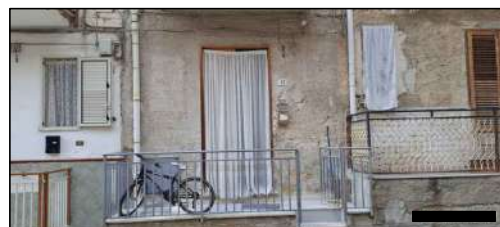
prospetto su via Calcedonio Giordano - PT