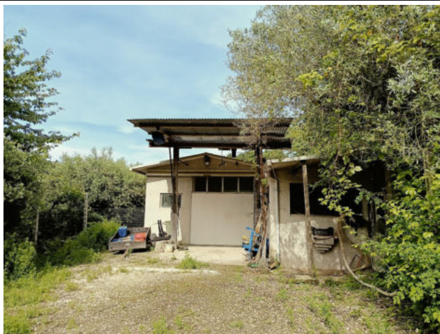
PART. PROSPETTO OVEST