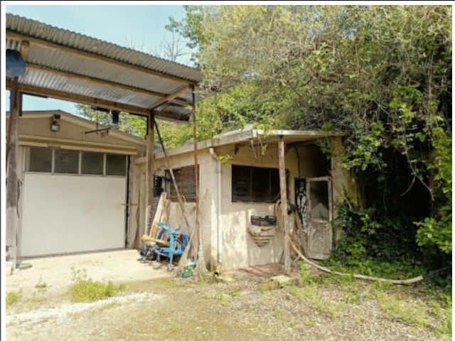
PART. PROSPETTO OVEST