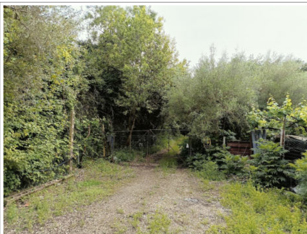
PERCORSO INTERNO P.LLA 621