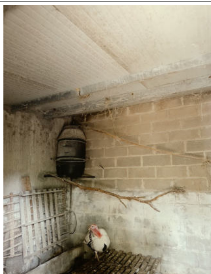
INTERNO ACCESSORIO SUD