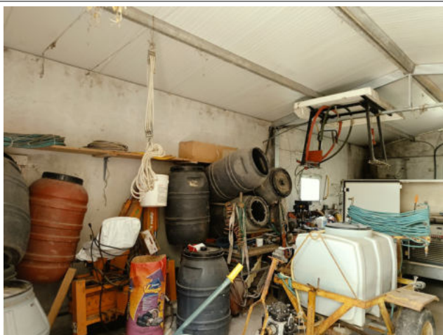
INTERNO ACCESSORIO P.LLA 621