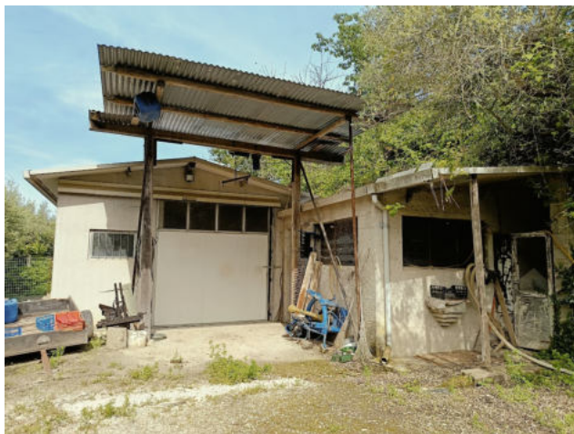
ACCESSORI P.LLA 621 E TETTOIA ESTERNA NON AUTORIZZATA