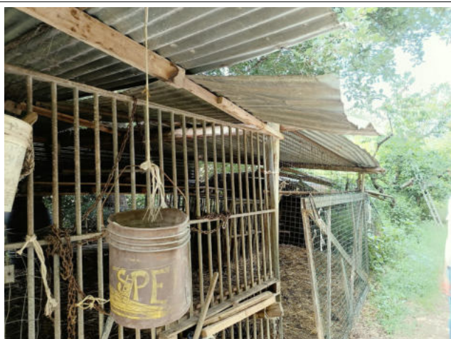
ACCESSORI NON AUTORIZZATI