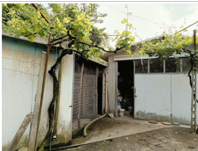
FRONTE POSTERIORE EST