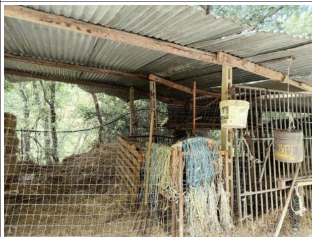
ACCESSORI NON AUTORIZZATI