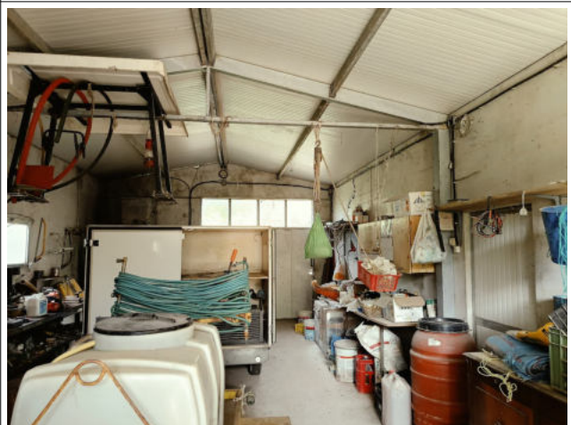
INTERNO ACCESSORIO P.LLA 621